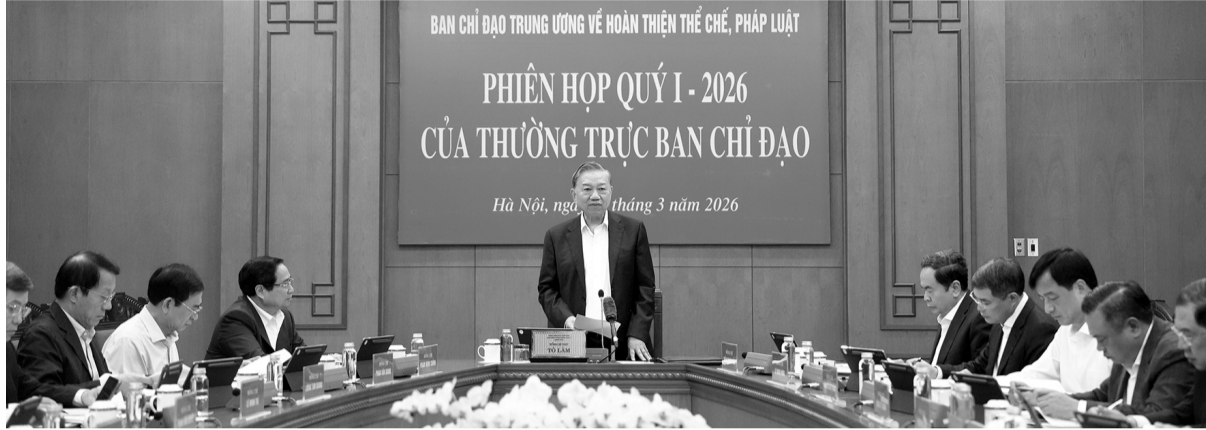
● Tổng Bí thư Tô Lâm phát biểu tại Phiên họp quý I/2026 của Thường trực Ban Chỉ đạo Trung ương về hoàn thiện thể chế, pháp luật.

Thay mặt Đảng ủy Bộ Tư pháp - Cơ quan Thường trực của Ban Chỉ đạo Trung ương về hoàn thiện thể chế, pháp luật, Bí thư Đảng ủy, Bộ trưởng Bộ Tư pháp Nguyễn Hải Ninh, Ủy viên Thường trực Ban Chỉ đạo vừa ký ban hành Thông báo số 15-TB/BCĐTW về Kết luận của đồng chí Tổng Bí thư Tô Lâm, Trưởng Ban Chỉ đạo tại Phiên họp quý I/2026 của Thường trực Ban Chỉ đạo.