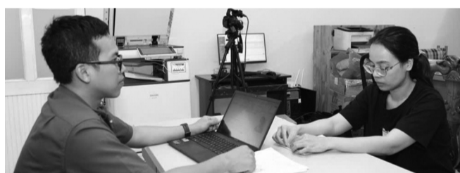
● Công an lấy lời khai một đối tượng mua bán hóa đơn trái phép.

Theo Luật sư Đậu Đức Ninh (Cty Luật TNHH MTV hằng luật Thành Danh), hành vi mua bán trái phép hóa đơn không chỉ là mua bán hóa đơn chưa ghi nội dung, mà còn gồm việc mua bán hóa đơn đã ghi nội dung nhưng không có hàng hóa, dịch vụ kèm theo; hoặc sử dụng hóa đơn của cơ sở kinh doanh khác để hợp thức hóa hàng hóa, dịch vụ mua vào hay cấp cho khách hàng khi bán hàng hóa, dịch vụ. Nói một cách nôm na, đây là việc biến một tờ hóa đơn từ công cụ chứng minh giao dịch thật thành "lá bùa" hợp thức hóa các khoản chi, doanh thu hay nghĩa vụ thuế không đúng thực chất. Loại chứng từ này thường được mua để đưa vào sổ sách kế toán như một khoản đầu vào, nhằm tăng chi phí, giảm lợi nhuận chịu thuế, khấu trừ thuế hoặc che chắn cho những dòng tiền không phản ánh đúng giao dịch thật, gian lận tài chính.