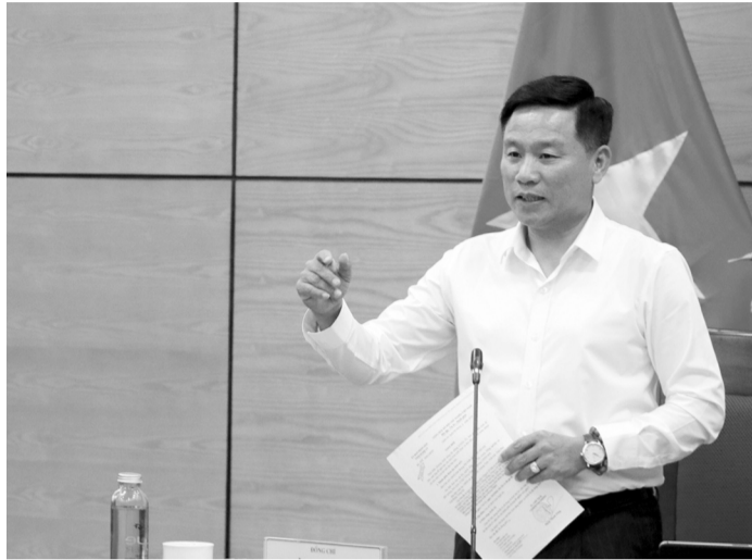
● Theo ông Hiền, nếu dự án không hoàn thành theo cam kết, tỉnh sẽ thu hồi để giao cho nhà đầu tư mới có năng lực.

Tỉnh yêu cầu Sở Xây dựng phải ký cam kết với nhà đầu tư về tiến độ, gửi UBND tỉnh trước ngày 15/4/2026. Hàng tháng