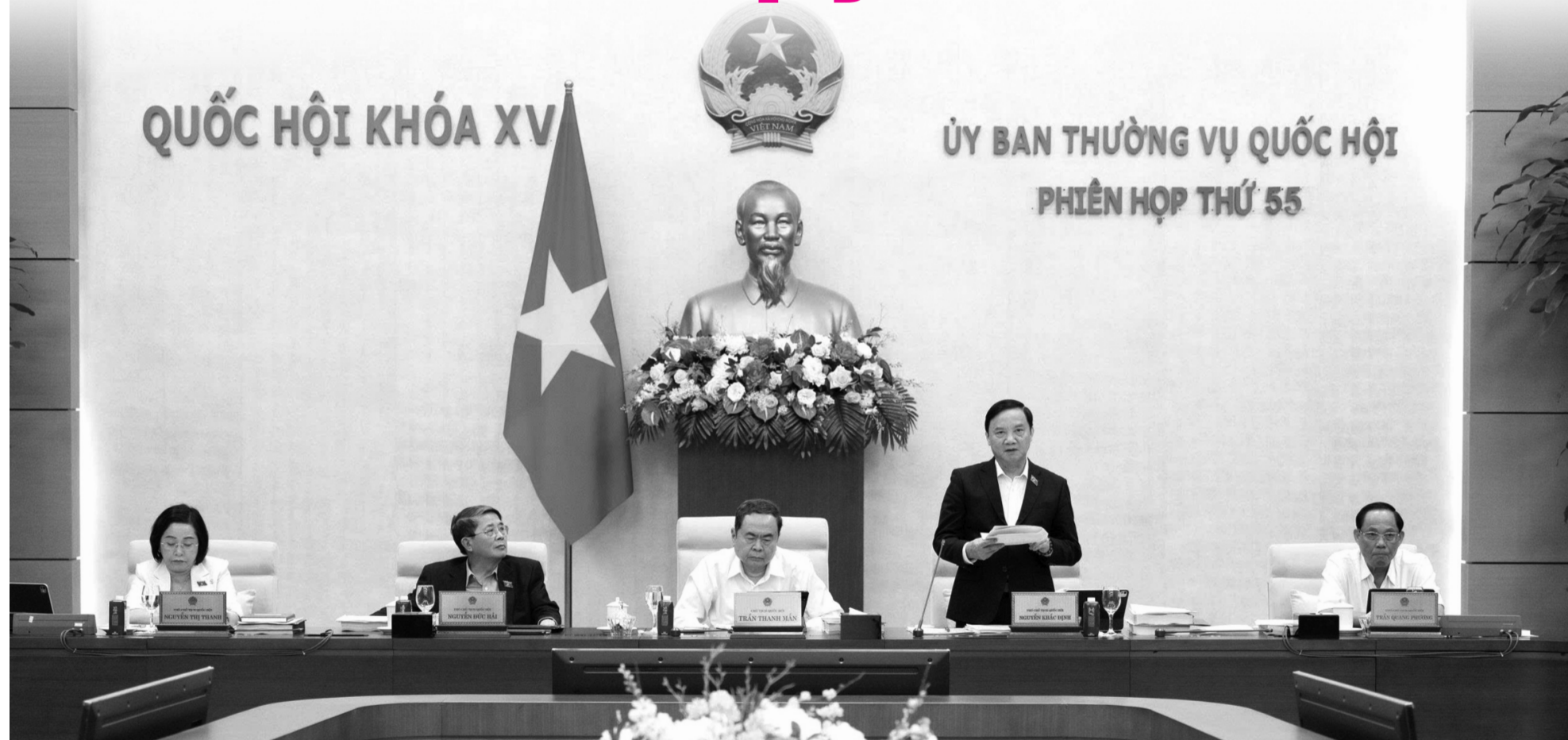
● Phó Chủ tịch Quốc hội Nguyễn Khắc Định điều hành Phiên họp.

Chiều 18/3, tiếp tục chương trình Phiên họp thứ 55, tại Nhà Quốc hội, dưới sự điều hành của Phó Chủ tịch Quốc hội Nguyễn Khắc Định, Ủy ban Thường vụ Quốc hội cho ý kiến về dự án Luật Thủ đô (sửa đổi).