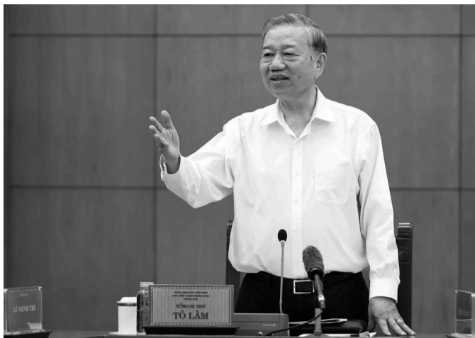
● Tổng Bí thư Tô Lâm phát biểu tại cuộc họp.

Cũng tại cuộc họp, Ban Chỉ đạo thống nhất đưa vụ án “Vi phạm quy định về đầu thầu gây hậu quả nghiêm trọng”; “Đưa hối lộ”; “Nhận hối lộ” xảy ra tại Tổng Công ty Cảng hàng không Việt Nam (ACV) và các đơn vị liên quan vào diện Ban Chỉ đạo theo dõi, chỉ đạo. PHƯƠNG MAI