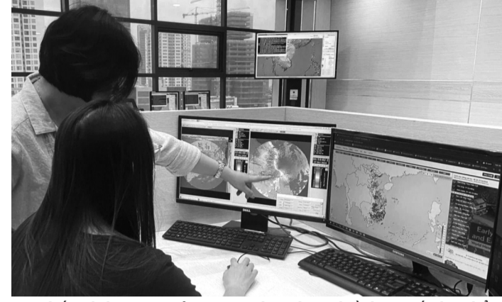
● Hệ thống dự báo KTTV của Việt Nam hiện đã có nhiều bước tiến đáng kể.

Thứ trưởng Bộ NN&MT khẳng định: “Dự báo càng chính xác, cảnh báo càng sớm