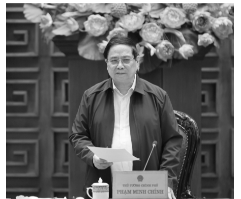
● Thủ tướng Phạm Minh Chính phát biểu tại cuộc họp.

Sáng 18/3, Thủ tướng Chính phủ Phạm Minh Chính chủ trì cuộc họp Thường trực Chính phủ để rà soát tình hình triển khai và đôn đốc, thúc đẩy tiến độ thực hiện dự án đường sắt gồm: Dự án đường sắt tốc độ cao Bắc - Nam, dự án đường sắt Lào Cai - Hà Nội - Hải Phòng, lập quy hoạch các tuyến đường sắt Hà Nội - Lạng Sơn và Hải Phòng - Móng Cái, các tuyến đường sắt đô thị Hà Nội và TP Hồ Chí Minh.