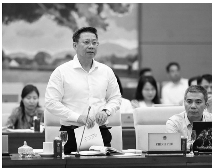
● Thứ trưởng Bộ Tư pháp Nguyễn Thanh Ngọc trình bày tờ trình dự án Luật tại phiên họp.