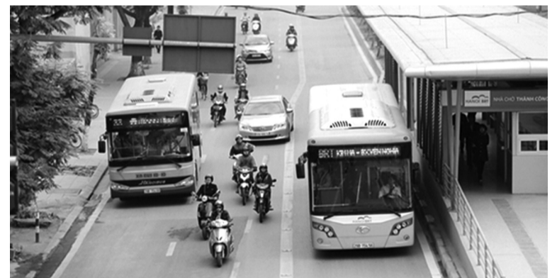
●Bộ Công Thương khuyến nghị người dân tăng cường sử dụng phương tiện công cộng. (Ảnh minh họa)

Bộ Công Thương đã có các khuyến nghị người dân và doanh nghiệp sử dụng xăng dầu tiết kiệm, hiệu quả. Cụ thể, Bộ Công Thương khuyến cáo người dân hạn chế sử dụng phương tiện cá nhân khi không cần thiết; ưu tiên đi chung xe, sử dụng phương tiện công cộng hoặc xe đạp cho quãng đường ngắn; Lái xe tiết kiệm nhiên liệu, giữ tốc độ ổn định, tránh tăng giảm ga đột ngột, hạn chế chạy tốc độ cao không cần thiết; Cần nhắc sử dụng xe điện, xe hybrid hoặc phương tiện sử