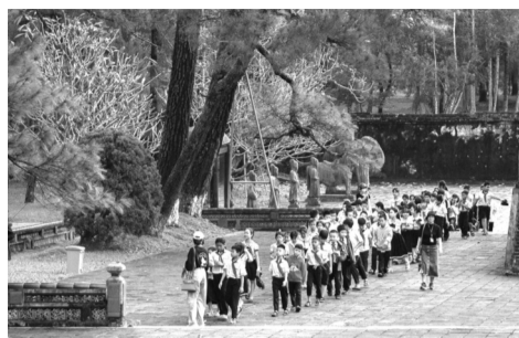
● Học sinh tham quan tìm hiểu tại một di tích văn hóa.

Thời gian qua, việc đưa giáo dục di sản (GDĐS) vào các trường học tại Huế đang góp phần giúp học sinh (HS) hiểu sâu hơn về ý nghĩa, giá trị lâu dài của văn hóa, từ đó hình thành ý thức gìn giữ và phát huy di sản. Hoạt động này được triển khai với sự phối hợp giữa Sở GD&ĐT và Trung tâm Bảo tồn Di tích Cổ đô (BTDTCD) Huế.