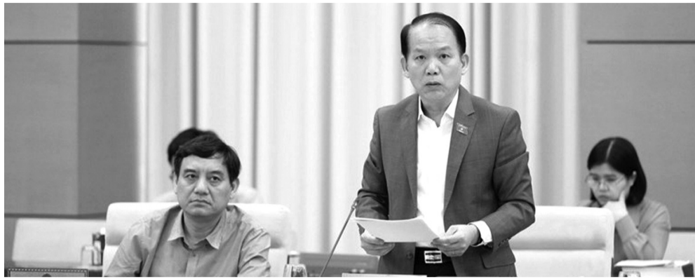
● Chủ nhiệm Ủy ban Pháp luật và Tư pháp của Quốc hội Hoàng Thanh Tùng trình bày báo cáo tại phiên họp.

Chiều 18/3, tiếp tục chương trình Phiên họp thứ 55, tại Nhà Quốc hội, dưới sự điều hành của Phó Chủ tịch Quốc hội Nguyễn Khắc Định, Ủy ban Thường vụ Quốc hội (UBTVQH) cho ý kiến về dự án Luật Thủ đô (sửa đổi).