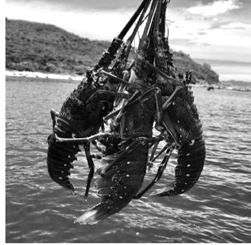
●Tôm hùm là mặt hàng xuất khẩu đạt giá trị cao trong 2 tháng đầu năm.

Tôm sú đạt 44,6 triệu USD, tăng 13%, tiếp tục giữ vai trò ổn định trong phân khúc trung và cao cấp. Sự khác biệt về tốc độ tăng trưởng cho