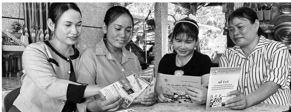
● Phát tờ rơi tuyên truyền về bình đẳng giới cho các gia đình tại xã An Vinh, tỉnh Gia Lai.

Cố ý tuyên truyền sai sự thật để cản trở việc bổ nhiệm người vào vị trí quản lý, lãnh đạo hoặc các chức danh chuyên môn vi phạm bình đẳng giới.