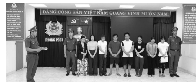
● Các đối tượng bị bắt giữ trong Chuyên án 1025H.