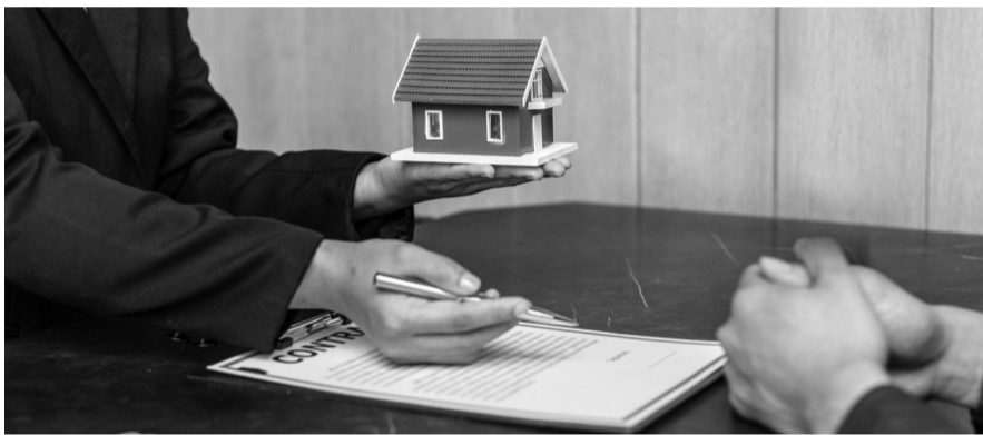
● Nghị định mới góp phần giảm gánh nặng chi phí cho người dân và doanh nghiệp - chuẩn hóa và nâng cao chất lượng đội ngũ Quản tài viên. (Ảnh minh họa)