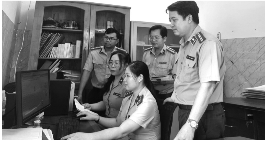
● Cán bộ, Chấp hành viên Phòng THADS Khu vực 9 - Cà Mau tích cực triển khai hiệu quả Nền tảng số trong lĩnh vực THADS.

Tiếp tục chỉ đạo tập trung rà soát lập danh sách, có kế hoạch tổ chức thực hiện hiệu quả đối với các vụ việc có giá trị thi hành lớn; án liên quan đến tín dụng, ngân hàng; án có điều kiện thi hành nhưng trên 01 năm, 05 năm chưa tổ chức thi hành xong. Rà soát các vụ việc chưa có điều kiện thi hành chuyển sang theo dõi riêng bảo đảm theo quy trình, quy định. Tổ chức giao tài sản đã bán đấu giá thành nhưng chưa giao được. THU NGUYỄN