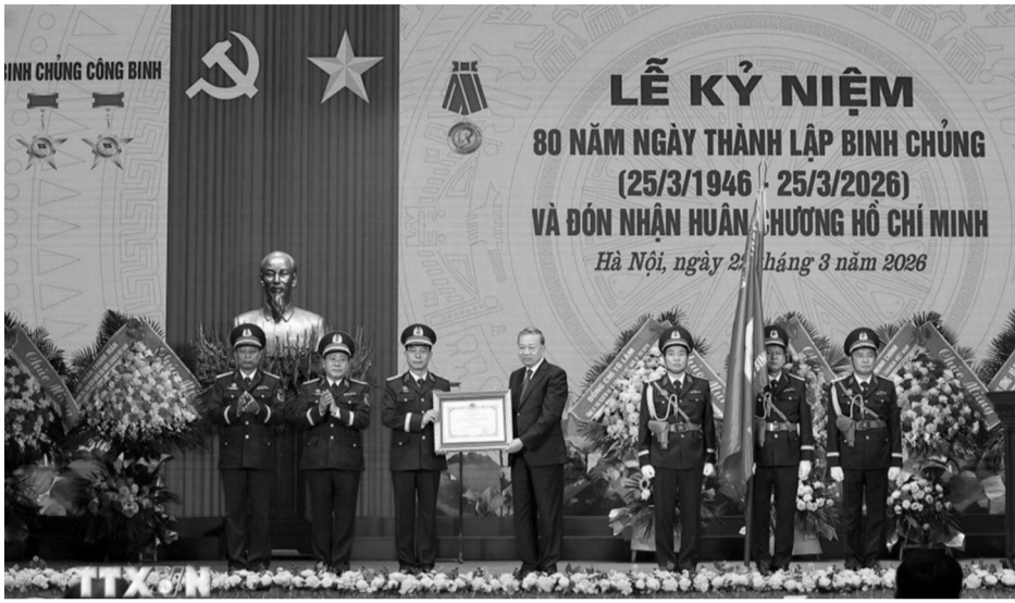
● Tổng Bí thư Tô Lâm trao tặng Huân chương Hồ Chí Minh cho Binh chủng Công binh.

Sáng 22/3, tại Hà Nội, Đảng ủy Bộ Tư lệnh Binh chủng Công binh (Bộ Quốc phòng) tổ chức Lễ kỷ niệm 80 năm Ngày thành lập Binh chủng Công binh (25/3/1946 - 25/3/2026) và đón nhận Huân chương Hồ Chí Minh. Tại buổi lễ, Tổng Bí thư Tô Lâm, Bí thư Quân ủy Trung ương đã trao Huân chương Hồ Chí Minh cho Binh chủng Công binh, phần