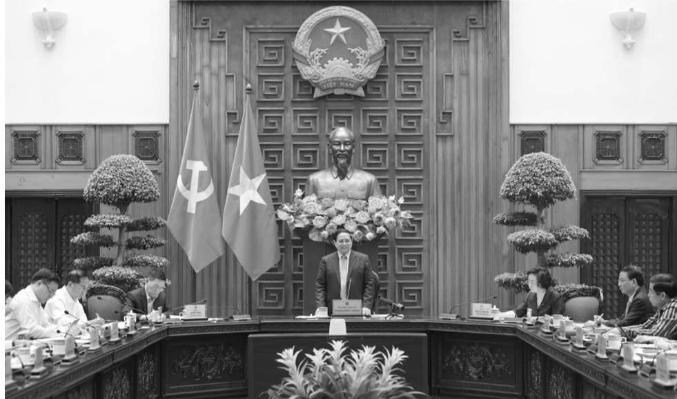
● Tại cuộc họp chiều 21/3, Thủ tướng Phạm Minh Chính yêu cầu các Bộ, ngành, doanh nghiệp liên quan thực hiện nghiêm, kịp thời, hiệu quả các chỉ đạo của Bộ Chính trị trong Kết luận số 14 về bảo đảm nguồn cung xăng dầu.

Trước bối cảnh giá cả biến động, nguy cơ xuất hiện các hành vi đầu cơ, găm hàng,