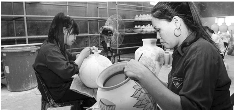
● Vẽ hoa văn lên sản phẩm tại làng gốm Bát Tràng, Hà Nội.

Làng nghề phải có phương án bảo vệ môi trường, có tổ chức tự quản về bảo vệ môi trường và hạ