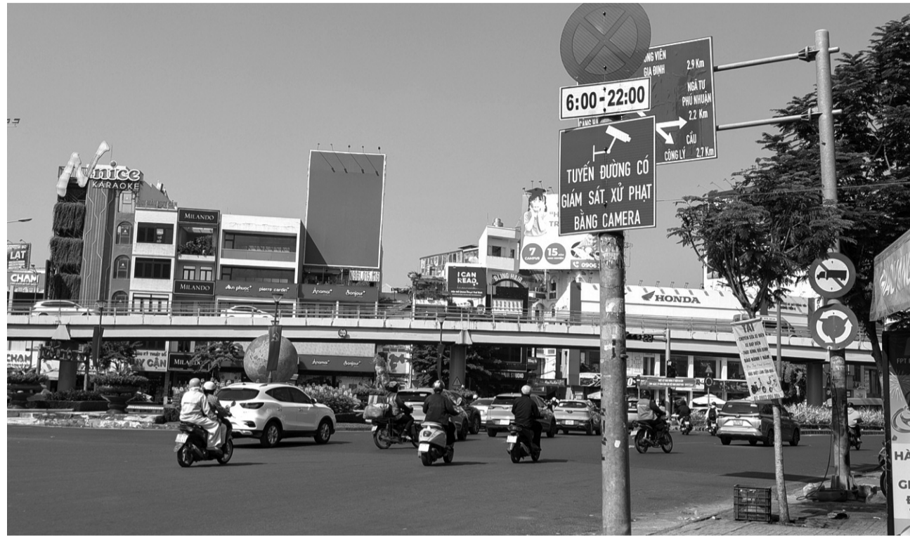
● Hệ thống camera theo dõi an ninh trật tự đang được vận hành hiệu quả tại TP HCM.

TP HCM sẽ tăng cường công tác tuyên truyền phòng, chống tội phạm để nâng cao nhận thức, ý thức chấp hành pháp luật của người dân; phổ biến phương thức, thủ đoạn của các loại tội phạm và kỹ năng phòng ngừa; phát huy vai trò của cộng đồng trong phát hiện, tố giác tội phạm, góp phần giữ vững an ninh, trật tự trên địa bàn.