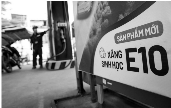
● Xăng E10 sẽ được đưa ra thị trường sớm hơn lộ trình.

Theo báo cáo của các thương nhân kinh doanh xăng dầu,