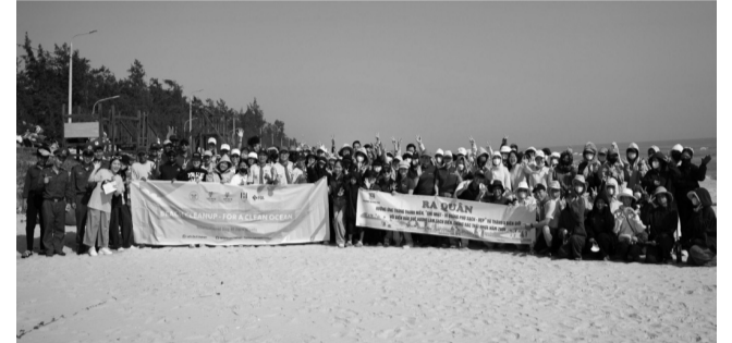
● Đồng đảo tình nguyện viên đã cùng dọn rác với chính quyền địa phương, các tổ chức xã hội và cộng đồng dân cư.

Cuối tuần qua, tại bãi biển Hạ Thanh (phường Quảng Phú, thành phố Đà Nẵng), Let's Do It Vietnam phối hợp cùng UBND phường Quảng Phú, Công ty Hirdaramani Vietnam - Fashion Garments Limited (FGL), đã tổ chức buổi dọn rác "Hành động đẹp - Vì biển xanh" nhằm hưởng ứng Ngày Quốc tế Không rác thải 30/03 hàng năm. Chương trình thu hút sự tham gia của hơn 160 tình nguyện viên, qua đó thu gom được hơn 300kg rác thải bị vứt bừa bãi tại khu vực bãi biển.