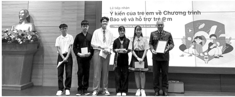
● Lễ tiếp nhận ý kiến của trẻ em về chương trình bảo vệ và hỗ trợ trẻ em tương tác lành mạnh trên môi trường mạng giai đoạn 2026 - 2030.