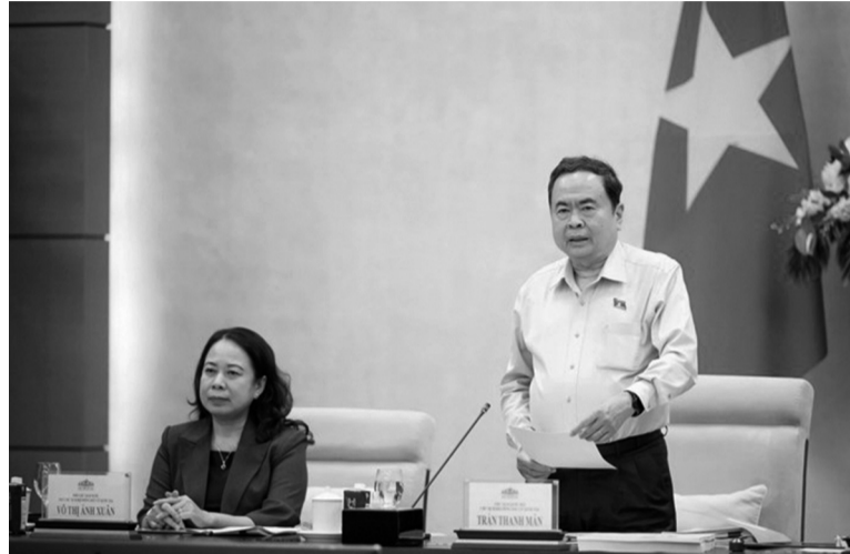
● Chủ tịch Quốc hội Trần Thanh Mẫn phát biểu kết luận Phiên họp.

Về nhiệm vụ thời gian tới, Chủ tịch QH Trần Thanh Mẫn đề nghị Văn phòng HĐBCQG và Ủy ban Công tác đại biểu của QH cần chuẩn bị đầy đủ tài liệu phục vụ hội nghị tổng kết ngày 31/3/2026, theo kế hoạch đã được