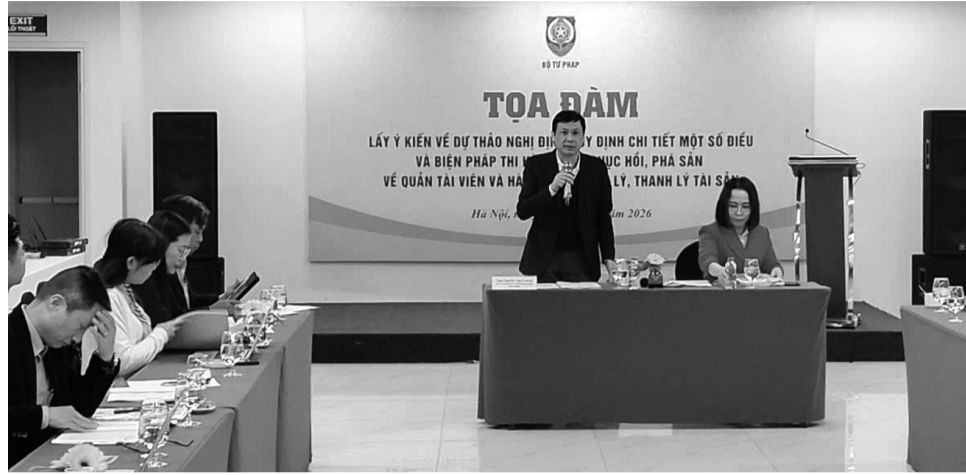
● Bộ Tư pháp tổ chức Tọa đàm lấy ý kiến về dự thảo Nghị định quy định chi tiết một số điều và biện pháp thi hành Luật Phục hồi, phá sản về quản tài viên và hành nghề quản lý, thanh lý tài sản.

Nghị định 65/2026/NĐ-CP quy định chi tiết một số điều và biện pháp thi hành Luật Phục hồi, phá sản về Quản tài viên và hành nghề quản lý, thanh lý tài sản có hiệu lực từ ngày 1/3/2026. Nghị định mới góp phần giảm gánh nặng chi phí cho người dân và doanh nghiệp; chuẩn hóa và nâng cao chất lượng đội ngũ Quản tài viên.