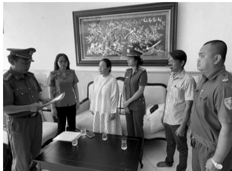
● Tổng đạt quyết định tố tụng với bị can Tiên.