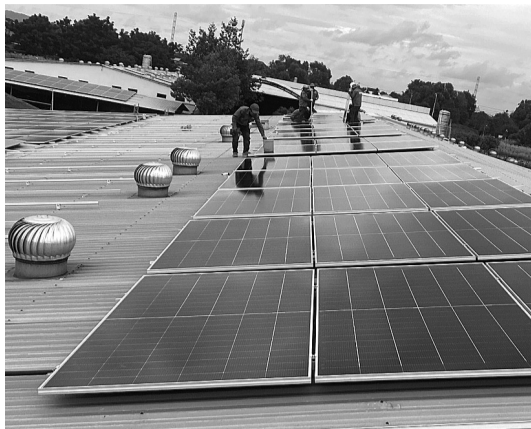
● Xu hướng lắp đặt điện mặt trời mái nhà tại TP HCM ngày càng tăng mạnh.

Một trong những giải pháp đáng chú ý là công bố danh mục thủ tục