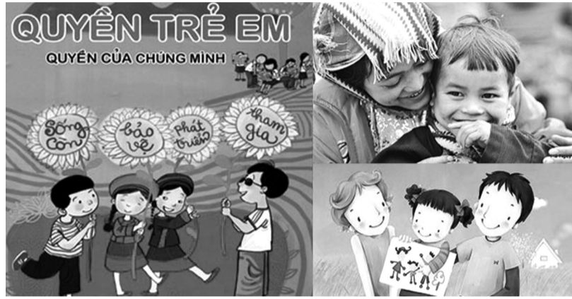
● Giúp trẻ em "lên tiếng" và tham gia vào quá trình hoạch định chính sách liên quan quyền và sự an toàn của mình là bước thể hiện rõ ràng quyền tham gia của trẻ em theo luật định.