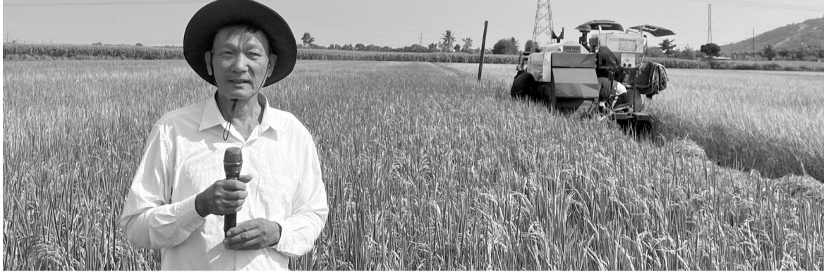
● Nông dân chia sẻ về hiệu quả của mô hình canh tác lúa áp dụng công nghệ sạ hàng - đất khô kết hợp vùi phân.

Tại xã Xuân Phú, tỉnh Đồng Nai, Viện Nghiên cứu lúa gạo quốc tế (IRRI) vừa tổ chức sự kiện “Tổng kết mùa vụ mô hình canh tác lúa áp dụng cơ giới hóa sạ hàng - đất khô kết hợp vùi phân”. Sự kiện nhằm tổng kết, đánh giá kết quả triển khai mô hình canh tác trên trong vụ Đông Xuân 2025 - 2026.