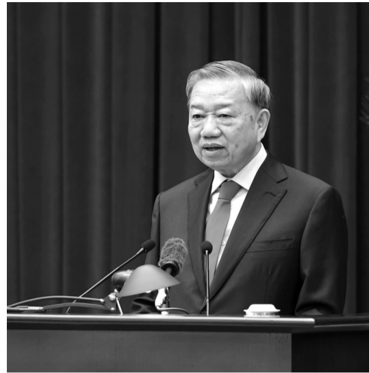
● Tổng Bí thư Tô Lâm phát biểu khai mạc Hội nghị.

Tổng Bí thư Tô Lâm nêu rõ, Đại hội XIV của Đảng đã chỉ ra đường hướng phát triển mới của đất nước. Hội nghị Trung ương 2 có trách nhiệm biến tinh thần, khát vọng, quyết tâm và phương hướng lớn của Đại hội XIV thành cơ chế vận hành, thành khuôn khổ tổ chức, thành năng lực cầm quyền thực chất của Đảng trong toàn bộ nhiệm kỳ.