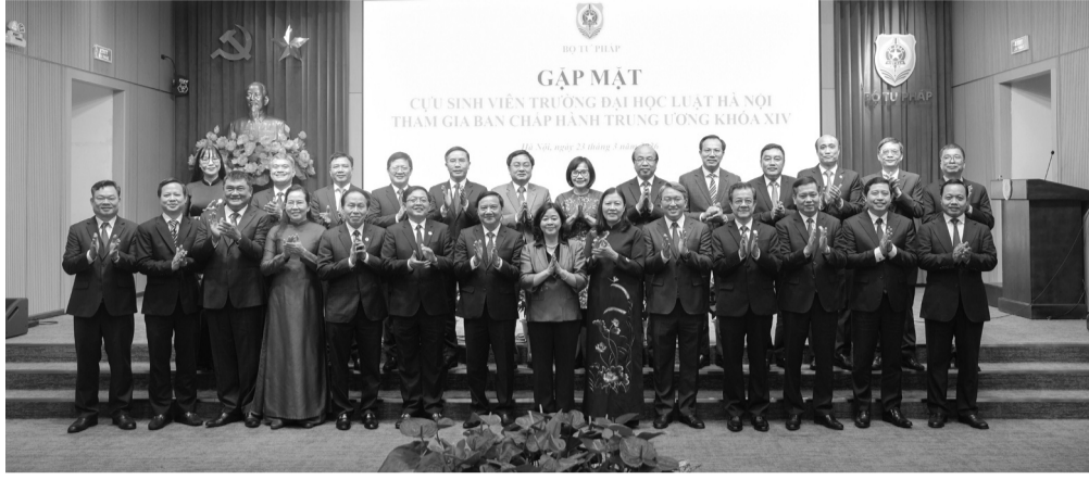
● Các đại biểu chụp ảnh lưu niệm tại buổi gặp mặt.

Bộ trưởng Bộ Tư pháp Nguyễn Hải Ninh, Ủy viên Ban Chấp hành Trung ương Đảng, cựu sinh viên khóa 18 đã nhấn mạnh như vậy tại buổi gặp mặt cựu sinh viên Trường Đại học Luật Hà Nội tham gia Ban Chấp hành Trung ương khóa XIV vào ngày 23/3.