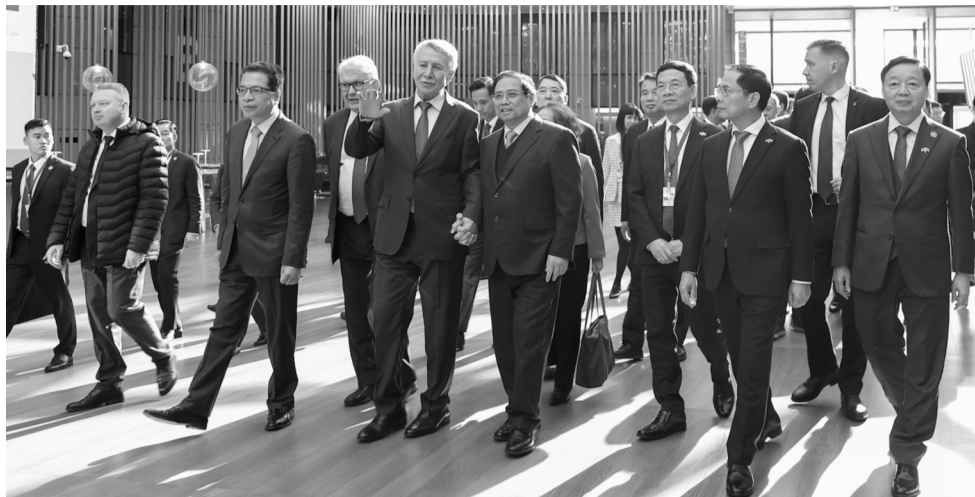
● Thủ tướng Phạm Minh Chính cùng Đoàn đại biểu cấp cao Việt Nam đến thăm, làm việc với Tập đoàn Novatek.

các quy định của pháp luật liên quan lĩnh vực điện lực, Thủ tướng hoan nghênh Tập đoàn tham gia phát triển các dự án xây dựng cơ sở hạ tầng kho cảng LNG, các dự án nhà máy điện khí LNG cũng như việc cung cấp LNG ổn định cho thị trường Việt Nam, phát huy tốt những thuận lợi nói trên và có giải pháp kịp thời tháo gỡ các khó khăn, vướng mắc.