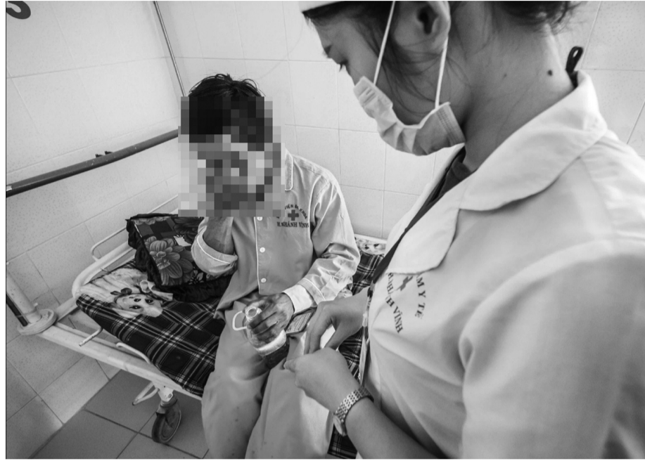
● Việt Nam hiện đứng thứ 12/30 quốc gia có gánh nặng bệnh lao cao nhất thế giới. (Nguồn: WHO)

Ngày Thế giới phòng, chống bệnh lao 24/3 năm 2026 gửi gắm toàn cầu thông điệp: “Yes! We Can End TB! Led by Countries! Powered by People!” (Tạm dịch: “Đúng! Chúng ta có thể chấm dứt bệnh lao! Quốc gia dẫn dắt - Nhân dân đồng hành!”). Tại Việt Nam - quốc gia hiện đứng thứ 12/30 quốc gia có gánh nặng bệnh lao cao nhất thế giới, chủ đề năm 2026 được xác định là: “Phát hiện lao gắn với khám sức khỏe định kỳ cho mỗi người dân”.