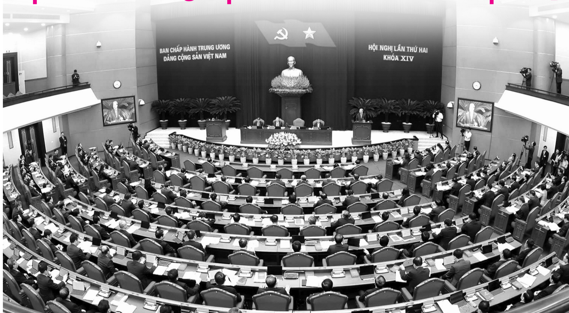
● Quang cảnh phiên khai mạc Hội nghị.

Sáng 23/3, Hội nghị lần thứ 2 Ban Chấp hành Trung ương Đảng khóa XIV đã khai mạc trọng thể tại Thủ đô Hà Nội. Nội dung Hội nghị cần giải quyết rất nhiều, rất rộng, rất khó, đều là những việc phải làm, cần làm ngay, không thể chậm trễ.