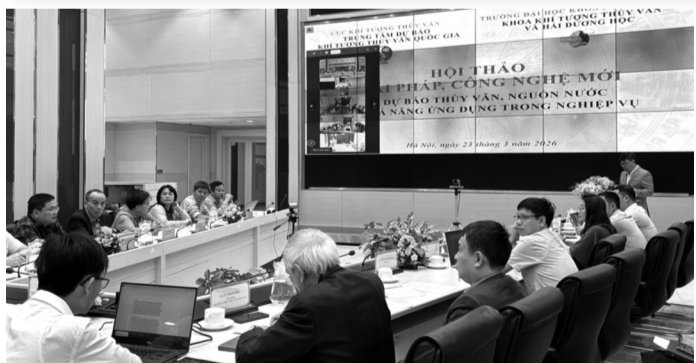
● Hội thảo do Cục KTTV phối hợp tổ chức.

Một số ý kiến tại Hội thảo cho rằng, nếu tăng đầu tư cho quan trắc, dự báo và cảnh báo thiên tai, có thể giúp giảm thiểu 30 - 40% thiệt hại trong các kịch bản rủi ro lớn; để nghị chuyển mạnh sang cảnh báo tác động, tức là không chỉ dừng ở thông tin mưa hay mực nước, mà chỉ ra cụ thể khu vực nào, thời điểm nào có nguy cơ ngập, ảnh hưởng ra sao để người dân có thể hành động sớm. Cần rút ngắn chu kỳ cập nhật bản tin dự báo lũ, từ 3 - 6 giờ xuống còn 1 giờ trong các tình huống khẩn cấp, đồng thời sử dụng các kênh truyền thông như mạng xã hội để truyền tải thông tin nhanh hơn tới người dân.