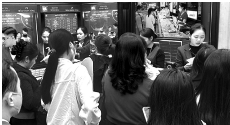
Do nhu cầu mua vàng trong dân lớn khiến giá vàng bị đẩy lên mức cao.

Xu hướng giảm của giá vàng thế giới đã diễn ra liên tục trong gần một tháng qua. Từ đỉnh cao khoảng 5.600 USD/ounce hồi cuối tháng 2, giá vàng đã giảm rất mạnh, xuống còn khoảng 4.250 USD/ounce trong ngày 23/3. Như vậy, chỉ trong chưa đầy một tháng, giá vàng đã “bốc hơi” khoảng 1.350 USD/ounce, tương đương mức giảm lên tới 24%. Thậm chí, có thời điểm giá vàng xuống dưới 4.200 USD/ounce, ở mức 4.184 USD/ounce. Trong 24 giờ qua, giá vàng giảm đến 260.85 USD/Ounce.