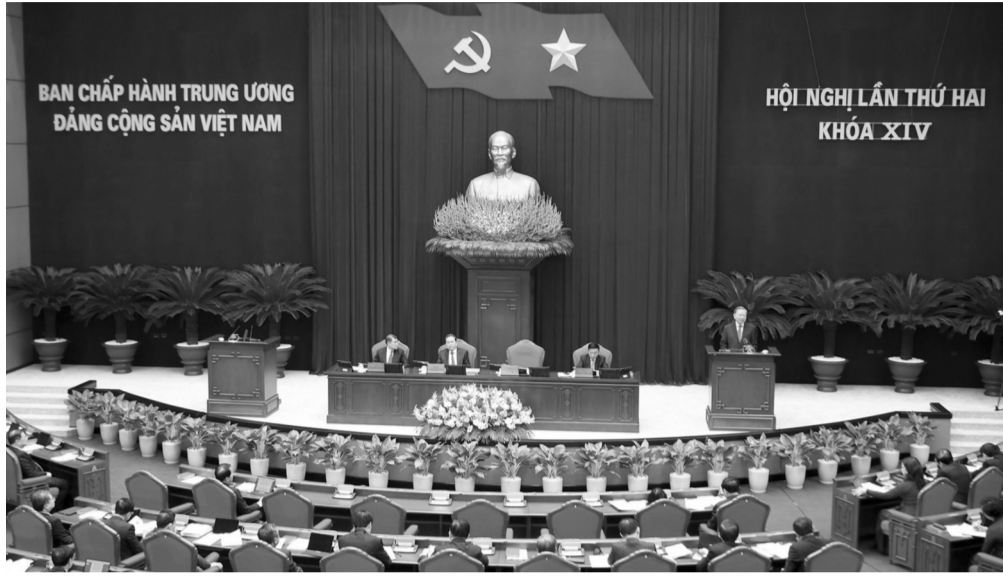
● Quang cảnh phiên khai mạc Hội nghị.