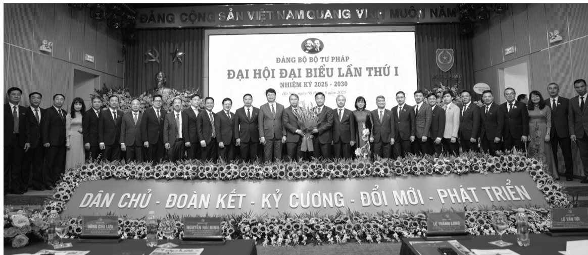
● Phó Thủ tướng Chính phủ Lê Thành Long chúc mừng Ban Chấp hành Đảng bộ Bộ Tư pháp nhiệm kỳ 2025 - 2030.