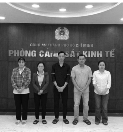
● Công an đã khởi tố 5 đối tượng trong vụ án.