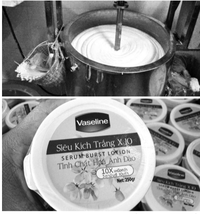
● Kem trộn được pha chế từ hóa chất không rõ nguồn gốc, xuất xứ.