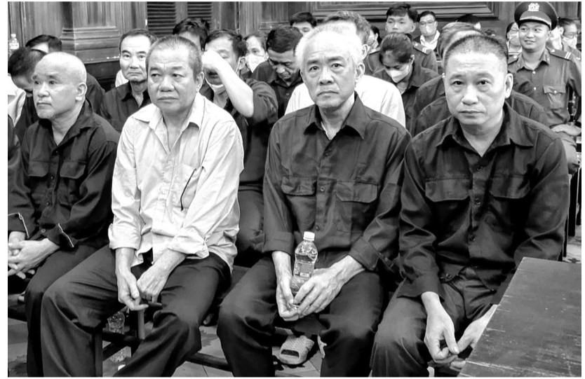
● Một số bị cáo trong phiên xử.

Bản án xác định, nhằm thu hút số học viên đăng ký, tăng doanh thu cho các Trung tâm đào tạo lái xe, lãnh đạo các trung tâm đã đưa ra chủ trương không yêu cầu học viên tham gia học lý thuyết, thực hành và thi hết môn theo quy định mà chỉ hợp thức hóa số buổi học và kết quả thi. Sau đó, lãnh đạo các trung tâm chỉ đạo nhân viên, giáo viên không tổ chức học tập trung, phân công kỹ