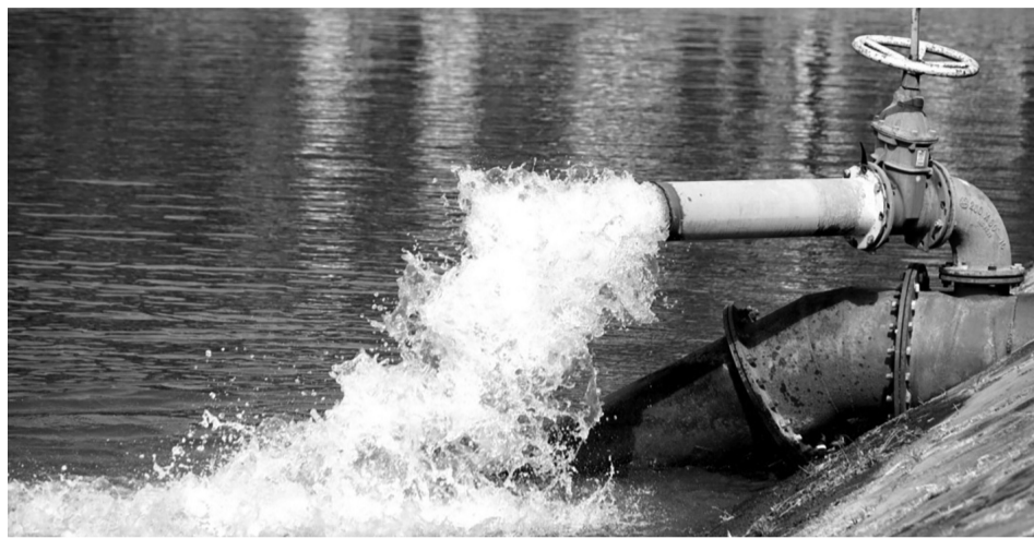
● Hệ thống công trình thủy lợi được vận hành linh hoạt.

Trước tình hình xâm nhập mặn năm 2026, ngành Nông nghiệp và Môi trường tỉnh Đồng Tháp chủ động triển khai nhiều giải pháp đồng bộ nhằm bảo vệ sản xuất nông nghiệp, đồng thời bảo đảm nguồn nước phục vụ sinh hoạt cho người dân tại các khu vực bị ảnh hưởng.