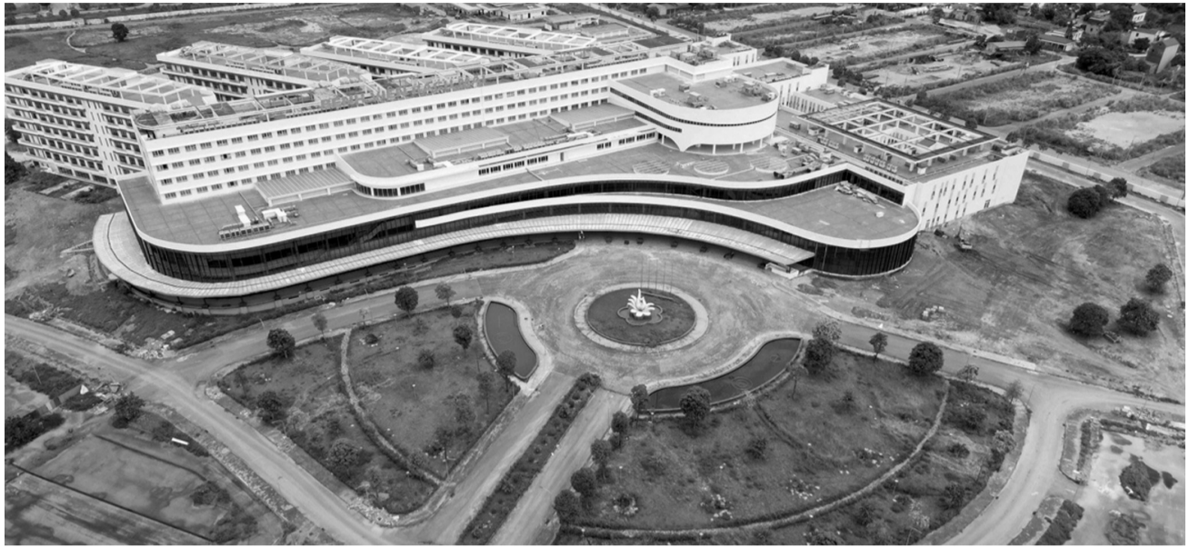
● Dự án cơ sở 2 BV Bạch Mai.