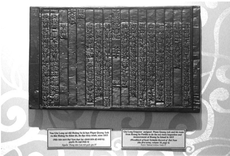
● Mộc bản triều Nguyễn là di sản tư liệu của Việt Nam được UNESCO ghi danh.

Bảo quản trị liệu bằng các biện pháp khoa học, kỹ thuật và các biện pháp khác phù hợp nhằm loại trừ nguyên nhân gây hại và phục hồi một phần hư hỏng của di sản tư liệu; Chuyển dạng số, cập nhật, sao lưu trên hệ thống cơ sở dữ liệu quốc gia phục vụ hoạt động quản lý, bảo vệ và phát huy giá trị trên môi trường điện tử theo quy định của Luật này, Luật Tiếp