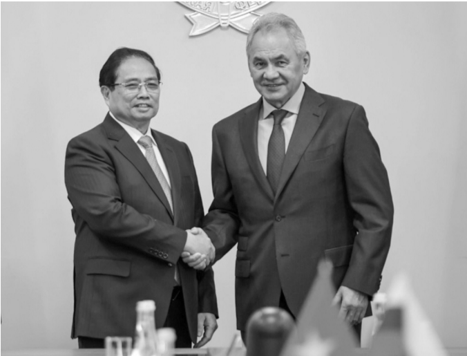
● Thủ tướng Phạm Minh Chính và Thủ ký Hội đồng An ninh Liên bang Nga Sergey Shoigu.

Trong khuôn khổ chuyến thăm chính thức Liên bang Nga, ngày 24/3 (theo giờ địa phương), Thủ tướng Phạm Minh Chính và Đoàn lãnh đạo cấp cao Việt Nam đã có cuộc gặp với Thủ ký Hội đồng An ninh Liên bang Nga Sergey Shoigu. Trong không khí tin cậy chính trị cao, Thủ tướng