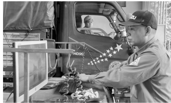
● Từ 1/3/2026, phương pháp đo độ khói khí thải với xe diesel được thực hiện theo chu trình gia tốc tự do.

Theo đó, từ 1/3/2026, quy định tại QCVN 85:2025/BNNMT, phương pháp đo độ khói khí thải với xe diesel được thực hiện theo chu trình gia tốc tự do. Một số phản ánh cho rằng việc yêu cầu đạp bàn đạp ga đến hết hành trình trong thời gian dưới 1 giây, đạt tốc độ lớn nhất của động cơ trong thời gian ngắn, có thể dẫn đến rủi ro hư hỏng cơ khí nghiêm trọng như cháy bạc biên, gãy tay biên, vỡ ốc máy, vỡ ống nước làm mát, gãy cánh quạt, đặc biệt với các xe đời cũ đã qua nhiều năm sử dụng. Một số đề xuất cho rằng chỉ đạp ga khoảng 1/2 hành trình (tương đương 2.000 - 3.000 vòng/phút) với xe thế hệ cũ.