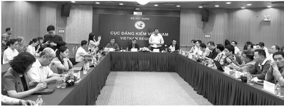
● Hội nghị do Cục Đăng kiểm tổ chức.

Cục Đăng kiểm (Bộ Xây dựng) tổ chức Hội nghị trao đổi về công tác kiểm tra khí thải xe ô tô. Một trong những vấn đề được đặc biệt quan tâm là quy trình kiểm tra khí thải với xe lắp động cơ diesel theo phương pháp gia tốc tự do.