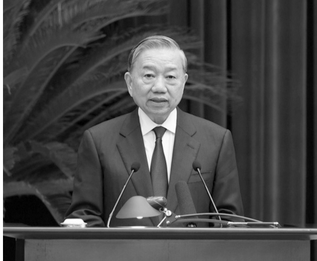
● Tổng Bí thư Tô Lâm phát biểu bế mạc Hội nghị.

Sau 3 ngày làm việc khẩn trương, nghiêm túc, trách nhiệm, dân chủ, thẳng thắn, sâu sắc, Hội nghị lần thứ 2 Ban Chấp hành Trung ương Đảng khóa XIV đã hoàn thành toàn bộ nội dung, chương trình đề ra và bế mạc chiều 25/3, tại Thủ đô Hà Nội.