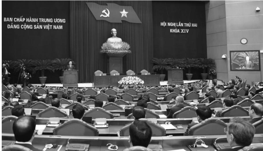
● Quang cảnh Hội nghị. (Ảnh: VGP)