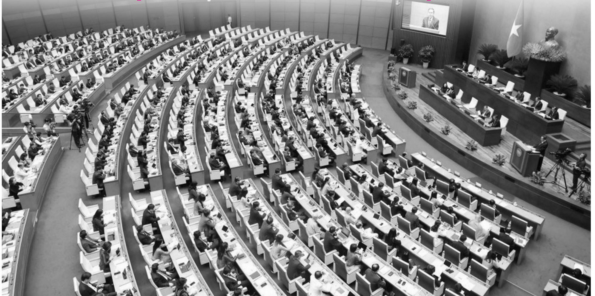
● Kỳ họp thứ nhất Quốc hội khóa XVI dự kiến khai mạc ngày 6/4/2026. (Ảnh minh họa: QH)

Trong những điển hình được tôn vinh tại Chương trình bình chọn, tôn vinh “Gương sáng Pháp luật” các năm 2021, 2023 và 2025 (do Báo Pháp luật Việt Nam chủ trì tổ chức), nhiều cá nhân tiêu biểu tiếp tục được cử tri tín nhiệm bầu làm đại biểu Quốc hội khóa XVI. Họ không chỉ mang theo kinh nghiệm thực tiễn phong phú, mà còn đại diện cho tinh thần thượng tôn pháp luật, tận tâm phụng sự Nhân dân - những giá trị đang ngày càng được kỳ vọng lan tỏa mạnh mẽ trong hoạt động lập pháp và giám sát.