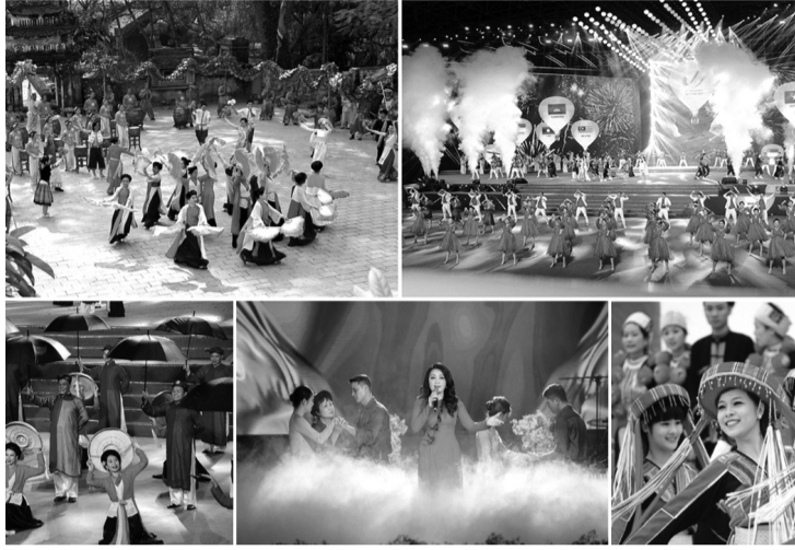
● Nghị quyết số 80-NQ/TW về phát triển văn hóa Việt Nam là dấu mốc quan trọng trong tư duy phát triển văn hóa Việt Nam. (Ảnh minh họa)