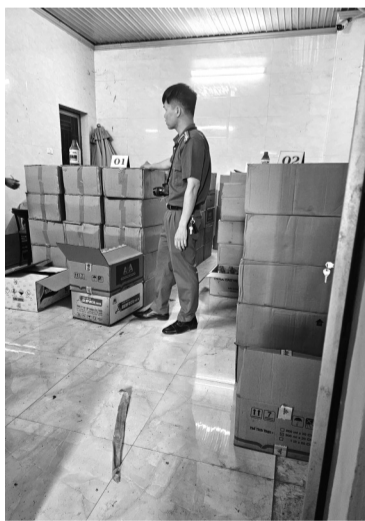
● Một phần tang vật vụ án.

trừ cô này có phải hàng cấm, hàng giả hay không.