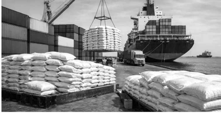
● Nguồn cung gạo toàn cầu đang dư thừa khiến việc xuất khẩu gặp nhiều khó khăn.

Bối cảnh toàn cầu đang gặp nhiều khó khăn do biến động chính trị, nguồn cung toàn cầu cũng đang dư thừa, các quốc gia cạnh tranh đều đã có các kế hoạch xuất khẩu năm 2026 kỷ càng... những điều này đang khiến cho việc xuất khẩu gạo năm 2026 của Việt Nam gặp nhiều khó khăn.