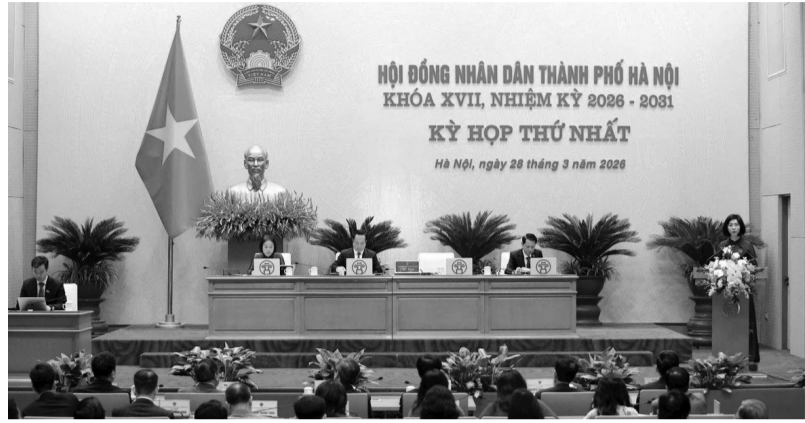
● Quang cảnh Kỳ họp thứ Nhất HĐND Thành phố Hà Nội khoá XVII, nhiệm kỳ 2026 - 2031.

Trong những ngày vừa qua, một số địa phương trên cả nước đã tổ chức Hội nghị tổng kết cuộc bầu cử đại biểu Quốc hội khóa XVI và đại biểu HĐND các cấp nhiệm kỳ 2026 - 2031; tổ chức Kỳ họp thứ Nhất của HĐND cấp tỉnh, kiện toàn các chức danh lãnh đạo chủ chốt của nhiệm kỳ mới.