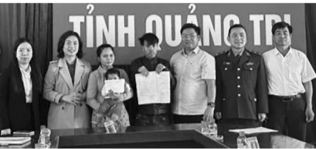
● Sự vào cuộc của các lực lượng đã giúp các trường hợp trẻ em “đặc biệt” được ĐKKK.

ngợi các địa phương rà soát, thống kê các trường hợp, xây dựng kế hoạch hỗ trợ cụ thể. Sở cũng chủ động triển khai các biện pháp hỗ trợ trực tiếp tại cơ sở, chỉ đạo TTTGPLNN số 2 cử cán bộ trực tiếp xuống cơ sở, đến từng hộ gia đình tư vấn, hỗ trợ hoàn thiện hồ sơ.