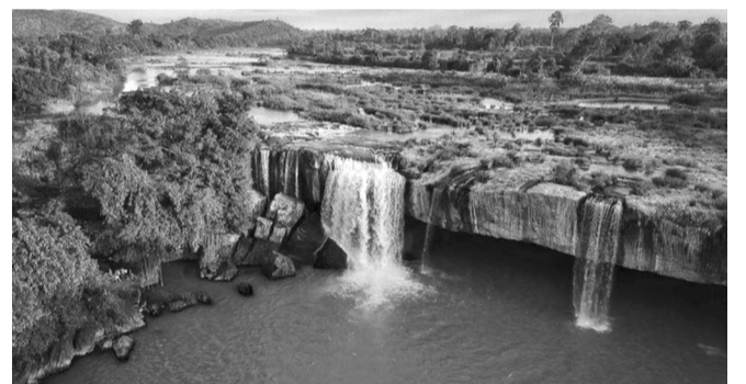
● Đăk Lăk có nhiều tiềm năng để trở thành một trung tâm du lịch quốc gia đẳng cấp.

Ngày 29/3, tại Khu du lịch biển Sao Mai (phường Bình Kiến, tỉnh Đăk Lăk), Viện Nghiên cứu phát triển Phương Đông và Viện Kinh tế văn hóa (thuộc Liên hiệp các Hội Khoa học và Kỹ thuật Việt Nam) đã tổ chức tọa đàm khoa học với chủ đề: "Xây dựng vùng Phú Yên thành trung tâm du lịch quốc gia".