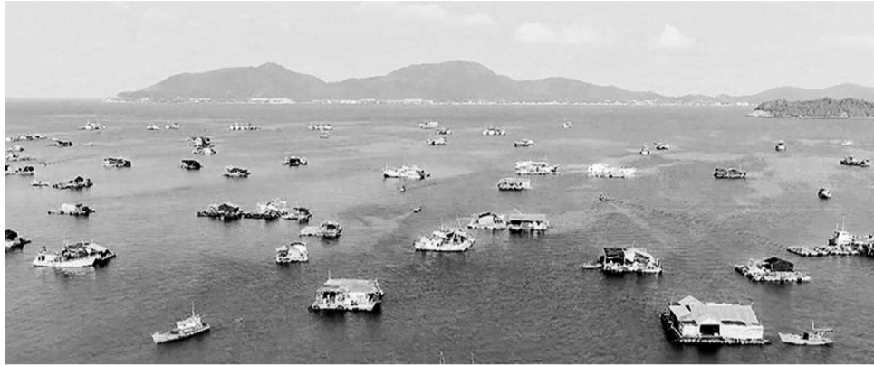
● Nuôi cá lồng bè trên biển ở tỉnh An Giang.

Bộ Nông nghiệp và Môi trường đã ban hành Thông tư 18/2026/TT-BNNMT quy định mức thu tiền sử dụng khu vực biển cụ thể thuộc thẩm quyền giao khu vực biển của Bộ trưởng Bộ Nông nghiệp và Môi trường.