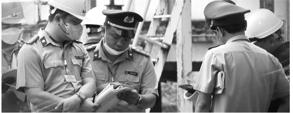
● Chấp hành viên tác nghiệp.

Điểm nổi bật của mô hình là đưa hệ thống THADS gần dân, sát dân và phục vụ Nhân dân tốt hơn. Người dân không còn cần phải xác định cơ quan THADS có thẩm quyền trong quá trình yêu cầu THA như trước đây mà có thể trực tiếp yêu cầu THA tại bất kỳ Phòng THADS khu vực nào trong phạm vi tỉnh, TP thuận tiện, nhanh chóng.