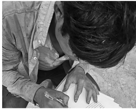
● Cán bộ đến tận nhà trực tiếp hướng dẫn người dân hoàn thiện thủ tục ĐKKK cho trẻ.

Trước thực tế này, Sở Tư pháp nhận định, việc ĐKKK cho các trẻ này là nhiệm vụ cần được ưu tiên giải quyết. Sở đã ban hành các văn bản chỉ đạo, đề