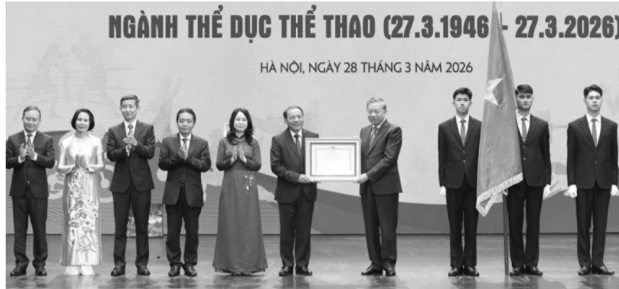
● Tổng Bí thư Tô Lâm trao Huân chương Lao động hạng Nhất tặng Cục Thể dục Thể thao Việt Nam.

Đặt trong bối cảnh đất nước bước vào giai đoạn phát triển mới với yêu cầu cao hơn về chất lượng nguồn nhân lực và sức khỏe cộng đồng, Tổng Bí thư yêu cầu phải có cách nhìn tổng quát hơn về vị trí, vai trò của thể dục thể thao. Tổng Bí thư đề ra 8 nhiệm vụ trọng tâm cho ngành trong thời gian tới, trong đó nhấn mạnh một số định hướng lớn như phải khẩn trương hoàn thiện thể chế phát triển thể dục thể