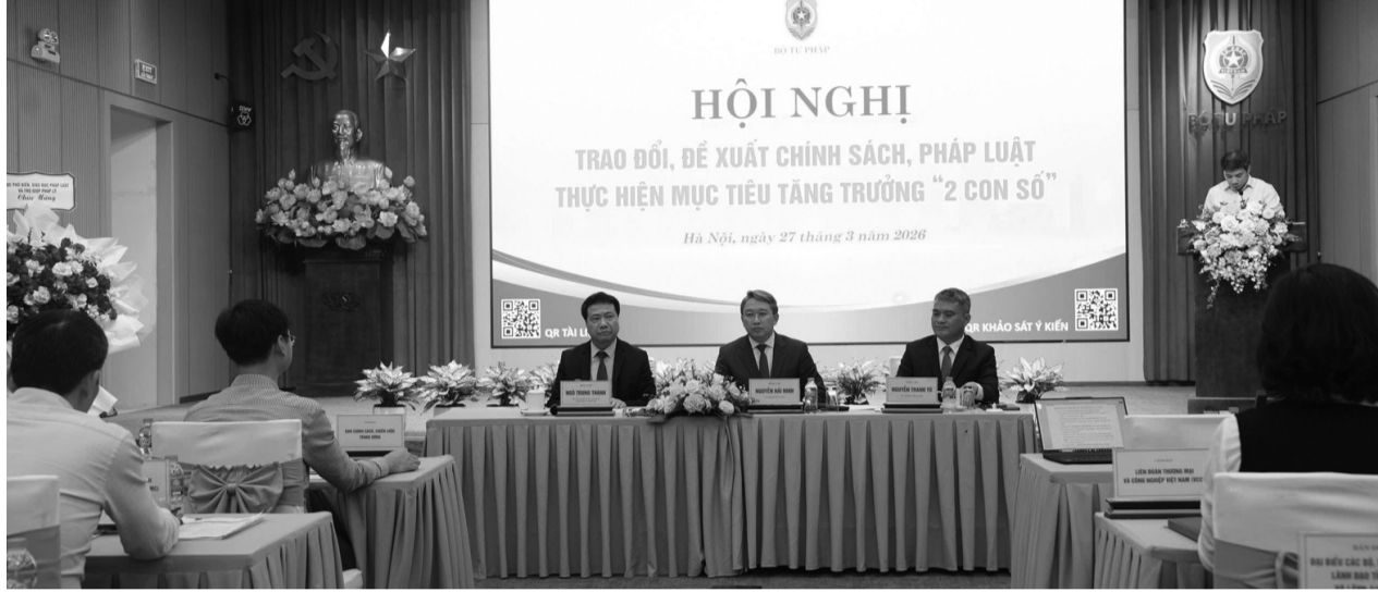
● Bộ trưởng Bộ Tư pháp Nguyễn Hải Ninh, Phó Chủ nhiệm Ủy ban Pháp luật và Tư pháp của Quốc hội Ngô Trung Thành, Thứ trưởng Bộ Tư pháp Nguyễn Thanh Tú chủ trì Hội nghị.

Đây là một trong những kiến nghị đáng chú ý tại Hội nghị trao đổi, đề xuất chính sách, pháp luật thực hiện mục tiêu tăng trưởng “2 con số” do Bộ Tư pháp tổ chức mới đây.