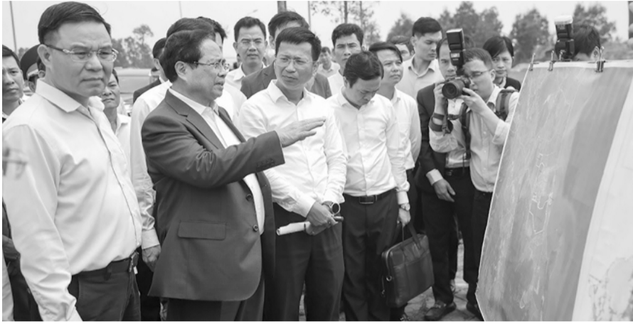
● Thủ tướng Phạm Minh Chính khảo sát địa điểm dự kiến xây dựng kho dự trữ xăng dầu chiến lược tại Khu kinh tế Nghi Sơn.

Sáng 29/3, dự Hội nghị xúc tiến đầu tư tỉnh Thanh Hóa năm 2026, Thủ tướng Phạm Minh Chính yêu cầu khai thác, phát huy hơn nữa “tứ Sơn” của Thanh Hóa (4 trung tâm kinh tế động lực gồm Nghi Sơn, Sầm Sơn, Lam Sơn, Bim Sơn), đặc biệt là giữ đà, giữ nhịp và tiếp tục mở rộng để Khu kinh tế Nghi Sơn phát triển tốt hơn.