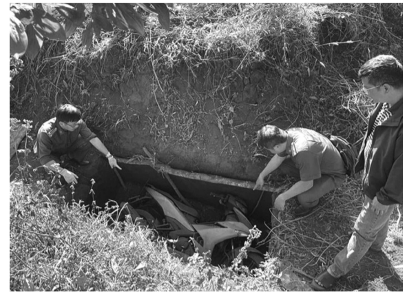
● Chiếc xe sử dụng gây án được giấu dưới hố.