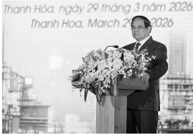
● Thủ tướng Phạm Minh Chính phát biểu tại Hội nghị xúc tiến đầu tư tỉnh Thanh Hóa năm 2026.

Phát biểu tại Hội nghị, Thủ tướng Phạm Minh Chính khẳng định Thanh Hóa có nhiều tiềm năng khác biệt, cơ hội nổi trội, lợi thế cạnh tranh, đã đạt được nhiều kết quả quan trọng nhưng cũng còn nhiều khó khăn; Đồng thời, trân trọng cảm ơn, đánh giá cao các nhà đầu tư dự Hội nghị, thể hiện sự quan tâm, ủng hộ, sẻ chia, với quyết tâm cao cùng tỉnh Thanh Hóa phát triển thành tỉnh “kiểu mẫu” như Chủ tịch Hồ Chí Minh từng căn dặn.