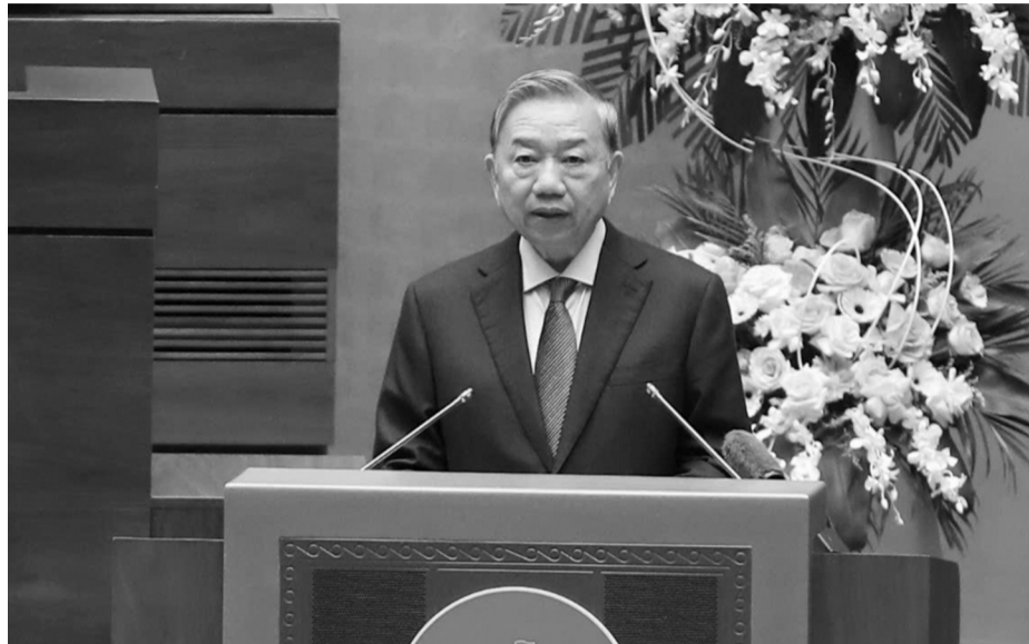
● Tổng Bí thư Tô Lâm lưu ý, bài học lớn nhất là thành công của một cuộc bầu cử chỉ thật sự trọn vẹn khi được chuyển hóa thành hiệu quả hoạt động của nhiệm kỳ mới. (Ảnh: VGP)

Phát biểu chỉ đạo Hội nghị, Tổng Bí thư Tô Lâm nêu 5 thành công của cuộc bầu cử. Trong đó, điểm nổi bật nhất của cuộc bầu cử lần này là sự tham gia đông đảo, trách nhiệm và đầy niềm tin của cử tri cả nước. Theo báo cáo, tỷ lệ cử tri đi bỏ phiếu đạt 99,70% - mức cao nhất từng được ghi nhận. Đặc biệt, không có đơn vị bầu cử nào phải bầu lại; 500 đại biểu QH đã được bầu đủ, đồng thời HĐND cấp tỉnh và cấp xã trong cả nước cũng được bầu đủ theo quy định. Những con số ấy không chỉ phản ánh hiệu quả tổ