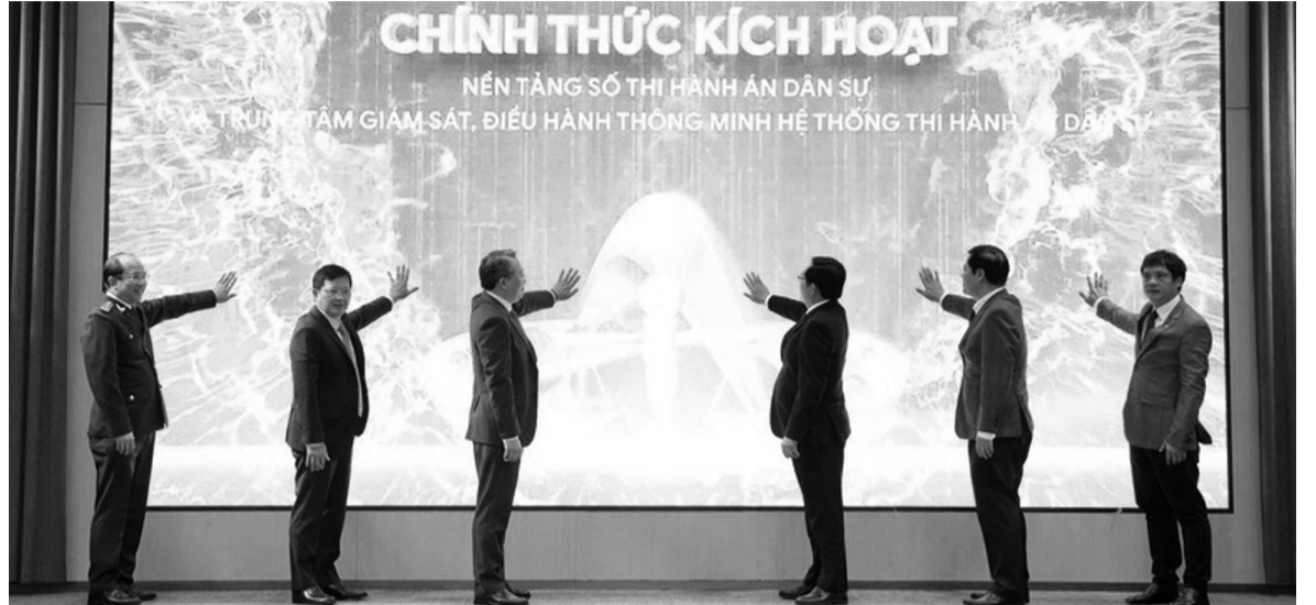
●Lãnh đạo Chính phủ, Lãnh đạo Bộ Tư pháp, Lãnh đạo Cục Quản lý THADS nhấn nút kích hoạt khai trương Nền tảng số THADS.

Kết quả, với sự hỗ trợ đắc lực của công nghệ thông tin, các vụ án quy mô lớn đã được tổ chức thi hành trong thời gian ngắn kỷ lục, thu hồi hàng nghìn tỷ đồng để chi trả cho người dân. Đây không chỉ là thành công về mặt nghiệp vụ, mà còn là minh chứng rõ nét