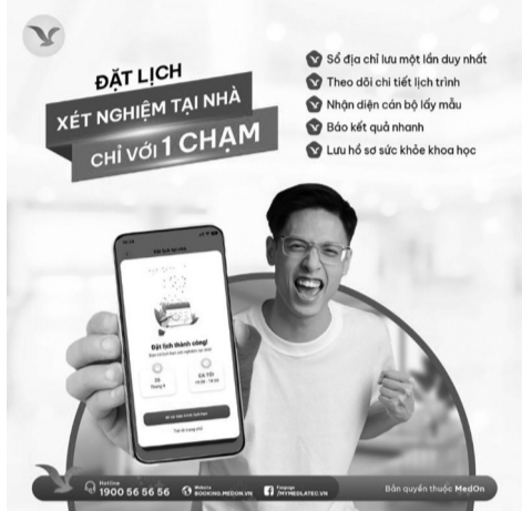
● App My Medlatic thiết lập quy trình dịch vụ khép kín, tiện lợi chỉ với một chạm.