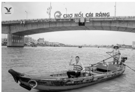
● Người dân chỉ cần đặt lịch là có nhân viên đến tận nơi lấy mẫu kiểm tra sức khỏe theo yêu cầu.