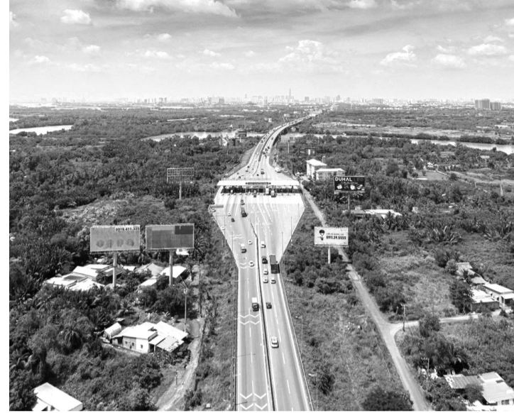
●Cao tốc TP HCM - Long Thành - Dầu Giây dài 55km thuộc địa bàn Đồng Nai và TP HCM.

Cục Đường bộ (Bộ Xây dựng) vừa ban hành quyết định phê duyệt điều chỉnh, bổ sung phương án tổ chức giao thông trên tuyến cao tốc TP HCM - Long Thành - Dầu Giây, đoạn từ Km 25+920 đến Km 54+983; nhằm hoàn thiện phương án phân làn, quy định tốc độ và tăng cường các điều kiện bảo đảm an toàn giao thông (ATGT), phù hợp thực tế khai thác.