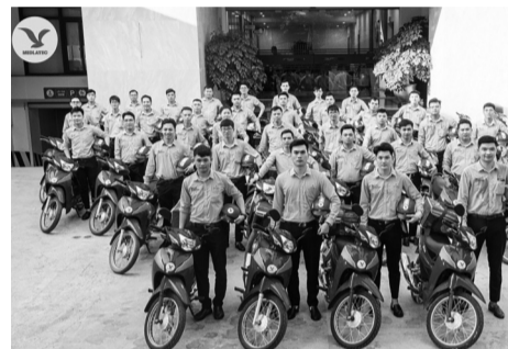
● Hàng ngày có gần 700 nhân viên lấy mẫu tận nơi chuyên nghiệp, tận tâm trên toàn quốc.