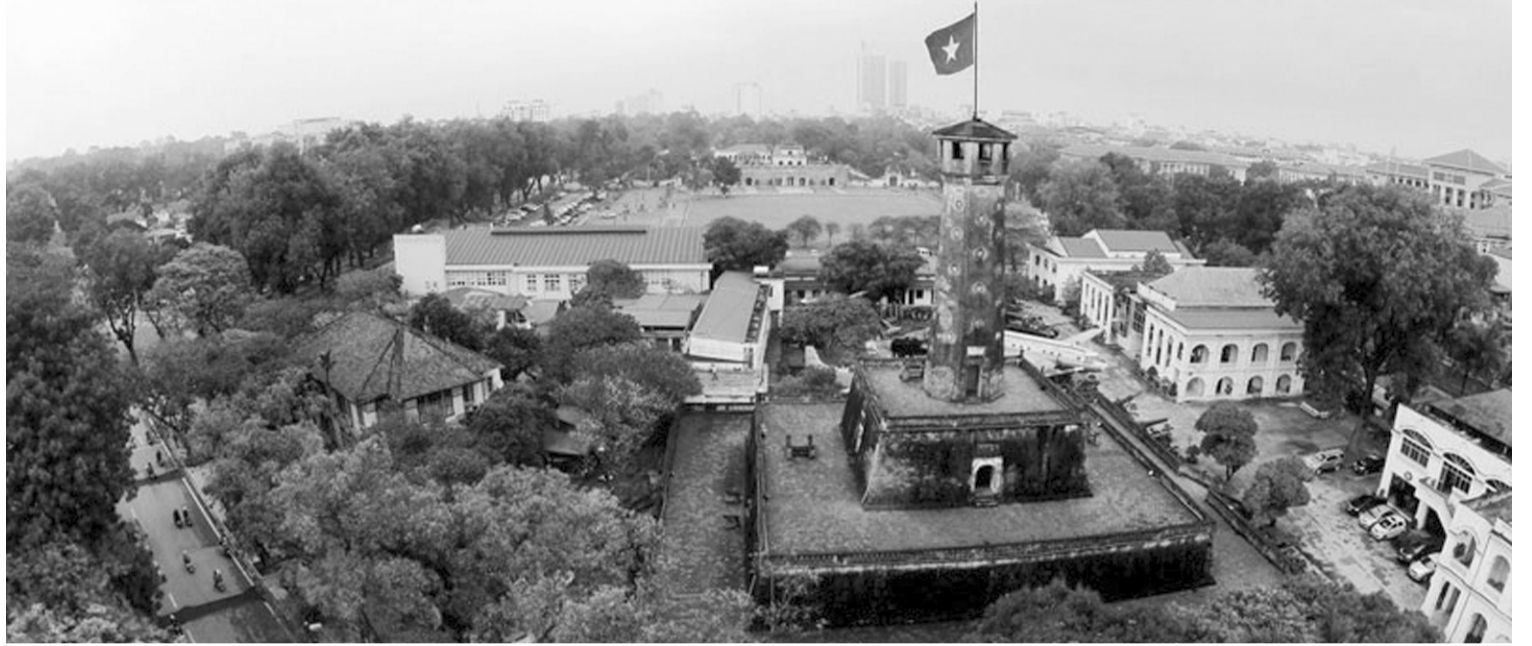
● Những thành tựu toàn diện mà Việt Nam đạt được sau 40 năm Đổi mới đã tạo dựng nền tảng vững chắc, đồng thời bác bỏ các quan điểm hoài nghi về tính khả thi của mục tiêu phát triển đất nước. (Ảnh minh họa: hanoimoi.vn)

Trên nền tảng phát triển ngày càng vững chắc, Việt Nam đang hội tụ đầy đủ các điều kiện cần thiết để bước vào giai đoạn phát triển mới với yêu cầu cao hơn và kỳ vọng lớn hơn. Từ hạ tầng chiến lược từng bước được hoàn thiện theo hướng đồng bộ, hiện đại, đến tăng trưởng kinh tế duy trì ổn định ở mức cao, cục diện đối ngoại không ngừng mở rộng..., khát vọng phát triển đất nước dần được hiện thực hóa bằng những kết quả cụ thể, thuyết phục.