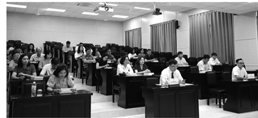
● Chứng chỉ chương trình bồi dưỡng công chức được cấp 1 lần cho học viên hoàn thành khóa bồi dưỡng sau khi kết thúc khóa bồi dưỡng.

Cơ quan An ninh điều tra thông báo ai là bị hại hoặc người liên quan đến vụ án do Đặng Thanh Hùng thực hiện, đề nghị liên hệ đơn vị để được hướng dẫn giải quyết. KIỀU DÃ