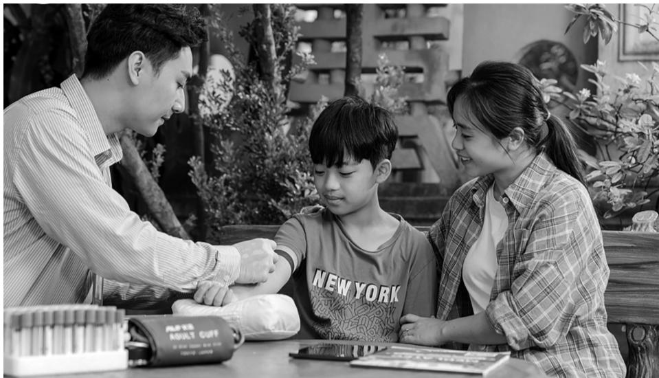
● Dịch vụ lấy mẫu xét nghiệm tận nơi của MEDLATEC mang giá trị nhân văn sâu sắc trong sứ mệnh phụng sự chăm sóc sức khỏe Nhân dân.

Trong kỷ nguyên công nghệ số bùng nổ, mọi nhu cầu thiết yếu của con người đều được "số hóa" để trở nên nhanh chóng, tiện lợi hơn. Trong đó, việc chăm sóc sức khỏe của người dân cũng bước sang một giai đoạn mới - đặt lịch xét nghiệm ngay tại nhà chỉ với vài thao tác đơn giản, nhanh tiện.