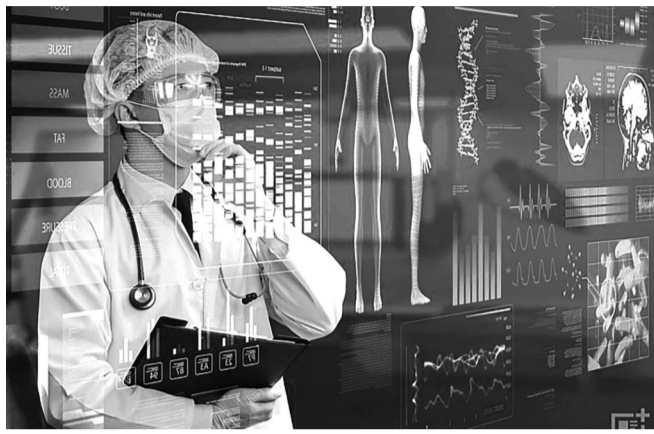
● Y học tái tạo - xu hướng công nghệ nổi bật đang định hình tương lai của y học hiện đại.

Trong bối cảnh ngành Y tế chuyển mình mạnh mẽ từ “chữa bệnh” sang “chăm sóc sức khỏe chủ động”, đổi mới sáng tạo không còn là xu hướng mà đã trở thành yêu cầu tất yếu. Việc ứng dụng công nghệ, thúc đẩy mô hình sáng tạo và tăng cường liên kết hệ sinh thái đã và đang mở ra hướng đi mới trên hành trình vì sức khỏe Nhân dân.