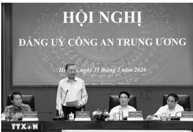
● Tổng Bí thư Tô Lâm phát biểu chỉ đạo tại Hội nghị.

Sáng 31/3, tại Hà Nội, Đảng ủy Công an Trung ương tổ chức Hội nghị để đánh giá các mặt công tác từ đầu năm đến nay và cho ý kiến về một số nội dung theo thẩm quyền. Tổng Bí thư Tô Lâm, Ủy viên Ban Thường vụ Đảng ủy Công an Trung ương dự và phát biểu chỉ đạo.