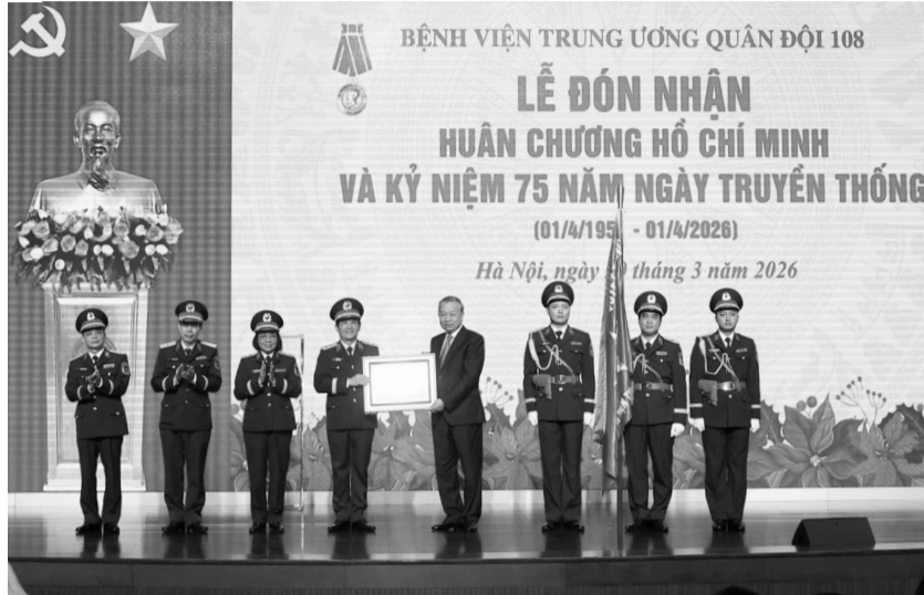
● Tổng Bí thư Tô Lâm trao Huân chương Hồ Chí Minh (lần 2) tặng Bệnh viện Trung ương Quân đội 108 vì có bề dày truyền thống, có công lao to lớn, đặc biệt xuất sắc trong sự nghiệp cách mạng của Đảng, của dân tộc.

Tổng Bí thư đề nghị Đảng ủy, Ban Giám đốc, các giáo sư, bác sĩ, các nhà khoa học và tập thể cán bộ thầy thuốc Bệnh viện Trung ương Quân đội 108 cần tiếp tục quán triệt sâu sắc quan điểm của Đảng về công tác bảo vệ, chăm sóc và nâng