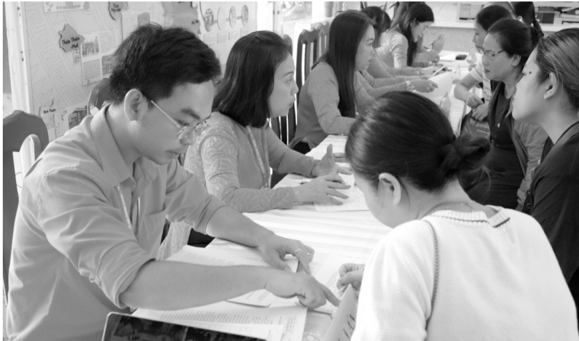
●Phụ huynh tìm hiểu thông tin tuyển sinh lớp 1 tại một trường tiểu học ở phường Bến Thành. (Ảnh: Bích Thanh)

UBND TP HCM vừa ban hành Kế hoạch huy động trẻ ra lớp và tuyển sinh vào các lớp đầu cấp năm học 2026 - 2027.