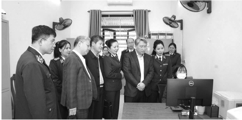
● Bộ trưởng Bộ Tư pháp Nguyễn Hải Ninh kiểm tra công tác ứng dụng công nghệ thông tin, chuyển đổi số tại Thi hành án dân sự tỉnh Lào Cai.

Nền tảng số THADS hiện đã hoàn tất kết nối, chia sẻ dữ liệu với Trung tâm dữ liệu quốc gia, bảo đảm tính liên thông và thông nhất với các cơ sở dữ liệu chuyên ngành phục vụ cho công tác xác