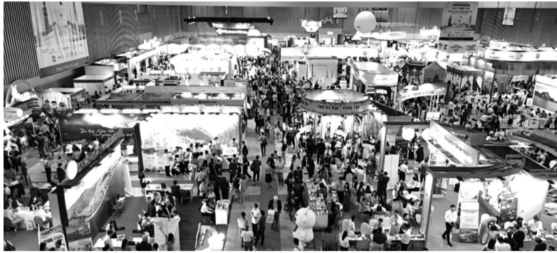
● Hội chợ Du lịch Quốc tế TP HCM (ITE HCMC) diễn ra sôi động, với nhiều gian hàng.

ngay. Tính thời điểm và sự độc đáo giúp kích thích nhu cầu du lịch, đặc biệt trong bối cảnh du khách ngày càng ưa chuộng trải nghiệm mới lạ. Đồng thời, sự kiện còn là cơ hội để nâng cấp hạ tầng, cải thiện dịch vụ và tăng cường liên kết vùng.