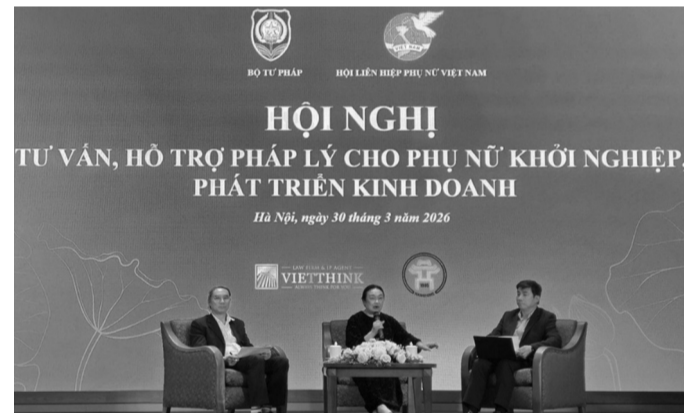
● Các chuyên gia tham gia phiên hỏi - đáp trực tiếp và trực tuyến tại Hội nghị. (Ảnh: PV)

Chiều 30/3, Bộ Tư pháp phối hợp với Hội Liên hiệp Phụ nữ Việt Nam tổ chức Hội nghị tập huấn “Tư vấn, hỗ trợ pháp lý cho phụ nữ khởi nghiệp, phát triển kinh doanh” với hình thức kết hợp trực tiếp và trực tuyến tới 5.000 điểm cầu trên toàn quốc.