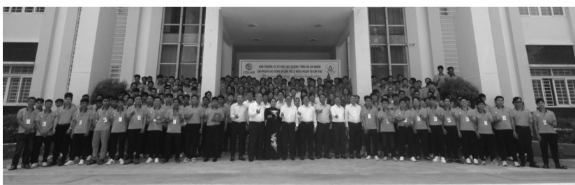
● Lễ khai trương cơ sở đào tạo Chương trình phi lợi nhuận cho người lao động đi làm việc ở nước ngoài tại Cần Thơ ngày 30/3. (Nguồn: TTXVN)

Theo thông tin từ Trung tâm Lao động ngoài nước (COLAB), Bộ Nội vụ, ngày 30/3, tại phường Vị Tân, thành phố Cần Thơ, COLAB phối hợp với Sở Nội vụ TP Cần Thơ tổ chức Lễ khai trương Cơ sở đào tạo Chương trình phi lợi nhuận cho người lao động đi làm việc ở nước ngoài và Khai giảng khóa đào tạo đầu tiên tại đây cho 186 người lao