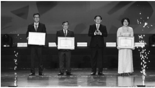
● Phó Thủ tướng Hồ Quốc Dũng trao tặng Bằng khen của Thủ tướng Chính phủ cho 3 nhà giáo xuất sắc.