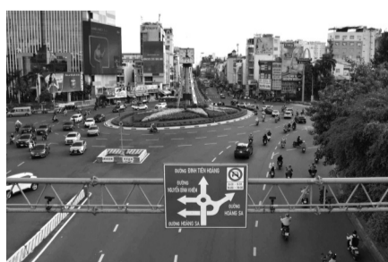
● Camera AI giám sát trước vòng xoay Điện Biên Phủ.

TP HCM sẽ ứng dụng trí tuệ nhân tạo (AI) để điều khiển đèn tín hiệu giao thông tại nhiều khu vực như trung tâm TP, cửa ngõ, thay vì các phương án điều khiển tại chỗ, truyền thống. Để thực hiện, một trong những công việc là cần sớm hoàn thiện hạ tầng camera giám sát. Thông tin được Sở Xây dựng TP HCM nêu trong công văn gửi Bộ Xây dựng và một số cơ quan liên quan