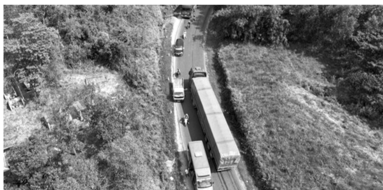
●Xe tải lưu thông trên QL49.

Mặc dù cơ quan chức năng đã cấm các biển báo cấm theo khung giờ cao điểm (5h - 7h, 11h - 14h, 17h - 19h), nhưng ngoài khung giờ cấm, lưu lượng phương tiện