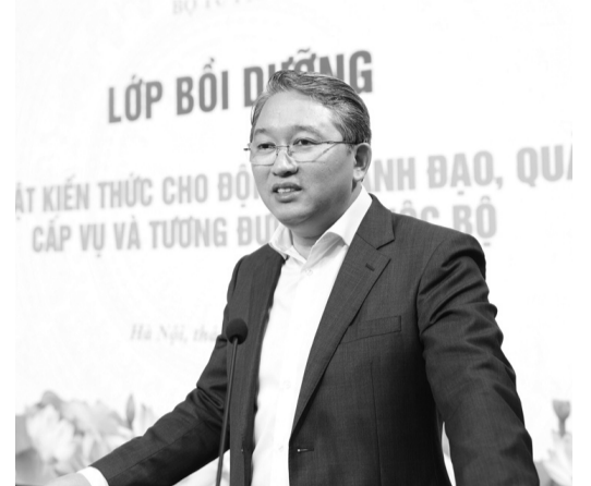
● Bộ trưởng Bộ Tư pháp Nguyễn Hải Ninh.