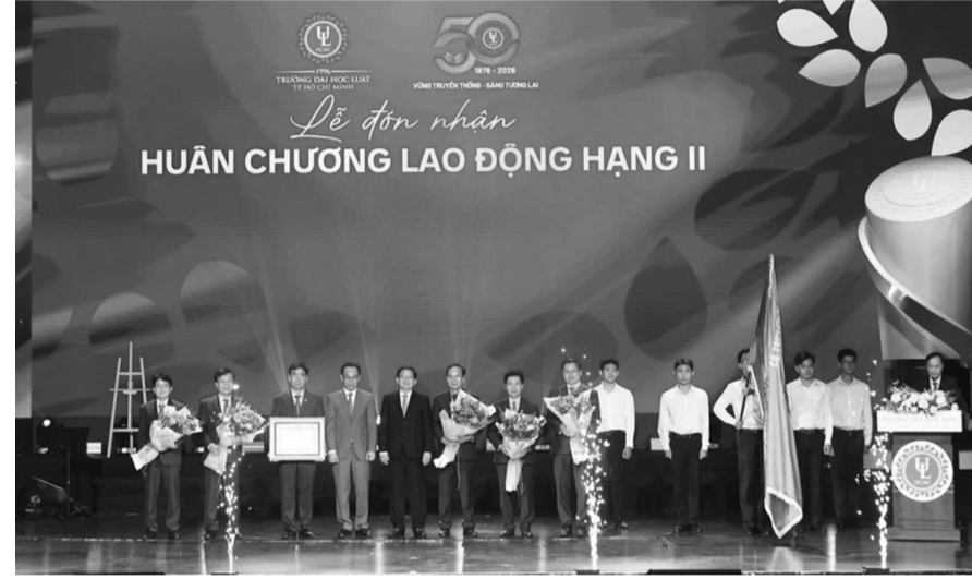
● Trường ĐH Luật TP HCM đón nhận Huân chương Lao động hạng Nhì.

Trong định hướng phát triển thời gian tới, TS Sơn cho rằng, đào tạo pháp lý không thể tách rời các lĩnh vực của đời sống hiện đại, đặc biệt trong bối cảnh chuyển đổi số và hội nhập: “Chúng tôi tin rằng, chỉ khi gắn kết tri thức pháp lý với các lĩnh vực kinh tế, công nghệ, quản trị và đời sống xã hội, nhà trường mới có thể đào tạo được