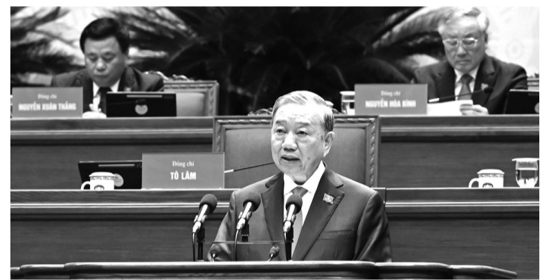
● Tổng Bí thư Tô Lâm nhấn mạnh, văn kiện được thông qua tại Đại hội XIV thực sự là kết tinh trí tuệ, ý chí, tư duy đổi mới, khát vọng vươn lên và quyết tâm rất lớn của toàn Đảng, toàn dân và toàn quân ta.

Trước những luận điệu xuyên tạc nhằm phủ nhận tính khả thi của các mục tiêu mà Đại hội XIV đề ra, yêu cầu đặt ra không chỉ là nhận diện rõ bản chất vấn đề, mà còn phải kiên quyết đấu tranh, phản bác bằng luận cứ khoa học và thực tiễn thuyết phục. Đây là nhiệm vụ cấp thiết trong bảo vệ nền tảng tư tưởng của Đảng, góp phần củng cố niềm tin và tăng cường sự đồng thuận xã hội.