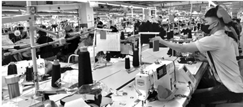
● Tiết kiệm năng lượng sẽ giúp doanh nghiệp tăng sức cạnh tranh, giảm áp lực lên mặt bằng giá sản phẩm.

Trong bối cảnh xung đột leo thang, thị trường năng lượng thế giới trải qua những kỳ tăng giá chưa từng thấy. Trong nước, giá xăng dầu bật tăng rất mạnh. Ngay lập tức, Thủ tướng Chính phủ đã ký ban hành Chỉ thị 09/CT-TTg ngày 19/3/2026 về việc tăng cường thực hiện tiết kiệm năng lượng (TKNL). Theo đó, sử dụng năng lượng tiết kiệm và hiệu quả được xác định là một trong những giải pháp quan trọng hàng đầu nhằm giảm thiểu rủi ro về nguồn cung năng lượng, giảm chi phí sản xuất, nâng cao hiệu quả và sức cạnh tranh của nền kinh tế, đồng thời góp phần bảo đảm vững chắc an ninh năng lượng quốc gia và phát triển bền vững.