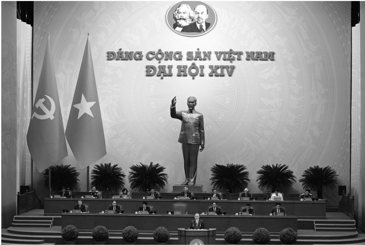
● Đại hội XIV của Đảng đã ra mục tiêu đến năm 2030 trở thành nước đang phát triển có công nghiệp hiện đại, thu nhập trung bình cao; hiện thực hóa tầm nhìn đến năm 2045 trở thành nước phát triển, thu nhập cao.