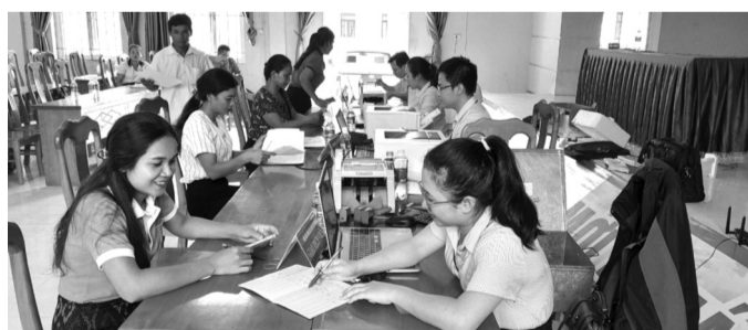
● Phiên giải ngân cho vay hộ đồng bào dân tộc thiểu số tại một xã vùng cao tỉnh Quảng Trị.

Các xã có doanh số cho vay lớn như: Xã Minh Hóa có doanh số cho vay 28.600 triệu đồng với 440 lượt hộ vay vốn; xã Kim Phú có doanh số cho vay 14.300 triệu đồng với 300 lượt hộ vay vốn. Đến cuối tháng 3 năm 2026, tổng dư nợ cho vay các chương trình tín dụng chính sách tại Phòng Giao dịch NHCSXH Minh Hóa, tỉnh Quảng Trị đạt 705.200 triệu đồng, tăng 29.820 triệu đồng so với đầu năm, tỷ lệ tăng trưởng 4,41%