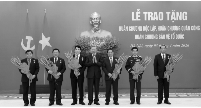
● Tổng Bí thư Tô Lâm trao Huân chương Độc lập hạng Nhất và Huân chương Quân công hạng Nhất tặng các đồng chí lãnh đạo, nguyên lãnh đạo Đảng, Nhà nước.

Chiều 3/4, tại Trụ sở Trung ương (TU) Đảng, Bộ Chính trị, Ban Bí thư đã tổ chức Lễ trao tặng Huân chương Độc lập, Huân chương Quân công, Huân chương Bảo vệ Tổ quốc cho các đồng chí lãnh đạo chủ chốt, lãnh đạo cấp cao của Đảng, Nhà nước, lãnh đạo các Bộ, ban, ngành TU, có thành tích đặc biệt xuất sắc trong sự nghiệp xây dựng và bảo vệ Tổ quốc. Tổng Bí thư Tô Lâm chủ trì buổi lễ.