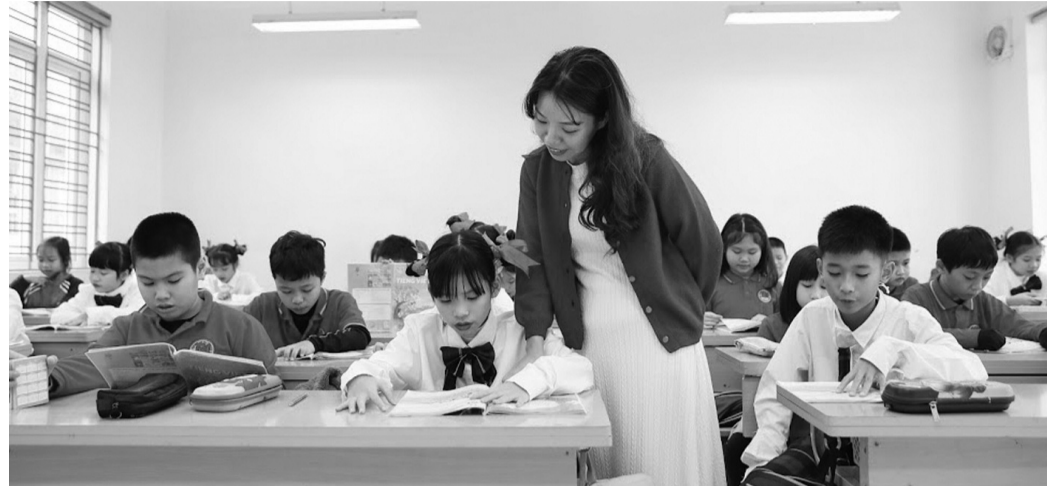
● Thi tuyển nhà giáo được thực hiện theo 2 vòng thi.

Chính phủ đã ban hành Nghị định 93/2026/NĐ-CP quy định chi tiết và hướng dẫn thi hành một số điều của Luật Nhà giáo; theo đó, đã quy định cụ thể các đối tượng được ưu tiên trong tuyển dụng nhà giáo, trong đó có 2 nhóm được cộng 5 điểm vào kết quả vòng 2.