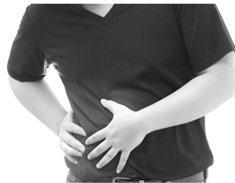
● Khi xuất hiện dấu hiệu đau bụng, người dân nên đi khám ngay để có chẩn đoán xác định chính xác.