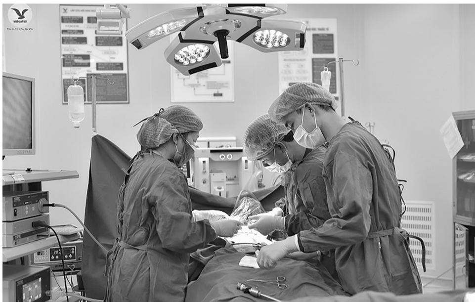
● Chuyên khoa Ngoại, Bệnh viện Đa khoa MEDLATEC là địa chỉ tin cậy thực hiện điều trị hiệu quả bệnh lý đa chuyên khoa.