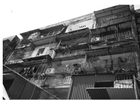
● Một CCC tại Hải Phòng.

Quá trình thực hiện, TP sẽ điều chỉnh, phân bổ số lượng nhà, phương án hỗ trợ tái định cư tùy theo thực tế và nguyện vọng đăng ký của người dân. Hải Phòng chủ