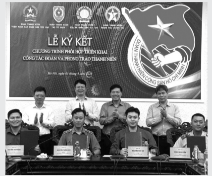
● Dưới sự chứng kiến của Lãnh đạo các cơ quan, Đoàn Thanh niên bốn cơ quan ký Chương trình phối hợp triển khai công tác Đoàn và phong trào thanh niên giai đoạn 2026 - 2030.