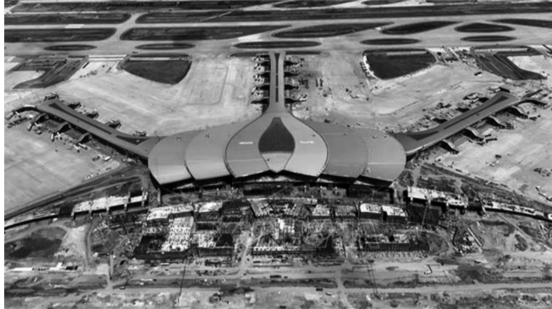
● Cảng hàng không quốc tế Long Thành đang trong thời gian hoàn tất các hạng mục để đưa vào vận hành thương mại dự kiến cuối năm 2026.

Sân bay Long Thành giai đoạn 1 có 2 đường cất hạ cánh, cuối năm 2025 đường cất hạ cánh thứ nhất đã đón các chuyến bay kỹ thuật. Đường cất hạ cánh thứ 2 nhà