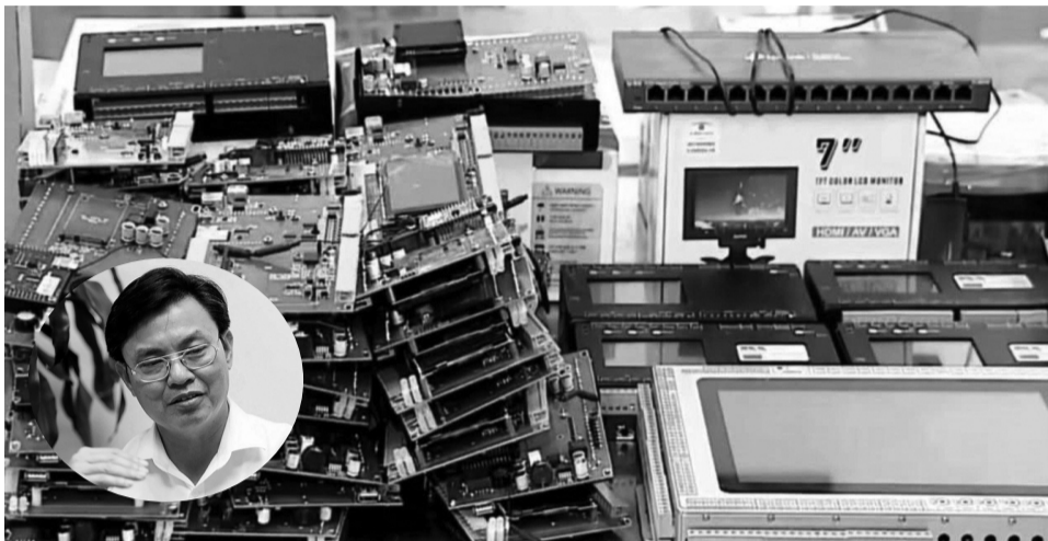
● Đối tượng Thức và một số tang vật trong vụ án can thiệp, chỉnh sửa số liệu QTMT.

Bộ Nông nghiệp và Môi trường (NN&MT) vừa có văn bản đề nghị UBND các tỉnh, thành chỉ đạo các Sở NN&MT, cơ quan liên quan khẩn trương tổ chức rà soát, kiểm tra các hệ thống quan trắc nước thải, khí thải tự động, liên tục trên địa bàn.