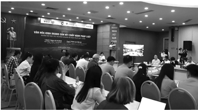
● Hội thảo “Văn hóa kinh doanh gắn với chấp hành pháp luật” hỗ trợ HKD kê khai, nộp thuế quý I năm 2026. (Ảnh trong bài: PV)