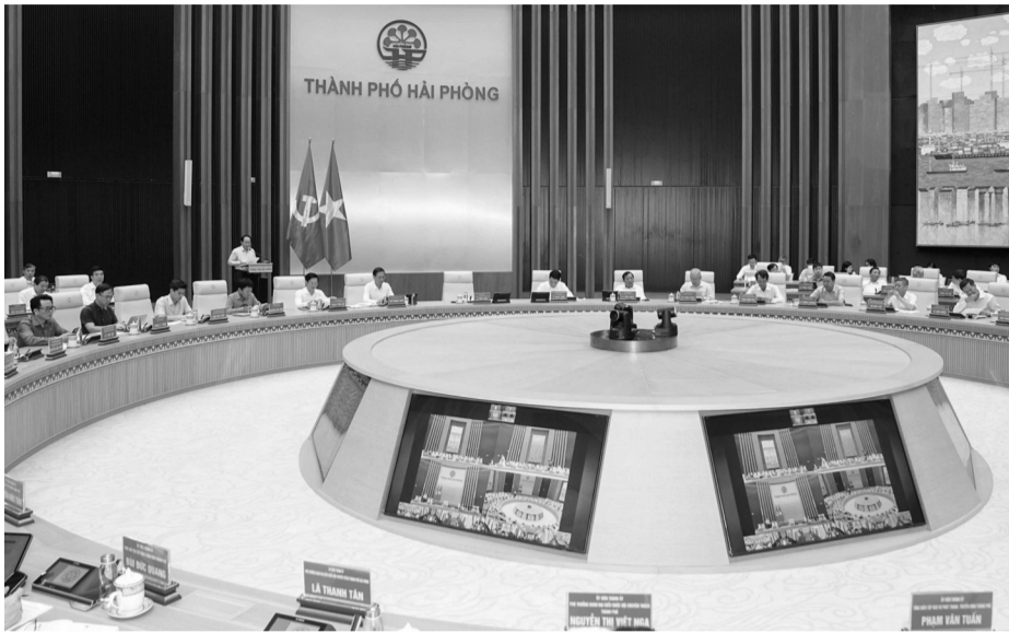
● Quang cảnh Hội nghị.

Về các nhiệm vụ cụ thể, Bí thư Thành ủy cũng cơ bản thống nhất với các hạn chế, tồn tại cũng như các nhiệm vụ, giải pháp trọng tâm quý II và các nhiệm vụ tiếp theo năm 2026 theo Báo cáo và phát biểu của các đại biểu dự Hội nghị. Đồng thời đề nghị tập trung hoàn thiện Kế hoạch đầu tư công trung hạn giai đoạn 2026 - 2030; Đảng ủy UBND TP khẩn trương rà soát toàn bộ danh mục dự án, hạch toán kinh tế - xã hội rõ ràng, bảo đảm hiệu quả sử dụng vốn, khả năng lan tỏa, dẫn dắt tăng trưởng; sắp xếp thứ tự ưu tiên rõ ràng, tập trung nguồn lực cho các dự án tạo động lực, các đột phá chiến