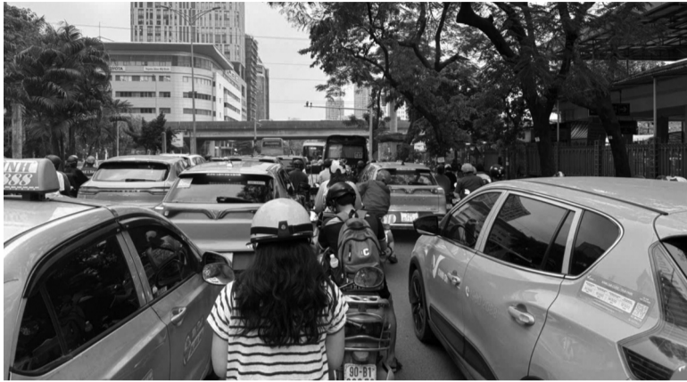
● Giải pháp căn cơ, toàn diện về giao thông đô thị bền vững là yếu tố quan trọng cho các đô thị đáng sống.

Trong bối cảnh đô thị hóa nhanh và áp lực hạ tầng ngày càng gia tăng, giao thông bền vững là một “chiếc chìa khóa” mở ra tương lai cho các thành phố đáng sống. Không chỉ dừng lại ở việc xây dựng các tuyến metro, cách tiếp cận mới đang đặt trọng tâm vào việc tái cấu trúc không gian đô thị, huy động nguồn lực quốc tế và thúc đẩy hợp tác đa phương nhằm tạo ra hệ sinh thái giao thông hiện đại, xanh và hiệu quả.