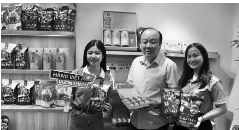
● Trứng gà và gà leo SaDu được trưng bày, giới thiệu tại “Sức sống hàng Việt” số 4 do Cục Quản lý và Phát triển thị trường trong nước tổ chức.

Chương trình được tổ chức theo hướng kết hợp đa kênh, gắn kết giữa trưng bày, bán hàng trực tiếp với hoạt động livestream trên nền tảng số, qua đó tăng cường kết nối cung - cầu, mở rộng hệ thống phân phối và đưa sản phẩm Việt đến gần hơn với người tiêu dùng. Đây cũng là giải pháp góp phần nâng cao năng lực cạnh tranh của doanh nghiệp trong nước, thúc đẩy