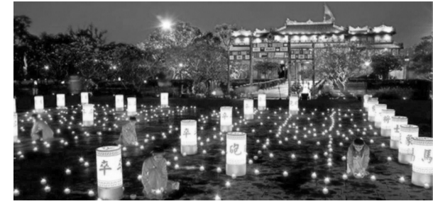
●Hoàng thành Huế trong một sự kiện văn hóa tổ chức vào ban đêm.

Không chỉ khu vực trung tâm sông Hương, nhiều không gian di sản của Huế cũng đang được tính toán khai thác theo hướng kết hợp bảo tồn với phát triển kinh tế đêm.