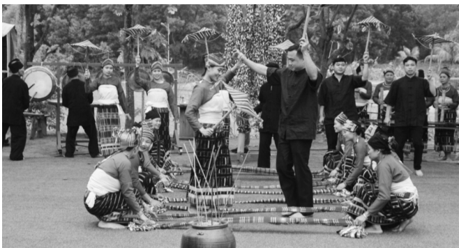
● Cần xây dựng cơ chế phối hợp giữa chính quyền và cộng đồng địa phương trong việc gìn giữ và phát huy giá trị văn hóa du lịch. (Ảnh: chinphu.vn)

Trong bối cảnh du lịch ngày càng phát triển mạnh mẽ và trở thành nhu cầu phổ biến của xã hội, văn hóa ứng xử của mỗi cá nhân nơi công cộng đang trở thành một vấn đề đáng quan tâm. Những va chạm giữa du khách và không gian văn hóa bản địa thời gian qua cho thấy, bên cạnh sự gia tăng về số lượng, chất lượng nhận thức và hành vi trong hoạt động du lịch vẫn còn nhiều khoảng trống. Điều này đặt ra yêu cầu cấp thiết phải nâng cao văn hóa ứng xử trong cộng đồng, nhằm xây dựng môi trường du lịch văn minh, tôn trọng và bền vững.