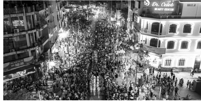
● TP Huế kỳ vọng các dự án kinh tế đêm sẽ thu hút du khách, góp phần phát triển dịch vụ và kinh tế địa phương. (Ảnh: T.Nhung)

Thế nhưng, hoạt động tại đây chủ yếu phục vụ nhu cầu của người dân địa phương, trong khi những sản