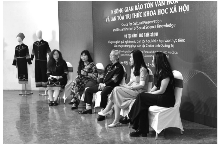
● Tọa đàm “Ứng dụng kết quả nghiên cứu dân tộc học - nhân học vào thực tiễn: Câu chuyện trang phục dân tộc Chứt ở Quảng Trị” tại Lễ khai mạc trưng bày.