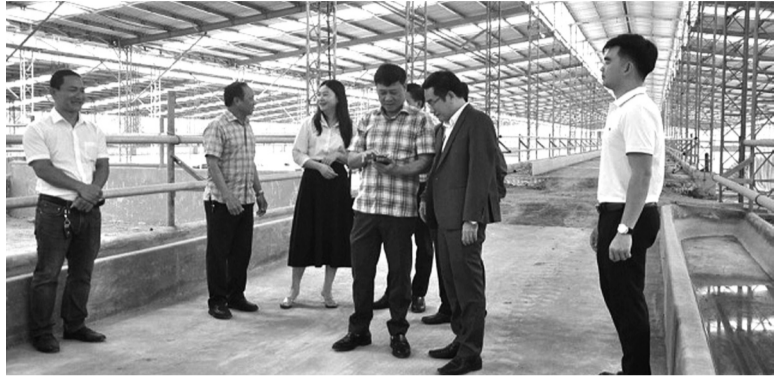
● Lãnh đạo xã Hoàn Lão tham quan mô hình vỗ béo bò tại Công ty Cổ phần Chăn nuôi Dương Gia Quảng Bình.