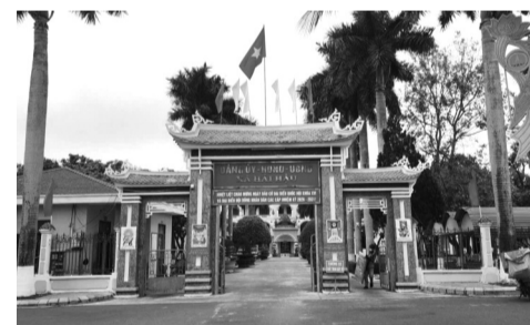
● Trụ sở UBND xã Hải Hậu.