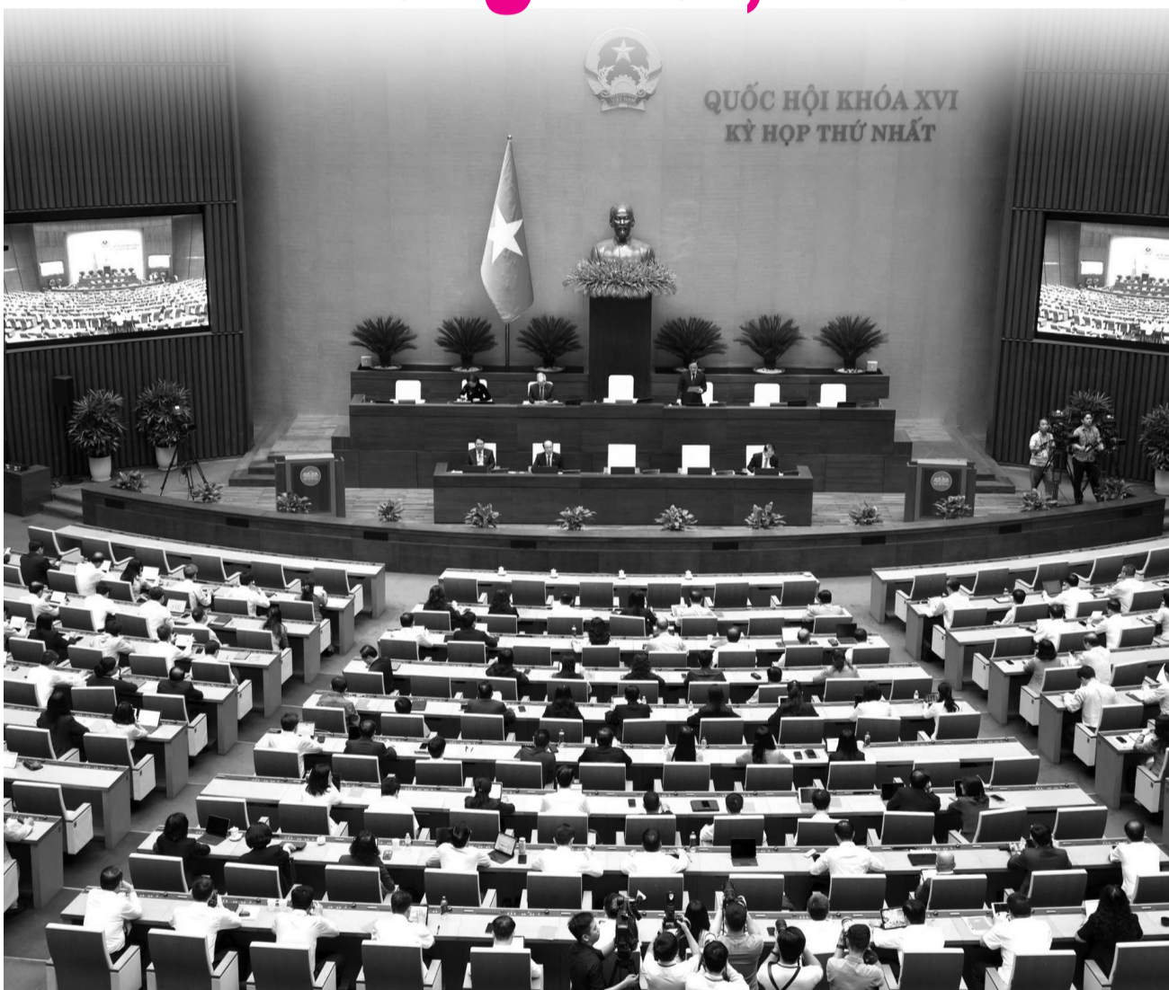
● Quang cảnh Phiên thảo luận tại Hội trường về 3 dự án Luật do Bộ Tư pháp chủ trì soạn thảo.

Cuối tuần qua, Quốc hội thảo luận tại hội trường về 3 dự án Luật do Bộ Tư pháp chủ trì soạn thảo, gồm dự án Luật Hộ tịch (sửa đổi), dự án Luật sửa đổi, bổ sung một số điều của Luật Công chứng; dự án Luật sửa đổi, bổ sung một số điều của Luật Trợ giúp pháp lý.