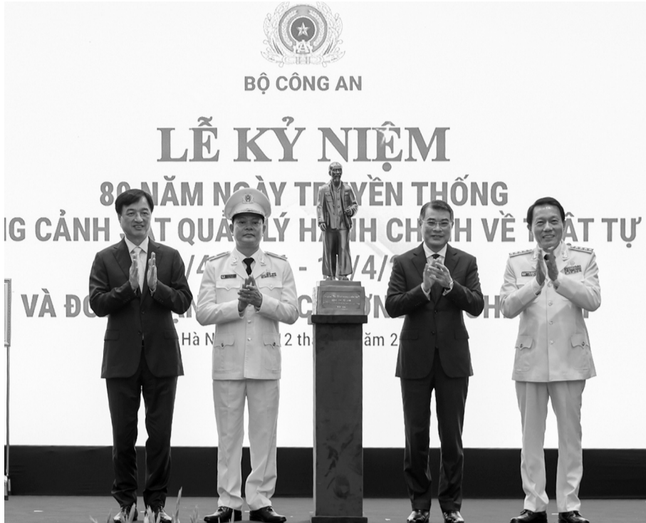
● Thủ tướng Chính phủ Lê Minh Hưng; Trưởng Ban Tổ chức Trung ương Nguyễn Duy Ngọc; Bộ trưởng Bộ Công an Lương Tam Quang trao bức tượng "Bác Hồ về thăm quê" - quà của Tổng Bí thư, Chủ tịch nước Tô Lâm tặng lực lượng Cảnh sát Quản lý hành chính về trật tự xã hội.