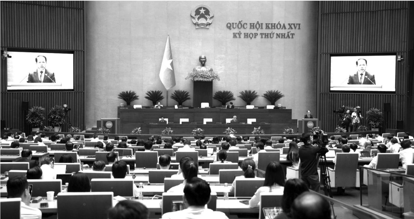
● Quang cảnh phiên thảo luận tại hội trường về dự thảo Nghị quyết.

Quốc hội vừa thảo luận tại hội trường về dự thảo Nghị quyết về cơ chế phối hợp, chính sách đặc thù nhằm nâng cao hiệu quả phòng ngừa và giải quyết tranh chấp đầu tư quốc tế. Cuối phiên họp, Bộ trưởng Bộ Tư pháp Hoàng Thanh Tùng đã giải trình những vấn đề mà đại biểu Quốc hội (ĐBQH) quan tâm.