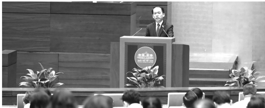
● Bộ trưởng Bộ Tư pháp Hoàng Thanh Tùng giải trình, làm rõ thêm ý kiến đại biểu Quốc hội nêu.

Sáng 12/4, Quốc hội (QH) thảo luận ở hội trường về dự án Luật Thủ đô (sửa đổi). Qua thảo luận, các đại biểu bày tỏ tán thành với việc sửa đổi Luật Thủ đô, trao cho Hà Nội cơ hội lịch sử để TP hiện thực hóa những khát vọng phát triển trong kỷ nguyên mới.