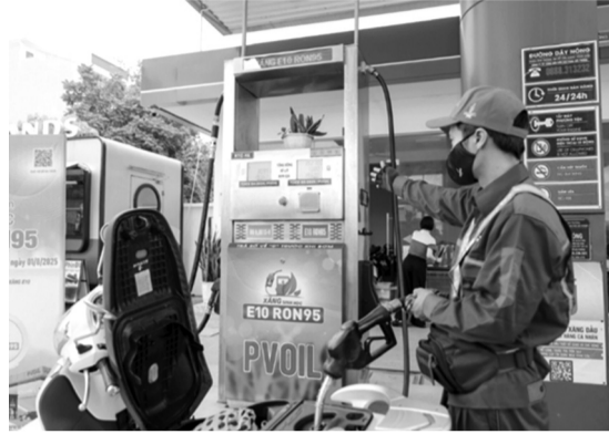
● Xăng E10 sẽ được triển khai bán trên toàn quốc từ ngày 30/4/2026. (Ảnh: XH)

Đây cũng là lộ trình mà Bộ Công Thương đang muốn đẩy nhanh. Theo đó, Bộ này đang thực hiện lấy ý kiến dự thảo sửa Thông tư 50, nhằm đề xuất đẩy sớm lộ trình áp dụng tỷ lệ phối trộn nhiên liệu sinh học và truyền thống. Theo dự thảo,