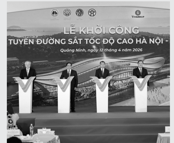
● Thủ tướng Lê Minh Hưng và các đại biểu thực hiện nghi thức khởi công tuyến đường sắt tốc độ cao Hà Nội - Quảng Ninh.

Sáng 12/4, tại Quảng Ninh, Thủ tướng Lê Minh Hưng dự Lễ khởi công dự án tuyến đường sắt tốc độ cao Hà Nội - Quảng Ninh. Dự kiến hoàn thành vào cuối năm 2028, với tốc độ thiết kế tối đa lên tới 350km/h, công trình sẽ giúp rút ngắn thời gian di chuyển giữa 2 địa phương xuống 5 - 7 lần, chỉ còn khoảng 23 phút.