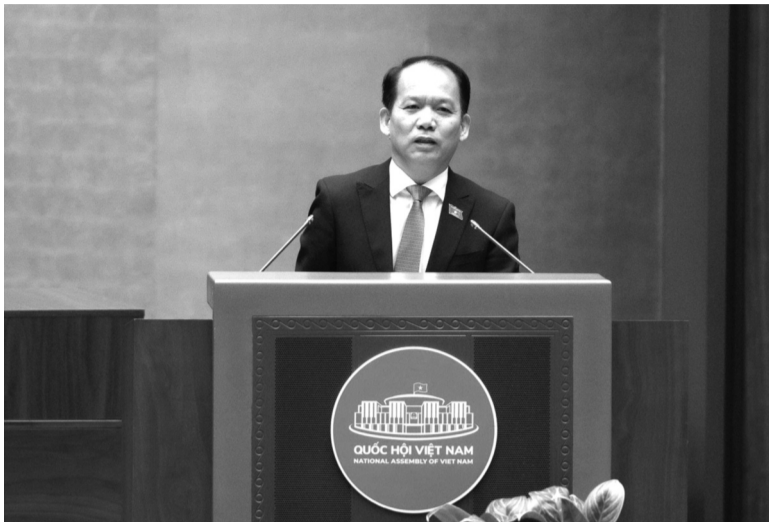
● Bộ trưởng Bộ Tư pháp Hoàng Thanh Tùng giải trình về 3 dự án Luật.