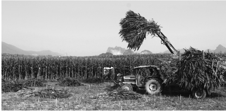
● Ngô sinh khối được thu hoạch, bó gọn tại ruộng, nhanh chóng đưa về trạm cân, phục vụ chuỗi liên kết chăn nuôi.

Không còn cảnh phơi bắp ngoài sân hay thấp thỏm chờ giá hạt ngô lên xuống, những ngày này, trên các cánh đồng ở xã Tuyên Bình và xã Nam Trạch, tỉnh Quảng Trị, nông dân tất bật thu hoạch cánh đồng cây ngô. Những bó ngô xanh được cắt sát gốc ngay tại ruộng để máy vận chuyển lên xe đưa về các trang trại chăn nuôi trâu, bò. Câu chuyện tưởng chừng giản đơn ấy lại là một bước chuyển đáng chú ý trong tư duy sản xuất nông nghiệp của người dân Quảng Trị.