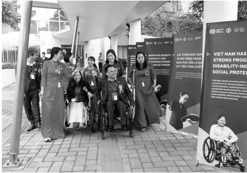
● NKT tham dự Lễ kỷ niệm Ngày quốc tế NKT tháng 12/2025 do ILO, Liên minh Hợp tác xã Việt Nam phối hợp tổ chức.