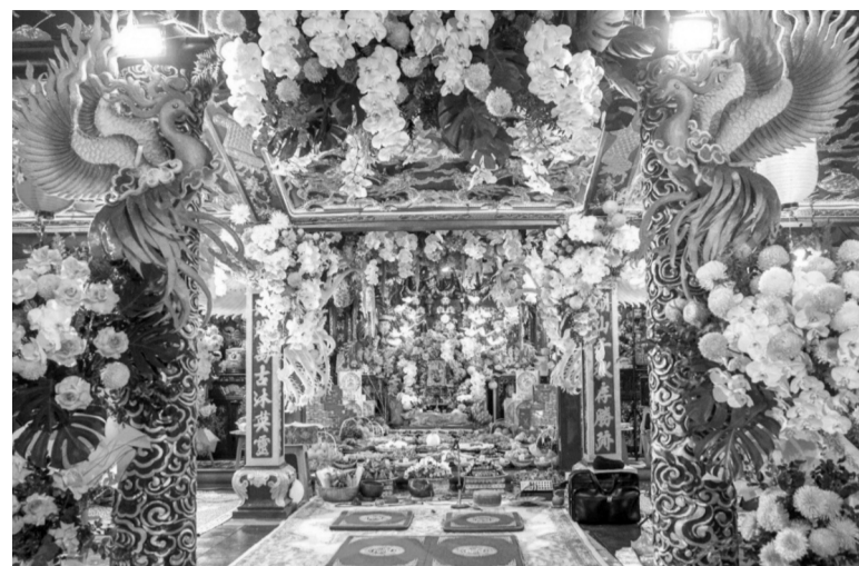
● Bàn Đền Cô Bé Ngai Vàng.