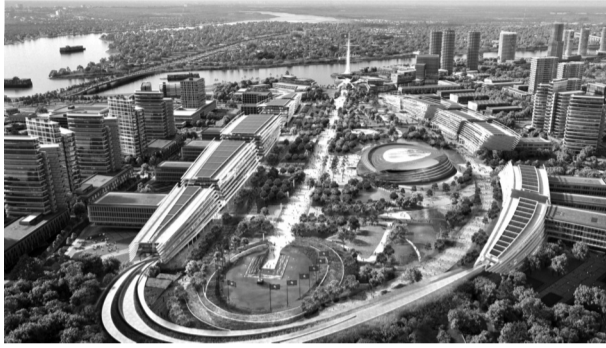
● Quy hoạch khu trung tâm của Trung tâm hành chính - chính trị Đồng Nai.

Hôm qua (12/4), Quốc hội thống nhất điều chỉnh chương trình Kỳ họp thứ Nhất, bổ sung nội dung dự thảo Nghị quyết của Quốc hội về việc thành lập TP Đồng Nai trực thuộc Trung ương (TW). Dự kiến tại đợt 2 của Kỳ họp, ngày 20 - 23/4, Quốc hội sẽ xem xét, thông qua Nghị quyết này.