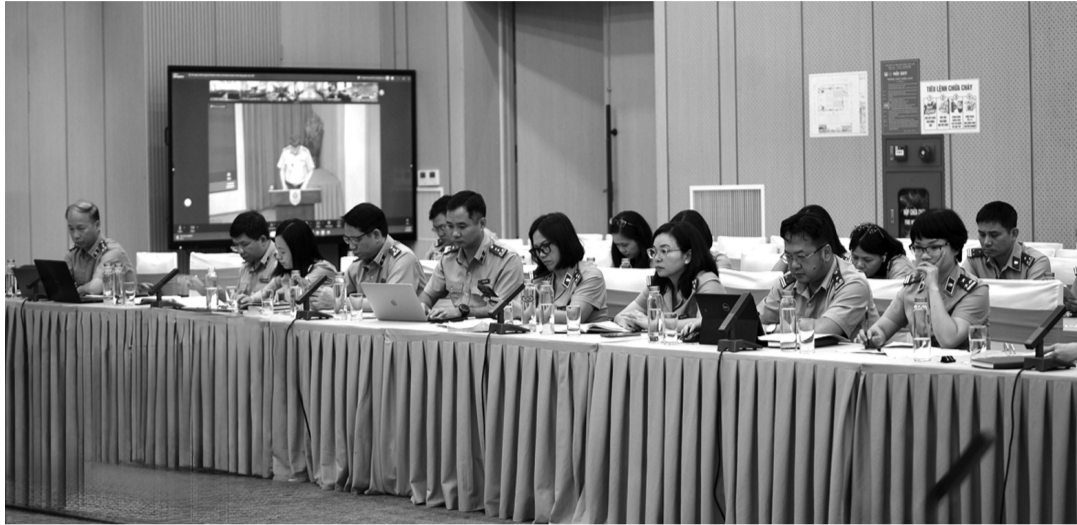
● Cán bộ Cục Quản lý THADS tại Hội nghị sơ kết công tác THADS 6 tháng đầu năm 2026.

Phần lớn công chức THADS có bản lĩnh chính trị vững vàng, ý thức chấp hành pháp luật và tinh thần trách nhiệm cao trong công việc. Thực tế cho thấy, nhiều Chấp hành viên đã xử lý thành công các vụ việc phức tạp, có giá trị