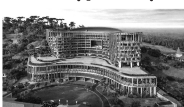
● Phối cảnh dự kiến dự án Trung tâm Hội nghị, Thương mại và Du lịch quốc tế Hải Phòng.

Dự án Trung tâm Hội nghị, Thương mại và Du lịch quốc tế Hải Phòng được triển khai trên