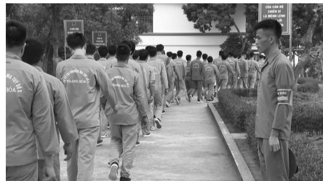
● Tại các cơ sở cai nghiện ma túy Thanh Hóa đều áp dụng mô hình “Học viên tự giác - cùng tiến bộ”.

PCMT giai đoạn 2025 - 2030, mục tiêu xây dựng xã, phường không ma túy, tiến tới trở thành tỉnh không ma túy vào năm 2030. Công an tỉnh tiếp tục triển khai nhiều giải pháp như xây dựng “phòng tuyến 3 lớp”, lấy phòng ngừa là gốc, ngăn chặn từ sớm, từ xa, từ bên kia biên giới; rà soát, quản lý chặt người nghiện, người sử dụng trái phép chất ma