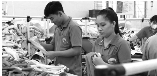
● GRDP bình quân đầu người tại Đồng Nai năm 2025 đạt hơn 150 triệu đồng.