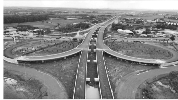
● Hệ thống hạ tầng giao thông tại Đồng Nai ngày càng được hoàn thiện.

Trước đó ngày 25/3, Hội nghị TW 2 khóa 14 đã thống nhất chủ trương thành lập TP Đồng Nai trực thuộc TW. Chính phủ sau đó ban hành nghị quyết thông qua hồ sơ đề án lập 10 phường thuộc tỉnh Đồng Nai, giao Bộ Nội vụ hoàn thiện thủ tục trình Quốc hội thành lập TP Đồng Nai trực thuộc TW.