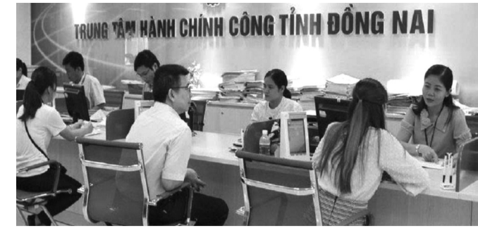
● Môi trường đầu tư kinh doanh tại Đồng Nai được đánh giá ngày càng đơn giản, thuận lợi.