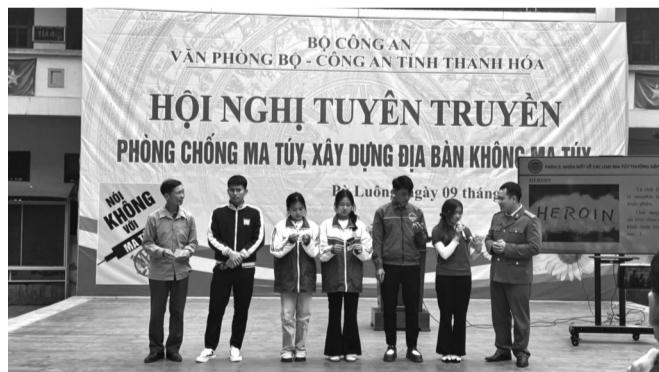
● Công an tỉnh Thanh Hóa phối hợp tổ chức tuyên truyền PCMT tại xã Pù Luông.