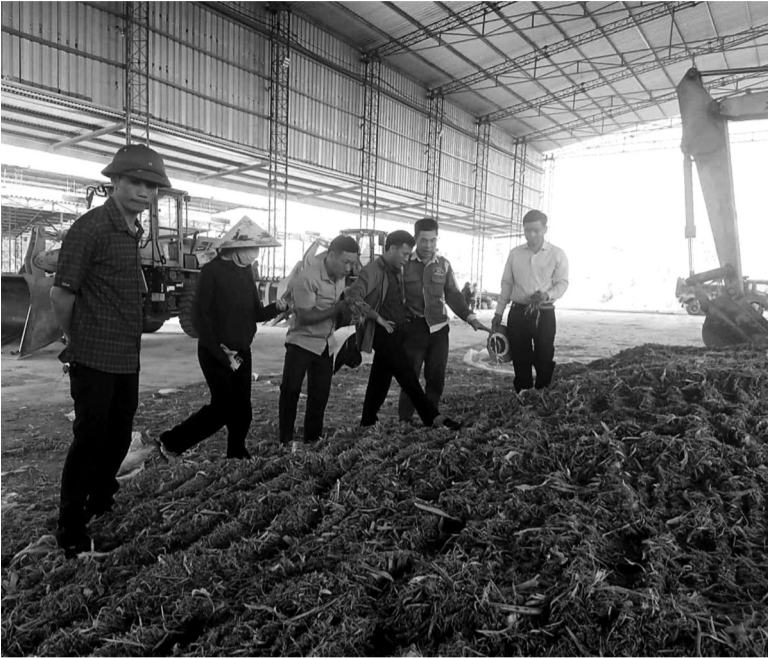
● Chính quyền địa phương phối hợp doanh nghiệp kiểm tra, thu mua ngô sinh khối, góp phần ổn định đầu ra cho nông dân.