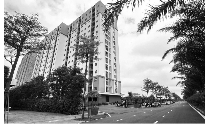
● Một dự án NOXH đã hoàn thiện và mở bán các căn hộ cho người dân sử dụng.

Trong 12 dự án NOXH độc lập có khoảng 12.752 căn, trong đó 3 dự án đã hoàn thành đưa vào sử dụng với 1.712 căn, ba dự án đang triển khai xây dựng, với 1.634 căn và 6 dự án đã được chấp thuận chủ