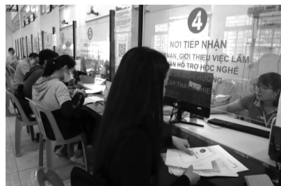
● Người lao động làm thủ tục hưởng trợ cấp thất nghiệp tại Trung tâm dịch vụ việc làm TP HCM.

Một điểm mới đáng chú ý là chính sách hỗ trợ tiền ăn cho người lao động trong quá trình học nghề. Từ ngày 1/1/2026, người lao động tham gia học nghề được hỗ trợ chi