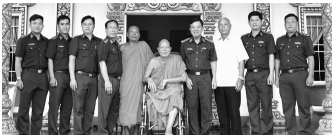
● Đoàn công tác BĐBP tỉnh Cà Mau chụp ảnh lưu niệm cùng chư tăng, sư sãi chùa Xiêm Cán.