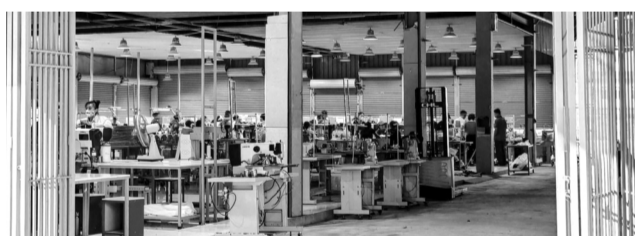
● Bên trong dự án chợ nay được sử dụng làm nhà xưởng.

Thực tế, sau khi hoàn thành và đưa vào hoạt động từ năm 2020, khu chợ không thu hút được tiểu thương. Hiện ngoài