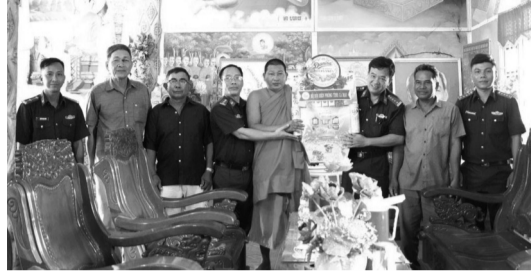
● Đoàn công tác BĐBP tỉnh Cà Mau thăm hỏi, tặng quà chúc Tết Chôl Chnăm Thmây tại chùa Serey Vongsa Kos Thmây (xã Vĩnh Hậu).

Nhân dịp Tết cổ truyền Chôl Chnăm Thmây năm 2026 của đồng bào Khmer, ngày 13/4, Ban Chỉ huy Bộ đội Biên phòng (BĐBP) tỉnh Cà Mau đã tổ chức các đoàn công tác đến thăm, chúc Tết đồng bào Khmer tại chùa Xiêm Cán (phường Hiệp Thành) và chùa Serey Vongsa Kos Thmây (xã Vĩnh Hậu), thể hiện sự quan tâm, gắn bó giữa lực lượng Biên phòng với đồng bào các dân tộc trên địa bàn biên giới.