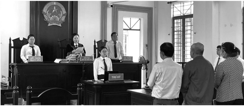
● Vụ án được TAND khu vực 16 - TP HCM xét xử.

Sau thời gian nghị án kéo dài, ngày 13/4, TAND khu vực 16 - TP HCM đã tuyên án sơ thẩm vụ án “Trốn thuế” và “Không chấp hành án” xảy ra tại Cty CP Tân Tân (phường Đông Hòa, TP HCM).