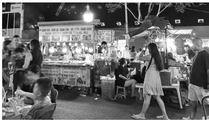
● Tăng cường kiểm soát nguy cơ ngộ độc thực phẩm trong hoạt động kinh doanh thức ăn đường phố. (Ảnh: PV)

Liên tiếp các vụ nghi ngộ độc thực phẩm thời gian gần đây đang gióng lên hồi chuông cảnh báo về an toàn thực phẩm. Trước thực trạng đáng lo ngại, các địa phương cùng Ban Chỉ đạo liên ngành Trung ương về an toàn thực phẩm đã và đang triển khai đồng bộ nhiều giải pháp nhằm tăng cường công tác thanh tra, kiểm tra, giám sát, xử lý nghiêm các vi phạm.