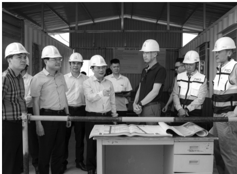
●Đoàn công tác Bộ Xây dựng kiểm tra một dự án NOXH tại TP Huế.

Hiện tại, nguồn cung NOXH chỉ mới đáp ứng được khoảng 30% nhu cầu thực tế của người dân trên địa bàn. Mục tiêu ngắn hạn trong thời gian tới, TP sẽ đưa ra thị trường khoảng 2.000 căn và dự kiến sẽ tiêu thụ hết nhanh chóng. TP đang đánh giá tổng thể các dự án, tiến hành rà soát và lựa chọn các quỹ đất thuận lợi để tập trung phát triển NOXH.