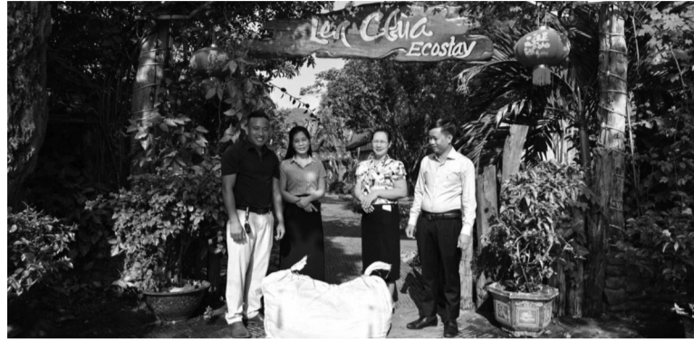
● Chính quyền địa phương trực tiếp xuống cơ sở, tìm giải pháp tiêu thụ nông sản cho người dân trong những ngày cao điểm nắng nóng.

Từ sự kết nối của chính quyền, nhiều cơ sở như Khu du lịch Suối Đá, Lèn Chùa Ecostay,