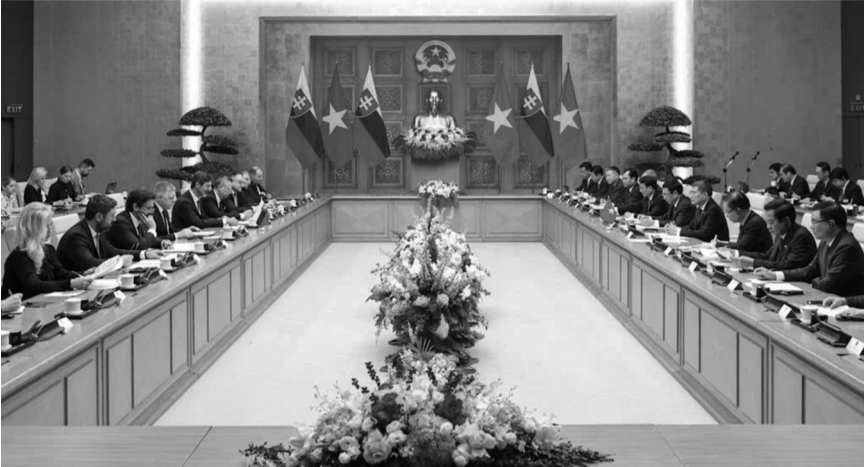
● Thủ tướng Chính phủ Lê Minh Hưng và Thủ tướng Robert Fico hội đàm.

Ngày 13/4, tại trụ sở Chính phủ, sau Lễ đón chính thức trọng thể Thủ tướng Chính phủ Cộng hòa Slovakia Robert Fico thăm chính thức Việt Nam, Thủ tướng Chính phủ Lê Minh Hưng và Thủ tướng Robert Fico đã tiến hành hội đàm.