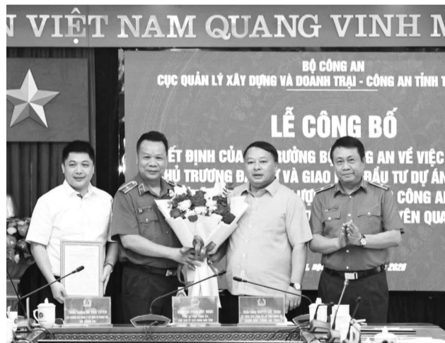
● Đại diện Bộ Công an trao Quyết định phê duyệt và tặng hoa chúc mừng địa phương cùng chủ đầu tư.