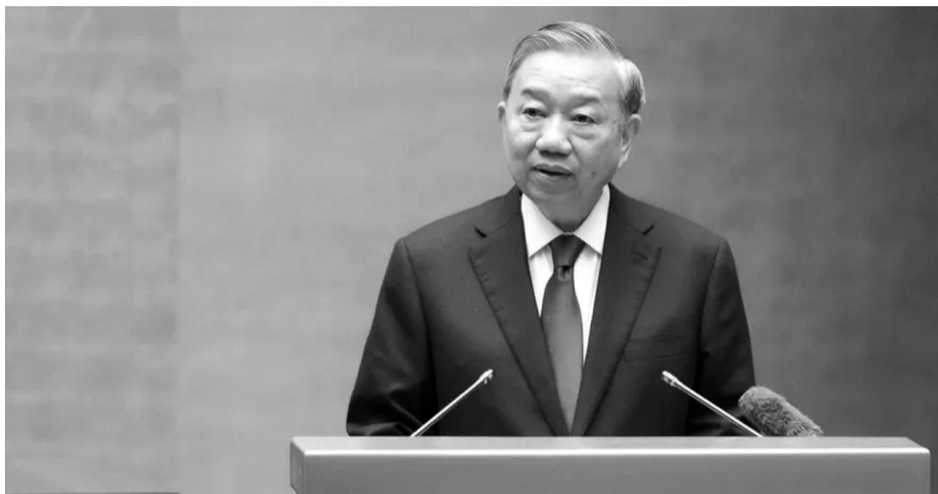
● Tổng Bí thư, Chủ tịch nước Tô Lâm phát biểu chỉ đạo Hội nghị.

Đặc biệt, phải coi trọng việc khơi thông vốn của Nhân dân, xem đây là đột