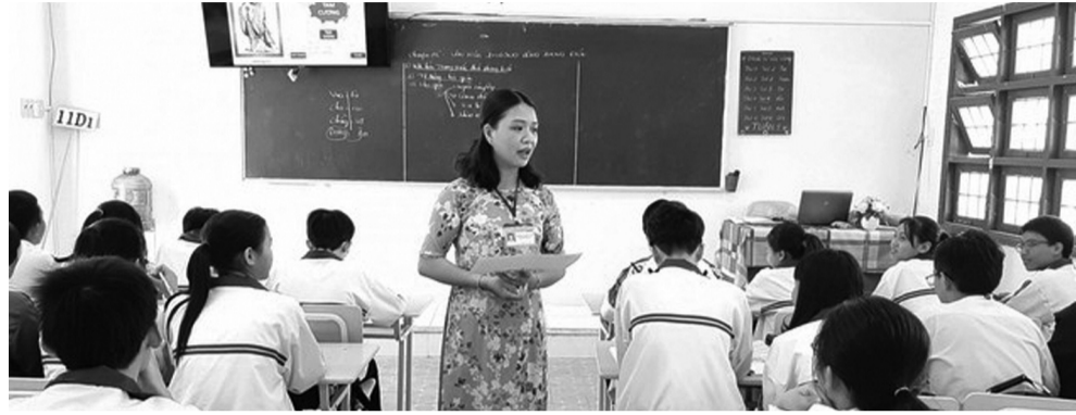
● Ảnh minh họa.

Giáo viên giảng dạy môn Tiếng dân tộc thiểu số phải đáp ứng trình độ chuẩn được đào