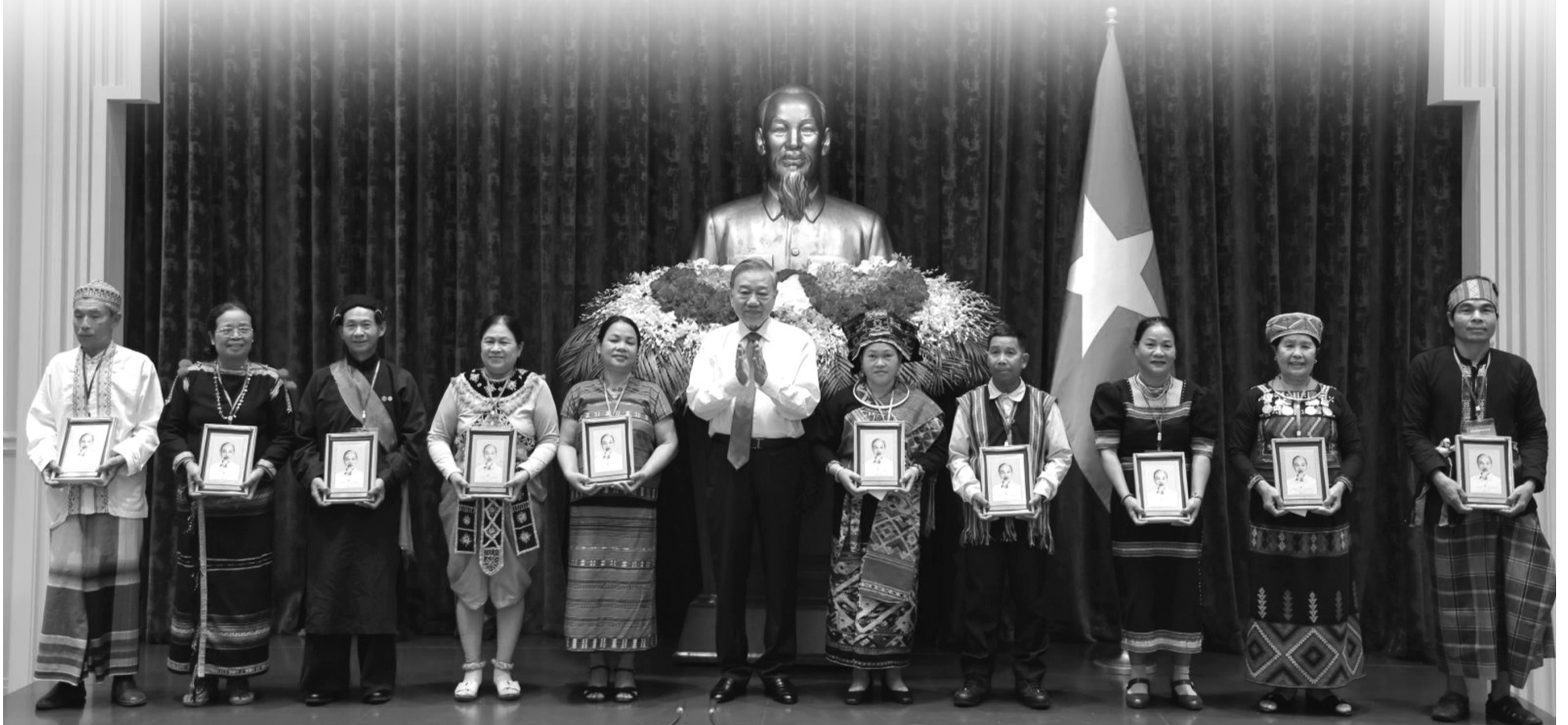
● Tổng Bí thư, Chủ tịch nước Tô Lâm tặng chân dung Chủ tịch Hồ Chí Minh cho các già làng, trưởng bản, nghệ nhân, người có uy tín tiêu biểu toàn quốc.

Tinh thần trên được Tổng Bí thư, Chủ tịch nước Tô Lâm nhấn mạnh khi phát biểu tại buổi tiếp các già làng, trưởng bản, nghệ nhân, người có uy tín tiêu biểu toàn quốc, nhân Ngày Văn hóa các dân tộc Việt Nam (19/4), diễn ra cuối tuần qua tại Hà Nội.