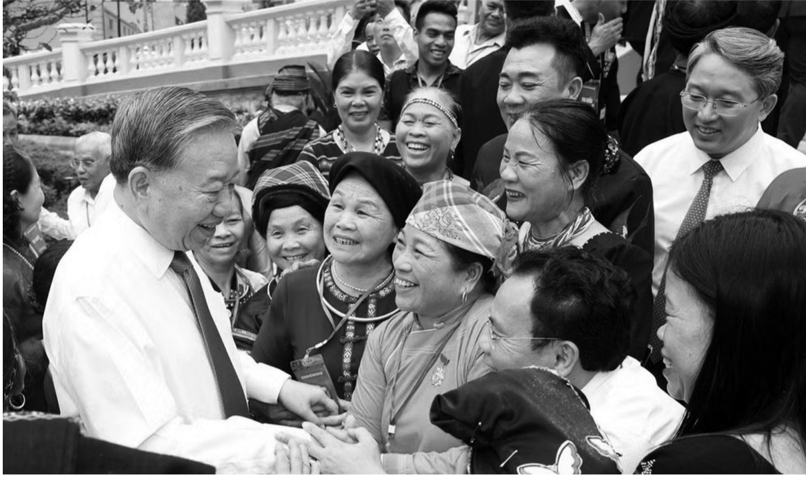
● Tổng Bí thư, Chủ tịch nước Tô Lâm với các già làng, trưởng bản, nghệ nhân, người có uy tín tiêu biểu toàn quốc.

Tinh thần trên được Tổng Bí thư, Chủ tịch nước Tô Lâm nhấn mạnh khi phát biểu tại buổi tiếp các già làng, trưởng bản, nghệ nhân, người có uy tín tiêu biểu toàn quốc, nhân Ngày Văn hóa các dân tộc Việt Nam (19/4), diễn ra cuối tuần qua tại Hà Nội.