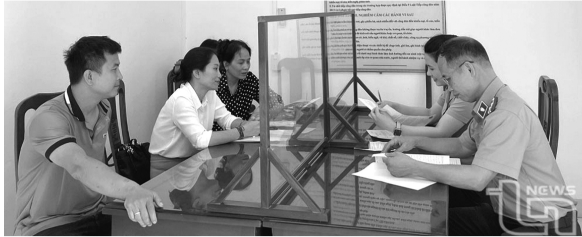
● Cán bộ THADS Thái Nguyên tiếp dân.

Để tập trung chỉ đạo giải quyết các vụ việc khiếu nại, tố cáo phức tạp, kéo dài, ngày 18/10/2024, Tổng cục trưởng Tổng cục THADS (nay là Cục trưởng Cục Quản lý THADS) đã ban hành Quy trình giải quyết các vụ việc được xác định là vụ việc khiếu nại, tố cáo phức tạp, kéo dài. Theo đó, định kỳ hàng tháng, hàng quý cơ quan THADS tỉnh, thành phố phải thực hiện rà soát, tổng hợp danh sách các vụ việc khiếu nại, tố cáo phức tạp, kéo dài; báo cáo kết quả thực hiện và đề xuất các phương án giải quyết các vụ việc. Trên cơ sở đó, Cục Quản lý THADS xem xét, đánh giá, chỉ đạo giải quyết dứt điểm các vụ việc.