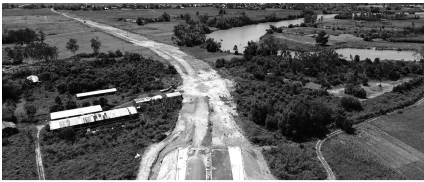
● Một cây cầu xây xong vẫn chưa thể sử dụng vì thiếu đường dẫn.

Còn có thể kể đến cầu Quảng Đà nối xã Hòa Tiến với phường Điện Bàn Bắc, tổng vốn 274 tỷ đồng, thông xe kỹ thuật từ tháng 3/2025, nhưng đến nay đường dẫn phía nam chưa hoàn thiện.