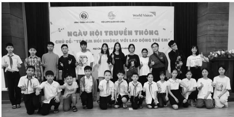
Trẻ em Đà Nẵng được trang bị kiến thức về phòng, chống bạo lực, nói không với bạo lực trẻ em.