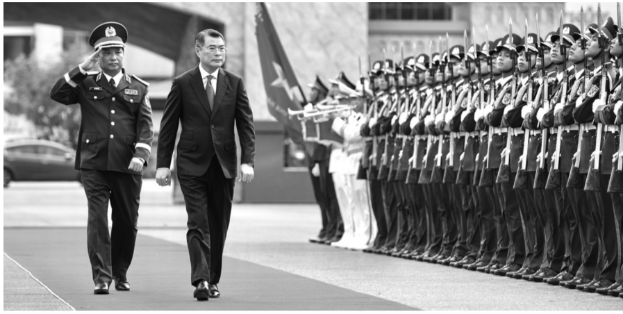
● Thủ tướng Chính phủ Lê Minh Hưng đến dự Lễ đón nhận danh hiệu Anh hùng Lực lượng vũ trang nhân dân của Quân khu 4.