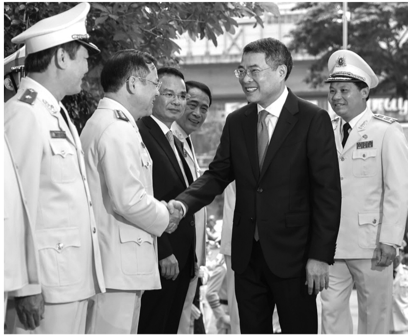
● Thủ tướng Chính phủ Lê Minh Hưng đến dự Lễ kỷ niệm 80 năm Ngày truyền thống lực lượng Cảnh sát hình sự, Bộ Công an.

Cuối tuần qua, phát biểu tại Lễ kỷ niệm 80 năm Ngày truyền thống lực lượng Cảnh sát hình sự, Bộ Công an (18/4/1946 - 18/4/2026) và đón nhận Huân chương Hồ Chí Minh, Thủ tướng Chính phủ Lê Minh Hưng khẳng định, lực lượng Cảnh sát hình sự đã viết nên bản hùng ca bằng sự tuyệt đối trung thành với Đảng, Nhà nước, tận tụy phụng sự Tổ quốc, phục vụ Nhân dân; vượt qua mọi khó khăn, gian khổ, hoàn thành mọi nhiệm vụ được giao, lập nhiều chiến công, thành tích đặc biệt xuất sắc.