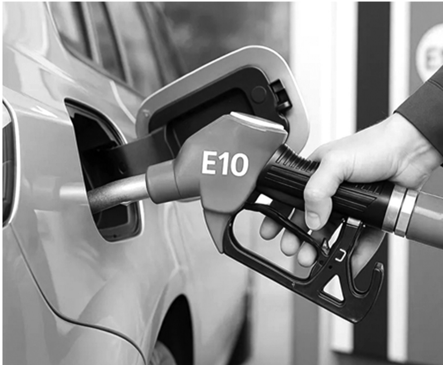
● Việc sử dụng xăng E10 không có khác biệt so với xăng khoáng.

Ông Đào Duy Anh - Phó Cục trưởng Cục Đồi mới sáng tạo, Chuyên đổi xanh và Khuyến công (Bộ Công Thương) cũng cho rằng, việc thay đổi thói quen tiêu dùng với những mặt hàng tiêu dùng quen thuộc sẽ tạo ra tâm lý e ngại bước đầu. “Thực chất, từ khi thử nghiệm dùng xăng E10 tại Việt Nam, các lãnh đạo ở Bộ Công Thương, PVOIL, Petrolimex là những người tiên phong, gương mẫu thực hiện. Chúng tôi đã ghi nhận về tình hình thực tế khi