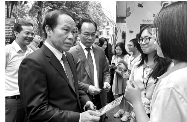
● Phó Thủ tướng Chính phủ Lê Tiến Châu nghe giới thiệu về Dự án Fresh Taste áp dụng công nghệ vào gia vị lên men tự nhiên.

Dự và phát biểu tại Ngày hội Khởi nghiệp quốc gia của học sinh, sinh viên lần thứ VIII diễn ra sáng 18/4 tại Học viện Ngân hàng, Phó Thủ tướng Chính phủ Lê Tiến Châu nhấn mạnh, khởi nghiệp học sinh, sinh viên phải chuyển từ phong trào sang thực chất, từ ý tưởng sang sản phẩm, từ nhà trường ra thị trường.