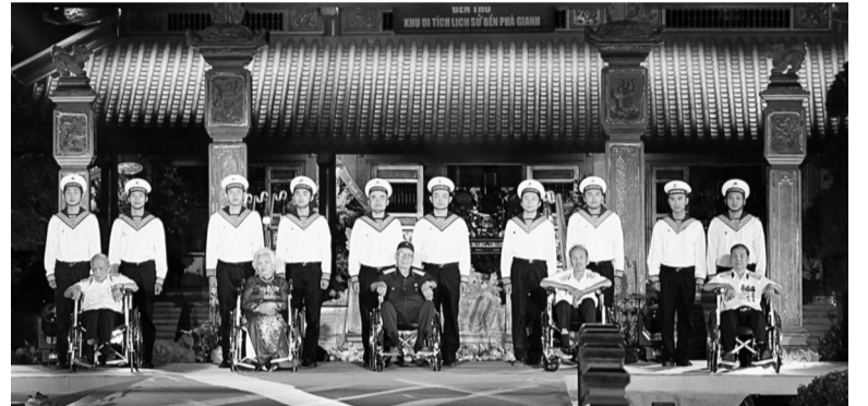
● Chương trình có sự hiện diện của các anh hùng lực lượng vũ trang nhân dân, các nhân chứng lịch sử, cựu chiến binh.

“Bản hùng ca trên sông” là lời tri ân sâu sắc dành cho những thế hệ cán bộ, chiến sĩ, thanh niên xung phong, dân quân và Nhân dân đã anh dũng chiến đấu, hy sinh tại khu vực phà Gianh - cảng Gianh trong suốt 9 năm làm nhiệm vụ chi viện cho tiền tuyến và chống chiến tranh phá hoại miền Bắc của đế quốc Mỹ, giai đoạn 1964 - 1973. Bến phà Gianh, tỉnh Quảng Trị từng là trọng điểm đánh phá ác liệt, nơi hàng ngàn cán bộ, chiến sĩ và người dân đã anh dũng hy sinh với tinh thần “xe chưa qua, nhà không tiếc; đường chưa thông, không tiếc máu xương”. Những mất mát ấy đã hun đúc nên giá trị lịch sử và chiều sâu tâm linh cho vùng đất này.