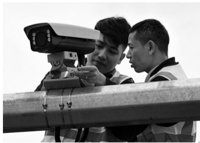
● Lắp đặt camera sử dụng trí tuệ nhân tạo tại Hà Nội.

TP dự kiến giai đoạn 2 (1/1/2027 - 31/12/2027) mở rộng khu vực thí điểm tại phường Hoàn Kiếm và Cửa Nam, gồm vùng lõi phường Hoàn Kiếm đã thực hiện ở giai đoạn 1 và 14 tuyến phố bao quanh thuộc phường Cửa Nam: Nguyễn Du, Hàn Thuyên, Trần Hưng Đạo, Trần Khánh Dư, Trần Quang Khải, Trần Nhật Duật, Hàng Đậu, Cửa