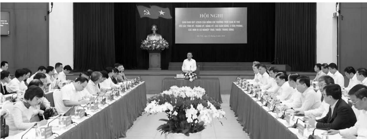
● Thường trực Ban Bí thư Trần Cẩm Tú đề nghị Đảng ủy Quốc hội, Đảng ủy Chính phủ phối hợp chặt chẽ, đẩy nhanh soạn thảo các văn bản theo thẩm quyền để ban hành.

Hôm qua (23/4), tại Hà Nội, Ủy viên Bộ Chính trị, Thường trực Ban Bí thư Trần Cẩm Tú đã chủ trì giao ban quý I/2026 với các tỉnh ủy, thành ủy, đảng ủy, các ban đảng, 4 văn phòng, các đơn vị sự nghiệp trực thuộc Trung ương.