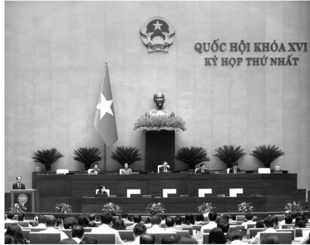
● Tiếp tục Kỳ họp thứ Nhất, chiều 23/4, Quốc hội khóa XVI biểu quyết thông qua nhiều luật, nghị quyết quan trọng, trong đó có 6 luật, nghị quyết do Bộ Tư pháp được giao chủ trì soạn thảo.

Chiều 23/4, Quốc hội (QH) biểu quyết thông qua nhiều luật, nghị quyết quan trọng, trong đó có 6 luật, nghị quyết do Bộ Tư pháp được giao chủ trì soạn thảo, bao gồm: Luật Tiếp cận thông tin (sửa đổi); Luật Thủ đô (sửa đổi); Luật Hộ tịch (sửa đổi); Luật sửa đổi, bổ sung một số điều của Luật Công chứng; Luật sửa đổi, bổ sung một số điều của Luật Trợ giúp pháp lý; Nghị quyết của QH về cơ chế phối hợp, chính sách đặc thù nâng cao hiệu quả phòng ngừa và giải quyết tranh chấp đầu tư quốc tế.