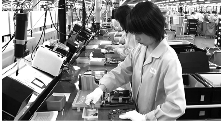
● Hoạt động xuất nhập khẩu của Hà Nội ghi nhận một số điểm tích cực.

Trong bối cảnh thương mại toàn cầu nhiều biến động và áp lực tăng trưởng ngày càng lớn, TP Hà Nội đang tập trung tháo gỡ các “điểm nghẽn”, hỗ trợ doanh nghiệp (DN) nâng cao năng lực cạnh tranh và thúc đẩy xuất khẩu theo hướng bền vững, thích ứng với yêu cầu mới của thị trường quốc tế.