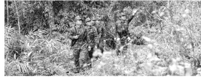
● BDBP Thanh Hóa tuần tra, kiểm soát, nắm chắc địa bàn.

Thanh Hóa có đường biên giới dài, tiếp giáp với Lào, địa hình rừng núi hiểm trở, nhiều đường mòn, lối mờ. Đây là điều kiện để tội phạm ma túy lợi dụng hoạt động, hình thành các đường dây vận chuyển xuyên quốc gia với thủ đoạn ngày càng tinh vi, liêu lĩnh. Thực tế cho thấy, khu vực ngoại biên vẫn tiềm ẩn nguy cơ phức tạp, tình trạng tái trồng cây thuốc phiện còn xảy ra; trong khi đó, nội biên, nhất là tuyến biên giới đất liền, TPMT diễn biến khó lường. Trước tình hình này, Bộ đội Biên phòng (BDBP) Thanh Hóa đã chủ động xây dựng kế hoạch, xác lập chuyên án phù hợp từng địa bàn, triển khai đồng bộ các biện pháp nghiệp vụ, tăng cường bám nắm địa bàn, quản lý chặt đối tượng. Với phương châm "chủ động phòng ngừa, kiên quyết đấu tranh", nhiều chuyên án lớn đã được triệt phá thành công, góp phần ngăn chặn hiệu quả nguồn ma túy thâm lậu qua biên giới. Trong năm 2025, BDBP Thanh Hóa đã đấu tranh thành công 4 chuyên án lớn, triển khai 13 kế hoạch nghiệp vụ; bắt giữ 231 vụ/272 đối tượng, thu hơn 11,5kg heroin cùng hàng chục nghìn viên ma túy tổng hợp. Nhiều đường dây vận chuyển ma túy liên tỉnh, xuyên quốc gia bị bóc gỡ, góp phần giữ vững an ninh trật tự khu vực biên giới. Cùng với đấu tranh, BDBP chú trọng công tác tuyên truyền, vận động Nhân dân tham gia phòng, chống ma túy thông qua các mô hình "tự quản đường biên, mốc giới", "bản không ma túy". Qua đó, nâng cao nhận thức, xây dựng "thế trận lòng dân" vững chắc, phòng ngừa tội phạm từ sớm, từ xa.