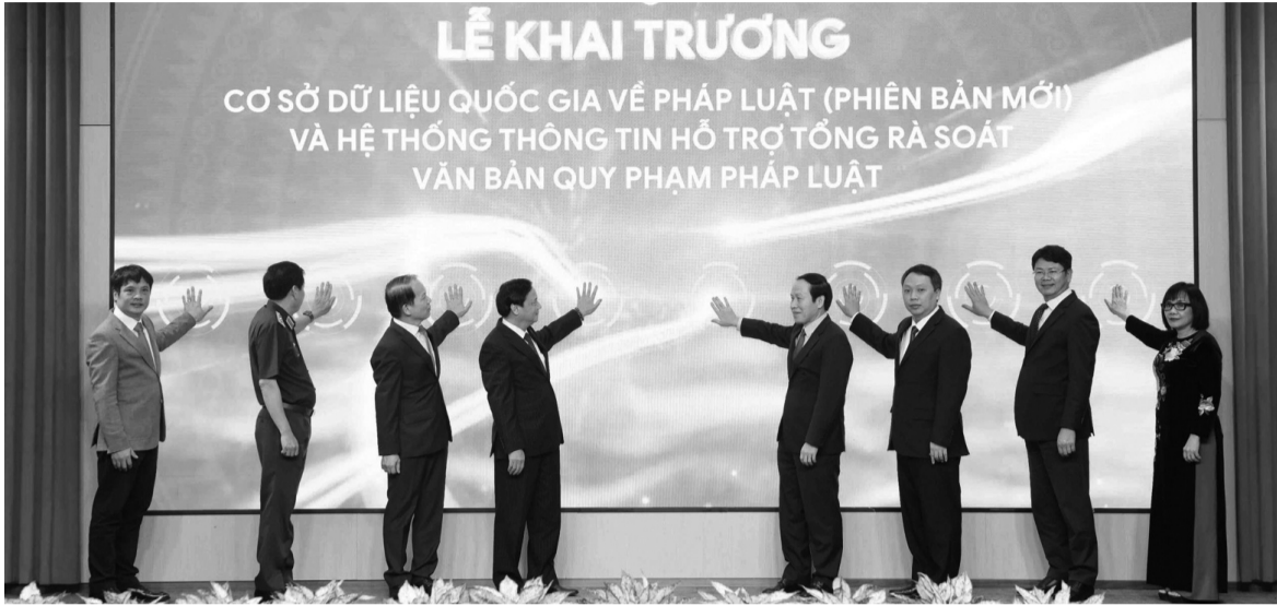
● Các đại biểu thực hiện nghi thức bấm nút khai trương CSDLQGPL (phiên bản mới) và Hệ thống thông tin hỗ trợ tổng rà soát VBQPPL.