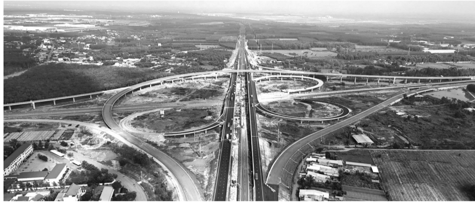
● Nút giao cao tốc Biên Hòa - Vũng Tàu và cao tốc TP HCM - Long Thành - Dầu Giây. (Ảnh: B.Yên)

Ban Quản lý dự án 85 (BQLDA 85, Bộ Xây dựng) vừa có văn bản gửi UBND tỉnh, Phòng Cảnh sát giao thông (CSGT) Công an Đồng Nai về việc hỗ trợ phân luồng, điều tiết giao thông khi đưa vào khai thác tuyến chính cao tốc dự án thành phần (DATP) 2, cao tốc Biên Hòa - Vũng Tàu giai đoạn 1.