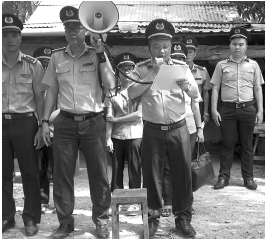
● Chấp hành viên Phòng THADS KV13 - An Giang tổ chức cưỡng chế THA.

Đặc biệt, tính chất phức tạp của án tham nhũng, kinh tế: Số việc, số tiền phải thi hành tăng mạnh (tăng gần 6% về việc và tăng gần 32% về tiền phải thi hành), có điều kiện về tiền tăng vọt (tăng trên 29% về tiền). Tuy nhiên, có nhiều vụ việc lớn, tài sản bị che giấu, phân tán, tranh chấp pháp lý kéo dài, phối hợp liên