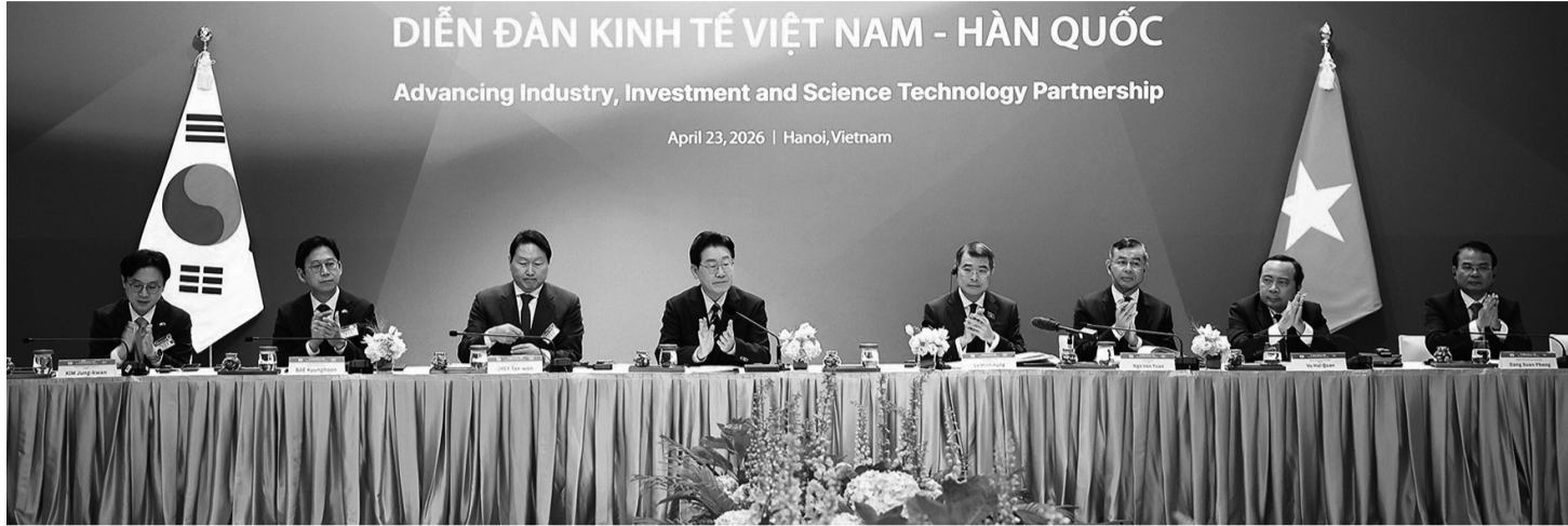
● Thủ tướng Lê Minh Hưng và Tổng thống Hàn Quốc Lee Jae Myung dự Tọa đàm bàn tròn với doanh nghiệp Việt Nam và Hàn Quốc.