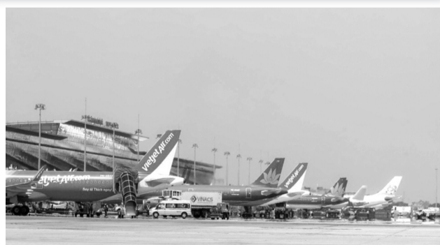
●Theo Cục Hàng không, việc phụ thu là linh hoạt, bảo đảm hài hòa lợi ích giữa Nhà nước, DN, người dân.

có hành lang pháp lý rõ ràng, cần thực hiện các thủ tục báo cáo cấp có thẩm quyền trong trường hợp giải quyết các vấn đề cấp bách, quan trọng. Nhằm tiếp tục hỗ trợ hoạt động vận tải hàng không trước diễn biến bất lợi từ giá nhiên liệu Jet A-1, Cục Hàng không kiến nghị cấp