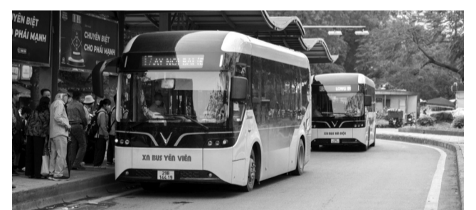
● Dự kiến khách đi trên 128 tuyến xe buýt có trợ giá và 2 tuyến ĐSĐT tại Hà Nội được miễn phí dịp lễ tới đây.

Chủ trương này sẽ áp dụng với toàn bộ hành khách sử dụng dịch vụ trên 128 tuyến xe buýt có trợ giá trên địa bàn TP và 2 tuyến ĐSĐT số 2A, Cát Linh - Hà Đông, tuyến số 3.1, Nhòn - ga Hà Nội đoạn trên cao.