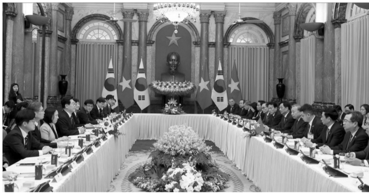
● Tổng Bí thư, Chủ tịch nước Tô Lâm hội đàm với Tổng thống Hàn Quốc Lee Jae Myung.

Tổng Bí thư, Chủ tịch nước Tô Lâm đánh giá cao sự tham gia đầu tư và đóng góp của các doanh nghiệp Hàn Quốc đối với quá trình phát triển kinh tế, xã hội Việt Nam; hoan nghênh doanh nghiệp