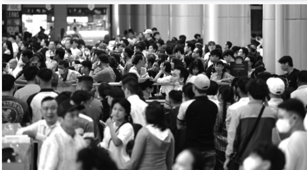
●Hành khách tại sân bay Tân Sơn Nhất dịp Tết Bình Ngọ 2026.

“Như vậy, chính sách giảm giá như trên cơ bản tác động không đáng kể đến cân đối thu - chi của hoạt động khai thác tài sản kết cấu hạ tầng hàng không do Nhà nước đầu tư, quản lý”, Cục Hàng không đánh giá.