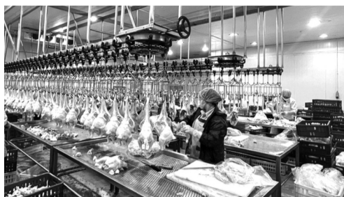
● Dây chuyền giết mổ gia cầm của một DN tại xã Phú Đồng bảo đảm vệ sinh an toàn thực phẩm.

Tại xã Chương Dương, trước đây có tới 631 CSGM nhỏ lẻ. Sau khi thực hiện chỉ đạo của TP, con số này đã giảm xuống còn 456 cơ sở. Dù vậy, số lượng còn lại vẫn rất lớn, đòi hỏi lộ trình xử lý bài bản và lâu dài. Xã đã xây dựng kế hoạch chấm dứt hoàn toàn các CSGM nhỏ lẻ trong khu dân cư theo ba giai đoạn: Năm 2026, giai đoạn 2027 - 2028 và sau năm 2028. Song song với đó là duy trì kiểm soát chặt chẽ các điều kiện vệ sinh thú y, an toàn thực phẩm và bảo vệ môi trường trong thời gian chuyển tiếp. Xã cũng đề xuất quy hoạch một khu giết mổ gia súc, gia cầm tập trung với quy mô