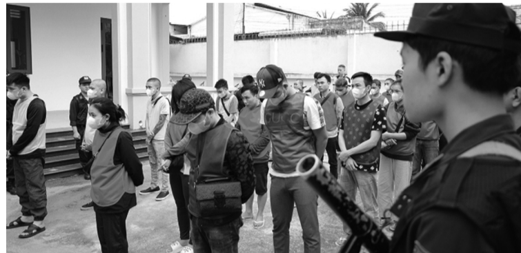
● Công an bắt một băng nhóm chuyên lừa đảo chiếm đoạt tài sản trên môi trường điện tử.

Dự án Bộ luật Hình sự (BLHS) sửa đổi đang được Bộ Công an lấy ý kiến Nhân dân đã đề xuất bổ sung các tội danh và hành vi phạm tội mới trong nhiều lĩnh vực, đặc biệt là công nghệ thông tin và mạng viễn thông; bổ sung các quy định về các dạng tài sản số như tiền số, tài sản số và giấy tờ có giá trên môi trường điện tử làm căn cứ pháp lý để tịch thu và thu hồi tài sản phạm tội.