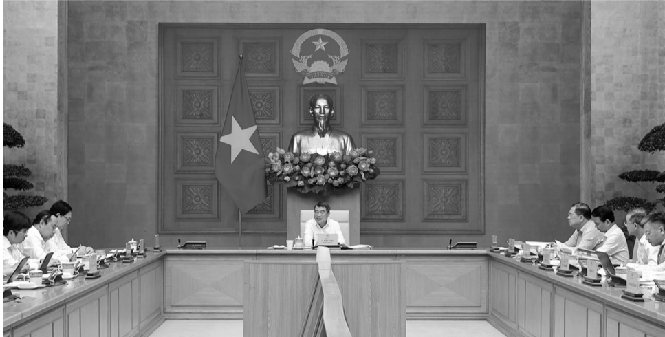
● Thủ tướng Lê Minh Hưng chủ trì cuộc làm việc với Bộ Khoa học và Công nghệ về thực hiện các nhiệm vụ khoa học, công nghệ, đổi mới sáng tạo và chuyển đổi số.

Phát biểu kết luận, Thủ tướng Lê Minh Hưng nhấn mạnh Nghị quyết 57 là định hướng chiến lược, có ý nghĩa đặc biệt quan trọng; việc tổ chức thực hiện phải quyết liệt, thực chất, hiệu quả hơn, theo đúng tinh