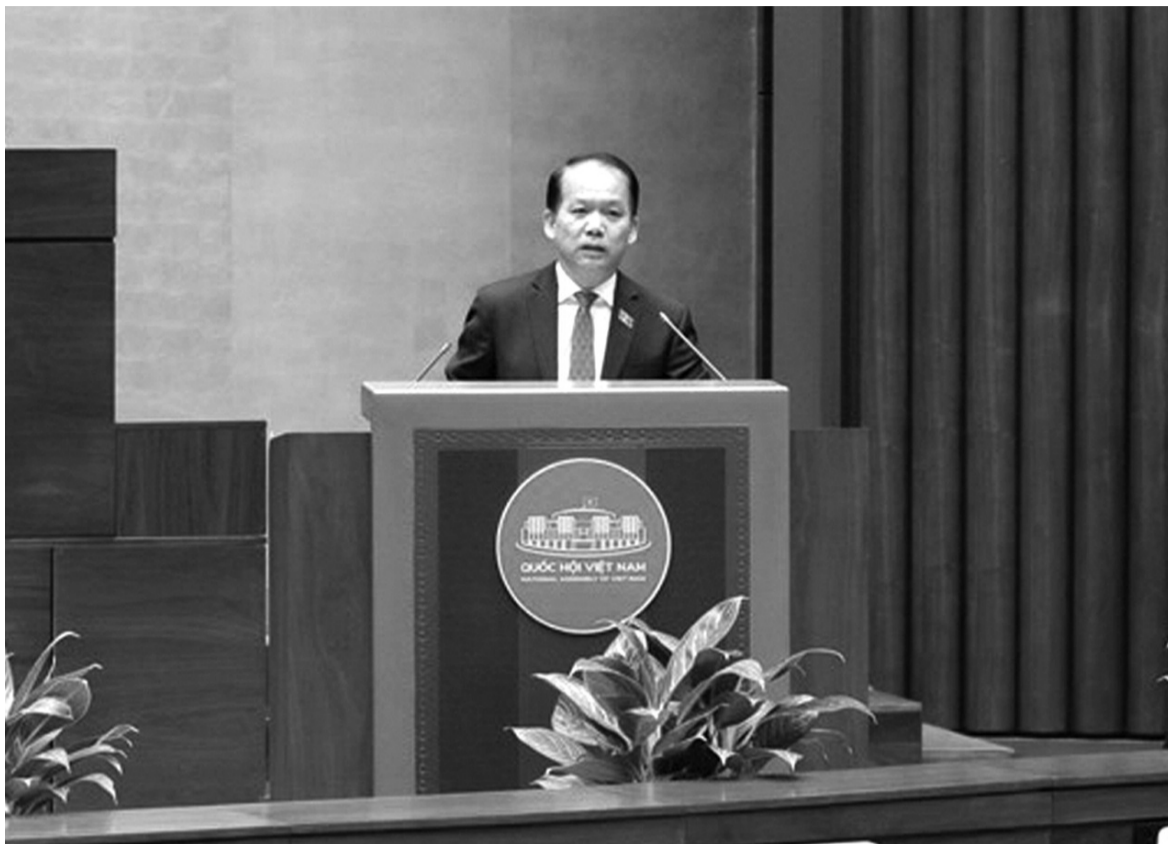
● Bộ trưởng Bộ Tư pháp Hoàng Thanh Tùng phát biểu tiếp thu, giải trình ý kiến đại biểu Quốc hội nêu tại phiên họp.