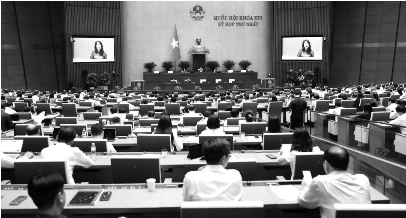
● Quang cảnh phiên thảo luận tại hội trường sáng 22/4.

Sáng 22/4, thảo luận tại hội trường về dự thảo Nghị quyết của Quốc hội (QH) về phát triển văn hóa Việt Nam, các đại biểu cơ bản tán thành với các chính sách phát triển văn hóa được nêu tại dự thảo. Một số ý kiến nhấn mạnh về chính sách chuyển đổi số để văn hóa hòa nhập vào dòng chảy của thị trường và sáng tạo.