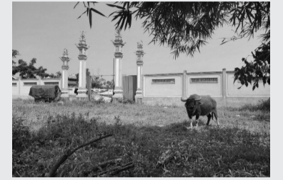
● Dự án mới thi công xong hàng rào và một số hạng mục.

Đền Xứ Tổ sư ca trù (hay còn gọi đình Nhà Trò) thờ 2 vị tổ nghề ca trù và cũng là nơi sinh hoạt, biểu diễn ca trù, đào tạo ca nương, kép đàn. Trải qua những biến cố của lịch sử và thời gian, đền Xứ trở thành phế tích. Năm