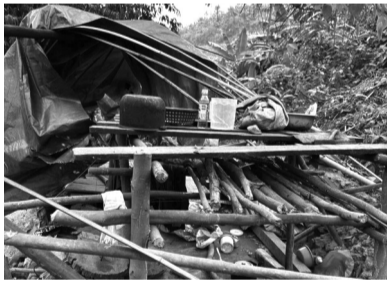
●UBND xã cho biết kiên quyết xử lý các trường hợp vi phạm, tịch thu phương tiện, tang vật, buộc khôi phục hiện trạng môi trường.