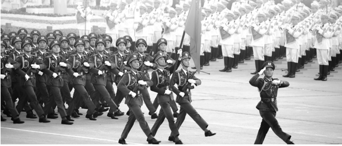
● Lực lượng Công an nhân dân luôn là “lá chắn thép” bảo vệ chủ nghĩa Mác - Lênin, tư tưởng Hồ Chí Minh.