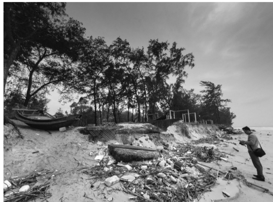
● Rừng phi lao ở thôn Hà Lợi Trung bị gãy đổ từng mảng, nhiều đoạn đường bê tông dẫn ra biển cũng bị đánh sập.

Từ nhiều đời nay, rừng phi lao ven biển được xem như lá chắn bảo vệ làng biển trước gió mưa, bão tố. Nhưng thời gian gần đây, đặc biệt là sau chuỗi mưa bão dồn dập cuối năm 2025, những cánh rừng phi lao dọc xã Bến Hải (tỉnh Quảng Trị) bị sóng lớn cuốn phăng ra biển.