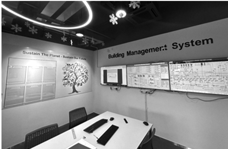
● Hệ thống BMS của Crystal Martin Việt Nam giúp giám sát và tối ưu hóa việc vận hành hệ thống điều hòa trung tâm giúp tiết kiệm năng lượng.

Bên cạnh đó, theo ông Dũng, có thể thấy rằng 80% phát thải của các sản phẩm nằm ở phát thải từ các quá trình đốt năng lượng để