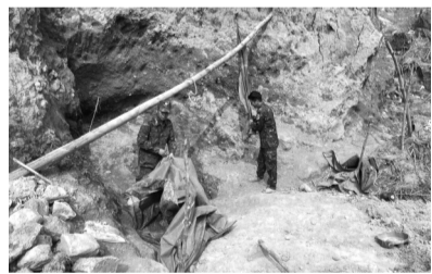
●Tháo dỡ lán trại của các đối tượng khai thác vàng trái phép.

Trước thực trạng trên, chính quyền địa phương và các lực lượng chức năng đã liên tục tổ chức các đợt