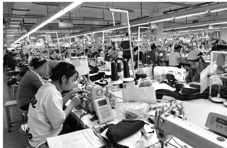
● Sử dụng năng lượng hiệu quả không chỉ phụ thuộc vào quy mô đầu tư, mà còn nằm ở tư duy quản trị và văn hóa DN. (Ảnh trong bài: PV)

Theo đại diện Crystal Martin Việt Nam, DN đặt mục tiêu giảm