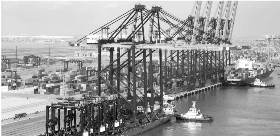
● Sản lượng hàng hóa thông qua cảng 4 tháng ước đạt 58,9 triệu tấn.

Trong 4 tháng đầu năm 2026, kinh tế - xã hội TP Hải Phòng tiếp tục duy trì ổn định và tăng trưởng tích cực, với 7/8 chỉ tiêu chủ yếu đạt và vượt kịch bản đề ra. Nhiều lĩnh vực ghi nhận kết quả nổi bật như thu ngân sách, xuất nhập khẩu, thu hút đầu tư và phát triển doanh nghiệp, tạo đà tăng trưởng cho các tháng tiếp theo.