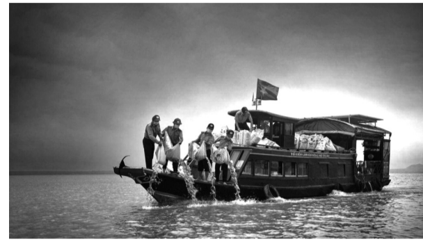
●Lực lượng chức năng thả cá trên hồ Trị An.