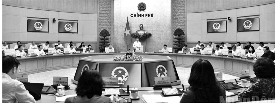
● Quang cảnh phiên họp.

Theo đề xuất của Ban Quản lý Khu công nghiệp tỉnh, Khu kinh tế ven biển phía Nam tỉnh Lâm Đồng dự kiến có quy mô khoảng 75.000ha. Đây là khu vực có