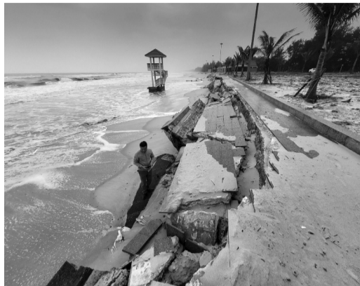
● Bãi tắm cộng đồng Trung Giang trong tình trạng bị sạt lở nghiêm trọng. (Ảnh trong bài: T.Tuyên)

Cả đời gắn bó với biển, ông Trần Văn Lợi (thôn Hà Lợi Trung) cho rằng chưa bao giờ thấy rừng phi lao bị tổn thương nặng nề đến vậy. Với cư dân bãi ngang, phi lao không chỉ là rừng phòng hộ; hạn chế cát bay, cát nhảy mùa hè; bảo vệ nhà cửa và đất sản xuất của cả làng mùa mưa bão; là nơi mọi người ngồi ngắm bóng thuyền cá trở về.