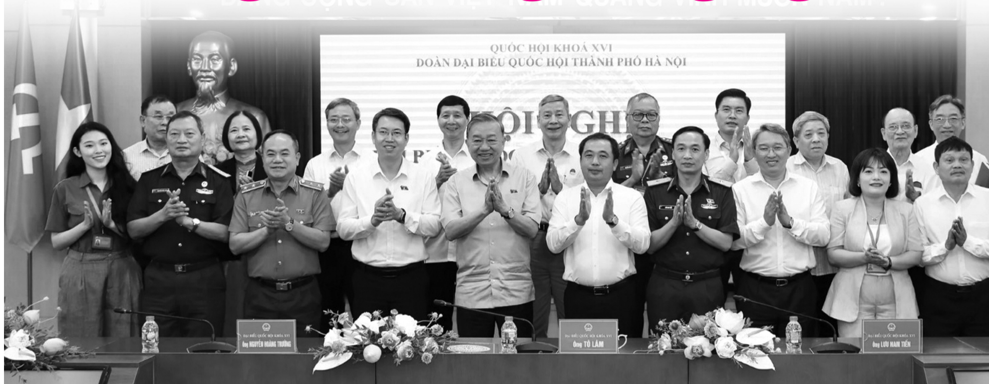
● Tổng Bí thư, Chủ tịch nước Tô Lâm cùng các đại biểu tại cuộc tiếp xúc cử tri.

Tinh thần trên được Tổng Bí thư, Chủ tịch nước Tô Lâm nhấn mạnh khi cùng các thành viên Đoàn đại biểu Quốc hội Thành phố Hà Nội, đơn vị bầu cử số 1 tiếp xúc cử tri, báo cáo kết quả Kỳ họp thứ Nhất, Quốc hội khóa XVI và lắng nghe các ý kiến, kiến nghị của cử tri, diễn ra hôm qua (4/5) tại Hà Nội.