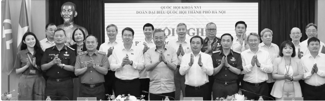
● Tổng Bí thư, Chủ tịch nước Tô Lâm cùng các đại biểu tại cuộc tiếp xúc cử tri.

Tinh thần trên được Tổng Bí thư, Chủ tịch nước Tô Lâm nhấn mạnh khi cùng các thành viên Đoàn đại biểu Quốc hội Thành phố Hà Nội, đơn vị bầu cử số 1 tiếp xúc cử tri, báo cáo kết quả Kỳ họp thứ Nhất, Quốc hội khóa XVI và lắng nghe các ý kiến, kiến nghị của cử tri, diễn ra hôm qua (4/5) tại Hà Nội.