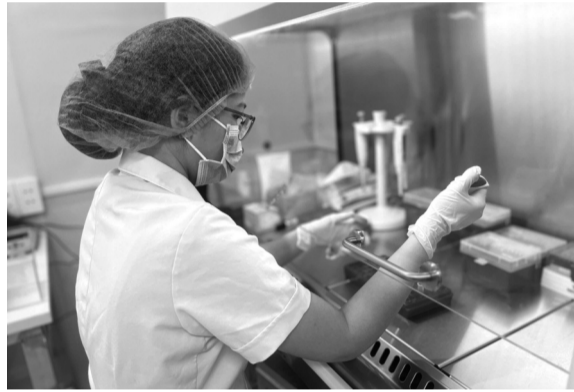
• Các hoạt động giám định tại Trung tâm Pháp y Hà Nội. (Ảnh trong bài: PV)