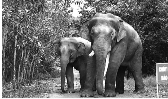
●Quần thể voi trong Khu Bảo tồn Thiên nhiên - Văn hóa Đồng Nai.

Quyết định phê duyệt điều chỉnh, bổ sung đề án du lịch sinh thái (DLST), nghỉ dưỡng, giải trí của Khu Bảo tồn Thiên nhiên - Văn hóa Đồng Nai giai đoạn 2021 - 2030 vừa được UBND Đồng Nai ban hành được xem là bước đi quan trọng để khai thác tiềm năng rừng, mặt nước, di tích và văn hóa bản địa theo hướng bền vững.