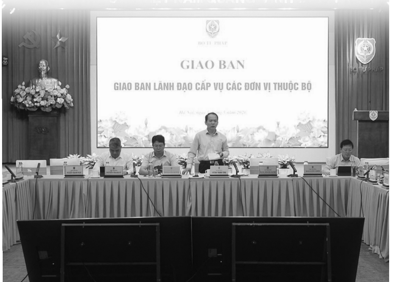
● Bộ trưởng Bộ Tư pháp Hoàng Thanh Tùng kết luận cuộc họp.