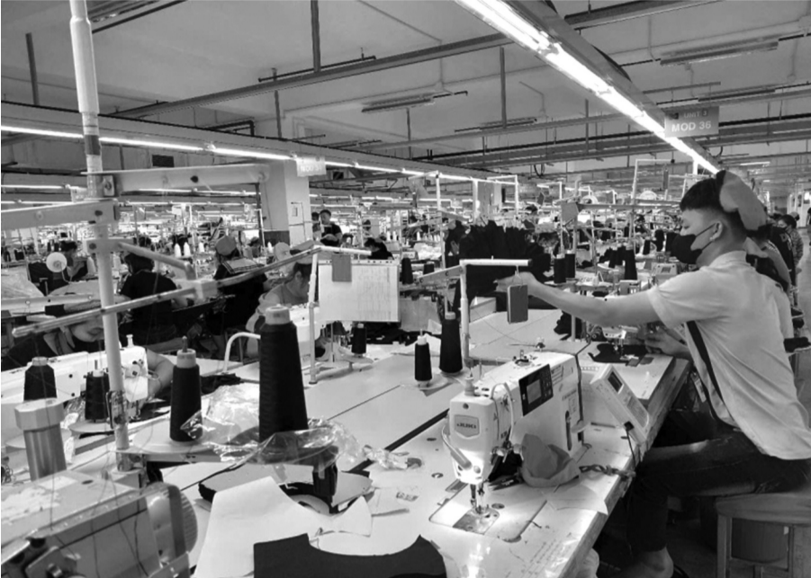
● Nhiều doanh nghiệp đã thực hiện các biện pháp để giảm nhiệt độ trong nhà xưởng, từ đó tiết giảm lượng điện tiêu thụ.