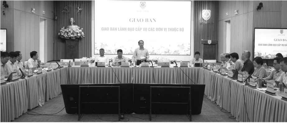
● Bộ trưởng Bộ Tư pháp Hoàng Thanh Tùng kết luận cuộc họp.