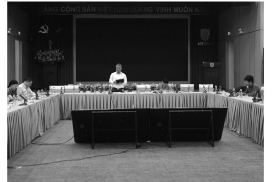
● Quang cảnh cuộc họp Hội đồng thẩm định.