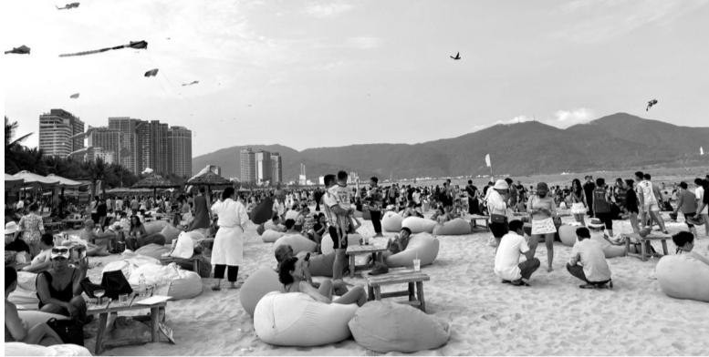
● Các bãi biển ở Đà Nẵng chật kín du khách đến vui chơi, nghỉ dưỡng trong hai kỳ nghỉ kép vừa qua.

Theo Cục Thống kê (Bộ Tài chính), tháng 4/2026, Việt Nam