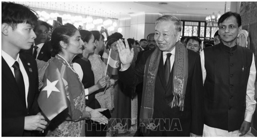
● Đại diện cộng đồng, cán bộ, nhân viên Đại sứ quán Việt Nam tại Ấn Độ đón Tổng Bí thư, Chủ tịch nước Tô Lâm.

Ngay sau khi tới thủ đô New Delhi, Tổng Bí thư, Chủ tịch nước Tô Lâm tiếp Cố vấn an ninh Quốc gia Ấn Độ Ajit Doval; gặp gỡ cán bộ, nhân viên Đại sứ quán Việt Nam và cộng đồng người Việt Nam tại Ấn Độ.