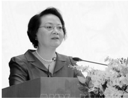
● Bí thư Trung ương Đảng, Phó Thủ tướng Phạm Thị Thanh Trà phát biểu tiếp thu ý kiến cử tri tại Hội nghị.