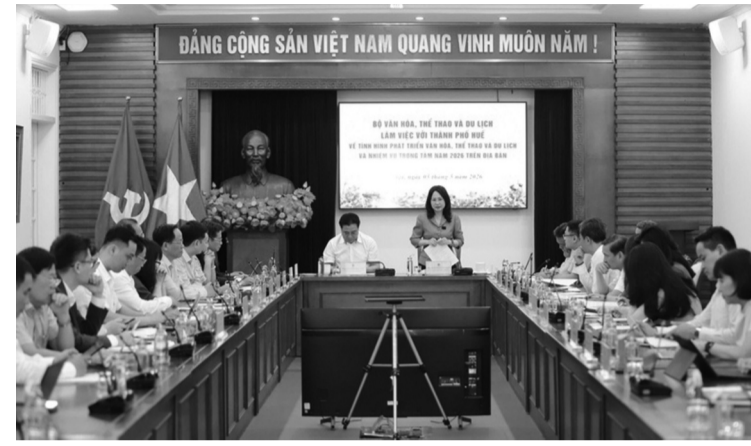
● Bộ trưởng Bộ VH,TT&DL Lâm Thị Phương Thanh đánh giá cao những kết quả nổi bật của TP Huế trong bảo tồn, phát huy giá trị di sản, phát triển VH,TT&DL.

Trong thời gian qua, công tác bảo tồn, phát huy giá trị di sản văn hóa được TP triển khai hiệu quả. Nhiều công trình trọng điểm thuộc Quần thể di tích Cố đô Huế đã được hoàn thành, bản