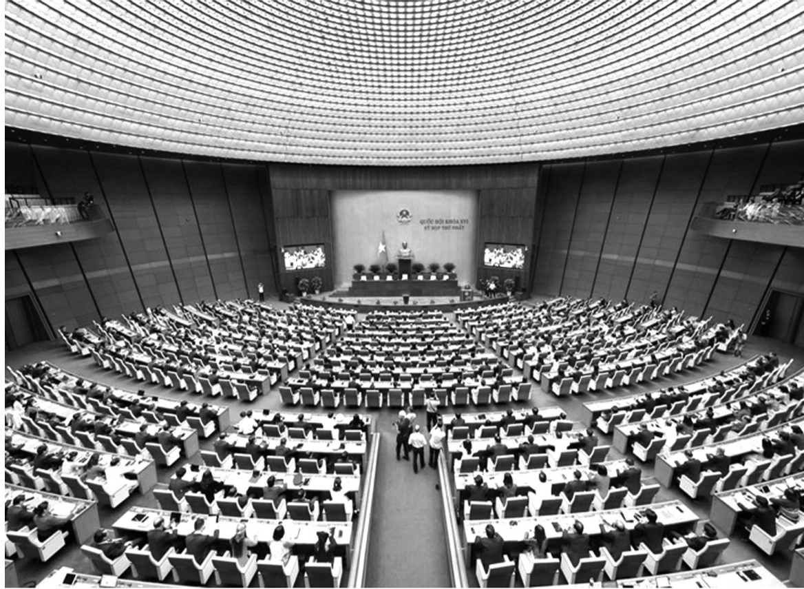
● “Không để kiến nghị của cử tri kéo dài qua nhiều kỳ tiếp xúc mà chậm chuyển biến, không rõ trách nhiệm, kết quả là yêu cầu mang tính nguyên tắc đối với mỗi đại biểu QH. Trong ảnh: Phiên khai mạc Kỳ họp thứ Nhất, Quốc hội khóa XVI.

Quốc hội vừa là nơi kết tinh ý chí, nguyện vọng và quyền làm chủ của Nhân dân, vừa là nơi chuyên hóa niềm tin ấy thành kết quả thực tiễn. Vì thế, yêu cầu “không để kiến nghị của cử tri đi qua nhiều kỳ tiếp xúc mà vẫn chậm chuyển biến, không rõ trách nhiệm, không rõ kết quả” vừa là mong muốn, vừa là yêu cầu có tính nguyên tắc đối với hoạt động của Quốc hội và từng đại biểu Quốc hội.