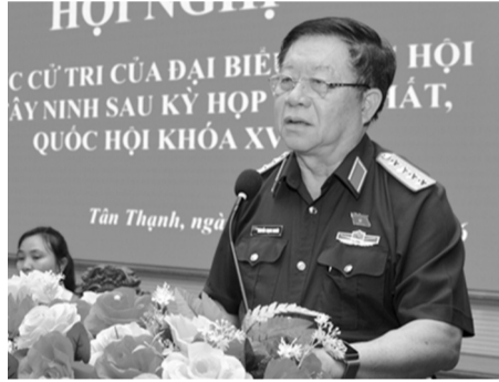
● Đại tướng Nguyễn Trọng Nghĩa phát biểu tại Hội nghị tiếp xúc cử tri của Đoàn Đại biểu Quốc hội tỉnh Tây Ninh sau Kỳ họp thứ Nhất, Quốc hội khóa XVI.

Tại Đà Nẵng, Ủy viên Bộ Chính trị, Thường trực Ban Bí thư Trần Cẩm Tú và Đoàn đại biểu Quốc hội đơn vị TP Đà Nẵng tiếp xúc cử tri 6 phường của TP Đà Nẵng.