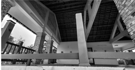
● Sau khi hoàn thành và bàn giao, nhiều hạng mục liên quan các bãi tắm vẫn chưa được đưa vào vận hành.