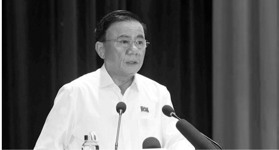
● Đổng chí Trần Cẩm Tú, Ủy viên Bộ Chính trị, Thường trực Ban Bí thư phát biểu tại buổi tiếp xúc cử tri.

Hôm qua (5/5), Đoàn Đại biểu Quốc hội Đà Nẵng, Lào Cai, Tây Ninh... đã tổ chức Hội nghị tiếp xúc cử tri sau Kỳ họp thứ Nhất, Quốc hội khóa XVI.