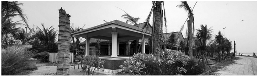
● Một góc công trình bãi tắm cộng đồng Gio Hải.

Theo ghi nhận thực tế, sau khi hoàn thành và bàn giao, phần lớn các hạng mục bãi tắm vẫn chưa được đưa vào vận hành. Trong khi cảng du lịch Cửa Việt đã khai thác từ tháng 3/2025, thì 3 bãi tắm vẫn rơi vào tình trạng bỏ không kéo dài. Các công trình như nhà hàng, khu dịch vụ, ki-ốt... được đầu tư khang trang hiện đang phơi sương, phơi nắng, xuống cấp theo thời gian. Nhiều hạng mục bị rêu mốc, hư hỏng, cây xanh chết khô, hệ thống hạ tầng bị ảnh hưởng do không được bảo trì thường xuyên.