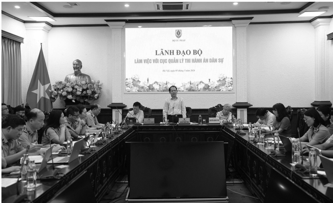
● Bộ trưởng Bộ Tư pháp Hoàng Thanh Tùng phát biểu tại buổi làm việc với Cục Quản lý THADS.

Về thể chế: nổi bật là đã tham mưu, trình Quốc hội thông qua Luật THADS năm 2025. Đối với việc triển khai Luật, Cục Quản lý THADS đang tham mưu trình cấp có thẩm quyền ban hành 3 Nghị định, 7 Thông tư và làm đầu mối phối hợp với các Bộ, ngành liên quan ban hành 10 Thông tư khác để quy định chi tiết, hướng dẫn thi hành Luật. Hiện nay, các Nghị định, Thông tư đều được triển