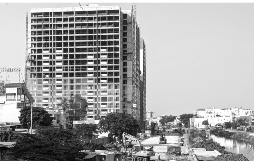
● Một dự án NCC đang được xây dựng tại TP HCM.

Theo HoREA, trong giai đoạn lập quy hoạch và quyết định chủ trương đầu tư, quy mô dân số tối đa sẽ được xác định dựa trên mục tiêu diện tích sàn bình quân đạt khoảng 32m 2 /người. Bước sang giai đoạn thiết kế và cấp phép, chủ đầu tư sẽ được linh hoạt cơ cấu căn hộ dựa trên diện tích sử dụng và số phòng ở.