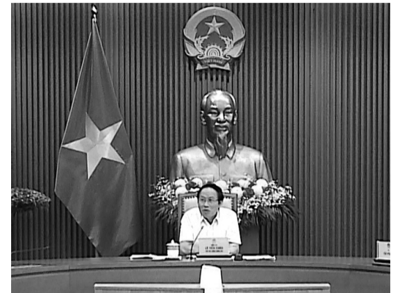
● Phó Thủ tướng Lê Tiến Châu lưu ý cần thể hiện rõ Công Pháp luật quốc gia là kênh thông tin truyền thông chính thức về mọi hoạt động của Ban Chỉ đạo Trung ương về hoàn thiện thể chế, pháp luật.

Sáng 5/5, tại Trụ sở Chính phủ, Phó Thủ tướng Lê Tiến Châu chủ trì cuộc họp về chính sách xây dựng Luật Phổ biến, giáo dục pháp luật (PBGDPL) (sửa đổi) và Đề án phát triển Công Pháp luật quốc gia giai đoạn 2026 - 2030.