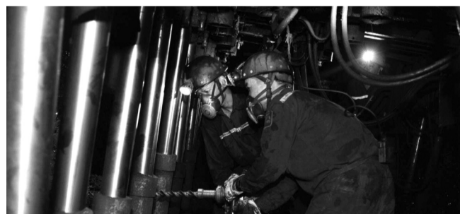
● TKV duy trì kiểm tra công tác nhận diện nguy cơ rủi ro, biện pháp phòng ngừa tai nạn sự cố, kiểm tra công tác an toàn, vệ sinh lao động... (Ảnh: Internet)