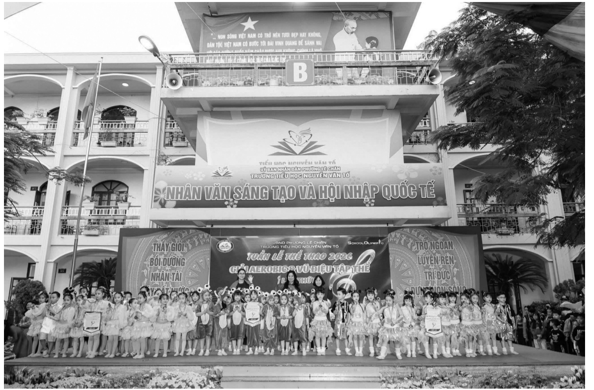
● Phường Lê Chân (TP Hải Phòng) đi đầu xây dựng Trường học XHCN trong kỷ nguyên mới.

Trong bài phát biểu của Tổng Bí thư, Chủ tịch nước Tô Lâm tại buổi làm việc với Ban Chấp hành Đảng bộ TP Hải Phòng ngày 16/3/2026 với định hướng chiến lược cho giai đoạn 2026 - 2030, tầm nhìn đến 2045 và xa hơn, không chỉ dừng lại ở việc đánh giá thành tựu, chỉ ra hạn chế hay định hướng phát triển kinh tế - xã hội. Ân sâu trong toàn bộ hệ thống luận điểm của Tổng Bí thư, Chủ tịch nước Tô Lâm là một tư tưởng xuyên