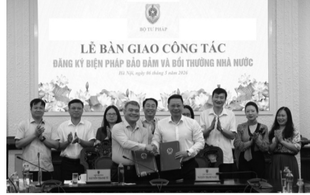
● Hai Thủ trưởng bàn giao công tác.

Ghi nhận tinh thần đoàn kết của tập thể Cục, Thủ trưởng nhấn mạnh, trong bối cảnh khối lượng công việc ngày càng lớn, yêu cầu ngày càng cao, đội ngũ cán bộ cần tiếp tục giữ vững kỷ cương, nâng cao chất lượng chuyên môn, chủ động tham mưu những giải pháp đột phá, sáng tạo để hoàn thành tốt nhiệm vụ. Thủ trưởng kỳ vọng với tinh thần đoàn kết, trách nhiệm Cục sẽ tiếp tục phát huy những kết quả đã đạt được trong thời gian qua, đồng thời tiếp tục đổi mới, bám sát các nhiệm vụ của Bộ, ngành Tư pháp, phát huy năng lực, hoàn thành tốt nhiệm vụ được giao.