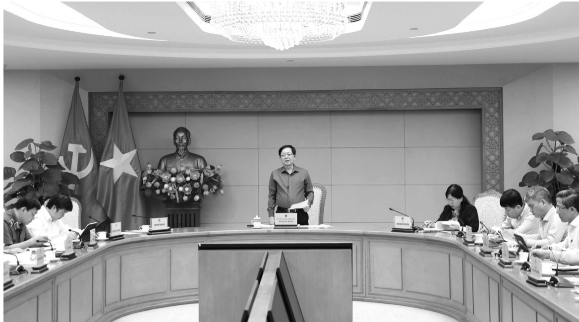
● Phó Thủ tướng Hồ Quốc Dũng chủ trì cuộc họp về tình hình thực hiện Chỉ thị 05/CT-TTg ngày 13/2/2026 của Thủ tướng Chính phủ.