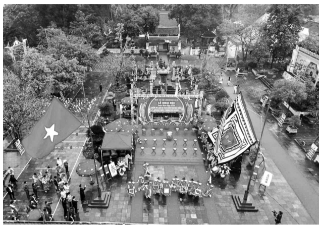
● Lễ hội đền Hát Môn xuân Bình Nghi 2026.

Với những giá trị đặc biệt về lịch sử, văn hóa và kiến trúc, đền Hát Môn đã được công nhận là Di tích quốc gia đặc biệt vào năm 2013. Ngày 28/4/2026, Phó Thủ tướng Chính phủ Phạm Thị Thanh Trà đã ký Quyết định số 756/QĐ-TTg phê duyệt nhiệm vụ lập quy hoạch bảo quản, tu bổ, phục hồi di tích. Đây không chỉ là một quyết định mang tính quản lý di sản, mà còn là bước đi quan trọng nhằm gìn giữ những giá trị lịch sử, văn hóa, tâm linh gắn với Hai Bà Trưng - biểu tượng bất khuất của dân tộc.