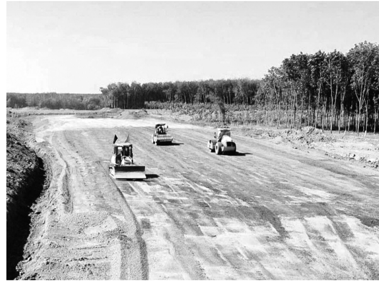
● Công trường cao tốc TP HCM - Thủ Dầu Một - Chơn Thành, đoạn qua TP Đồng Nai.

Tại dự án nâng cấp, mở rộng QL14 đoạn Đồng Xoài - Chơn Thành, các gói thầu quan trọng đã được triển khai, trong đó cầu Nha Bích là hạng mục trọng điểm. Công trình này được khởi công ngày 15/1, xây dựng mới về phía bên phải cầu hiện hữu, gồm 2 đơn nguyên, tổng bề rộng toàn cầu 34m, chiều dài