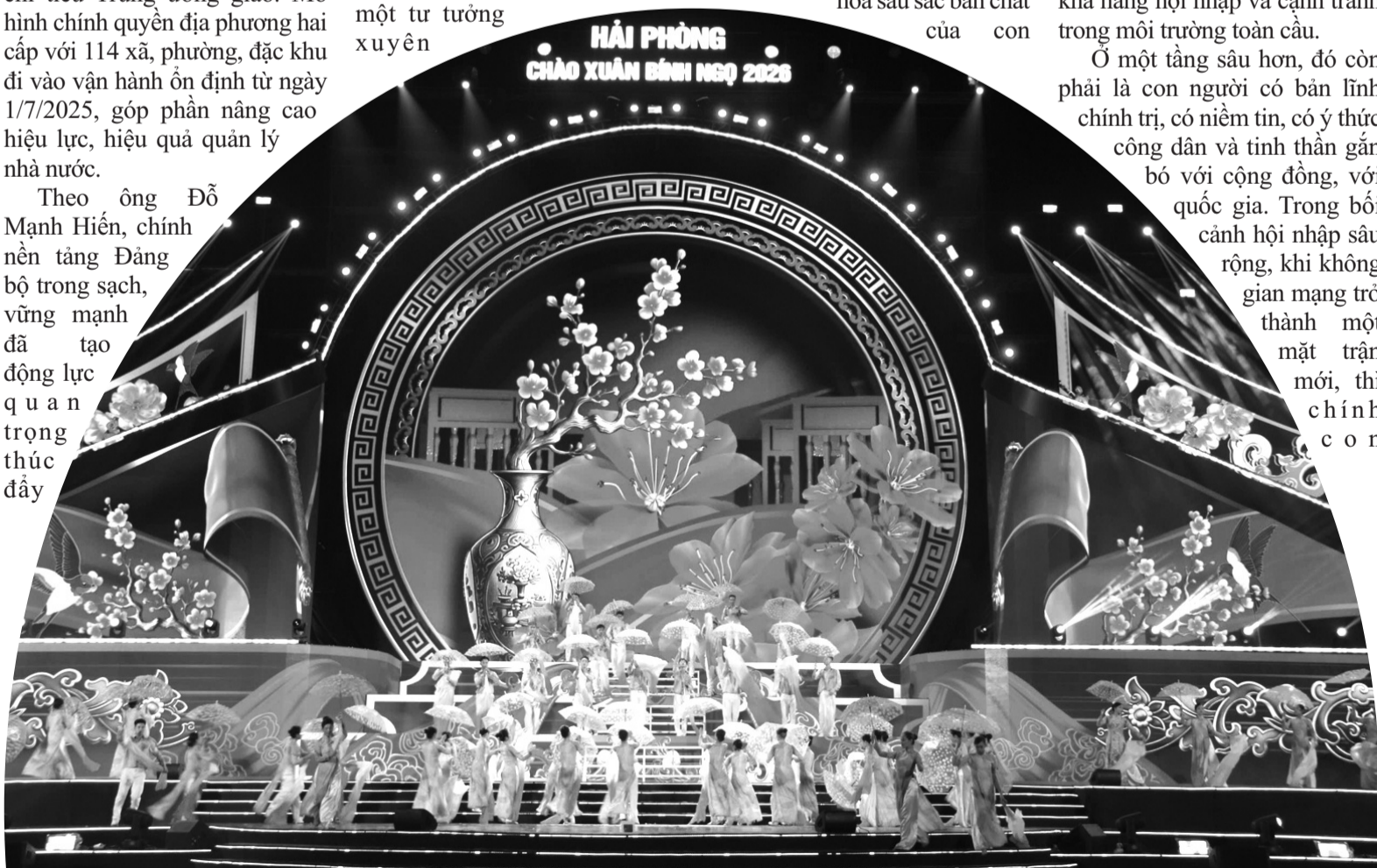
● Hải Phòng tiên phong xây dựng mô hình CNXH trong kỷ nguyên mới.

N.THƯƠNG - Q.AN - V.HUY - V.QUANG - V.HÙNG