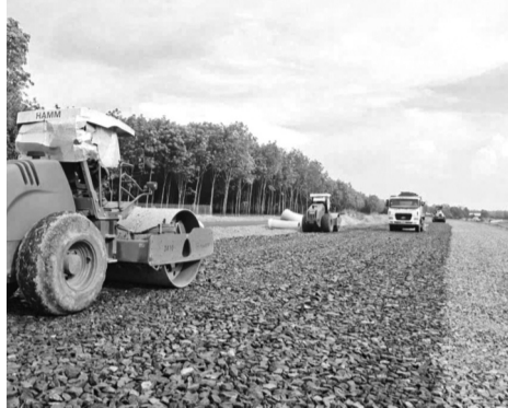
● Dự án tái định cư cao tốc Gia Nghĩa - Chơn Thành đang được đẩy nhanh thi công.