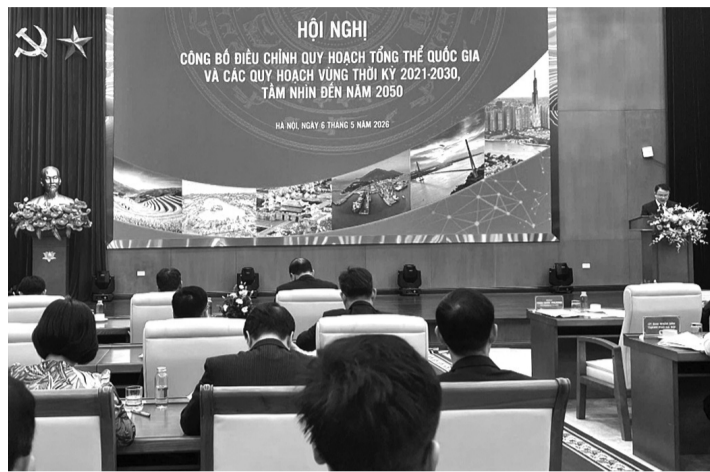
● Hội nghị công bố điều chỉnh Quy hoạch tổng thể quốc gia và các quy hoạch vùng thời kỳ 2021 - 2030, tầm nhìn đến năm 2050.

Phát biểu chỉ đạo tại Hội nghị công bố điều chỉnh Quy hoạch tổng thể quốc gia và các quy hoạch vùng thời kỳ 2021 - 2030, tầm nhìn đến năm 2050 do Bộ Tài chính tổ chức sáng 6/5, Phó Thủ tướng Thường trực Chính phủ Phạm Gia Túc nhấn mạnh yêu cầu kiên định mục tiêu tăng trưởng hai con số, đồng thời xác lập mô hình tăng trưởng mới dựa trên khoa học công nghệ, đổi mới sáng tạo và chuyển đổi số.