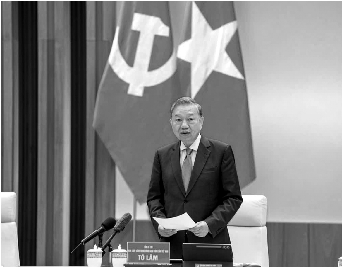
● Tổng Bí thư, Chủ tịch nước Tô Lâm tại buổi làm việc với Ban Chấp hành Đảng bộ TP Hải Phòng ngày 16/3/2026.

Theo đó, hệ tiêu chí CNXH và con người XHCN được xác định đây là nhiệm vụ trung tâm và cơ hội lịch sử, Đảng bộ Hải Phòng đã triển khai xây dựng Đề án với quy trình khoa học, bài bản. Thành phố phối hợp với Tạp chí Cộng sản tổ chức nhiều hội thảo khoa học cấp Trung ương, quy tụ gần 100 nhà lý luận, chuyên gia đầu ngành; đồng thời lấy ý kiến rộng rãi từ các tầng lớp Nhân dân, trí thức và cộng đồng doanh nghiệp.