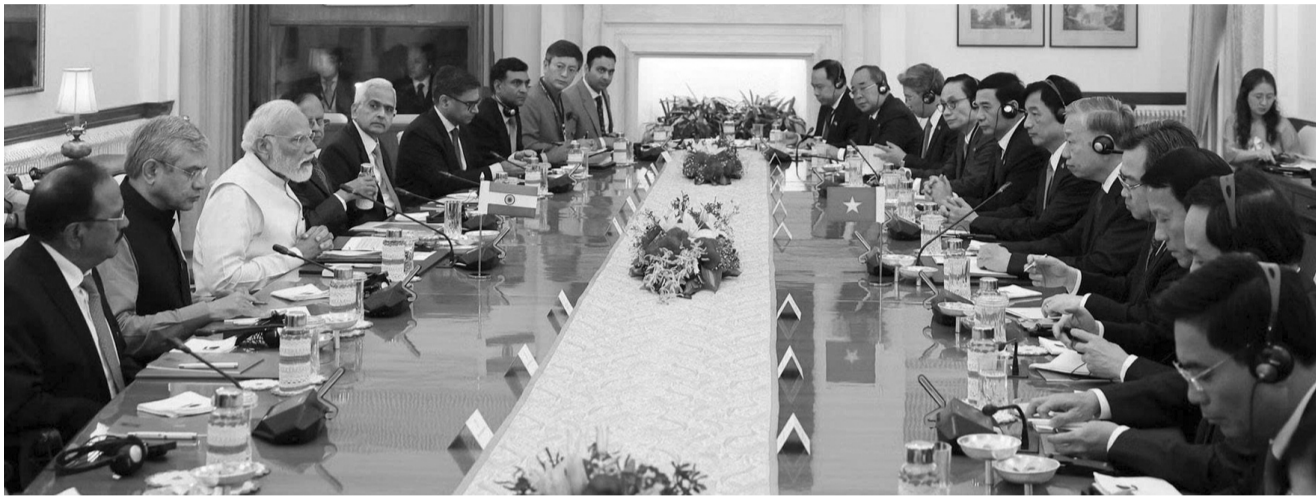
● Tổng Bí thư, Chủ tịch nước Tô Lâm hội đàm với Thủ tướng Ấn Độ Narendra Modi.

Sáng 6/5, sau Lễ đón cấp Nhà nước do Tổng thống Ấn Độ Droupadi Murmu, Thủ tướng Ấn Độ Narendra Modi đồng chủ trì được cử hành trọng thể tại Phủ Tổng thống ở thủ đô New Delhi (Ấn Độ) theo nghi thức cao nhất dành cho nguyên thủ quốc gia, Tổng Bí thư, Chủ tịch nước Tô Lâm đã tiến hành hội đàm với Thủ tướng Ấn Độ Narendra Modi.