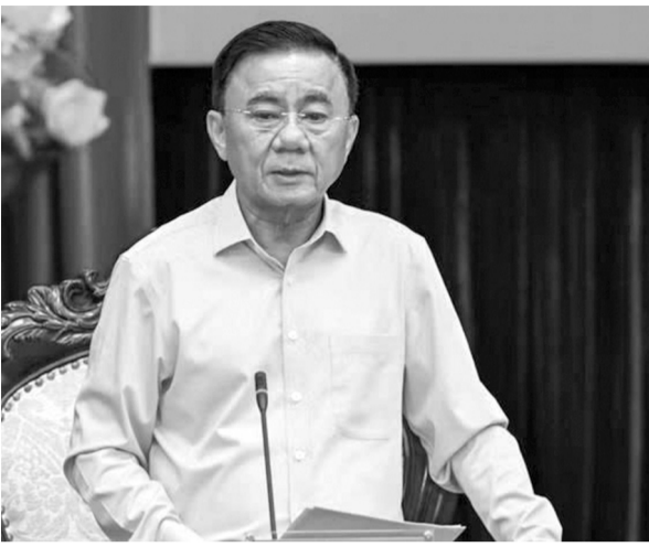
● Thường trực Ban Bí thư Trần Cẩm Tú chủ trì làm việc với Ban Thường vụ Đảng ủy Tập đoàn Công nghiệp - Viễn thông Quân đội.

Ngày 6/5, tại Hà Nội, Đoàn kiểm tra, giám sát số 12 của Bộ Chính trị do đồng chí Trần Cẩm Tú, Ủy viên Bộ Chính trị, Thường trực Ban Bí thư làm Trưởng đoàn đã làm việc với Ban Thường vụ Đảng ủy Tập đoàn Công nghiệp - Viễn thông Quân đội (Viettel).