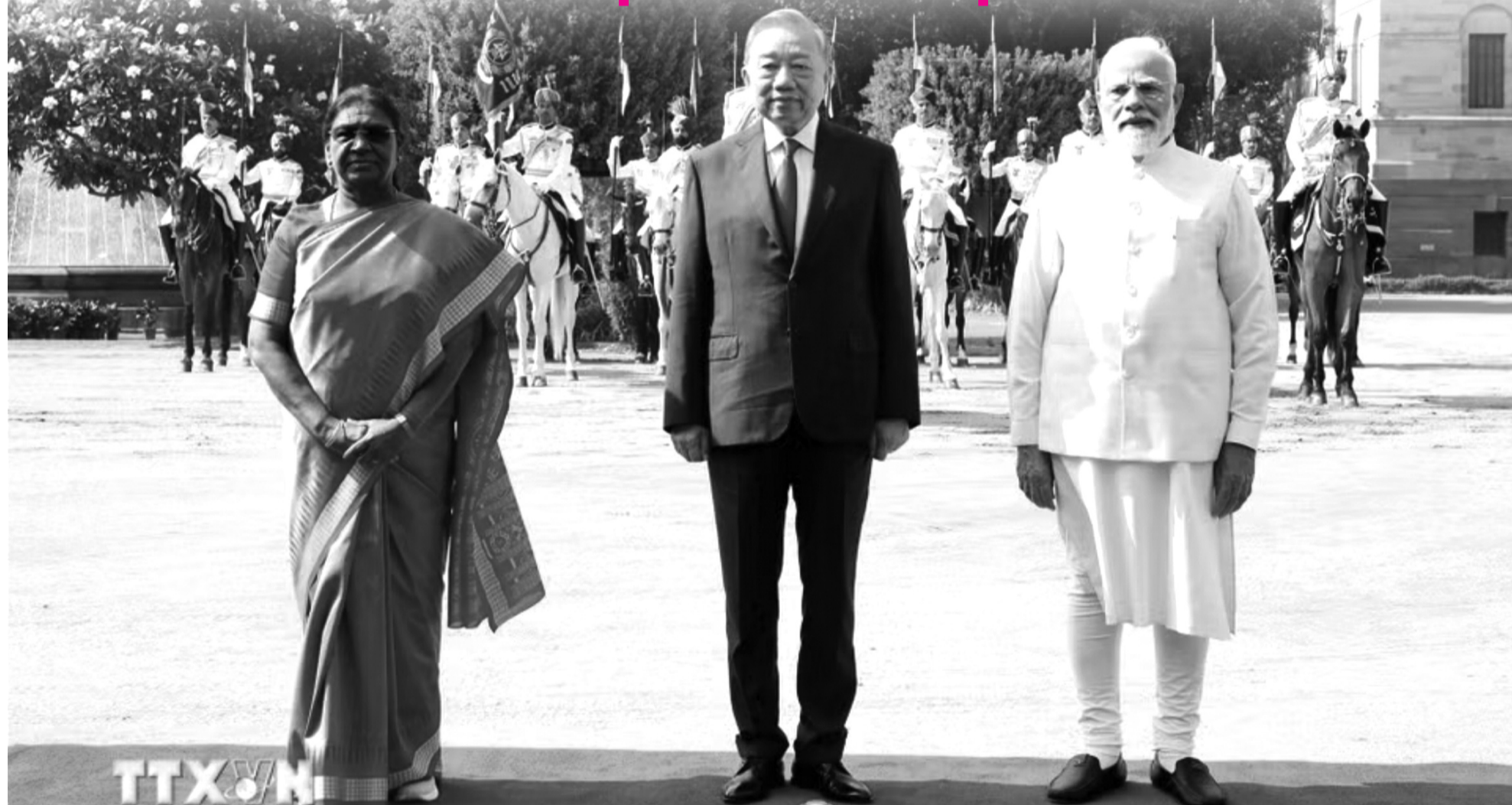
● Tổng thống Droupadi Murmu và Thủ tướng Narendra Modi đồng chủ trì Lễ đón trọng thể Tổng Bí thư, Chủ tịch nước Tô Lâm thăm cấp Nhà nước tới Ấn Độ.

Sáng 6/5, sau Lễ đón cấp Nhà nước do Tổng thống Ấn Độ Droupadi Murmu, Thủ tướng Ấn Độ Narendra Modi đồng chủ trì được cử hành trọng thể tại Phủ Tổng thống ở thủ đô New Delhi (Ấn Độ) theo nghi thức cao nhất dành cho nguyên thủ quốc gia, Tổng Bí thư, Chủ tịch nước Tô Lâm đã tiến hành hội đàm với Thủ tướng Ấn Độ Narendra Modi.