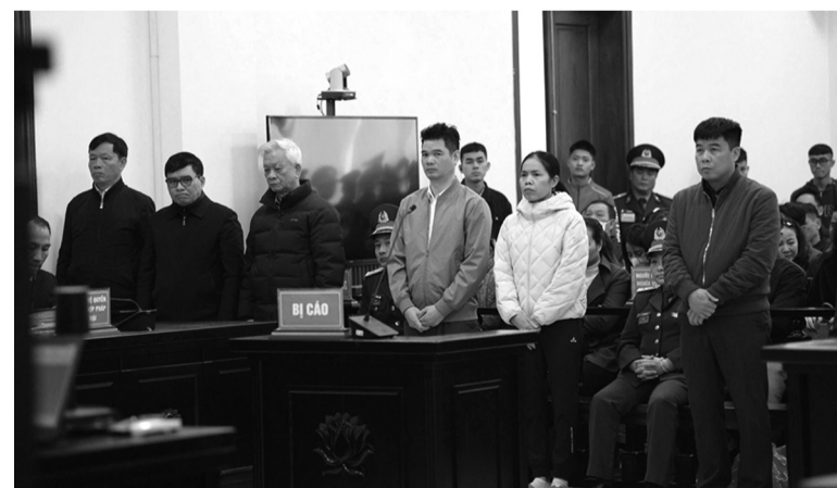
● Một số bị cáo tại phiên sơ thẩm.

Theo bản án sơ thẩm, từ 2015 - 2024, một số cán bộ UBND tỉnh và một số bị cáo thuộc một số cơ quan trong Bộ Quốc phòng đã có các sai phạm; vi phạm quy định về quản lý đất đai khi cấp có thẩm quyền có chủ trương đồng ý chuyển mục đích sử dụng đất tại sân bay Nha Trang từ đất quốc phòng sang phát triển kinh tế - xã hội địa phương nhưng chưa được Thủ tướng phê duyệt phương án sắp xếp, xử lý cơ sở nhà, đất. Trong quá trình chuyển giao khoảng 186,2ha đất quốc phòng tại sân bay Nha Trang cho UBND tỉnh, các bị cáo đã làm trái trình tự thủ tục quy định, không đúng ý kiến chỉ đạo của Thủ tướng và quan điểm thống nhất giữa Bộ Quốc phòng và UBND tỉnh. Gần 63ha đất quốc