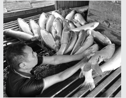
● Người dân gom cá chết đi tiêu hủy, ngày 4/5.

Theo đó, sau khi nhận được thông tin của UBND xã về việc kiểm tra, xác định nguyên nhân hiện tượng cá chết hàng loạt trên địa bàn xã Anh Sơn, Sở NN&MT đã cử cán bộ Chi cục Thủy sản và Kiểm ngư phối