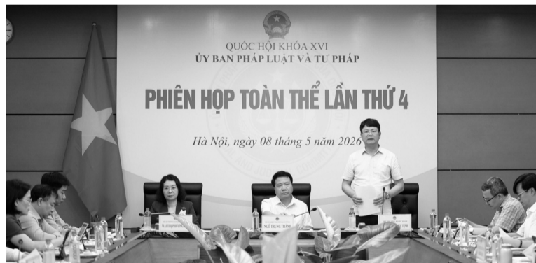
● Quang cảnh Phiên họp.

Liên quan đến cơ sở chính trị, pháp lý của việc sửa đổi Pháp lệnh, Thứ trưởng cho biết, Kết luận số 09 ngày 10/3/2026 của Bộ Chính trị là căn cứ để xây dựng quy định mới tại khoản 1 Điều 4 của dự thảo Pháp lệnh. Đây được xác định là điều khoản quan trọng nhất của dự thảo Pháp lệnh với quy định: “Văn bản hợp nhất được cơ quan, tổ chức, cá nhân