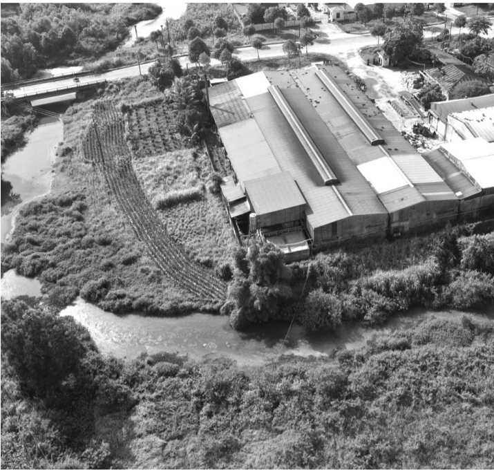
● Phần lớn nước thải phát sinh từ CCN Tịnh Ấn Tây được xả trực tiếp ra môi trường, đổ vào tuyến kênh chìm Sơn Tịnh.

Phải nhận lượng lớn nước thải từ Cụm công nghiệp (CCN) Tịnh Ấn Tây, nhiều năm qua, tuyến kênh chìm Sơn Tịnh đoạn chảy qua khu vực phường Trương Quang Trọng và xã Thọ Phong (tỉnh Quảng Ngãi) đang chịu ô nhiễm nghiêm trọng.