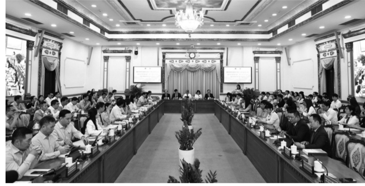
● Hội thảo do UBND TP, Thường trực HĐND TP HCM phối hợp Trường ĐH Luật TP HCM tổ chức.