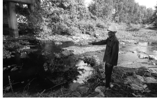
● Dòng nước đen ngòm, hôi hám tại kênh chìm Sơn Tịnh.