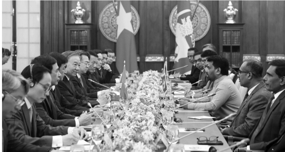
● Tổng Bí thư, Chủ tịch nước Tô Lâm và Tổng thống Sri Lanka Anura Kumara Dissanayake hội đàm.

Nhấn mạnh tiềm năng hợp tác về thương mại và đầu tư, hai nhà Lãnh đạo nhất trí triển khai các biện pháp đột phá nhằm sớm đạt mục tiêu kim ngạch thương mại 1 tỷ USD trong thời gian tới. Tổng Bí thư, Chủ tịch nước Tô Lâm khẳng định Việt Nam sẵn sàng cung ứng cho thị trường Sri Lanka các