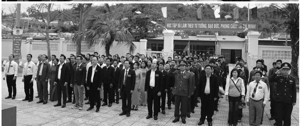
● Xây dựng thế trận lòng dân, bảo vệ vững chắc nền tảng tư tưởng của Đảng nơi đầu sóng ngọn gió.

sẵn sàng chiến đấu cao, chủ động trước mọi tình huống.