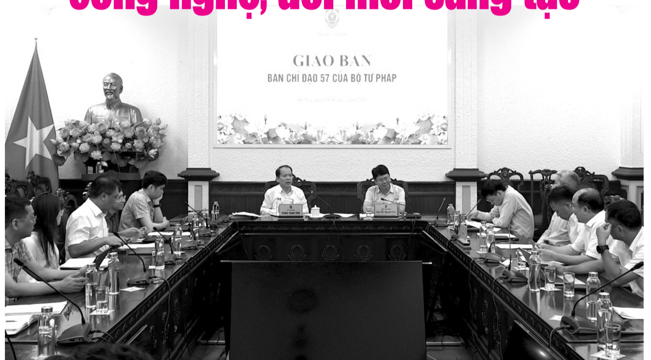
● Quang cảnh cuộc họp giao ban.