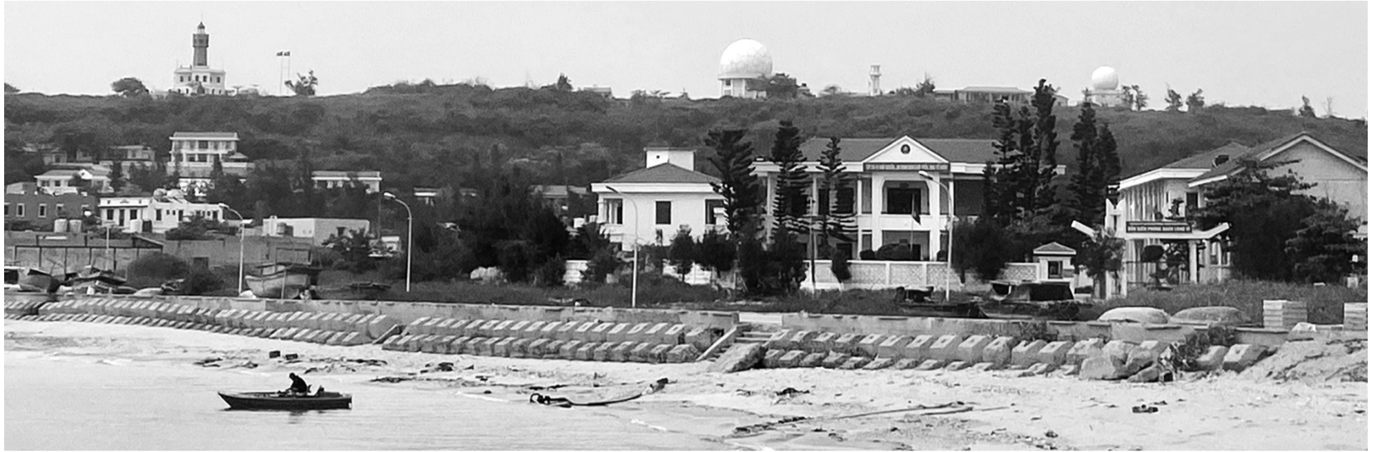
● Trong chiến lược phát triển kinh tế biển gắn với quốc phòng - an ninh, Bạch Long Vĩ giữ vị trí đặc biệt quan trọng.

nhiệm môi trường biển, suy giảm nguồn lợi thủy sản... tất cả đang đặt ra những yêu cầu cấp bách đối với sự phát triển bền vững.