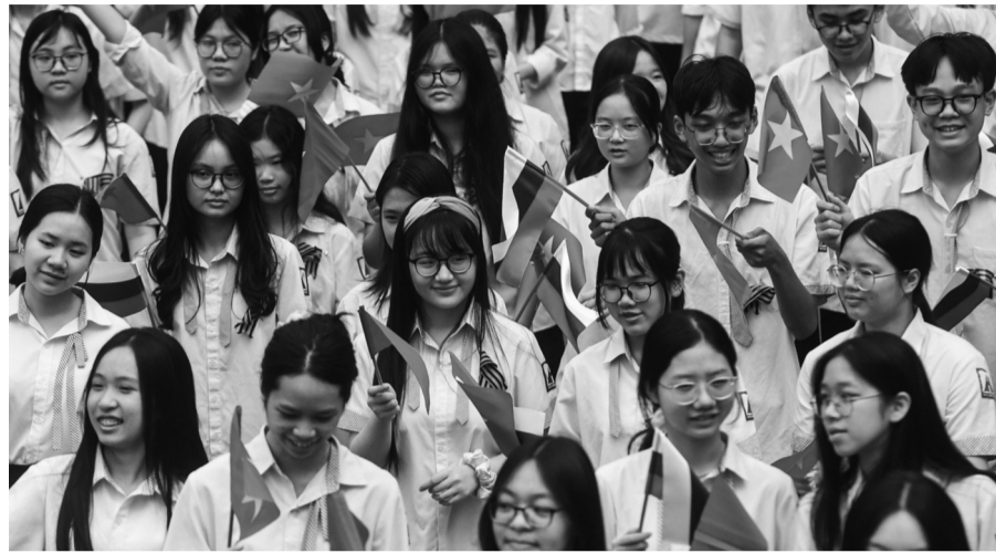
● Các em học sinh Việt Nam tham gia diễu hành "Bình đoàn bất tử".