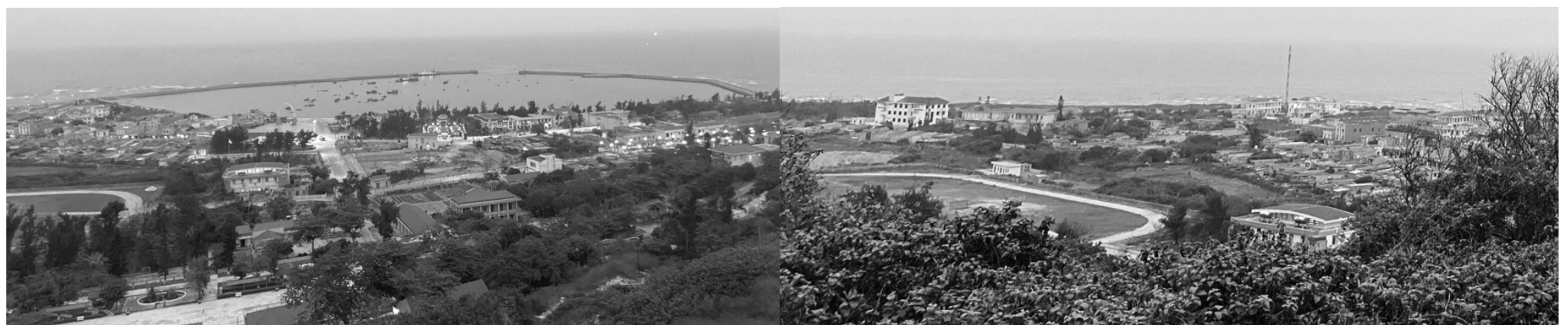
● Một góc đặc khu Bạch Long Vĩ nhìn từ trên cao.

N.THƯƠNG - T.HẰNG - V.HUY - V.QUANG - V.HÙNG