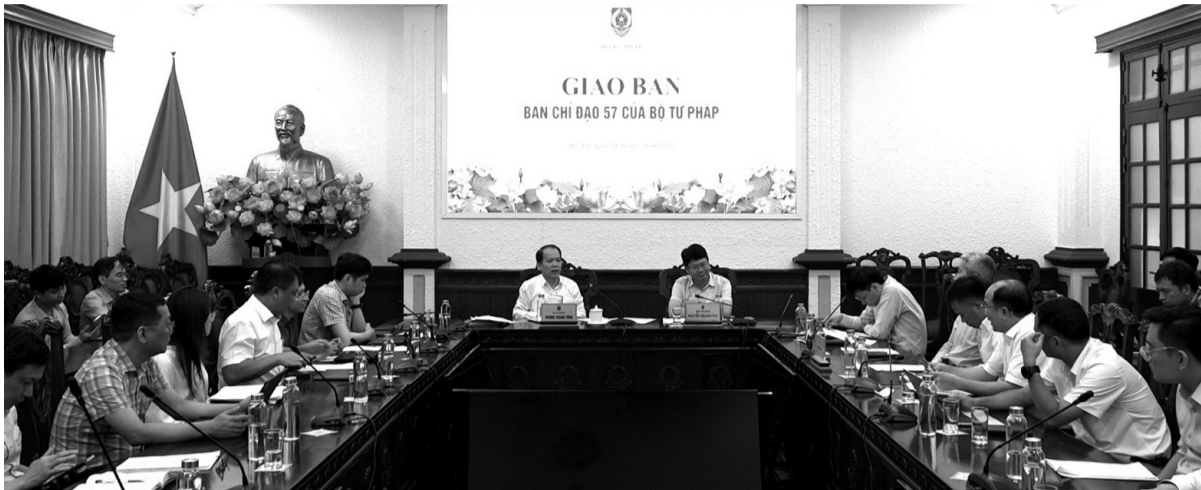
● Quang cảnh cuộc họp giao ban.

Tại cuộc họp giao ban Ban Chỉ đạo 57 (Ban Chỉ đạo về phát triển khoa học, công nghệ, đổi mới sáng tạo, chuyển đổi số và Đề án 06) của Bộ Tư pháp chiều 8/5, Bộ trưởng Bộ Tư pháp Hoàng Thanh Tùng, Trưởng Ban Chỉ đạo yêu cầu các đơn vị tập trung rà soát, làm rõ tiến độ thực hiện các nhiệm vụ, đặc biệt là những nội dung đang bị thống kê là chậm, muộn hoặc chưa hoàn thành. Cùng dự có Thứ trưởng Nguyễn Thanh Tịnh, Phó Trưởng ban Ban Chỉ đạo 57 của Bộ.