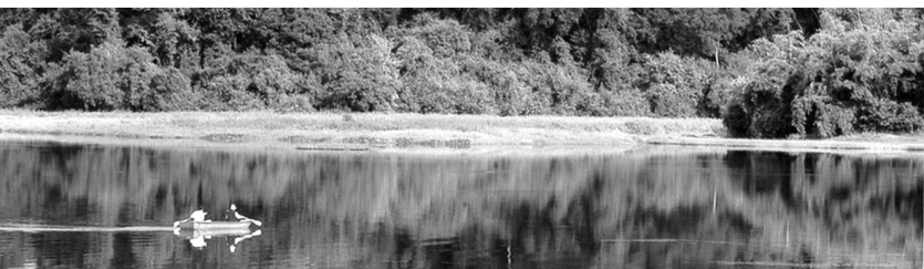
● Du khách chèo thuyền tại VQG Cát Tiên.