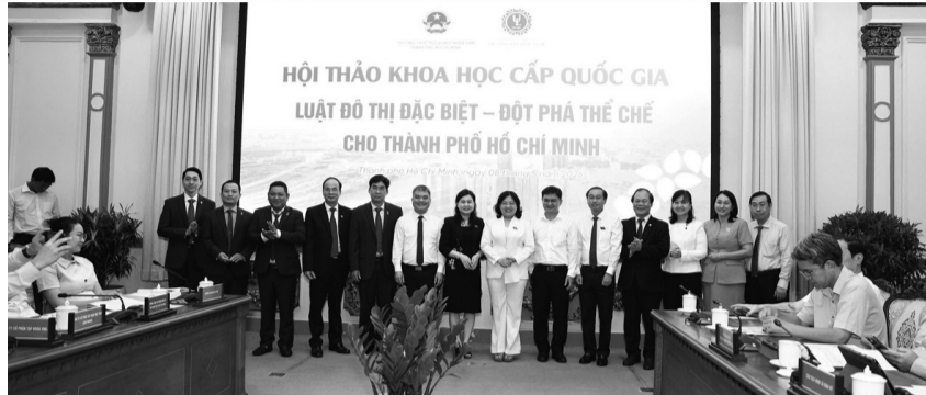
● Hội thảo nhận được 66 tham luận từ các chuyên gia, nhà khoa học, cơ quan quản lý nhà nước, đại biểu dân cử và các cơ sở đào tạo, nghiên cứu.

Một hướng đi đáng chú ý là phát triển mô hình “city break” kết hợp nghỉ