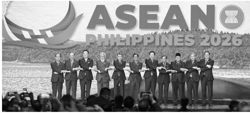
● Hội nghị Cấp cao ASEAN lần thứ 48 là 1 trong 2 cuộc họp định kỳ hằng năm của lãnh đạo ASEAN trong năm 2026.

Thứ hai, Thủ tướng đề nghị thúc đẩy hợp tác thực chất nhằm tăng