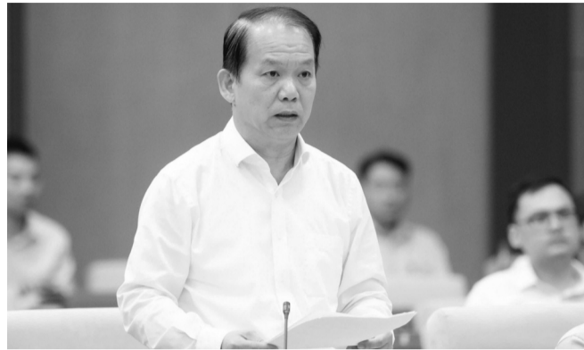
● Bộ trưởng Bộ Tư pháp Hoàng Thanh Tùng tại Phiên họp.