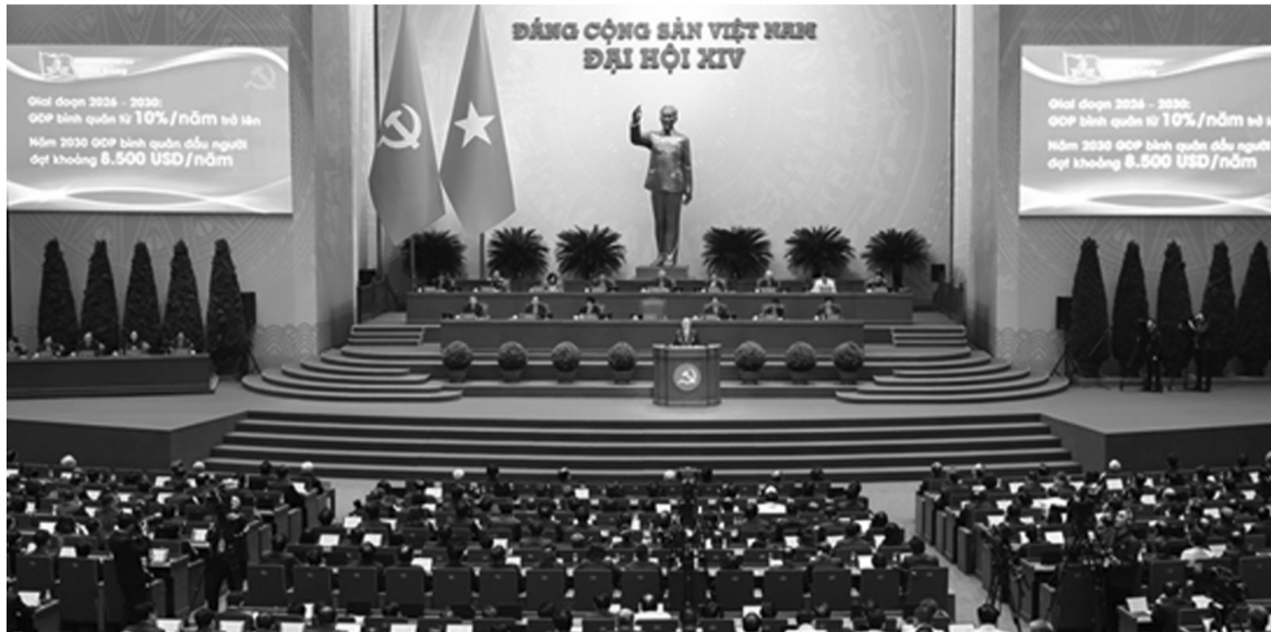
● Đại hội XIV của Đảng quán triệt sâu sắc quan điểm “dân là gốc”, Nhân dân là chủ thể, là trung tâm của công cuộc đổi mới, xây dựng và bảo vệ Tổ quốc.

Từ đó, mọi biểu hiện xa dân, quan liêu, hoặc thiếu trách nhiệm trong thực thi công vụ không phải là hạn chế về kỹ thuật quản lý nữa, mà là sự lệch chuẩn so với nguyên lý “vì dân” - làm suy giảm tính thuyết phục của hệ thống.