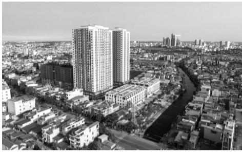
●Hải Phòng xác định đến 2030, quỹ đất dành riêng cho NOXH là 187,5ha.

TP xác định các nhóm giải pháp gồm: Hoàn thiện thể chế chính sách về nhà ở; quy hoạch và phát triển quỹ đất; nâng cao năng lực phát triển nhà ở theo dự án; huy động nguồn vốn; cải cách thủ tục hành chính, đầu tư... UBND các xã, phường, đặc khu có trách nhiệm triển khai tại địa bàn, phối hợp lập quy hoạch xây dựng các khu nhà ở, khu đô thị đồng bộ. NGUYỄN AN