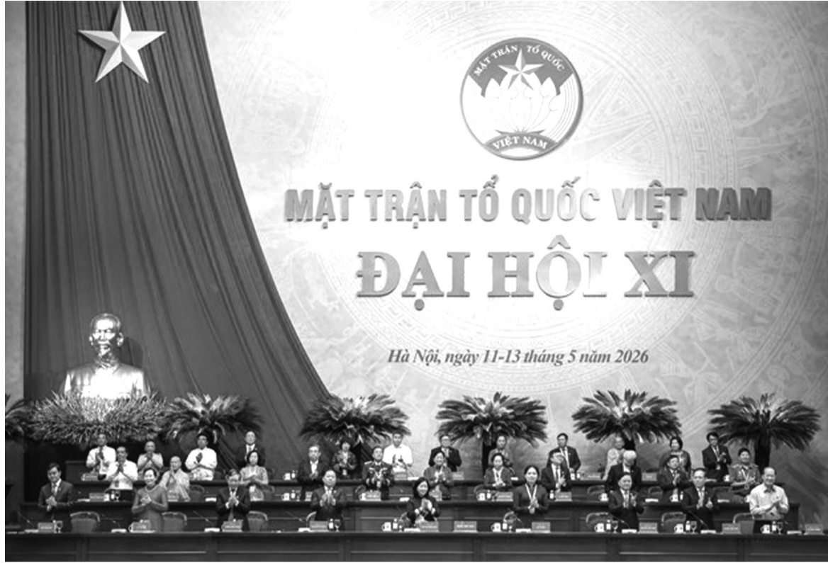
● Đoàn Chủ tịch điều hành phiên làm việc đầu tiên.