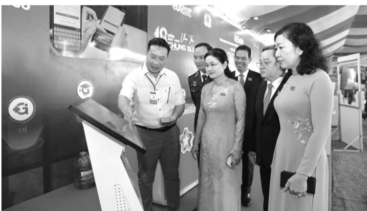
●Lãnh đạo TP Đồng Nai yêu cầu các sở, ngành, địa phương rà soát, đánh giá tổng thể hạ tầng công nghệ thông tin, hạ tầng kết nối, vùng phủ sóng để phục vụ công việc.

phân cấp phân quyền, quản lý tài sản công.