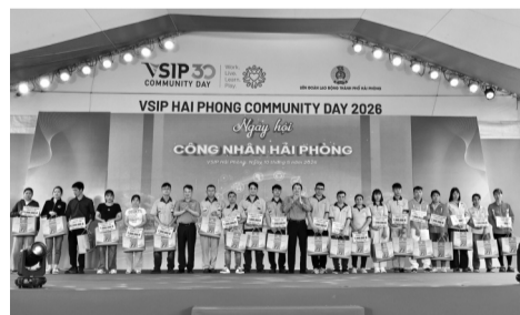
● Tặng quà cho công nhân có hoàn cảnh khó khăn.

Chương trình diễn ra với nhiều hoạt động như: Giải chạy “Green Run - Những bước chân khỏe đẹp” thu hút 2.739 người tham gia; hiến máu tình nguyện “Gieo yêu thương - Gặt hạnh phúc” thu hút 1.017 người đăng ký; Hội thi Rung chuông vàng với chủ đề