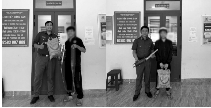
● Chương trình “Đổi tiếng pô ồn lấy hạt gạo thơm” do Công an phường Ba Ngòi triển khai.

Tiếng nẹt pô chát chúa, tiếng còi hơi inh ỏi không chỉ làm ô nhiễm tiếng ồn mà còn tiềm ẩn nguy cơ tai nạn giao thông. Khi nhiều địa phương bắt đầu mạnh tay xử lý thực trạng này, một thông điệp rõ ràng đang được phát đi: đã đến lúc phải trả lại sự bình yên cho đường phố.