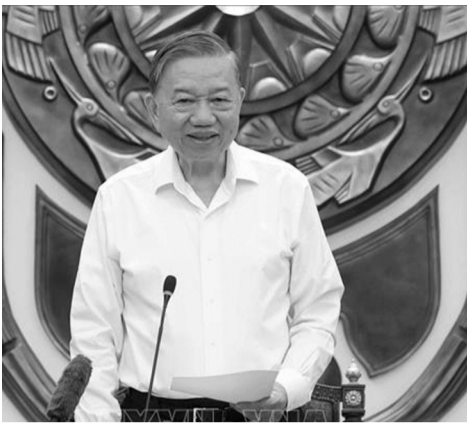
● Tổng Bí thư, Chủ tịch nước Tô Lâm phát biểu tại buổi làm việc.

Sáng 11/5, tại Hà Nội, Tổng Bí thư, Chủ tịch nước Tô Lâm đã làm việc với Văn phòng Chủ tịch nước, đánh giá tình hình, định hướng nhiệm vụ của cơ quan trong thời gian tới.