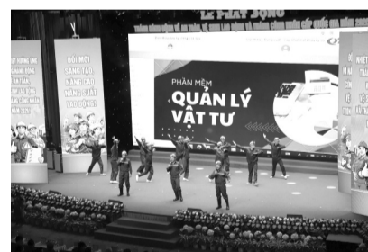
● Lễ phát động Tháng Công nhân và Tháng hành động về ATVSLĐ năm 2026 tại Quảng Ninh ngày 24/2/2026.

Theo Bộ Nội vụ, việc đề xuất sửa đổi Luật ATVSLĐ xuất phát từ thực tế thi hành giai đoạn 2016 - 2025 khi Báo cáo tổng kết thi hành Luật ATVSLĐ giai đoạn 2016 - 2025 cho thấy, dù hành lang pháp lý hiện hành đã góp phần quan