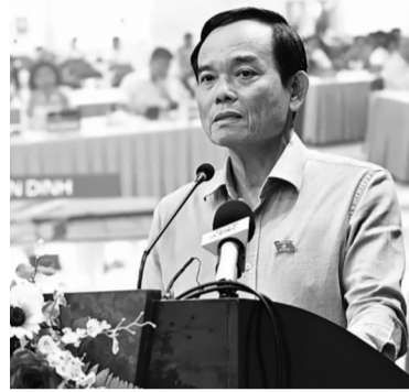
● Bí thư Thành ủy TP HCM Trần Lưu Quang trả lời cử tri.

Bí thư Thành ủy cho biết, sắp tới, Luật Nhà ở sẽ được sửa đổi nhằm giảm tiêu chí, thủ tục, giúp người dân dễ dàng tiếp cận nhà ở xã hội (NOXH) hơn. TP đang triển khai một mô hình vận hành mang tính đột phá là xây NOXH cho công nhân thuê hoặc mua, trong đó Liên đoàn Lao động TP đóng vai trò đầu mối kết nối giữa chủ đầu tư và DN. Tiền nhà sẽ được DN trừ trực tiếp vào lương hàng tháng của công nhân, giúp chủ đầu tư an tâm về dòng tiền, đồng thời tạo gắn kết người lao động gắn bó lâu dài với nhà máy. Hiện đã có khoảng 70.000 căn hộ được “chốt” phương án xây dựng theo cơ chế này, tạo cơ sở để TP vượt mức mục tiêu 200.000 căn NOXH. Cạnh đó, phân khúc nhà ở thương mại giá