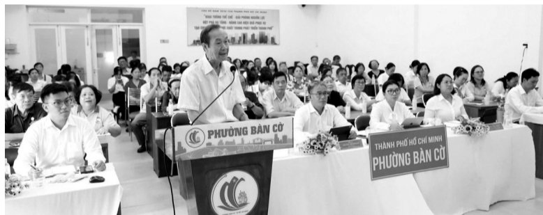
● Cuộc tiếp xúc cử tri được thực hiện theo hình thức trực tiếp và trực tuyến đến điểm cầu.

Bí thư Thành ủy đánh giá, đây sẽ là mô hình thí điểm quan trọng về công nghệ và quản lý vận hành trước khi thực hiện dự án đường sắt tốc độ cao Bắc - Nam. Ngoài ra, khi