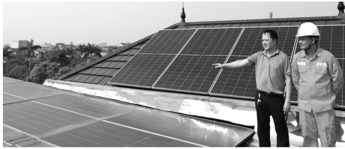
● Một công trình ĐMTMN của một hộ dân ở phường Thành Sen.

Nhu cầu sử dụng điện tăng cao trong mùa nắng nóng. Trong bối cảnh đó, tại Hà Tĩnh, điện mặt trời mái nhà (ĐMTMN) không chỉ giúp nhiều hộ dân, DN tiết giảm chi phí mà còn trở thành giải pháp quan trọng để giảm tải cho lưới điện, thúc đẩy chuyển dịch năng lượng xanh và phát triển bền vững.