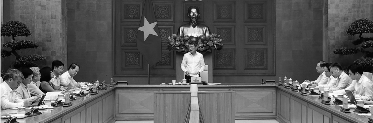
● Thủ tướng Chính phủ Lê Minh Hưng chủ trì cuộc làm việc.

Ngày 11/5, Thủ tướng Chính phủ Lê Minh Hưng chủ trì cuộc làm việc với Bộ Tư pháp về tình hình thực hiện nhiệm vụ từ đầu năm 2026 đến nay, phương hướng, nhiệm vụ trọng tâm trong thời gian tới, nhất là trong việc xây dựng, hoàn thiện thể chế phát triển đồng bộ, hiện đại, cạnh tranh để tạo đột phá, đáp ứng yêu cầu tăng trưởng 2 con số bền vững.