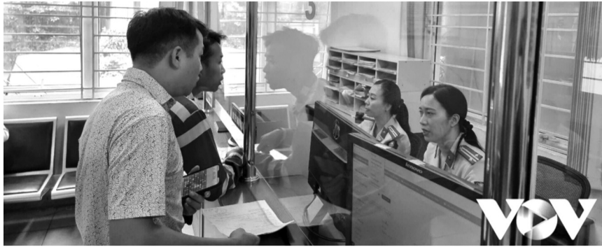
● Thông tư 17/2026/TT-BXD đã sửa đổi, bổ sung quy định về yêu cầu và hồ sơ đối với người học lái xe từ 1/7.

Người học lái xe để nâng hạng giấy phép lái xe phải đáp ứng theo quy định tại khoản 4 Điều 60 Luật Trật tự, an toàn giao thông đường bộ số 36/2024/QH15; trong đó, thời gian lái xe an toàn cho từng hạng giấy phép lái xe được quy định cụ thể như sau: Hạng B lên C1, B lên C, B lên D1, B lên BE, C1 lên C, C1 lên D1, C1 lên D2, C1 lên C1E, C lên D1, C lên D2, D1 lên