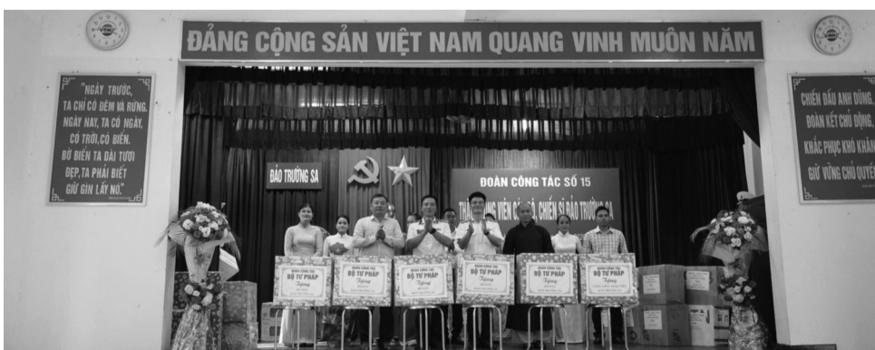
● Đoàn công tác Bộ Tư pháp tặng quà cán bộ, chiến sĩ và Nhân dân trên đảo Trường Sa.