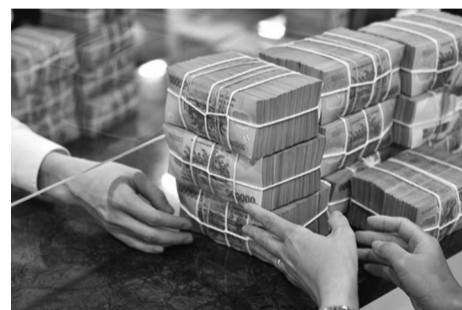
● Mặt bằng lãi suất cho vay đã có xu hướng giảm nhưng doanh nghiệp nhỏ và vừa vẫn khó tiếp cận.

Tuy nhiên, theo đại diện VINASME, cộng đồng doanh nghiệp nhỏ và vừa vẫn cần các chính sách hỗ trợ thuận lợi, thực chất hơn. Thực tế cho thấy, nhiều chương trình, quỹ hỗ trợ doanh nghiệp nhỏ và vừa chưa tạo được hiệu quả lan tỏa như kỳ vọng do số lượng doanh nghiệp tiếp cận được còn hạn chế. Đây