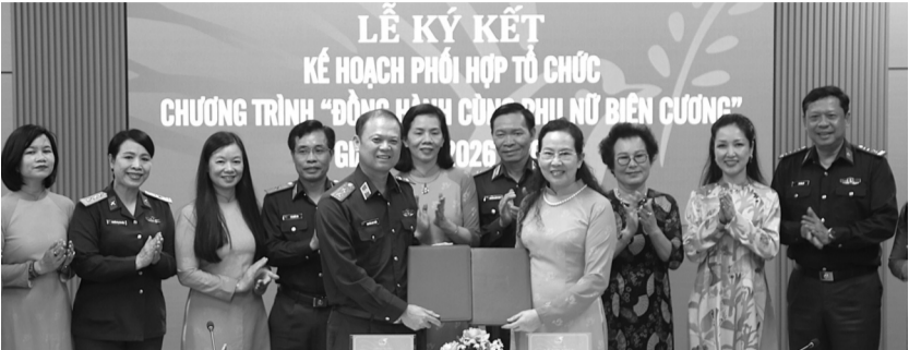
● Hội LHPN Việt Nam và Bộ Tư lệnh Bộ đội Biên phòng ký kết Chương trình giai đoạn 2026 - 2030.

Sinh thời, Chủ tịch Hồ Chí Minh từng khẳng định: “Non sông gấm vóc Việt Nam do phụ nữ ta, trẻ cũng như già, ra sức dệt thêu mà thêm tốt đẹp, rực rỡ”. Thực hiện lời căn dặn của Bác, các thế hệ phụ nữ Việt Nam đã không ngừng nỗ lực, phát huy truyền thống tốt đẹp, khẳng định vai trò và vị thế của mình trên nhiều lĩnh vực. Từ lao động sản xuất, phát triển kinh tế, xây dựng đời sống văn hóa đến tham gia bảo vệ chủ quyền, giữ gìn an ninh quốc gia, phụ nữ Việt Nam luôn thể hiện tinh thần trách nhiệm, bản lĩnh và sự cống hiến vì sự phát triển của đất nước.