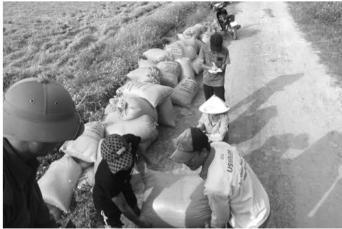
● Dù lúa được mùa nhưng chi phí sản xuất tăng cao khiến nhiều nông dân Quảng Trị không có lãi.