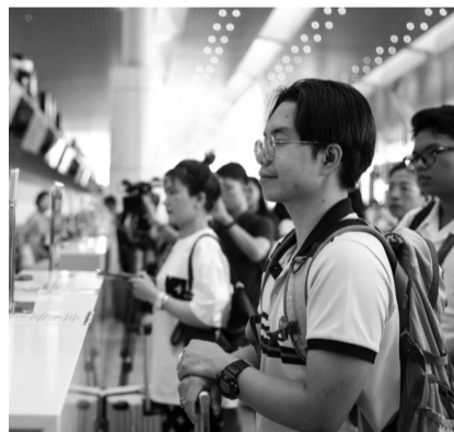
● Làm thủ tục bay tại sân bay Tân Sơn Nhất.

Với đề xuất đưa CHK Măng Đen, Vân Phong vào quy hoạch, Phó Thủ tướng Thường trực yêu cầu Bộ Xây dựng nghiên cứu kỹ trong tổng thể phát triển vùng, làm rõ khả năng kết nối với hệ thống giao thông đường bộ và các tuyến liên vùng, tiềm năng phát triển. Việc đầu tư cần được tính toán kỹ lưỡng về khả năng thu hút đầu tư trong nước, nước ngoài và yếu tố lưỡng dụng; nghiên cứu khả năng kết nối tổng thể với các CHK trong khu vực và hệ thống giao thông liên vùng.