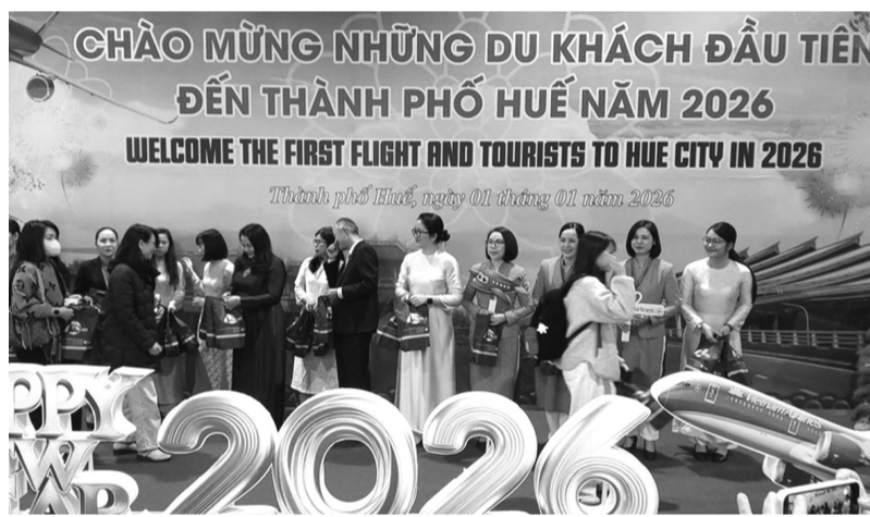
● Sở Du lịch chào mừng những du khách đầu tiên đến Huế năm 2026.

TS Minh cho rằng, Huế cần chuyển từ tư duy "làm nhiều hoạt