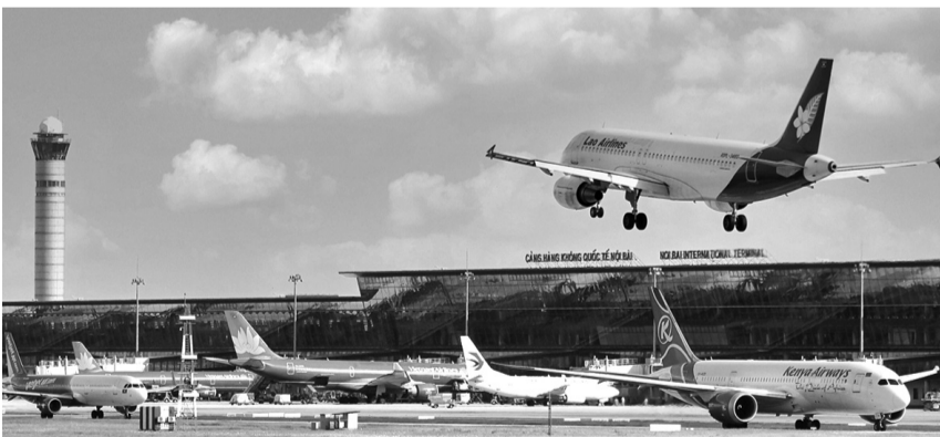
● Sân bay Nội Bài.

Hiện, Công an phường Đồng Sơn đã thu giữ 7 xe máy là tang vật và phương tiện liên quan. Đơn vị đang tiếp tục phối hợp với Phòng Cảnh sát hình sự, Công an tỉnh để củng cố hồ sơ, mở rộng điều tra và xử lý 2 người này theo quy định. LONG HUNG