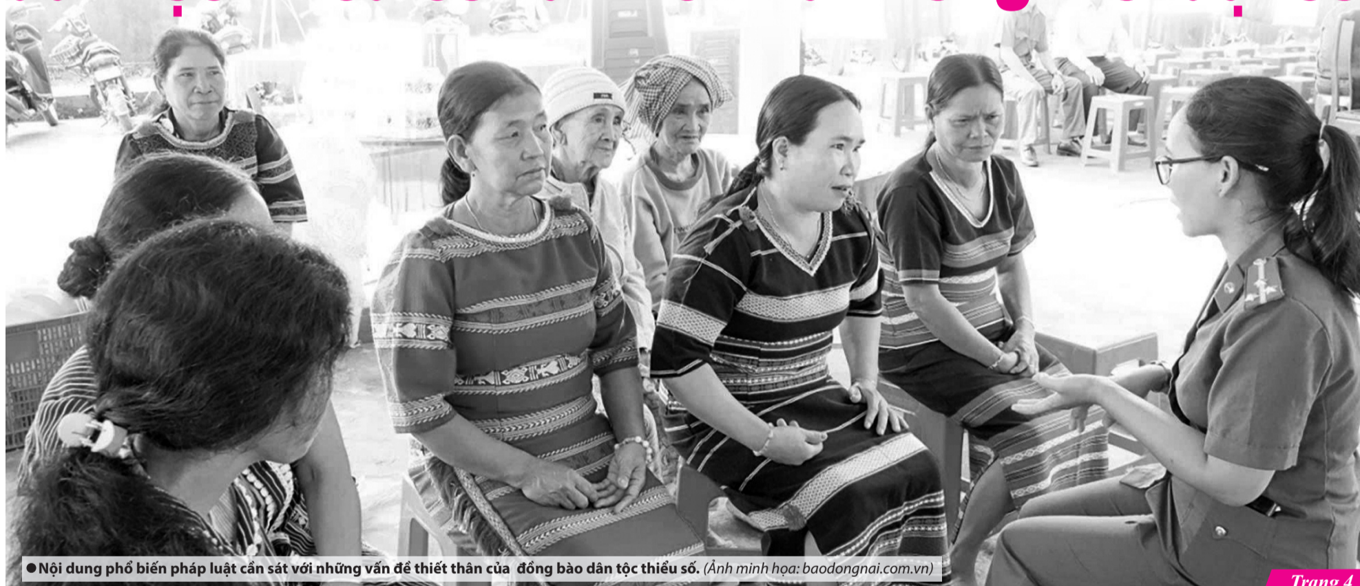
● Nội dung phổ biến pháp luật cần sát với những vấn đề thiết thân của đồng bào dân tộc thiểu số.