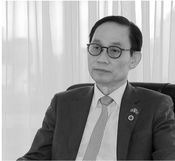
● Bộ trưởng Bộ Ngoại giao Lê Hoài Trung trả lời phỏng vấn báo chí.

Phát biểu chỉ đạo tại buổi lễ, Đại tướng Phan Văn