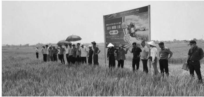
● Xã Hoàn Lão đang triển khai các mô hình nông nghiệp hữu cơ, nông nghiệp tuần hoàn nhằm nâng cao giá trị sản xuất.

Vụ Đông Xuân 2025 - 2026 tại Quảng Trị được đánh giá đạt năng suất khá, giá lúa không giảm với năm trước; nhưng chi phí vật tư, nhân công và dịch vụ sản xuất tăng cao khiến lợi nhuận người trồng lúa bị bào mòn, nhiều hộ dân lo thua lỗ, tính bỏ ruộng trong vụ Hè Thu.