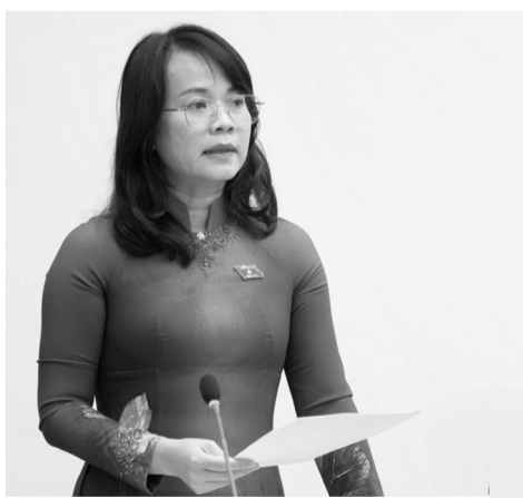
● Đại biểu Quốc hội Phạm Thị Hồng Yến.

Trong bối cảnh đó, Chính phủ đã trình QH xem xét, thông qua Nghị quyết nhằm xử lý các tồn tại, vướng mắc này ngay tại