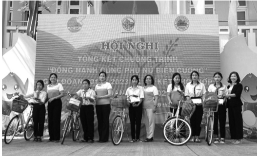
● Chương trình “Đồng hành cùng phụ nữ biên cương” đã đạt được kết quả đáng khích lệ trong hỗ trợ phụ nữ phát triển kinh tế, xóa đói, giảm nghèo, cải thiện cuộc sống.

Đặc biệt, Chương trình “Đồng hành cùng phụ nữ biên cương” còn mang ý nghĩa lớn lao về mặt xã hội và quốc phòng khi sự chung tay của lực lượng Bộ đội Biên phòng và cán bộ Hội LHPN cũng đã góp phần vun đắp mối quan hệ quân - dân khăng khít, tạo thế trận lòng dân bền vững giữa vùng đất địa đầu Tổ quốc, cùng nhau dựng xây một vùng biên cương vững