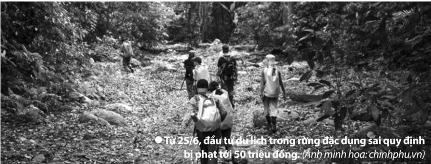
● Từ 25/6, đầu tư du lịch trong rừng đặc dụng sai quy định bị phạt tới 50 triệu đồng. (Ảnh minh họa: chinhphu.vn)

Đối với các diện tích lớn hơn, mức phạt từ 60 - 80 triệu đồng nếu lẩn chiếm từ 5ha