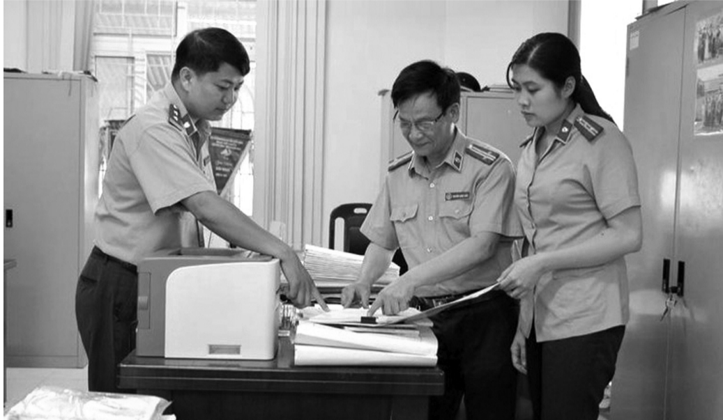
● Chấp hành viên trao đổi nghiệp vụ THADS.

6 tháng đầu năm, công tác thi hành án dân sự (THADS) đạt nhiều kết quả tích cực nhờ triển khai đồng bộ nhiều giải pháp, trong đó có việc quyết liệt đổi mới chỉ đạo, điều hành. Đây là yếu tố quan trọng mang tính quyết định để toàn hệ thống vận hành thông suốt, bảo đảm hoàn thành chỉ tiêu nhiệm vụ.