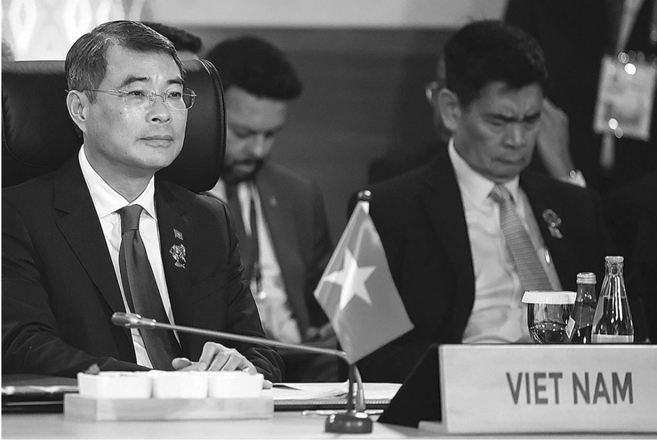
● Thủ tướng Chính phủ Lê Minh Hưng tham dự Phiên Toàn thể Hội nghị Cấp cao ASEAN lần thứ 48.

Thủ tướng Chính phủ Lê Minh Hưng và Đoàn đại biểu cấp cao Việt Nam vừa kết thúc tốt đẹp chuyến tham dự Hội nghị Cấp cao ASEAN lần thứ 48 tại Cebu, Philippines vào ngày 7 - 8/5. Đây là chuyến công tác nước ngoài đầu tiên của Thủ tướng Lê Minh Hưng trên cương vị người đứng đầu Chính phủ mới, qua đó tiếp tục khẳng định mạnh mẽ vai trò, vị thế và tinh thần chủ động, trách nhiệm của Việt Nam trong tiến trình xây dựng Cộng đồng ASEAN.