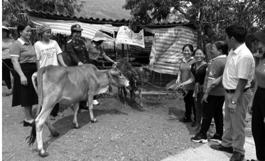
● Chương trình “Đồng hành cùng phụ nữ biên cương” đã đạt được kết quả đáng khích lệ trong hỗ trợ phụ nữ phát triển kinh tế, xóa đói, giảm nghèo, cải thiện cuộc sống.