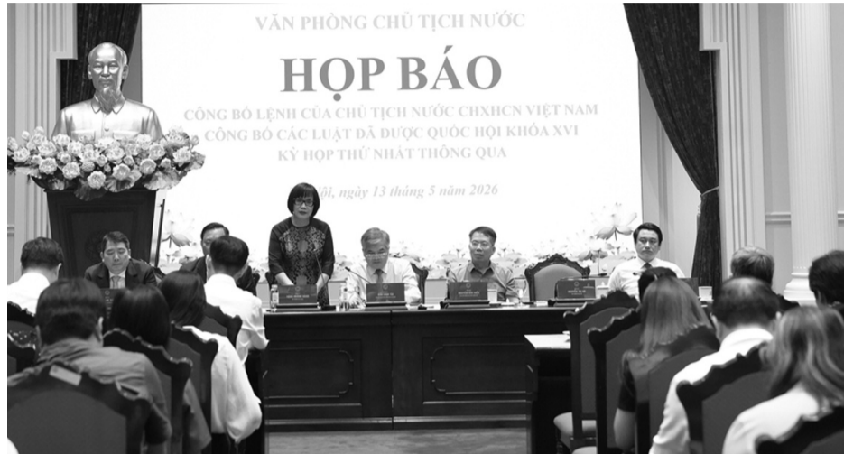
● Quang cảnh buổi họp báo