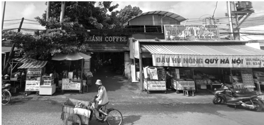
● Thửa đất nằm trong phạm vi 100m đầu tính từ ngã ba Tân Kim.