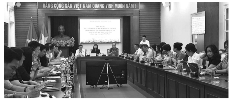
● Hội nghị xin ý kiến đối với dự thảo Kế hoạch của Thủ tướng Chính phủ triển khai đồng bộ hệ giá trị văn hóa, hệ giá trị quốc gia, hệ giá trị gia đình, chuẩn mực con người Việt Nam do Bộ VH,TT&DL tổ chức.

Ngày 13/5, Bộ Văn hóa, Thể thao và Du lịch (VH,TT&DL) tổ chức Hội nghị xin ý kiến đối với dự thảo Kế hoạch của Thủ tướng Chính phủ triển khai đồng bộ hệ giá trị văn hóa, hệ giá trị quốc gia, hệ giá trị gia đình, chuẩn mực con người Việt Nam (Kế hoạch).