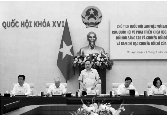
● Chủ tịch Quốc hội Trần Thanh Mẫn phát biểu tại cuộc làm việc.

Đây là yêu cầu được Chủ tịch Quốc hội (QH) Trần Thanh Mẫn đưa ra khi chủ trì cuộc làm việc với Ban Chỉ đạo của QH về phát triển khoa học, công nghệ, đổi mới sáng tạo và chuyển đổi số (CĐS) quốc gia và Ban Chỉ đạo CĐS của QH sáng 13/5.