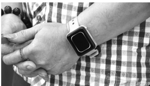
●Người nghiện ma túy được đeo thiết bị GSDT tại Điện Biên.

Hiện 100% CSCNMT đã thực hiện đánh giá, phân loại người cai nghiện ngay từ khi tiếp nhận để xây dựng kế hoạch cai nghiện phù hợp từng trường hợp. Các cơ sở cũng tổ chức học tập nội quy, giáo dục chính trị, pháp luật, kỹ năng sống, học văn hóa, xóa mù chữ và tư vấn tái hòa nhập cộng đồng cho người sắp hết thời hạn cai nghiện. Một số DN, cơ sở sản xuất kinh doanh cũng đã tiếp nhận, ký hợp đồng lao động với người sau cai nghiện theo giới thiệu của các CSCNMT.