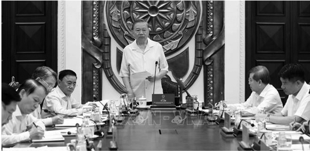
● Tổng Bí thư, Chủ tịch nước Tô Lâm phát biểu chỉ đạo tại buổi làm việc.