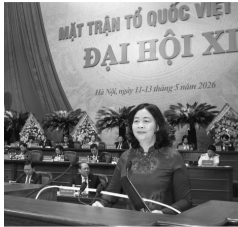
● Ủy viên Bộ Chính trị, Bí thư Trung ương Đảng, Chủ tịch Ủy ban Trung ương MTTQ Việt Nam Bùi Thị Minh Hoài phát biểu tại phiên bế mạc Đại hội.