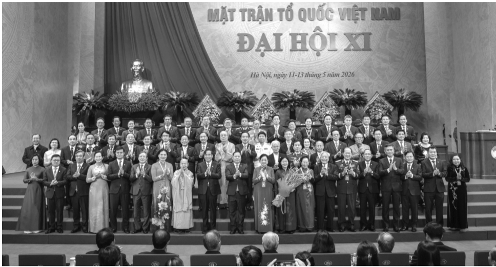
● Ra mắt Đoàn Chủ tịch Ủy ban Trung ương MTTQ Việt Nam Khóa XI.

Với tinh thần “Đoàn kết - Dân chủ - Đổi mới - Sáng tạo - Phát triển”, sau 2,5 ngày làm việc khẩn trương, nghiêm túc, trách nhiệm và hiệu quả, sáng 13/5, Đại hội đại biểu toàn quốc Mặt trận Tổ quốc Việt Nam lần thứ XI (Đại hội) đã hoàn thành chương trình đề ra và tiến hành phiên bế mạc.