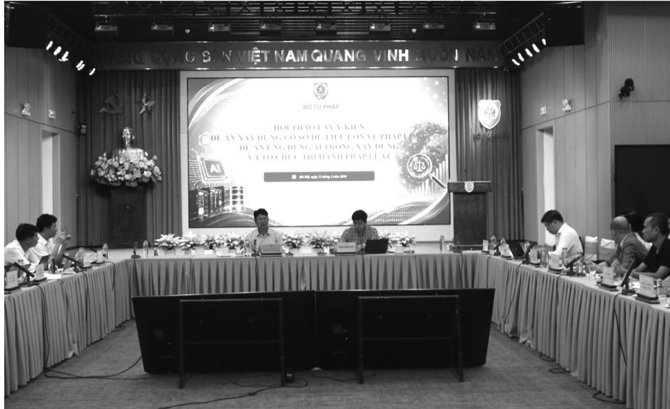
● Quang cảnh Hội thảo.

Báo cáo tại Hội thảo, đại diện Cục Công nghệ thông tin cho biết, Đề án “Xây dựng CSDL lớn về pháp luật” nhằm hình thành nguồn dữ liệu pháp luật thống nhất, dùng chung trên toàn quốc, phục vụ nâng cao hiệu quả xây dựng và thi hành pháp luật. Đề án