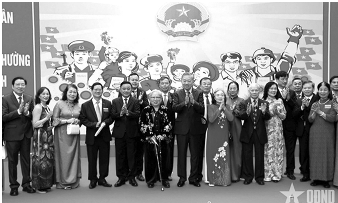
● Tổng Bí thư (nay là Tổng Bí thư, Chủ tịch nước) Tô Lâm cùng các đại biểu và cử tri trong Ngày bầu cử đại biểu Quốc hội khóa XVI (nhiệm kỳ 2026 - 2031) và đại biểu HĐND các cấp tại Khu vực bỏ phiếu số 2 phường Ba Đình, TP Hà Nội.

hành pháp luật ở cơ sở trong giai đoạn hiện nay, không thể chỉ dừng lại ở việc cải tiến quy trình hay hoàn thiện kỹ thuật hành chính, mà cần một cách tiếp cận mang tính chuyên đổi mô hình - từ quản lý thủ tục sang quản trị niềm tin xã hội. Đây không chỉ là sự thay đổi về phương thức vận hành, mà là sự điều chỉnh căn bản trong tư duy quản trị nhà nước, lấy trải nghiệm và mức độ hài lòng của người dân làm trung tâm đánh giá.