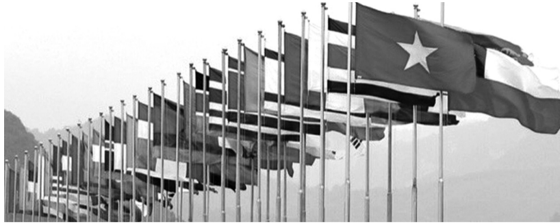
● Bổ sung nguyên tắc hoạt động thông tin đối ngoại trên không gian mạng từ 1/7. (Ảnh minh họa: chinhphu.vn)

Chính phủ vừa ban hành Nghị định 148/2026/NĐ-CP sửa đổi, bổ sung một số điều của Nghị định 72/2015/NĐ-CP về quản lý hoạt động thông tin đối ngoại; trong đó bổ sung nguyên tắc hoạt động thông tin đối ngoại trên không gian mạng.