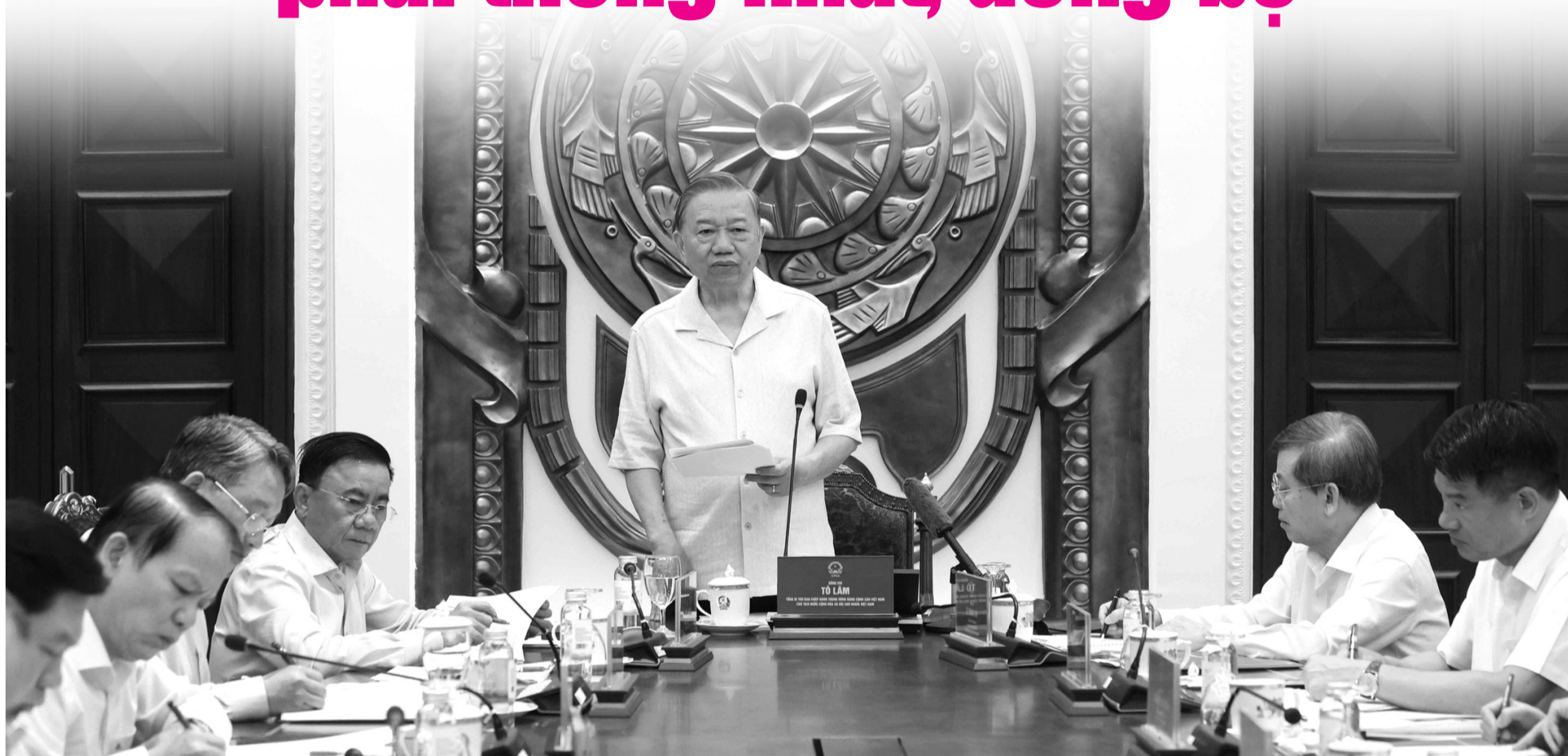
● Tổng Bí thư, Chủ tịch nước Tô Lâm phát biểu chỉ đạo tại cuộc họp.

Ngày 13/5, tại Hà Nội, Tổng Bí thư, Chủ tịch nước Tô Lâm chủ trì buổi làm việc với một số Bộ, ban, ngành, cơ quan về tổ chức, hoạt động của Ban Chỉ đạo Trung ương về hoàn thiện thể chế, pháp luật và Ban Chỉ đạo cải cách tư pháp Trung ương.