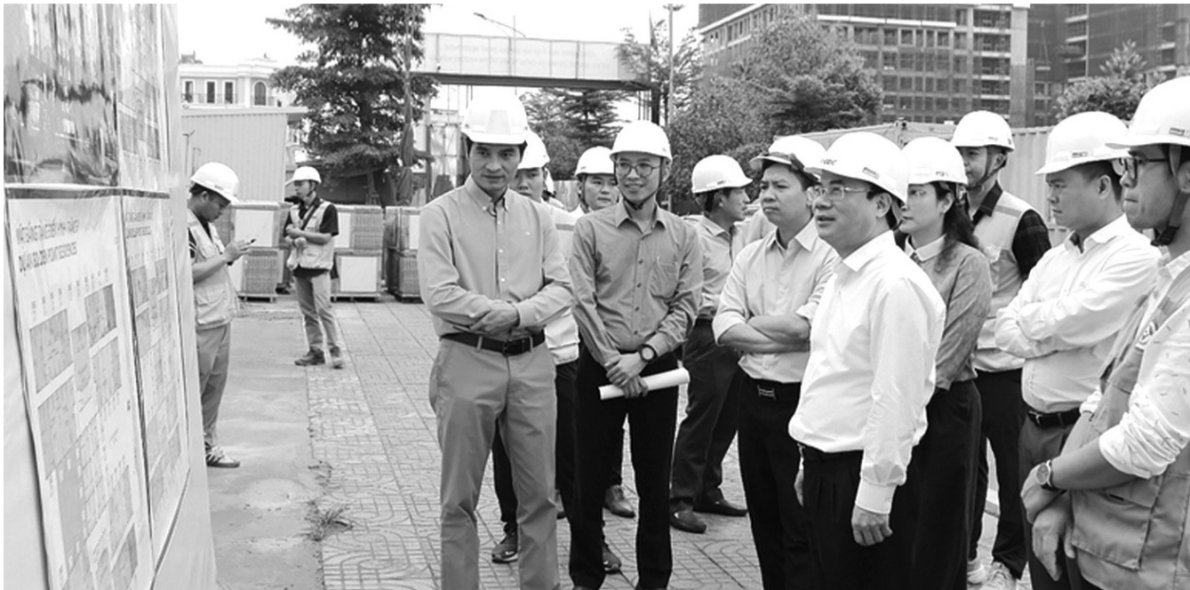
● Lãnh đạo Bộ Xây dựng kiểm tra, đôn đốc triển khai thực hiện các dự án NOXH trên địa bàn TP Hải Phòng mới đây. (Ảnh: PV)

Trong bối cảnh giá nhà thương mại liên tục tăng, nhu cầu nhà ở của người thu nhập thấp và công nhân khu công nghiệp ngày càng lớn, mục tiêu hoàn thành gần 160.000 căn nhà ở xã hội (NOXH) trong năm 2026 đang trở thành nhiệm vụ trọng tâm của nhiều địa phương. Bộ Xây dựng vừa ban hành Công điện đề nghị các địa phương triển khai hàng loạt giải pháp về quỹ đất, thủ tục đầu tư, tín dụng ưu đãi và cơ chế đặc thù đang được thúc đẩy nhằm tạo “luồng xanh” cho các dự án NOXH tăng tốc về đích.