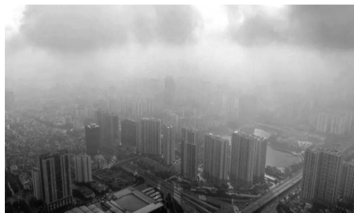
Viễn thám cho phép giám sát trên diện rộng, cập nhật nhanh và có khả năng phát hiện sớm các biến động bất thường của ô nhiễm không khí.

Cục Viễn thám quốc gia (Bộ NN&MT) đang xây dựng Thông tư quy chuẩn kỹ thuật giám sát chất lượng không khí bằng công nghệ viễn thám, nhằm hiện đại hóa quan trắc môi trường quốc gia. Không giống phương pháp quan trắc truyền thống phụ thuộc vào các trạm đo cố định, viễn thám cho phép giám sát trên diện rộng, cập nhật nhanh và có khả năng phát hiện sớm các biến động bất thường của ô nhiễm không khí.