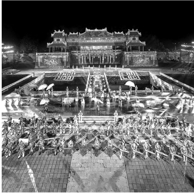
● Festival Huế gắn với di sản cung đình thu hút hàng triệu du khách. (Ảnh: Nhật Anh)