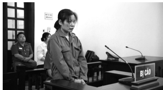
● HĐXX nhận định bị cáo Bắc "đã đối xử tàn ác, làm nhục người lệ thuộc mình là người già yếu, ốm đau, không có khả năng tự vệ".

Theo HĐXX, công việc chăm sóc người già đòi hỏi sự kiên nhẫn, yêu thương, trách nhiệm. Tuy nhiên, hành vi của bị cáo thể hiện sự thô bạo, thiếu tình thương với người mà mình được thuê chăm sóc.