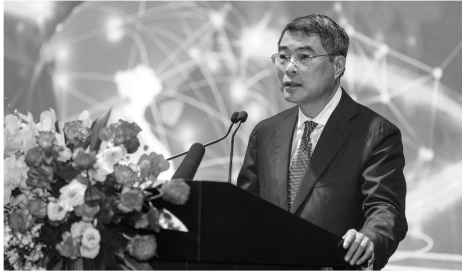
● Thủ tướng Chính phủ Lê Minh Hưng phát biểu tại sự kiện.

Thủ tướng nhấn mạnh, doanh nghiệp, viện, trường phải là trung tâm của hệ sinh thái; các Bộ, ngành cần nhanh chóng xây dựng nhiệm vụ, đặt hàng doanh nghiệp, viện, trường để phát