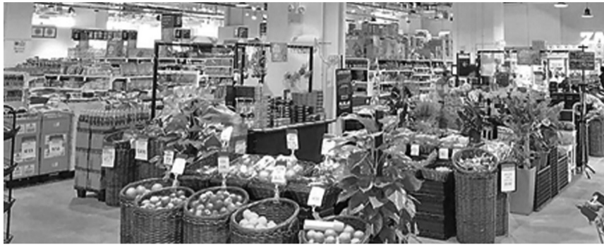
● Việt Nam đang đứng trước cơ hội lớn để chinh phục thị trường Halal.