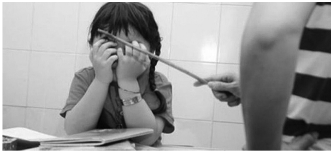
Trẻ em bị bạo hành sẽ chịu nhiều di chứng nặng nề, nhất là về tâm lý.