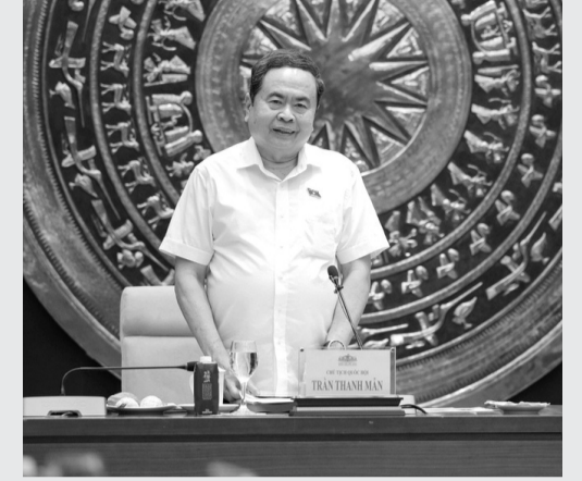
● Chủ tịch QH Trần Thanh Mẫn chủ trì cuộc làm việc với Thường trực Ủy ban Văn hóa và Xã hội.

Ngày 18/5, chủ trì cuộc làm việc với Thường trực Ủy ban Văn hóa và Xã hội của Quốc hội (QH) về tình hình triển khai các nhiệm vụ trọng tâm năm 2026 và định hướng các nhiệm vụ cho cả nhiệm kỳ của Ủy ban, Bí thư Đảng ủy QH, Chủ tịch QH Trần Thanh Mẫn yêu cầu Ủy ban tiếp tục đổi mới tư duy, cách làm, nâng cao chất lượng công tác lập pháp, giám sát, tham mưu chính sách; trong đó cần theo sát đến cùng các vấn đề thuộc lĩnh vực văn hóa, xã hội.