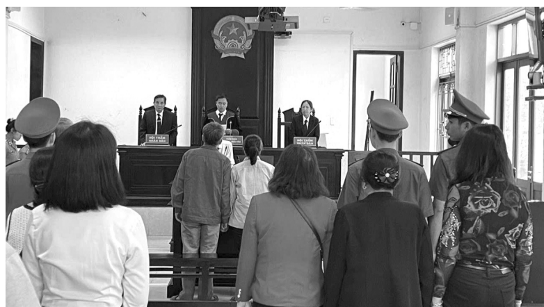
● Tòa nghị án kéo dài và dự kiến sẽ tuyên án vào ngày 22/5.

HĐXX tiến hành nghị án kéo dài và dự kiến sẽ tuyên án vào ngày 22/5. BÙI YẾN