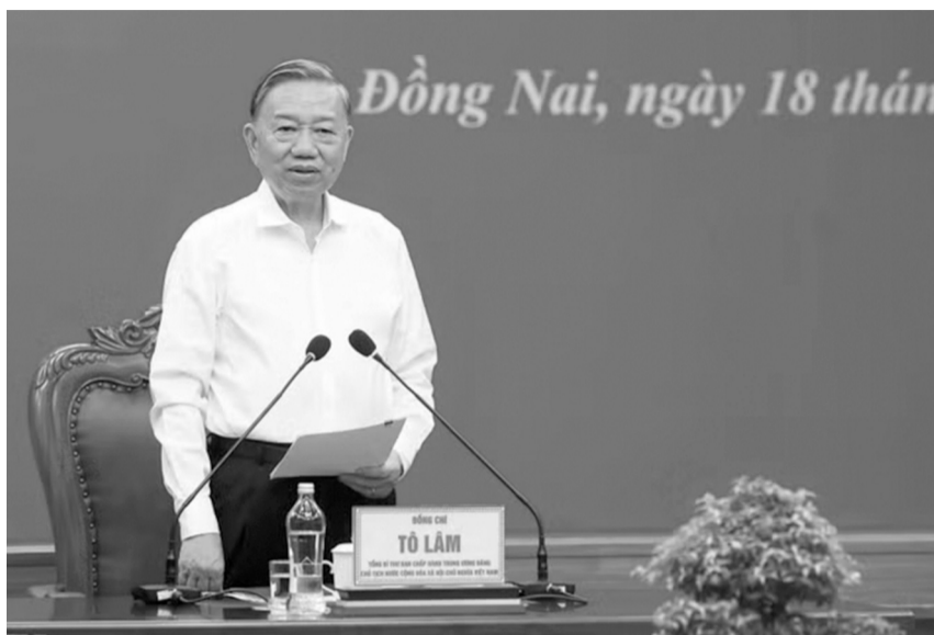
● Tổng Bí thư, Chủ tịch nước Tô Lâm phát biểu chỉ đạo.

Chiều 18/5, tại TP Đồng Nai, Tổng Bí thư, Chủ tịch nước Tô Lâm và Đoàn công tác của Trung ương đã làm việc với Ban Thường vụ Thành ủy Đồng Nai về tình hình triển khai Nghị quyết Đại hội Đảng toàn quốc lần thứ XIV và một số nhiệm vụ trọng tâm thời gian tới.