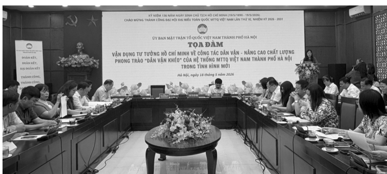
● Quang cảnh Tọa đàm.

Chiều 18/5, Ban Thường trực Ủy ban Mặt trận Tổ quốc (MTTQ) Việt Nam TP Hà Nội tổ chức Tọa đàm Vận dụng tư tưởng Hồ Chí Minh về công tác dân vận - Nâng cao chất lượng phong trào “Dân vận khéo” của hệ thống MTTQ Việt Nam TP Hà Nội trong tình hình mới. Đây là hoạt động nhằm tiếp tục quán triệt sâu sắc tư tưởng Hồ Chí Minh về công tác dân vận; triển khai thực hiện Chỉ thị số 10-CT/TU ngày 25/3/2026 của Ban Thường vụ Thành ủy Hà Nội về nâng cao chất lượng, hiệu quả phong trào thi đua “Dân vận khéo” trong tình