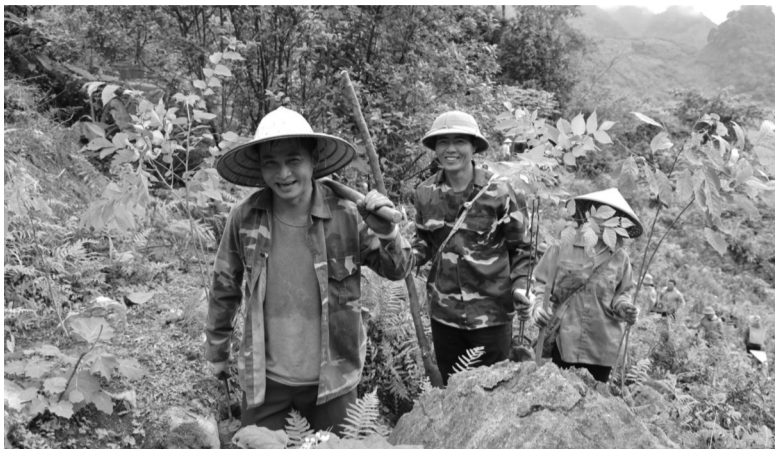
● Cộng đồng địa phương tham gia trồng rừng trong chương trình “Rừng Xanh Lên 2026”.

Thực tế công tác bảo tồn đa dạng sinh học, cộng đồng địa phương giữ vai trò quan trọng, khi mỗi sáng kiến và hành động cụ thể đều tạo ra những tác động tích cực, lan tỏa ý thức bảo vệ thiên nhiên, bảo tồn đa dạng sinh học. Vì vậy, Ngày Quốc tế Đa dạng sinh học 2026 chọn chủ đề “Hành động ở cấp địa phương để tạo ảnh hưởng toàn cầu”.