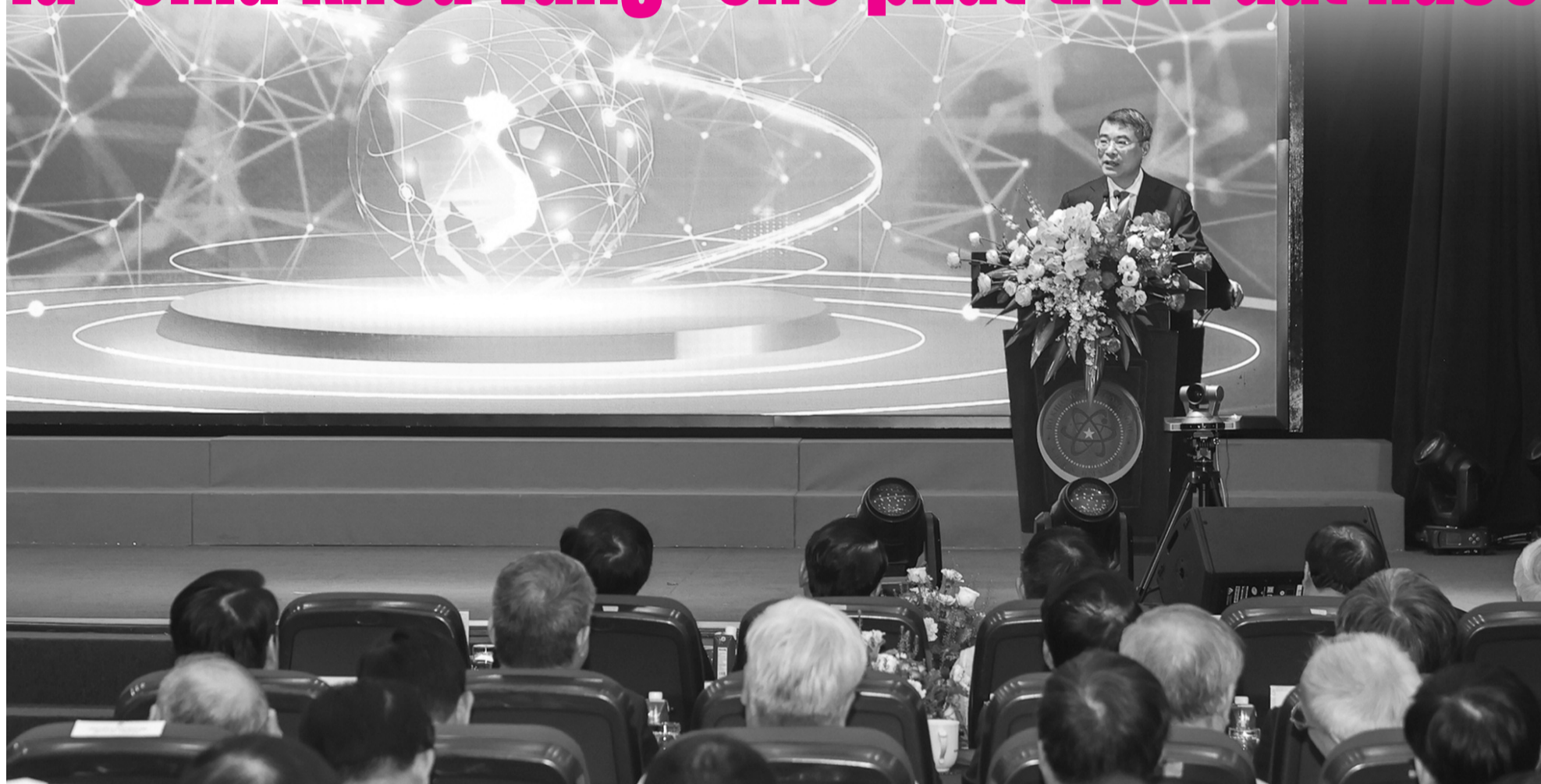
● Thủ tướng Lê Minh Hưng nhấn mạnh, chúng ta đang sống trong thời đại mà KHCN, đổi mới sáng tạo phát triển và thay đổi từng ngày, cạnh tranh toàn cầu ngày càng tăng.

Sáng 18/5, tại Hà Nội, Thủ tướng Chính phủ Lê Minh Hưng dự Lễ chào mừng Ngày Khoa học, Công nghệ và Đổi mới sáng tạo Việt Nam (18/5) và Hội nghị triển khai công nghệ chiến lược với chủ đề “Khoa học, công nghệ, đổi mới sáng tạo và chuyển đổi số - Động lực chính của mô hình tăng trưởng mới”.