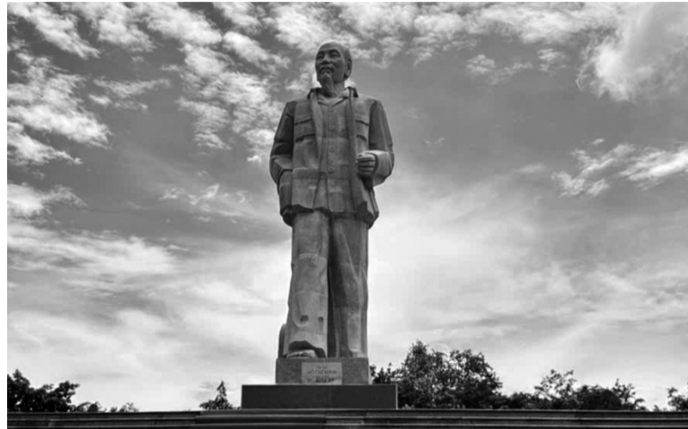
● Tượng đài Bác Hồ trên Quảng trường Hồ Chí Minh tại tỉnh Nghệ An.

Trong chuyến thăm Việt Nam năm 2015, Tổng Bí thư, Chủ tịch nước Trung Quốc Tập Cận Bình từng phát biểu: “Trong lòng người dân Trung Quốc như thế hệ chúng tôi, Chủ tịch Hồ Chí Minh là người bạn thân thiết nhất của Nhân dân Trung Quốc, chúng tôi gọi Chủ tịch Hồ Chí Minh là Bác Hồ”. Lời phát biểu ấy cho thấy hình ảnh Chủ tịch