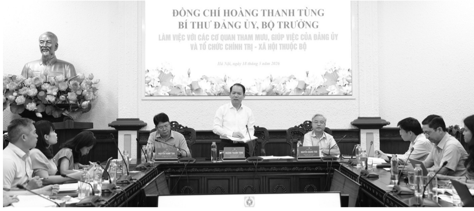
● Quang cảnh cuộc làm việc chiều 18/5.