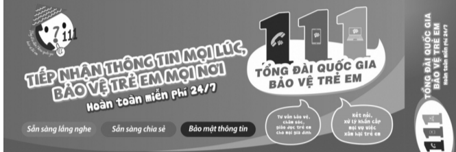
Cần phổ biến rộng rãi hơn nữa các kênh tiếp nhận thông tin bảo vệ trẻ em, đặc biệt là Tổng đài quốc gia 111.