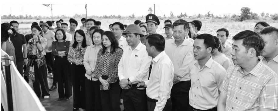
● Đoàn công tác khảo sát thực địa Dự án đầu tư xây dựng tuyến đường sắt Lào Cai - Hà Nội - Hải Phòng tại vị trí quy hoạch ga đường sắt phía Nam Hải Phòng thuộc địa bàn xã Kiến Minh.

Ngày 18/5, Ủy viên Trung ương Đảng, Phó Chủ tịch Quốc hội Nguyễn Hồng Diên cùng Đoàn công tác của Ủy ban Kinh tế và Tài chính của Quốc hội đã làm việc với UBND TP Hải Phòng về thực hiện mục tiêu tăng trưởng hai con số và triển khai các dự án trọng điểm quốc gia trên địa bàn.