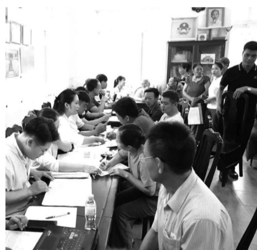
● Xã Thanh Oai chi trả hơn 45,5 tỷ đồng bồi thường, hỗ trợ GPMB tại thôn Kim Thành. (Ảnh minh họa - Nguồn: Hanoi.gov.vn)