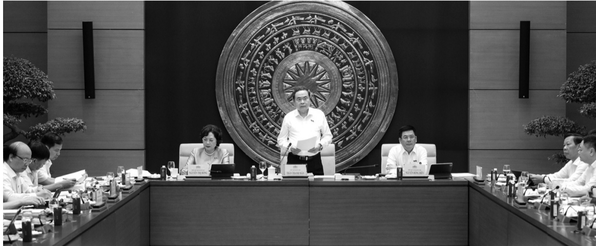
● Quang cảnh cuộc làm việc của Chủ tịch Quốc hội với Thường trực Ủy ban Kinh tế và Tài chính.