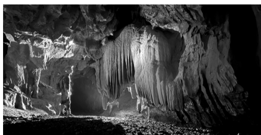
● Hang Nước Lặn tại xã Tân Thành và xã Tuyên Lâm dài 2.721m.