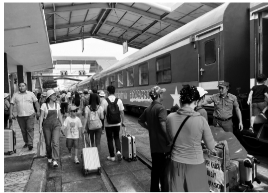
● Đường sắt hiện đang là lựa chọn được nhiều gia đình hướng đến trong các mùa cao điểm du lịch. (Ảnh: PV)

Nếu đường bộ, đường sắt và đường thủy giữ vai trò kết nối nội vùng thì hàng không vẫn là “xương sống” của du lịch Việt Nam, đặc biệt với khách quốc tế. Chia sẻ với truyền thông, ông Ưông Việt Dũng - Cục trưởng Cục Hàng không Việt Nam cho biết, thống kê cho thấy, khoảng 80% khách du lịch quốc tế đến Việt Nam sử dụng đường hàng không, vận tải hàng không cũng là phương thức chủ đạo đối với nhiều điểm đến nội địa; nguồn khách du lịch cũng chiếm tới 70% tổng lượng vận chuyển của các hãng hàng không.