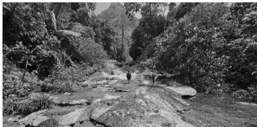
● Để tiếp cận, phát hiện các hang động mới, đoàn khảo sát đã phải vượt qua nhiều địa hình khó khăn.