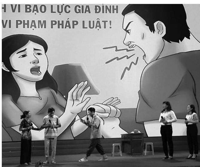
● Chương trình tuyên truyền về phòng, chống bạo lực gia đình của phụ nữ thành phố Cần Thơ.

Luật Trẻ em của Việt Nam đã quy định rõ trẻ có quyền bí mật đời sống riêng tư, bí mật cá nhân. Luật An ninh mạng và các quy định về bảo vệ dữ liệu cá nhân cũng nghiêm cấm việc đăng tải, phát tán thông tin cá nhân gây tổn hại tới danh dự, nhân phẩm người khác, bao gồm trẻ vị thành niên.