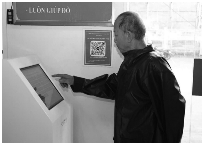
● Người dân thực hiện các thủ tục hành chính trực tuyến tại Trung tâm Phục vụ hành chính công xã Đại Phước. (Ảnh trong bài: Tiến Dũng)