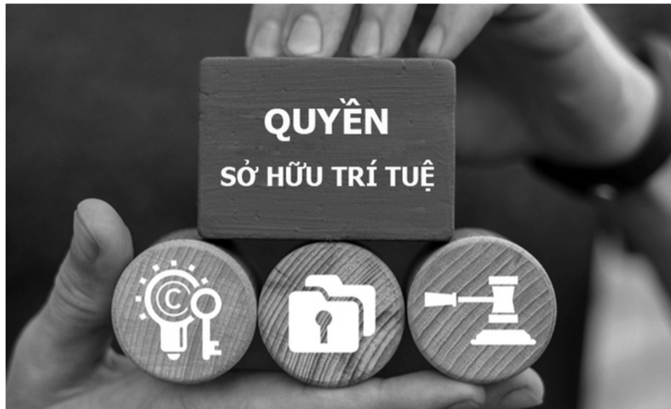
● Việt Nam đang nỗ lực tăng cường thực thi quyền sở hữu trí tuệ.

Trong khi đó, một số nền tảng phát sóng bóng đá và phim lậu khác vẫn tiếp tục hoạt động, cho thấy cuộc chiến chống