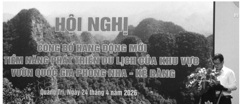
● Hội nghị công bố hang động mới do BQLVQG Phong Nha - Kẻ Bàng tổ chức.

Còn phải nhắc đến hang Chả Nghèo với cấu trúc dạng giếng đứng sâu, bên trong có thác nước và dòng suối ngầm phức tạp. Những phát hiện này tiếp tục cho thấy tiềm năng tồn tại những hệ thống hang động quy mô lớn chưa được khám phá hết trong khu vực.