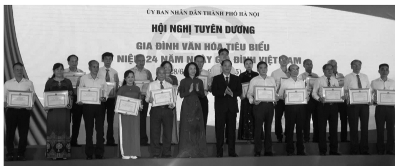
● Năm 2025, nhân dịp kỷ niệm 24 năm Ngày Gia đình Việt Nam (28/6/2001 - 28/6/2025), UBND Thành phố Hà Nội đã tuyên dương 80 Gia đình văn hóa Thủ đô tiêu biểu năm 2025.

phong trào thi đua tại địa phương. Các gia đình được tuyên dương năm nay có sự đa dạng về thành phần, từ cựu chiến binh, giáo viên, công nhân, doanh nhân, lực lượng vũ trang đến các gia đình thanh niên, gia đình dân tộc, tôn giáo... Dù ở những hoàn cảnh và công việc khác nhau, họ đều là những tấm gương tiêu biểu trong