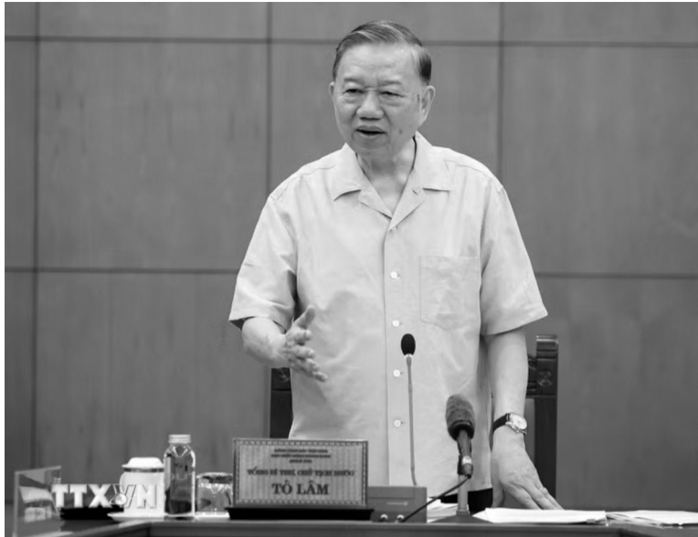
● Tổng Bí thư, Chủ tịch nước Tô Lâm chủ trì buổi làm việc với Ban Chính sách, chiến lược Trung ương.

Đồng thời, phải rà soát, phân loại và xử lý dứt điểm các nguồn lực đang chậm đưa vào sử dụng như quy hoạch treo, dự án vướng thủ tục, dự án chậm triển khai, đất công không sử dụng, tài sản công sử dụng kém hiệu quả, tài sản tranh chấp, các vụ án, vụ việc tồn đọng. Không để nguồn lực quốc gia nằm im trong thủ tục, trong tranh chấp, trong tâm lý sợ trách