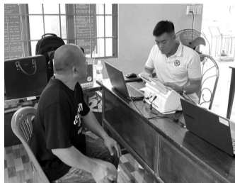
● Cán bộ xã Đại Phước thực hiện mô hình "Giờ vàng thứ Bảy, hành chính không khoảng cách".

Thời gian qua, các địa phương tại TP Đồng Nai đã chủ động đề xuất, triển khai nhiều sáng kiến trong cải cách hành chính (CCHC), nhất là các mô hình gắn với chuyển đổi số (CDS); hướng đến giải quyết thủ tục hành chính (TTHC) nhanh hơn, minh bạch hơn, giúp người dân tiếp cận dịch vụ công thuận tiện hơn.