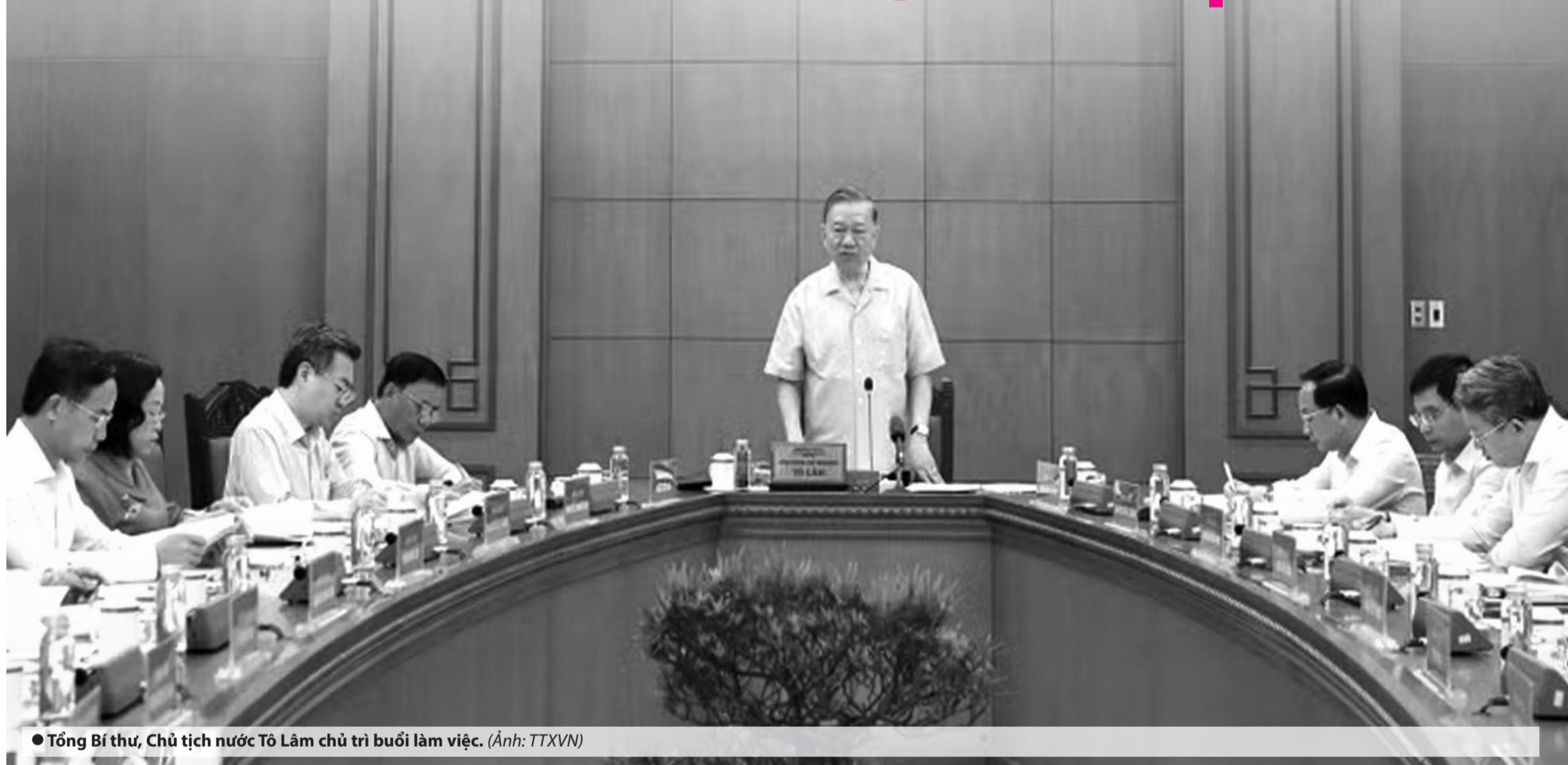
● Tổng Bí thư, Chủ tịch nước Tô Lâm chủ trì buổi làm việc.

Sáng 20/5, tại Trụ sở Trung ương Đảng, Tổng Bí thư, Chủ tịch nước Tô Lâm chủ trì buổi làm việc với Ban Chính sách, chiến lược Trung ương và các cơ quan liên quan về đánh giá nguồn lực phát triển đất nước gắn với thực hiện mục tiêu phấn đấu tăng trưởng kinh tế 2 con số và xác lập mô hình tăng trưởng mới.