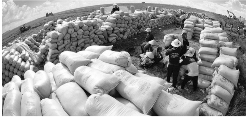
● Giá lúa gần 10 năm dao động tăng rất ít trong khi vật tư nông nghiệp tăng cao.

Theo Cục Trồng trọt và Bảo vệ thực vật (Bộ Nông nghiệp và Môi trường), việc giảm dần diện tích canh tác lúa tại Đồng bằng sông Cửu Long (ĐBSCL) đang trở thành định hướng phát triển ở nhiều địa phương, khi hiệu quả kinh tế từ cây lúa ngày càng thấp trong bối cảnh chi phí đầu vào tăng cao; biến đổi khí hậu diễn biến khốc liệt và nhu cầu tái cơ cấu nông nghiệp ngày càng cấp thiết.