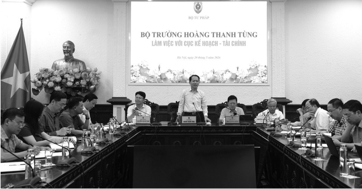
● Bộ trưởng Bộ Tư pháp Hoàng Thanh Tùng phát biểu tại cuộc làm việc.