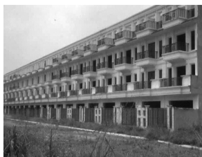
● Dự án Khu dân cư Bình Đa đã bị tạm dừng từ nhiều năm.

UBND TP Đồng Nai vừa ban hành Quyết định số 177/QĐ-UBND về việc bãi bỏ toàn bộ các quyết định chấp thuận chủ trương đầu tư, điều chỉnh chấp thuận chủ trương đầu tư dự án Khu dân cư Bình Đa, tại phường Bình Đa, Biên Hòa cũ, nay là phường Tam Hiệp, TP Đồng Nai. Động thái này diễn ra sau thời gian dài dự án bị thanh tra, khởi tố vụ án và xem xét trách nhiệm các tổ chức, cá nhân liên quan đến sai phạm đất đai.