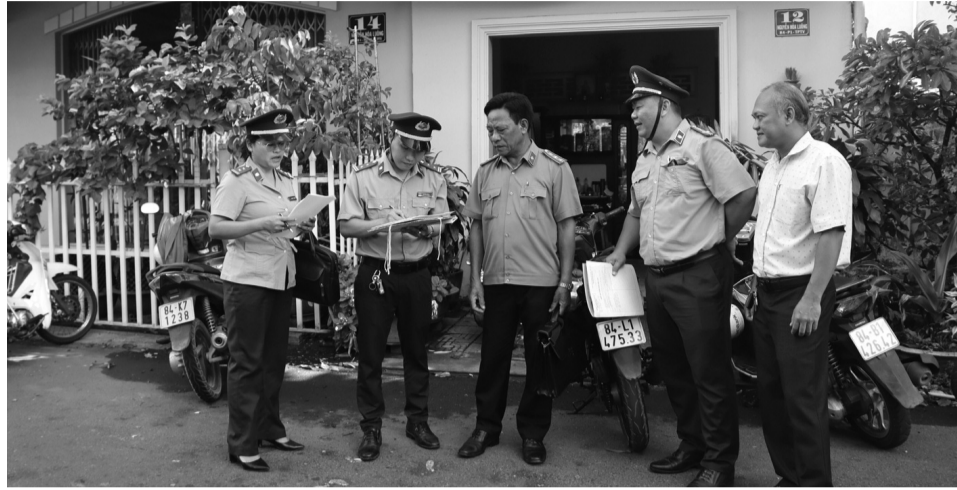
● Một cuộc cưỡng chế THADS ở Vĩnh Long.

Ngoài ra, chúng tôi tập trung chỉ đạo xử lý dứt điểm các vụ việc có giá trị lớn, án tín dụng ngân hàng, án tham nhũng, kinh tế; nâng cao chất lượng xác minh, phân loại án; ứng dụng mạnh mẽ công nghệ thông tin, chữ ký số, thực hiện tốt các