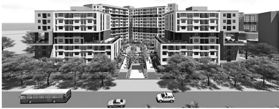
● Phối cảnh dự án nhà ở xã hội tại ô đất CT3, CT4 Khu đô thị mới Kim Chung.

Tinh thần ấy đã được nêu rõ trong định hướng phát triển đất nước giai đoạn 2026 - 2030 của Nghị quyết Đại hội XIV của Đảng: Hoàn thiện mô hình, cơ chế, chính sách quản lý phát triển xã hội hiện đại, toàn diện, bao trùm, bền vững; phát triển kinh tế gắn với bảo đảm tiến bộ, công bằng xã hội; không ngừng nâng cao đời sống, hạnh phúc của Nhân dân... Do đó, phát triển nhà ở phải được đặt trong tư duy tổng thể, không phải của riêng ngành Xây dựng, hay chính sách hỗ trợ người nghèo; càng không phải là câu chuyện hỗ trợ mang tính ngắn hạn. Đây là một nhiệm vụ quan trọng của chiến lược phát triển quốc gia, lấy con người làm trung tâm; là vấn đề của liên ngành, liên cấp, liên vùng gắn với quy hoạch đô thị, đất đai, công nghiệp, giao thông công cộng, thị trường lao động và quản lý dân cư.