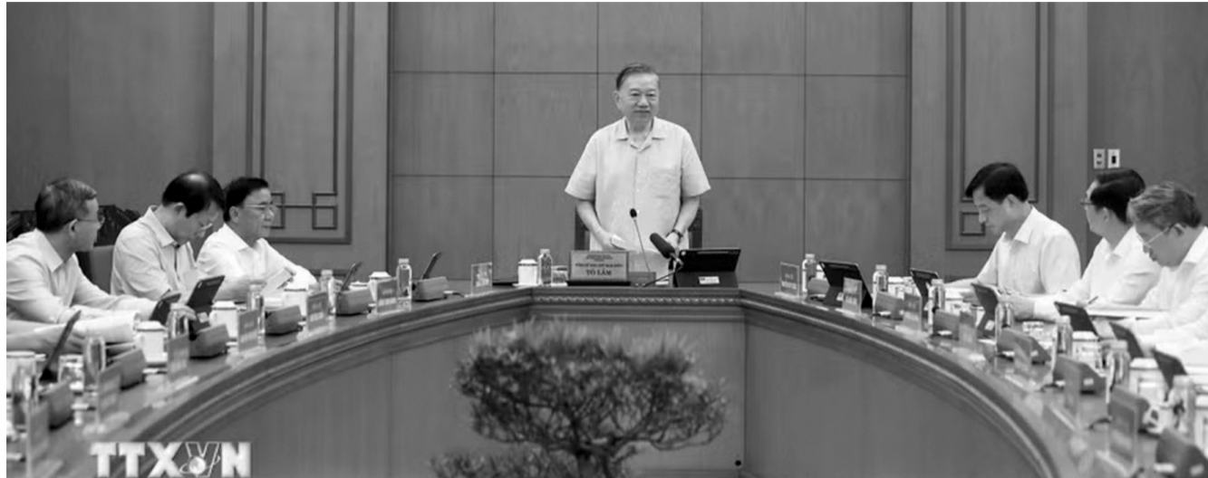
● Tổng Bí thư, Chủ tịch nước Tô Lâm chủ trì buổi làm việc.

Sáng 21/5, tại Trụ sở Trung ương Đảng, Tổng Bí thư, Chủ tịch nước Tô Lâm, Trưởng ban Chỉ đạo Trung ương về phát triển khoa học công nghệ (KH-CN), đổi mới sáng tạo và chuyển đổi số chủ trì buổi làm việc của Thường trực Ban Chỉ đạo Trung ương cho ý kiến về Đề án “Nghiên cứu ứng dụng và phát triển công nghệ lượng tử phục vụ phát triển kinh tế - xã hội, bảo đảm quốc phòng, an ninh”.