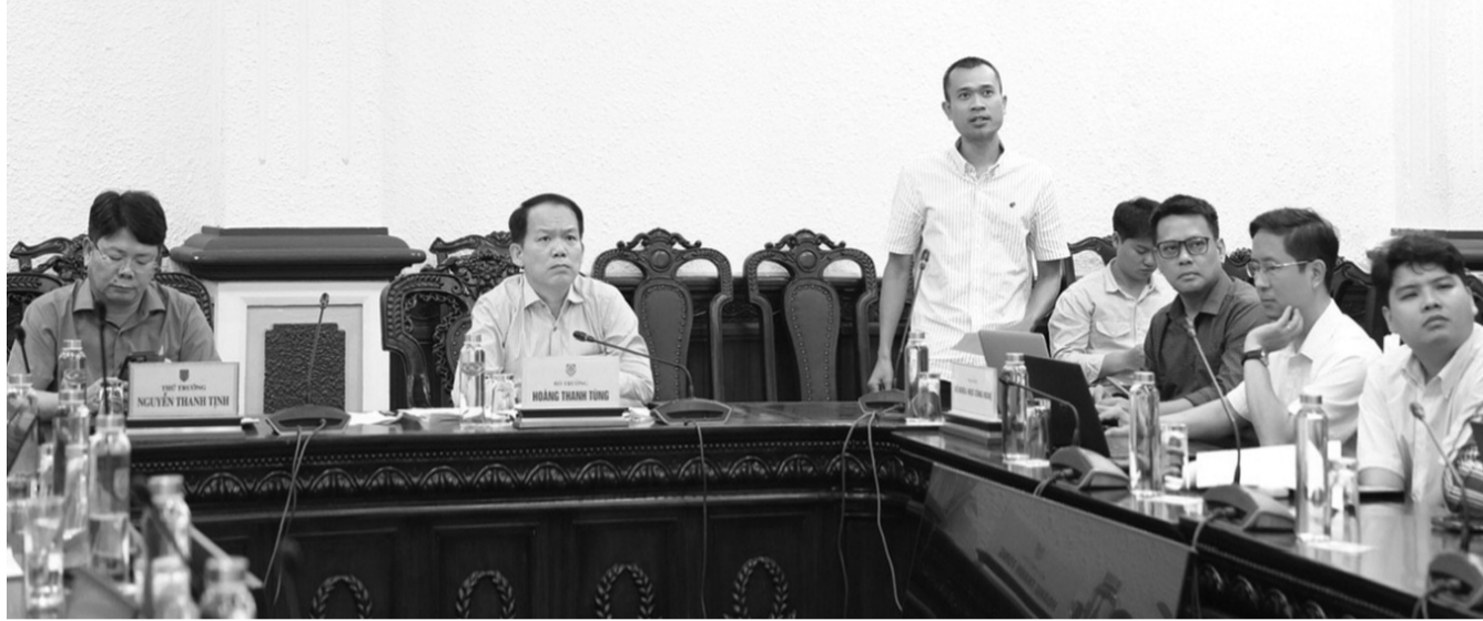
● Lãnh đạo Bộ Tư pháp nghe giới thiệu giải pháp ứng dụng AI.

Ngày 21/5, Bộ trưởng Bộ Tư pháp Hoàng Thanh Tùng chủ trì cuộc làm việc nghe giới thiệu, vận hành thử nghiệm và đánh giá đối với 3 giải pháp ứng dụng trí tuệ nhân tạo (AI) hỗ trợ rà soát, tra cứu, phân tích văn bản quy phạm pháp luật (VBQPPL) phục vụ tổng rà soát hệ thống VBQPPL.