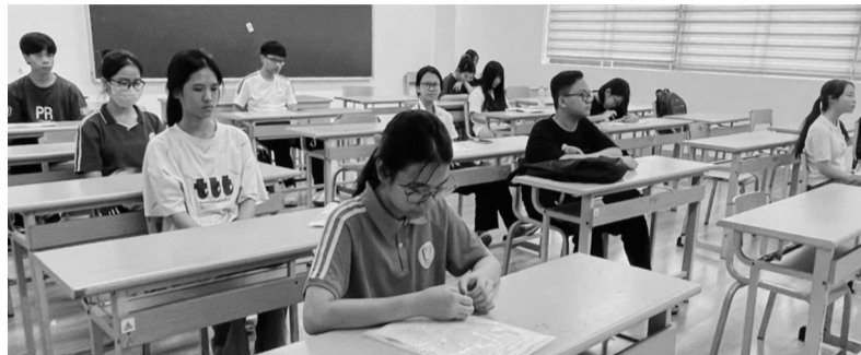
Thí sinh lớp 10 trong ngày làm thủ tục dự thi kỳ thi 2025.

Theo nhận định của thầy, đề Toán năm nay nhiều khả năng tiếp tục xuất hiện các câu hỏi gắn với tình huống thực tế, yêu cầu học sinh đọc hiểu tốt và xử lý dữ kiện chính xác. Vì vậy, kỹ năng đọc đề và tránh sai sót trong suy luận là yếu tố then chốt.