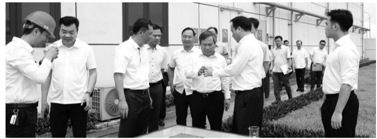
● Đoàn công tác kiểm tra hiện trạng Khu xử lý chất thải rắn Xuân Sơn.