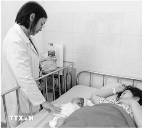
● Bác sĩ theo dõi sức khỏe cho sản phụ và em bé sau sinh.

Nghị định 168/2026/NĐ-CP nêu rõ, trường hợp quy định tại khoản 2 Điều 52 Luật BHXH sẽ không được hưởng chế độ nghỉ thai sản khi sinh con thứ hai theo quy định nêu trên.