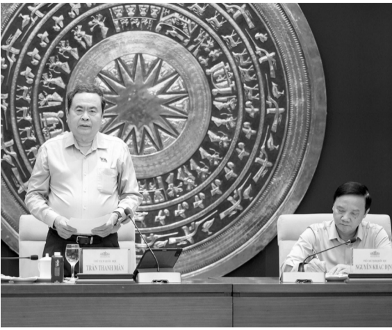
● Chủ tịch Quốc hội Trần Thanh Mẫn chủ trì cuộc làm việc với Thường trực Ủy ban Pháp luật và Tư pháp.

Chiều 21/5, Ủy viên Bộ Chính trị, Bí thư Đảng ủy Quốc hội (QH), Chủ tịch QH Trần Thanh Mẫn đã chủ trì cuộc làm việc với Thường trực Ủy ban Pháp luật và Tư pháp về các nhiệm vụ trọng tâm năm 2026 và nhiệm kỳ 2026 - 2031.