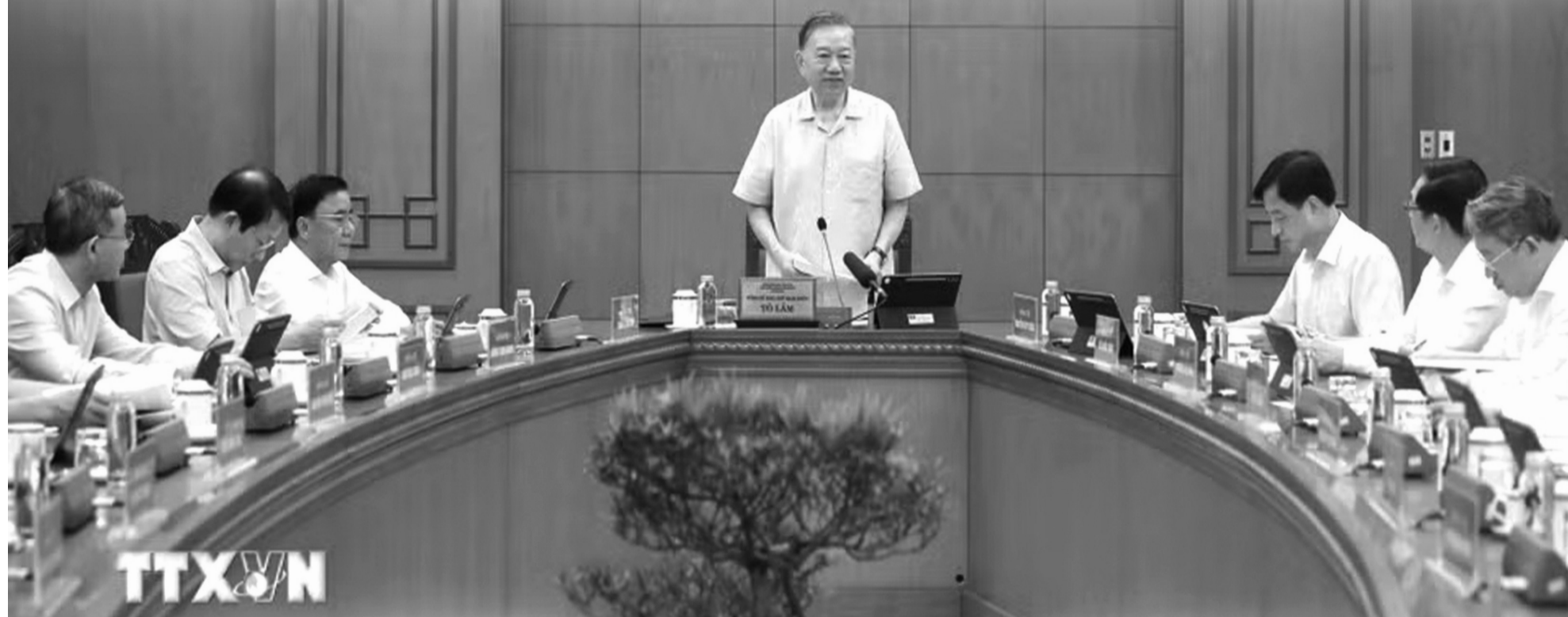
● Tổng Bí thư, Chủ tịch nước Tô Lâm chủ trì buổi làm việc.

Sáng 21/5, tại Trụ sở Trung ương Đảng, Tổng Bí thư, Chủ tịch nước Tô Lâm, Trưởng ban Chỉ đạo Trung ương về phát triển khoa học công nghệ, đổi mới sáng tạo và chuyển đổi số chủ trì buổi làm việc của Thường trực Ban Chỉ đạo Trung ương cho ý kiến về Đề án "Nghiên cứu ứng dụng và phát triển công nghệ lượng tử phục vụ phát triển kinh tế - xã hội, bảo đảm quốc phòng, an ninh".