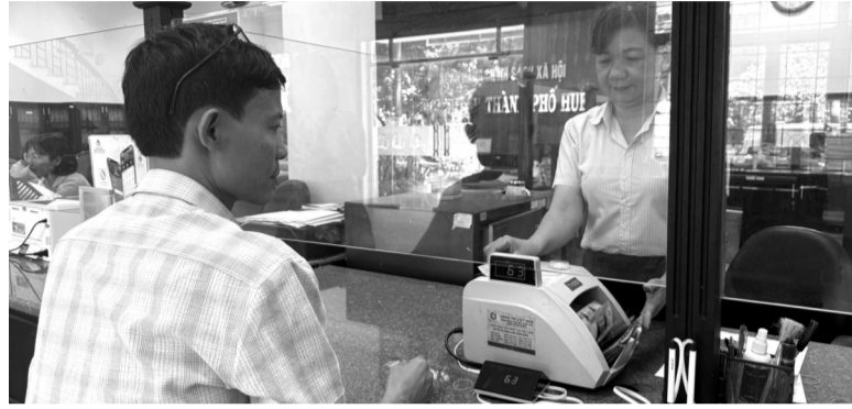
● Cán bộ tín dụng NHCSXH TP Huế hướng dẫn người dân hoàn thiện các thủ tục và giải ngân nguồn vốn vay mua NOXH.

Chi nhánh Ngân hàng Chính sách xã hội (NHCSXH) TP Huế vừa giải ngân cho 2 khách hàng đầu tiên vay vốn mua nhà ở xã hội (NOXH) tại dự án Khu phức hợp Thủy Vân giai đoạn 2 (khu đô thị Ecogarden). Đây là sự kiện đánh dấu kỳ vọng trong triển khai tín dụng chính sách trên địa bàn TP.