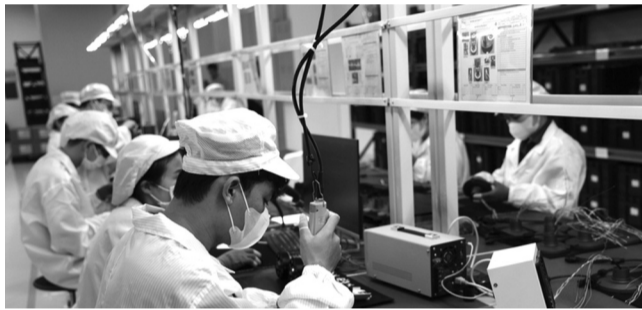
● Sở hữu trí tuệ ngày càng gắn chặt với công nghệ số, dữ liệu và trí tuệ nhân tạo.