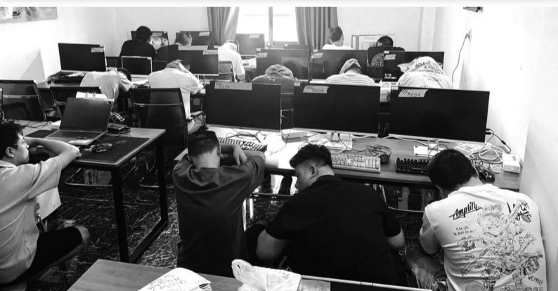
● Một băng nhóm nghi phạm lừa đảo trên mạng bị CA TP HCM phát hiện, bắt quả tang.

CA TP khuyến cáo người dân kiểm chứng thông tin trước khi chia sẻ, không đăng tải hoặc bình luận các nội dung mang tính xúc phạm, kích động, bôi nhọ người khác.