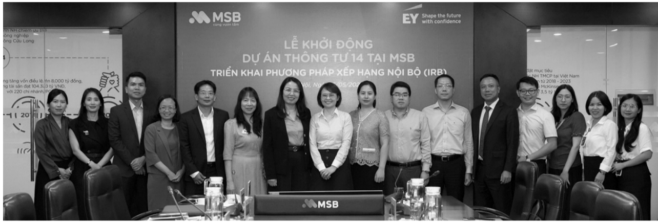
● Ban lãnh đạo MSB chụp ảnh cùng đại diện NHNN và EY tại Lễ khởi động Dự án.

Ngân hàng TMCP Hàng Hải Việt Nam (MSB) vừa phối hợp cùng Ernst & Young Việt Nam (EY) tổ chức thành công Lễ khởi động Dự án Thông tư 14/2025/TT-NHNN, đánh dấu bước chuyển quan trọng trong lộ trình chuyển đổi áp dụng phương pháp xếp hạng nội bộ (Internal Rating-Based - IRB).