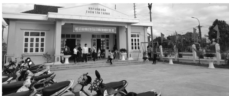
● Ngoài tiêu chí về quy mô HGD, dự thảo yêu cầu thôn, TDP phải có cơ sở hạ tầng kinh tế - xã hội thiết yếu phục vụ sinh hoạt cộng đồng. (Ảnh: H.Giang)

Đến nay, lực lượng chức năng đã bắt giữ, xử lý 140 đối tượng; trong đó khởi tố 105 người về các hành vi mua bán, vận chuyển, tàng trữ và tổ chức sử dụng trái phép chất ma túy; đồng thời đưa 35 đối tượng đi cai nghiện bắt buộc. Tang vật thu giữ gồm hơn 9kg ma túy tổng hợp, nhiều phương tiện, điện thoại và dụng cụ sử dụng ma túy. HOÀNG QUÂN