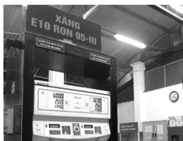
● Nhiều cây xăng đã chuyển sang bán duy nhất xăng E10.

phủ. Khách hàng khi đến đổ xăng đều được thông báo về việc chuyển sang sử dụng xăng E10.