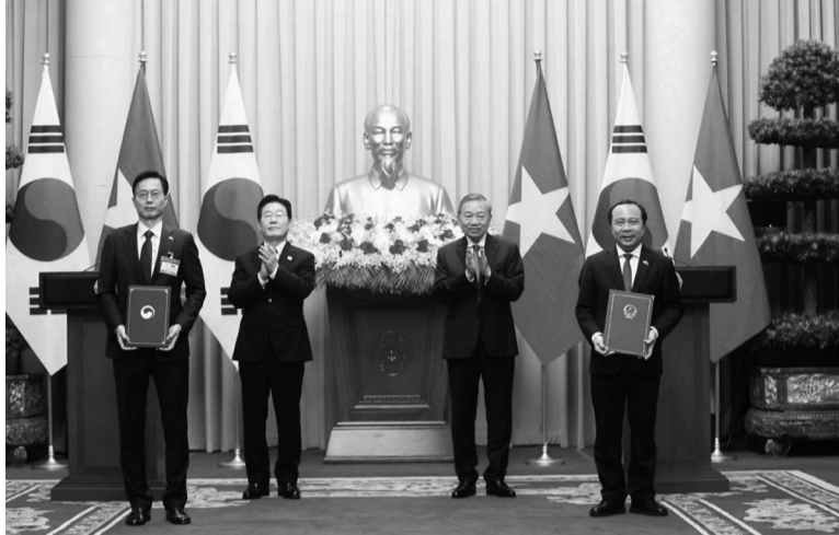
● Tổng Bí thư, Chủ tịch nước Tô Lâm và Tổng thống Lee Jae Myung chứng kiến việc trao Bản ghi nhớ về tăng cường hợp tác trong lĩnh vực sở hữu trí tuệ giữa Bộ trưởng Bộ KH&CN Việt Nam Vũ Hải Quân và Bộ trưởng Bộ Sở hữu trí tuệ Hàn Quốc Kim Yong Sun.

Từ cơ chế bảo hộ truyền thống, Luật Sở hữu trí tuệ (SHTT) sửa đổi năm 2025, có hiệu lực từ ngày 1/4/2026 mở ra bước ngoặt lớn khi đưa sáng chế, dữ liệu, thương hiệu và tài sản số trở thành nguồn lực kinh tế thực chất, thích ứng với kỹ nguyên trí tuệ nhân tạo (AI), chuyển đổi số và cạnh tranh công nghệ toàn cầu.