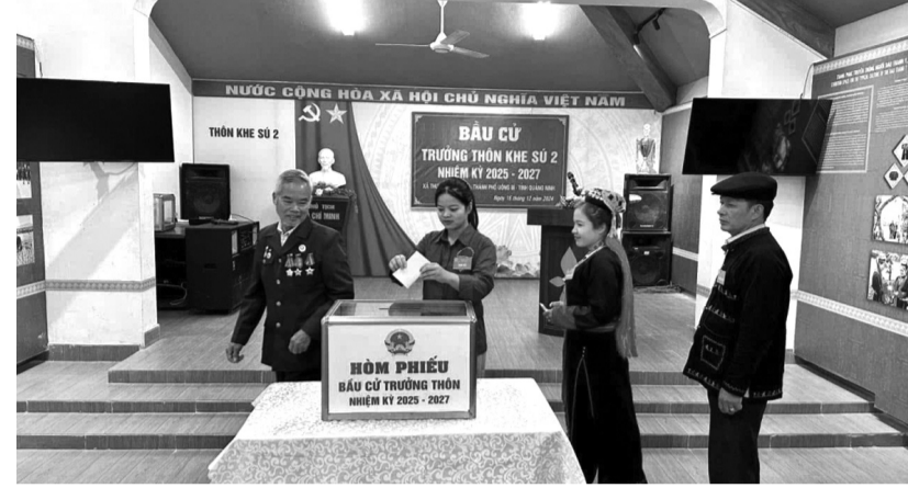
● Bầu cử trưởng thôn nhiệm kỳ 2025 - 2027 tại một địa phương ở Quảng Ninh.

Sau khi thực hiện sắp xếp đơn vị hành chính (ĐVHC) cấp tỉnh, cấp xã năm 2025, bình quân số thôn, TDP trên mỗi ĐVHC cấp xã tăng lên nhiều (từ khoảng 9 thôn, TDP/1 cấp xã lên khoảng 27 thôn, TDP/1 cấp xã). Cụ thể, từ 89.574 thôn, TDP/10.035