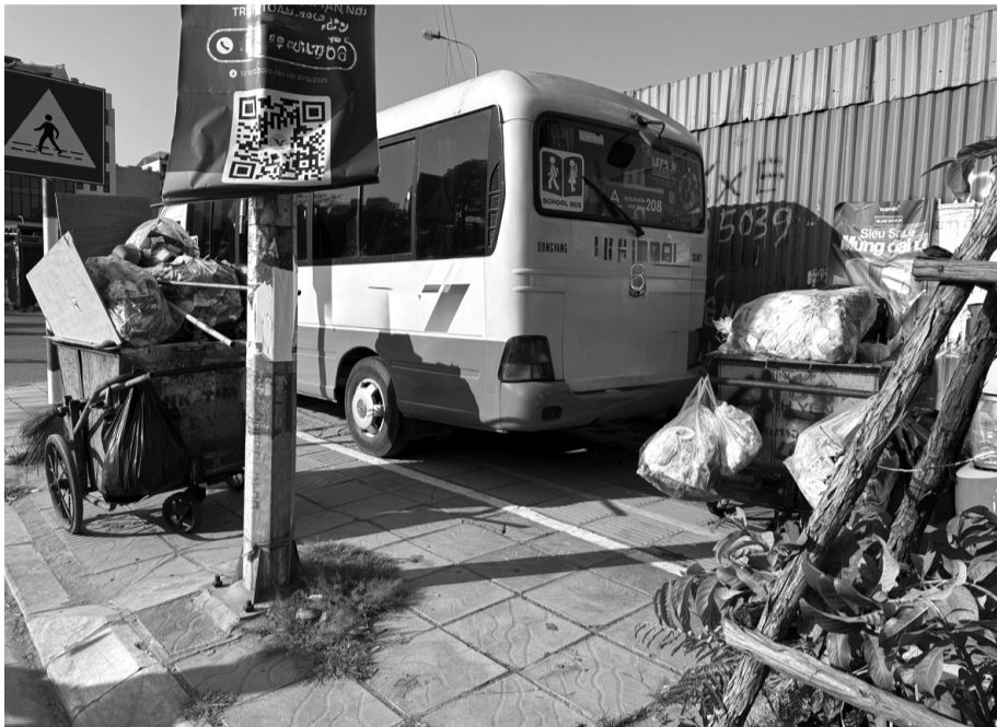
● Rác thải dù được phân loại hay không vẫn thường xuyên được thu gom chung tại một phường trên địa bàn Thành phố.

Dù quy định phân loại rác tại nguồn đã được triển khai và Hà Nội liên tục đẩy mạnh các chương trình bảo vệ môi trường, thực tế cho thấy việc thực hiện vẫn còn nhiều bất cập. Từ thói quen bỏ rác lẫn lộn của người dân, tình trạng đổ rác không đúng giờ, không đúng nơi quy định đến hệ thống thu gom, xử lý chưa đồng bộ đang khiến mục tiêu xây dựng đô thị xanh gặp nhiều trở ngại. Bài toán quản lý chất thải không còn chỉ là vấn đề vệ sinh môi trường mà đã trở thành thách thức lớn đối với phát triển đô thị bền vững.