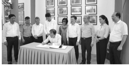
● Bộ trưởng Bộ Tư pháp Hoàng Thanh Tùng ghi lưu niệm trong sổ vàng truyền thống.