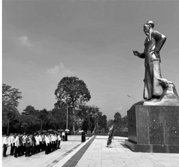
● Đoàn dâng hương tại tượng đài Hồ Chí Minh.