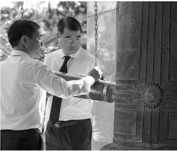
● Thủ tướng Chính phủ Lê Minh Hưng thành chương cầu siêu cho các anh hùng, liệt sĩ tại buổi lễ.

Cuối tuần qua, tại Nghĩa trang Liệt sĩ Quốc gia Đường 9, tỉnh Quảng Trị, Thủ tướng Chính phủ Lê Minh Hưng dự Lễ viếng, truy điệu và an táng hài cốt liệt sĩ quân tình nguyện và chuyên gia Việt Nam hy sinh tại Lào trong các thời kỳ chiến tranh. Buổi lễ do Tỉnh ủy, Hội đồng nhân dân, Ủy ban nhân dân, Ủy ban Mặt trận Tổ quốc Việt Nam tỉnh Quảng Trị long trọng tổ chức. Cùng dự có lãnh đạo các ban, Bộ, ngành, cơ quan Trung ương; đại diện hai tỉnh Savannkhet và Khammuon (Lào).