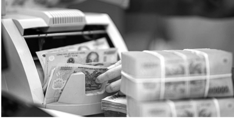
● NHNN đang siết kỷ luật về lãi suất huy động tiền gửi.

Lãi suất ngân hàng có xu hướng tăng trở lại. Trước tình hình này, Ngân hàng Nhà nước (NHNN) Việt Nam đã có động thái khá mạnh, nhằm đưa mặt bằng lãi suất ổn định trở lại, phục vụ mục tiêu phát triển kinh tế năm 2026.