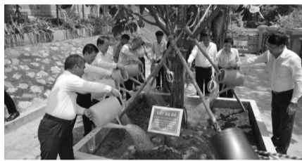
● Bộ trưởng Bộ Tư pháp Hoàng Thanh Tùng và Đoàn công tác trồng cây lưu niệm tại Khu di tích lịch sử Bộ Tư pháp.

Ngày 23/5, Đoàn đại biểu của Bộ Tư pháp do đồng chí Hoàng Thanh Tùng, Ủy viên Ban Chấp hành Trung ương Đảng, Bí thư Đảng ủy, Bộ trưởng làm Trưởng đoàn đã dâng hương tại lán Nà Nưa, đình Tân Trào, Khu tưởng niệm Chủ tịch Hồ Chí Minh và các vị tiền bối cách mạng, tượng đài Bác Hồ ở xã Tân Trào, đình Thanh La, Khu di tích Bộ Tư pháp.