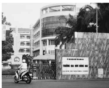
● Trường ĐH Đồng Nai.