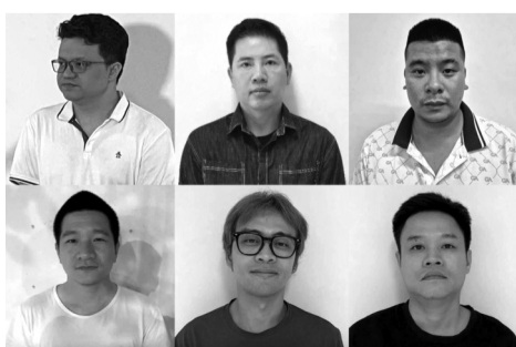
● Chủ các doanh nghiệp BH Media, Mây Sài Gòn, Lululola, 1900 Group, Giọng ca để đời bị khởi tố.

Loạt vụ khởi tố vừa qua vì thế không chỉ là chiến dịch pháp lý mà còn là dấu mốc cho thấy Việt Nam đang chuyển mạnh từ tư duy “hậu kiểm” sang chủ động bảo vệ tài sản trí tuệ trong nền kinh tế số. Đây là bước đi cần thiết để xây dựng ngành công nghiệp văn hóa hiện đại, nơi