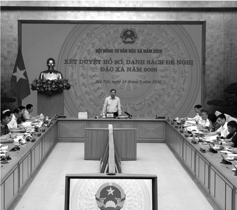
● Quang cảnh phiên họp.

Phát biểu tại phiên họp, Phó Thủ tướng Thường trực Phạm Gia Túc nhấn mạnh, nhân đạo và khoan hồng đối với người phạm tội là truyền thống tốt đẹp của dân tộc ta. Pháp luật nước ta vừa thể hiện tính nghiêm minh đối với người phạm tội, kiên quyết trừng trị nghiêm khắc đối với đối tượng chủ mưu, cầm đầu, ngoan cố, chống đối, tái phạm nguy hiểm, nhưng khoan hồng đối với người phạm tội thành khẩn, lập công chuộc tội, ăn năn hối cải và tạo mọi điều kiện thuận lợi để họ sửa chữa sai lầm, trở thành người lương thiện, có ích cho xã hội.