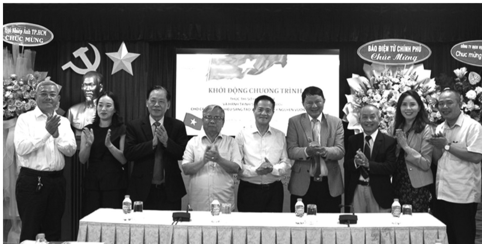
● Các đại biểu thực hiện nghi thức khởi động chương trình thực thi Sở hữu trí tuệ cho các Thương hiệu sáng tạo Việt.

nghiệp hơn, nơi sở hữu trí tuệ được coi trọng như nền tảng cốt lõi. Nhiều nhạc sĩ, nhà sản xuất khác cũng bày tỏ sự đồng tình khi cho rằng cuối cùng quyền lợi của người sáng tạo đã được bảo vệ thực chất hơn sau nhiều năm bị xem nhẹ.