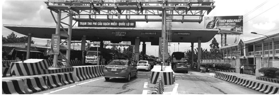
● Trạm thu phí dự án BOT cầu Rạch Miễu.

Cục Đường bộ (Bộ Xây dựng) cho biết, sau hơn 17 năm thu phí kể từ khi đưa vào khai thác, dự án BOT cầu Rạch Miễu trên QL60 nối Tiền Giang (nay là Đồng Tháp) và Bến Tre (nay là Vĩnh Long) dự kiến sẽ chính thức dừng thu phí vào cuối tháng 9/2026.