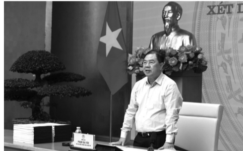
● Phó Thủ tướng Thường trực Phạm Gia Túc chủ trì phiên họp.

Ngày 24/5, tại Trụ sở Chính phủ, Ủy viên Bộ Chính trị, Phó Thủ tướng Thường trực Chính phủ Phạm Gia Túc, Chủ tịch Hội đồng tư vấn đặc xá năm 2026 đã chủ trì phiên họp toàn thể của Hội đồng để xét, duyệt danh sách đề nghị Chủ tịch nước đặc xá tù trước thời hạn cho các phạm nhân đủ điều kiện đặc xá.