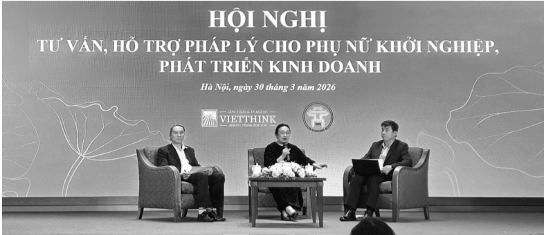
● Phiên hỏi đáp, tư vấn trực tiếp tại Hội nghị tập huấn “Tư vấn, hỗ trợ pháp lý cho phụ nữ khởi nghiệp, phát triển kinh doanh” do TƯ Hội LHPN Việt Nam phối hợp với Bộ Tư pháp tổ chức.

Tháng 11/2025, báo cáo tại Hội nghị tổng kết Đề án 939 và triển khai Đề án của Chính phủ Hỗ trợ phụ nữ khởi nghiệp giai đoạn 2026 - 2035 do Hội LHPN Việt Nam tổ chức cho thấy, Đề án 939 đã hỗ trợ hơn 118.000 phụ nữ khởi sự kinh doanh và khởi nghiệp (đạt gần gấp 6 lần so với mục tiêu đề ra); hỗ trợ thành lập mới hơn 1.600 hợp tác xã và trên 6.000 tổ hợp tác do phụ nữ tham gia quản lý, điều hành (đạt hơn 6,6 lần so với mục tiêu); hơn 130.000 doanh nghiệp nữ mới thành lập được tư vấn, hỗ trợ (đạt 1,3 lần so với mục tiêu); hơn 2.400 tỷ đồng vốn được kết nối qua ngân hàng, quỹ hỗ trợ, tài chính vi mô; trên 1.800 cuộc thi và ngày hội phụ nữ khởi nghiệp, thu hút hơn 41.000 ý tưởng sáng tạo, tạo hiệu ứng lan tỏa mạnh mẽ với