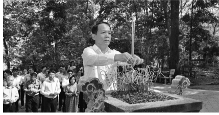
● Bộ trưởng Bộ Tư pháp Hoàng Thanh Tùng và Đoàn công tác dâng hương tại lán Nà Nưa (Tuyên Quang).