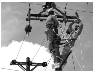
● Hệ thống điện quốc gia đang gặp nhiều thách thức trong tuần cao điểm nắng nóng.

Công ty TNHH Vận hành hệ thống điện và thị trường điện quốc gia (NSMO) vừa đưa ra thông tin cho biết, khu vực Bắc Bộ và Bắc Trung Bộ đã bước vào đợt nắng nóng rất gay gắt (từ ngày 23/5 đến 27/5). Đáng chú ý, tại Thủ đô Hà Nội trong hai ngày cao điểm 25 - 26/5, nhiệt độ khí tượng có thể chạm ngưỡng 40°C. Kết hợp với nhiệt độ điểm sương ở mức rất cao (27°C so với mức trung bình 18°C), hơi ẩm sẽ giữ nhiệt trong không khí và đẩy nhiệt độ cảm nhận thực tế ngoài trời lên tới 45°C - 47°C. Đợt nắng nóng này được đánh giá là có mức độ cao hơn giai đoạn 13 - 15/5 vừa qua. Dự báo phụ tải của hệ thống điện miền Bắc trong tuần này sẽ ở mức xấp xỉ 29.000MW, cao hơn 9,8% so với mức kỷ lục ghi nhận ngày 15/5.