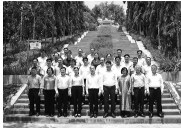
● Đoàn chụp ảnh lưu niệm tại Khu di tích lịch sử Bộ Tư pháp.