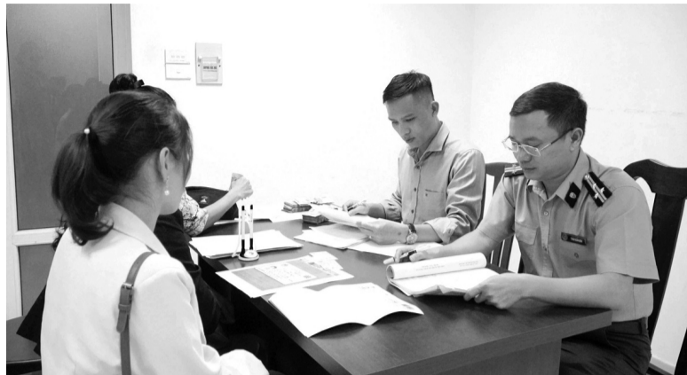
● Cán bộ THADS tiếp dân.

Có thể thấy, các tiêu chí pháp lý về xác định vụ việc phức tạp tại Nghị định số 155/2026/NĐ-CP không dừng lại ở những quy định mang tính kỹ thuật lập pháp, mà đã trở thành cơ sở pháp lý trọng yếu để kiểm soát quyền lực và minh bạch hóa hoạt động công quyền. Khi được vận hành liên thông, hòa nhịp cùng các quy định mới của Luật THADS 2025 và Thông tư số 05/2026/TT-BTP, cơ chế này tạo ra một quy trình kiểm soát chặt chẽ. Việc áp dụng đúng, chuẩn xác các văn bản quy phạm pháp luật này là giải pháp căn cơ để giảm thiểu các vụ việc khiếu kiện kéo dài, bảo vệ quyền lợi hợp pháp của Nhân dân và nâng cao chỉ số niềm tin vào tính nghiêm minh của nền Tư pháp. N.T.T.H