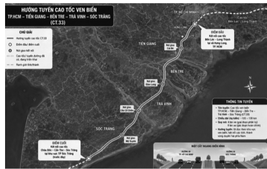
●Mô phỏng hướng tuyến cao tốc TP HCM - Tiền Giang - Bến Tre - Trà Vinh - Sóc Trăng.

UBND Vĩnh Long đề xuất điều chỉnh tiến độ đầu tư dự án vào giai đoạn 2026 - 2030 thay vì sau năm 2030 như quy hoạch hiện hành. Tỉnh cũng kiến nghị được giao làm cơ quan thẩm quyền triển khai giai đoạn 1 theo hình thức PPP và đề xuất Trung ương bố trí khoảng 21.240 tỷ đồng vốn ngân sách tham gia. TRẦN TIẾN