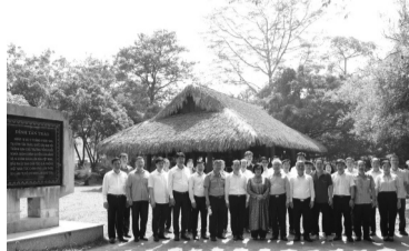
● Đoàn công tác chụp ảnh lưu niệm tại đình Tân Trào.