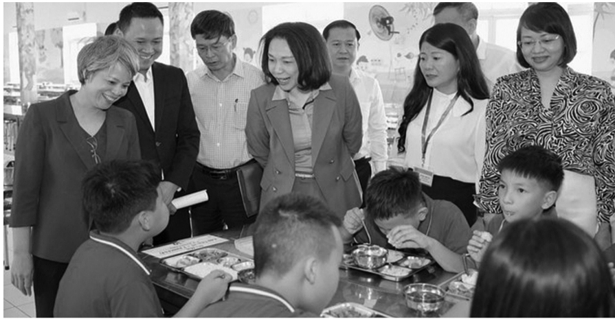
● Đoàn kiểm tra liên ngành TP Hà Nội kiểm tra đột xuất bữa ăn bán trú tại một trường tiểu học ở xã An Khánh. (Ảnh: Minh Anh)

Thực đơn bán trú không chỉ cần ngon miệng mà phải tuân thủ nghiêm ngặt các quy định về dinh dưỡng của Bộ Y tế và Bộ GD&ĐT. Thực đơn được xây dựng theo chu kỳ tối thiểu 2 tuần, không lặp lại món trong cùng chu kỳ và phải đa dạng 4 nhóm chất: Bột đường, đạm, béo, vitamin và khoáng chất.