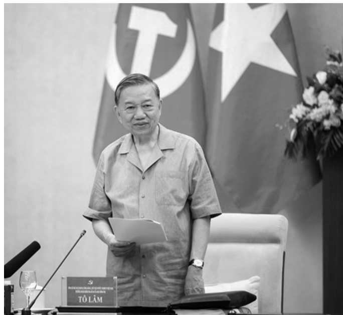
● Tổng Bí thư, Chủ tịch nước Tô Lâm phát biểu chỉ đạo tại Hội nghị.

Tại cuộc họp, các đại biểu nghe trình bày dự thảo Báo cáo kết quả kiểm tra, giám sát; đồng thời tập trung thảo luận, góp ý để tiếp tục bổ sung, chỉnh sửa, hoàn thiện báo cáo trước khi trình theo quy định.