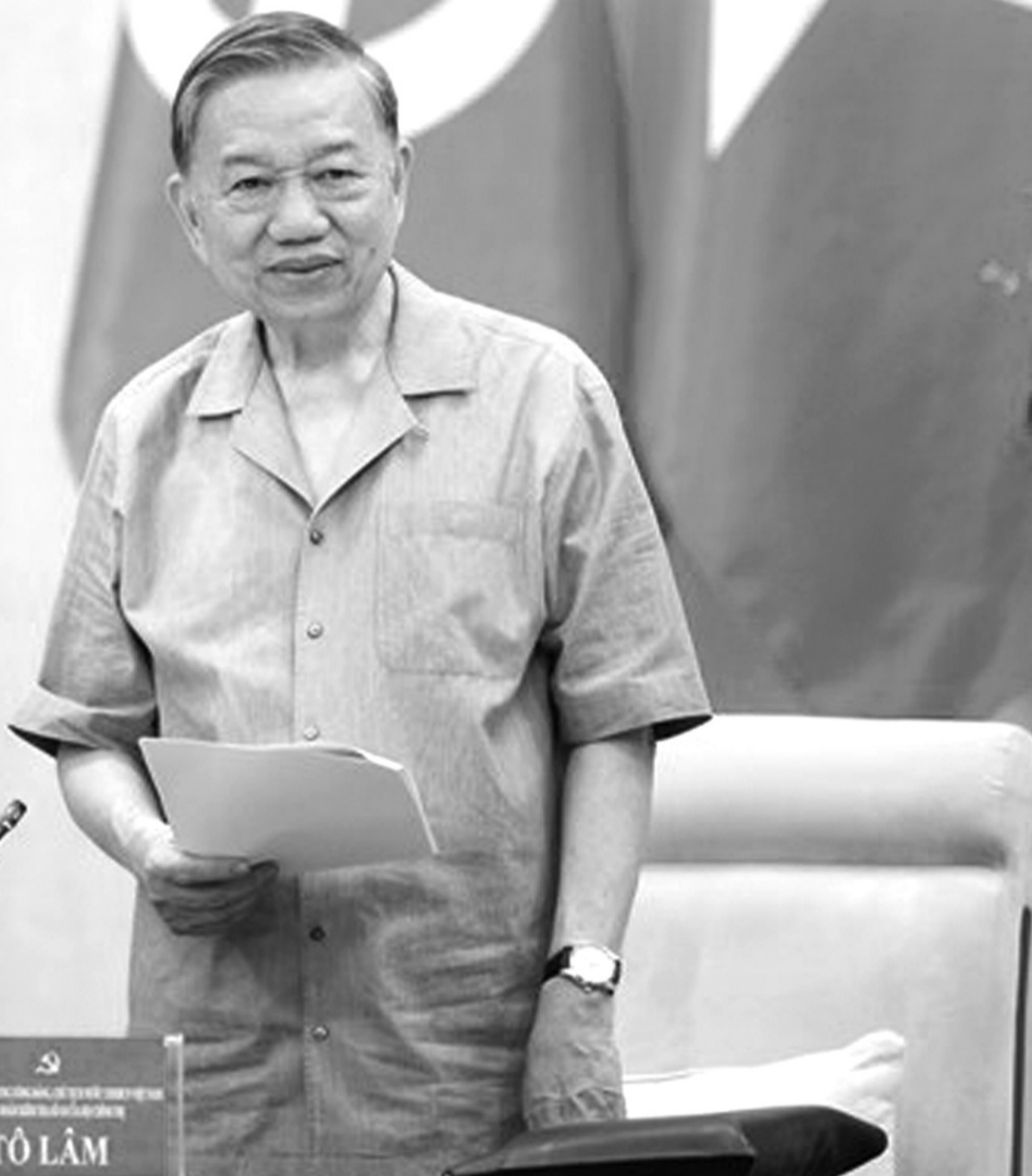
● Tổng Bí thư, Chủ tịch nước Tô Lâm phát biểu chỉ đạo tại Hội nghị.

Chiều 26/5, tại Nhà Quốc hội, Tổng Bí thư, Chủ tịch nước Tô Lâm, Trưởng Đoàn kiểm tra, giám sát số 10 của Bộ Chính trị, Ban Bí thư đã chủ trì Hội nghị thông qua dự thảo Báo cáo kết quả kiểm tra đợt 2 đối với Ban Thường vụ Đảng ủy Quốc hội.