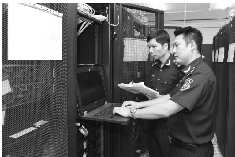
● Việc sửa đổi Luật Hải quan 2014 sẽ tạo cơ sở pháp lý cho việc tái cấu trúc hệ thống công nghệ thông tin của ngành. (Ảnh minh họa: H.C)

Theo định hướng và giải pháp của Ban Chấp hành Trung ương, Bộ Chính trị và trước yêu cầu phát triển mới của nền kinh tế số, thương mại điện tử xuyên biên giới, chuyển đổi số quốc gia và chủ trương đẩy mạnh phân cấp, phân quyền, nhiều quy định của Luật Hải quan hiện hành đã bộc lộ những bất cập, hạn chế cần được sửa đổi, bổ sung kịp thời.