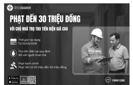
● Phạt đến 30 triệu đồng với chủ nhà trọ thu tiền điện giá cao. (Ảnh: EVNHANOI)

Buộc nộp lại số lợi bất hợp pháp có được do thực hiện vi phạm hành chính (bao gồm cả mọi chi phí phát sinh do hành vi vi phạm gây ra) để hoàn trả cho