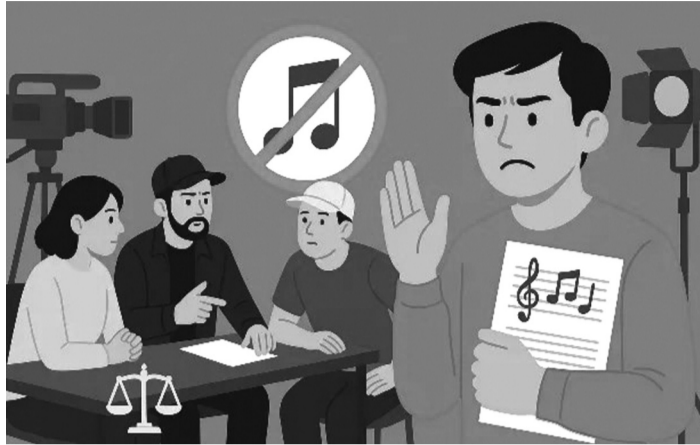
● Vấn đề bản quyền trong sáng tạo nghệ thuật bị coi nhẹ sẽ gây ảnh hưởng tới mục tiêu phát triển công nghiệp văn hóa ở Việt Nam.

Mỗi tác phẩm âm nhạc là kết tinh của lao động sáng tạo, thời gian, tiền bạc và cảm xúc của người sáng tạo. Vì vậy, việc tự ý sử dụng ca khúc, bản ghi hay chương trình biểu diễn của người khác để khai thác thương mại không chỉ là hành vi vi phạm pháp luật mà còn thể hiện sự thiếu đạo đức. Nếu không có một môi trường nghệ thuật lành mạnh được xây dựng trên sự tử tế, minh bạch và tôn trọng quyền sáng tạo, thì công nghiệp văn hóa khó có thể phát triển.