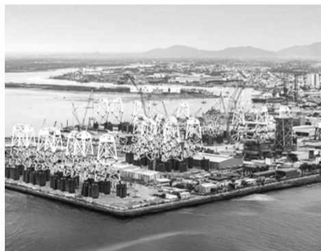
● Xưởng sản xuất chân đế cột điện gió ngoài khơi của PTSC, đơn vị thành viên của Petrovietnam.

công nghiệp - năng lượng tích hợp. Đó là bước chuyển mang tính chiến lược, phù hợp với yêu cầu bảo đảm an ninh năng lượng quốc gia, thực hiện cam kết Net Zero vào năm 2050 và tạo thêm động lực tăng trưởng mới cho nền kinh tế.