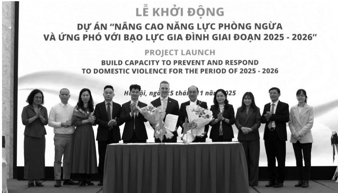
● Ngày 25/11/2025, Bộ VH,TT&DL phối hợp với UNFPA tại Việt Nam với sự hỗ trợ tài chính của Cơ quan Hợp tác Quốc tế Hàn Quốc (KOICA) tổ chức khởi động Dự án “Nâng cao năng lực phòng ngừa và ứng phó với BLGD giai đoạn 2025 - 2026”.