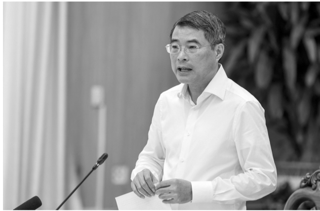
● Thủ tướng Chính phủ Lê Minh Hưng phát biểu tại buổi làm việc.

Về kinh tế, Thủ tướng đề nghị thu hút đầu tư vào công nghiệp chế biến, chế tạo, công nghệ cao; đẩy nhanh các dự án trong khu công nghiệp, khu chế xuất. Đối với vận hành chính quyền địa phương hai cấp, Thủ tướng yêu cầu bảo đảm bộ máy hoạt động thông suốt, nâng cao chất lượng đội ngũ cán bộ cấp xã, đẩy nhanh sắp xếp tài sản công và bố trí nhân sự phù hợp. Cùng với đó, Cần Thơ cần tiếp tục cải