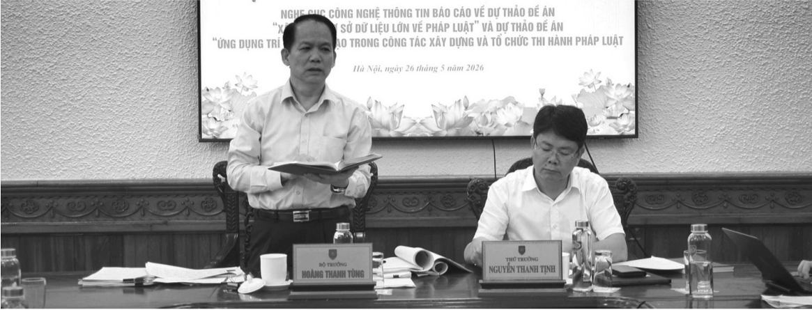
● Bộ trưởng Bộ Tư pháp Hoàng Thanh Tùng phát biểu tại buổi làm việc.

Ngày 26/5, Bộ trưởng Bộ Tư pháp Hoàng Thanh Tùng đã chủ trì buổi làm việc với Cục Công nghệ thông tin và các đơn vị có liên quan về dự thảo Đề án “Xây dựng cơ sở dữ liệu lớn về pháp luật” và dự thảo Đề án “Ứng dụng trí tuệ nhân tạo trong công tác xây dựng và tổ chức thi hành pháp luật”.