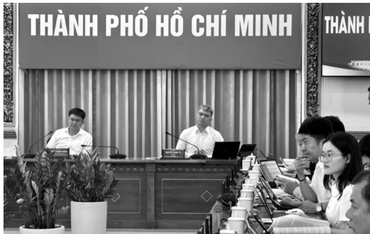
●Lãnh đạo TP HCM mong muốn Bộ Tư pháp sát cánh với TP để xây dựng Luật ĐTĐB hoàn chỉnh.

Về vấn đề chuyển tiếp giữa Nghị quyết 98, Nghị quyết 260 với Luật ĐTĐB, bà Hạnh cho biết TP sẽ cụ thể hóa những vấn đề tiếp tục áp dụng các Nghị quyết. Những vấn đề còn vướng mắc mà Nghị quyết không giải quyết được thì sẽ áp dụng Luật. Các sở, ngành đã có nội dung cần tiếp tục Nghị quyết, nội dung nào sẽ áp dụng Luật ĐTĐB, trong dự thảo sẽ nêu rõ để tham vấn ý kiến Bộ Tư pháp.