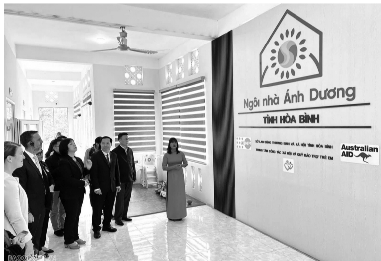
● “Ngôi nhà Ánh Dương” - một mô hình “nhà an toàn” được đưa vào sử dụng ở tỉnh Hòa Bình cũ (nay là Phú Thọ) vào tháng 1/2025.

quốc tế, mà chưa có khung pháp lý đầy đủ.