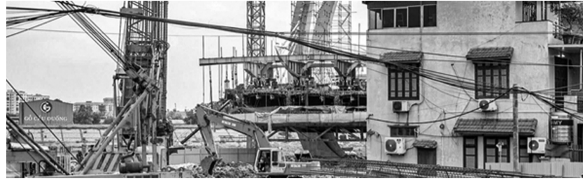
● Bộ Xây dựng đề nghị UBND TP Hà Nội chỉ đạo các đơn vị thực hiện dứt điểm công tác giải phóng mặt bằng trong tháng 5.

Bộ Xây dựng yêu cầu Ban Quản lý dự án đường sắt rà soát năng lực các nhà thầu tham gia dự án nâng cấp tuyến vận tải thủy sông Đuống (Hà Nội), trên cơ sở đó căn cứ quy định pháp luật và hợp đồng đã ký để xử lý các trường hợp chậm tiến độ, bảo đảm tiến độ thi công cầu đường sắt và cầu đường bộ mới.