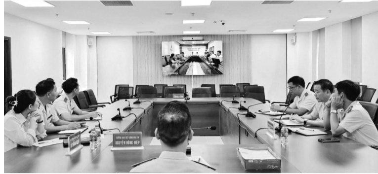
● Toàn cảnh một buổi tiếp công dân trực tuyến nhìn từ điểm cầu Trụ sở TCDTW.

Vụ việc khiếu nại, kiến nghị, phản ánh có tính chất phức tạp, kéo dài, cần sự phối hợp giải quyết của nhiều cơ quan, tổ chức