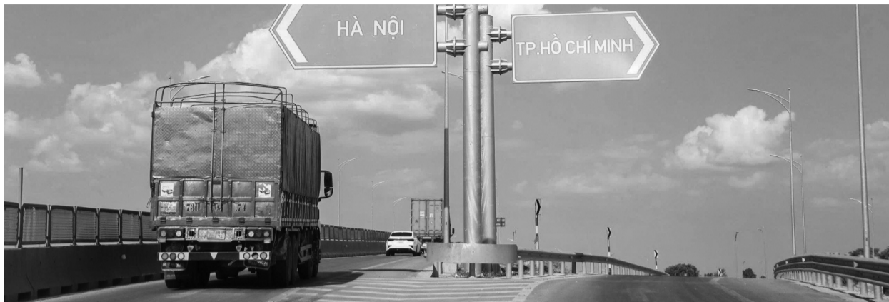
● Dự án đầu tư xây dựng mở rộng đường bộ cao tốc Bắc - Nam phía Đông, đoạn Cam Lộ - La Sơn có tổng chiều dài gần 99km.

Sau hơn 5 tháng khởi công, dự án mở rộng cao tốc Cam Lộ - La Sơn đang được các nhà thầu đồng loạt triển khai với hơn 120 mũi thi công trên toàn tuyến. Tuy nhiên, bài toán mặt bằng, hạ tầng kỹ thuật cùng biến động giá vật liệu và thời tiết bất lợi vẫn là những lực cản đáng kể đối với tiến độ công trình trọng điểm này.