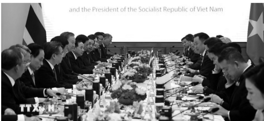
● Tổng Bí thư, Chủ tịch nước Tô Lâm hội đàm với Thủ tướng Thái Lan Anutin Charnvirakul.

Trong lĩnh vực kinh tế, hai nhà lãnh đạo nhất trí đẩy mạnh hợp tác, kết nối kinh tế theo hướng bổ trợ lẫn nhau, với những đột phá mới và phát triển mới về