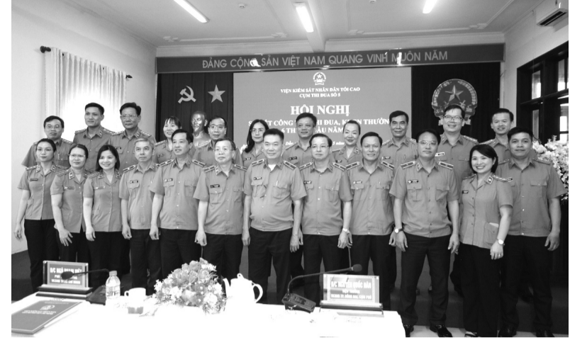
● Hội nghị sơ kết công tác thi đua, khen thưởng 6 tháng đầu năm 2026 CTĐ số 5 ngành KSND được tổ chức tại Đồng Nai.

Trong bối cảnh khối lượng công việc lớn, nhiều vụ án, vụ việc có tính chất phức tạp, các đơn vị trong CTĐ vẫn duy trì tinh thần trách nhiệm, kỷ cương và quyết tâm cao. Toàn CTĐ đã kiểm sát 19.768 nguồn tin về tội phạm; thụ lý kiểm sát điều tra 26.720 vụ/48.016 bị can; kiểm sát truy tố 12.348 vụ/30.850 bị can; công tố và kiểm sát xét xử 13.295 vụ/31.792 bị cáo. 6 tháng đầu năm