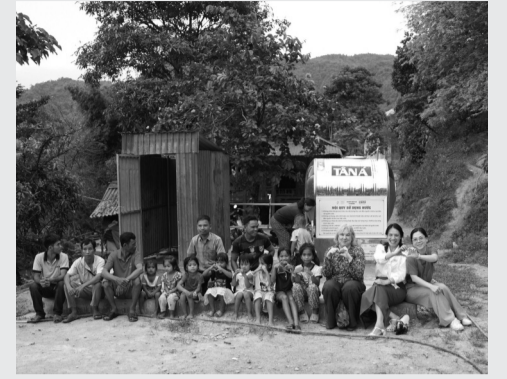
● Đoàn công tác tham quan hệ thống cấp nước tự chảy do chính cộng đồng xây dựng và quản lý tại thôn Cupua.

Đại diện Đại sứ quán Ireland tại Việt Nam vừa có chuyến thăm và làm việc tại tỉnh Quảng Trị từ ngày 27 đến 29/5/2026, nhằm đánh giá thực tế những kết quả đạt được của Chương trình “Tiền về phía trước” (Resilience First Programme) do Chính phủ Ireland tài trợ thông qua Đại sứ quán Ireland tại Việt Nam. Đây là sáng kiến tập trung hỗ trợ các nhóm dễ bị tổn thương, bao gồm cộng đồng dân tộc thiểu số, phụ nữ, thanh, thiếu niên và người khuyết tật, nhằm tăng cường khả năng chống chịu trước lũ lụt, hạn hán và các hiện tượng thời tiết cực đoan.