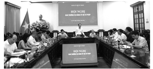
● Bí thư Đảng ủy, Bộ trưởng Bộ Tư pháp Hoàng Thanh Tùng chủ trì Hội nghị.

Chiều 28/5, Bí thư Đảng ủy, Bộ trưởng Bộ Tư pháp Hoàng Thanh Tùng chủ trì Hội nghị Ban Thường vụ Đảng ủy Bộ Tư pháp.