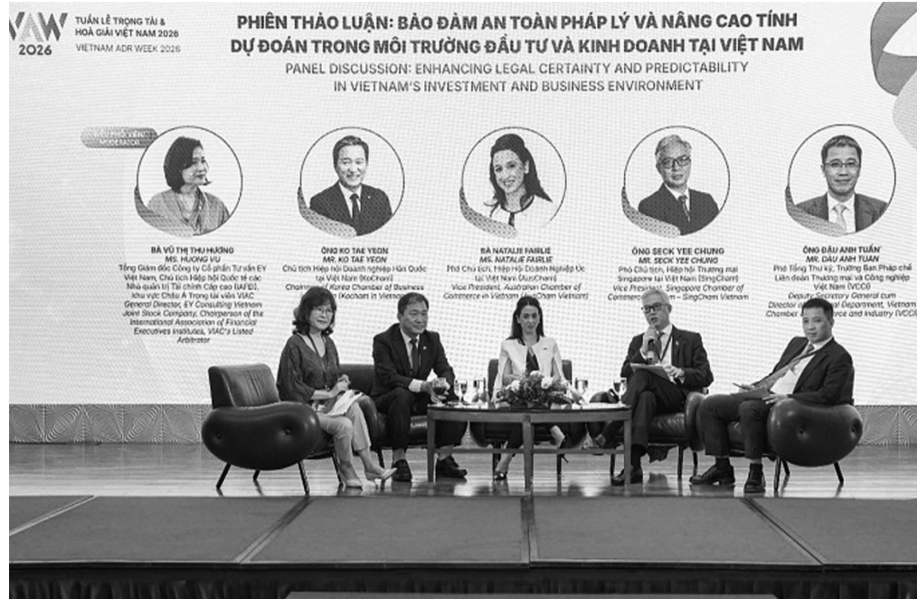
● Các diễn giả tại Phiên thảo luận: Bảo đảm an toàn pháp lý và nâng cao tính dự đoán trong môi trường đầu tư và kinh doanh tại Việt Nam.

Khi dòng vốn ngày càng thận trọng và chọn lọc, môi trường đầu tư không chỉ được đo bằng ưu đãi hay hạ tầng cứng, mà còn ở khả năng bảo đảm an toàn pháp lý và giải quyết tranh chấp minh bạch, hiệu quả. Một cơ chế pháp lý ổn định, minh bạch và công bằng đang trở thành “hạ tầng mềm” quan trọng, giúp củng cố niềm tin, giữ chân nhà đầu tư (NĐT) dài hạn và nâng cao năng lực cạnh tranh của nền kinh tế.