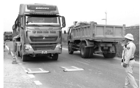
● Kiểm soát xe quá tải trên cao tốc Mai Sơn - QL45.

Theo đó, thực hiện chỉ đạo của Bộ Xây dựng, Cục Đường bộ đã giao cho các đơn vị có liên quan bố trí nhân sự để vận hành hệ thống giám sát, điều hành giao thông đường cao tốc; thu phí ETC (hạ tầng trạm thu phí, hệ thống Front-End, hệ thống Back-End thu phí đường cao tốc, hệ thống đường truyền dữ liệu, hệ thống cơ sở dữ liệu thanh toán điện tử giao thông đường bộ); công trình kiểm soát tải trọng xe của các dự