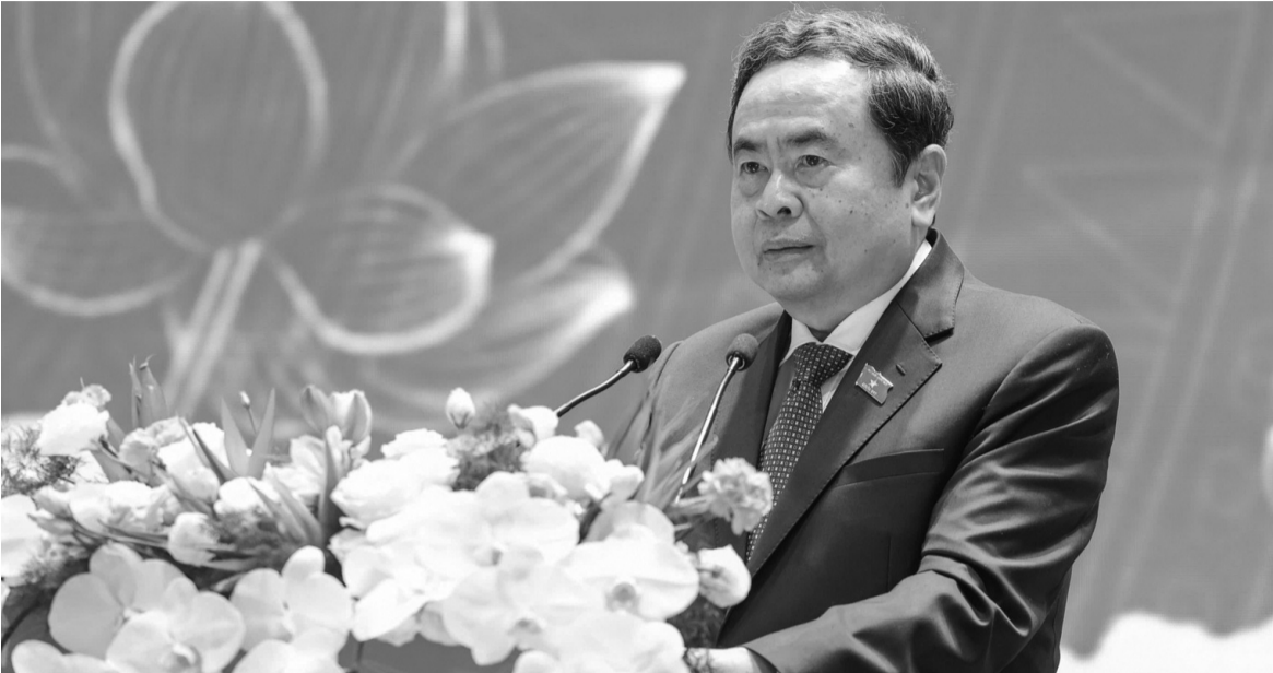
● Chủ tịch Quốc hội Trần Thanh Mẫn phát biểu bế mạc Hội nghị.

Ngày 28/5, tại Hà Nội, Ủy ban Thường vụ Quốc hội (UBTVQH) tổ chức Hội nghị HĐND toàn quốc triển khai phương hướng, nhiệm vụ nhiệm kỳ 2026 - 2031. Hội nghị được tổ chức theo hình thức trực tiếp kết hợp trực tuyến tại điểm cầu 33 tỉnh, TP.