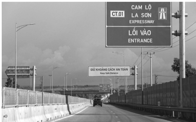
● Lối vào cao tốc Cam Lộ - La Sơn, đoạn qua địa bàn tỉnh Quảng Trị.

Sau hơn 5 tháng khởi công, dự án mở rộng cao tốc Cam Lộ - La Sơn đang được các nhà thầu đồng loạt triển khai với hơn 120 mũi thi công trên toàn tuyến. Tuy nhiên, bài toán mặt bằng, hạ tầng kỹ thuật cùng biến động giá vật liệu và thời tiết bất lợi vẫn là những lực cản đáng kể đối với tiến độ công trình trọng điểm này.