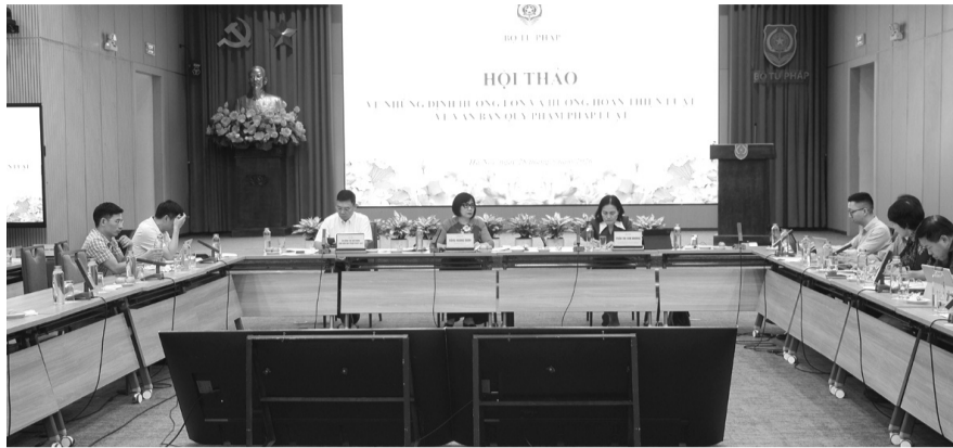
● Toàn cảnh Hội thảo.