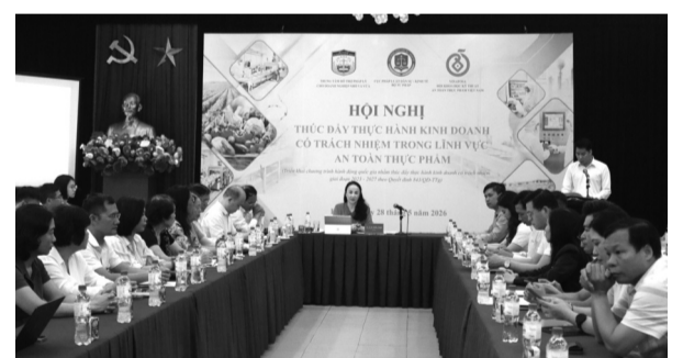
● Quang cảnh Hội nghị.

Ngày 28/5, Cục Pháp luật dân sự - kinh tế, Bộ Tư pháp tổ chức Hội nghị đối thoại "Thúc đẩy thực hành kinh doanh có trách nhiệm trong lĩnh vực an toàn thực phẩm".