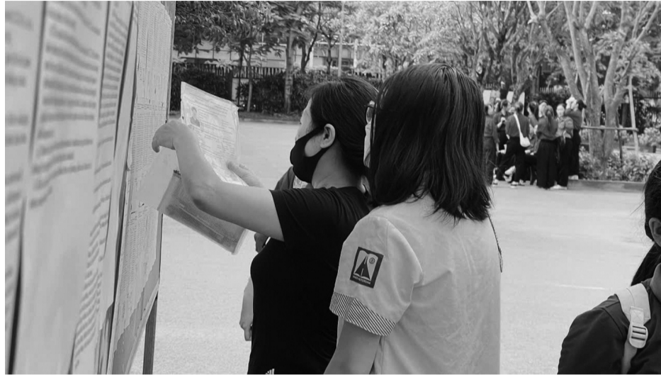
● Hôm nay (29/5), thí sinh kỳ thi lớp 10 Hà Nội làm thủ tục dự thi, nghe phổ biến quy chế thi. (Ảnh minh họa: PV)

Hôm nay (29/5), hơn 120.000 thí sinh tại Hà Nội chính thức làm thủ tục dự thi tuyển sinh vào lớp 10 THPT công lập năm học 2026 - 2027. Đây được xem là kỳ thi có áp lực lớn nhất đối với học sinh Thủ đô. Bởi vậy, từ khâu coi thi, bảo mật đề thi đến kiểm soát gian lận công nghệ cao đều được siết chặt nhằm bảo đảm kỳ thi diễn ra nghiêm túc, công bằng và an toàn.