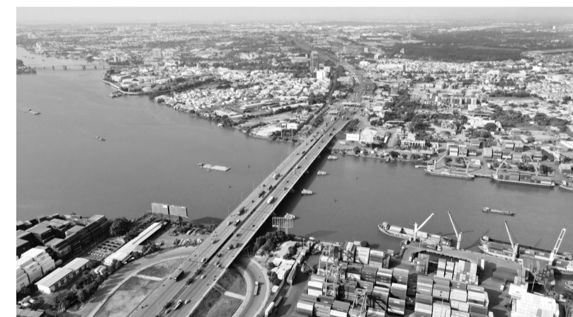
● Chiều cao tầng không hiện tại của cầu Đồng Nai 1 đang khiến việc lưu thông hàng hóa trên sông Đồng Nai bị hạn chế.