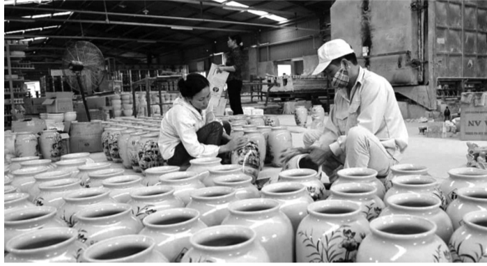
● Ảnh minh họa.

Bộ Tài chính đã ban hành Thông tư 58/2026/TT-BTC về hướng dẫn chế độ kế toán cho doanh nghiệp siêu nhỏ; theo đó, cho phép doanh nghiệp siêu nhỏ sử dụng người thân trong gia đình làm kế toán, không bắt buộc phải bố trí kế toán trưởng.