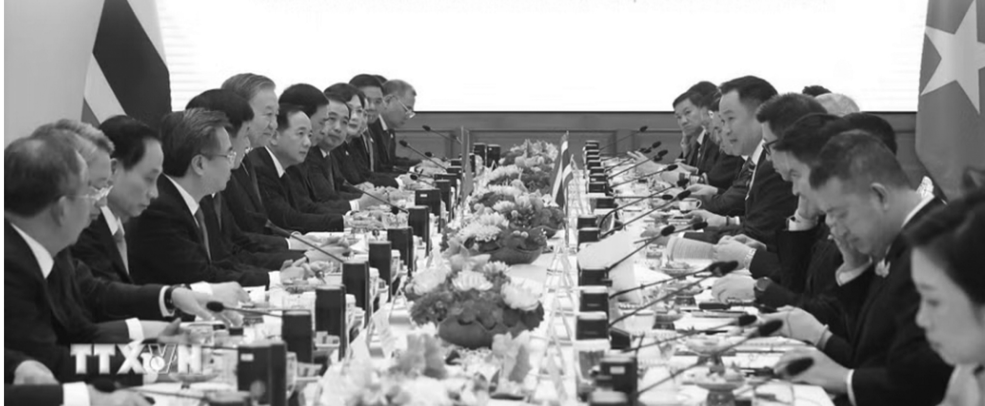
● Tổng Bí thư, Chủ tịch nước Tô Lâm hội đàm với Thủ tướng Thái Lan Anutin Charnvirakul.

and the President of the Socialist Republic of Viet Nam