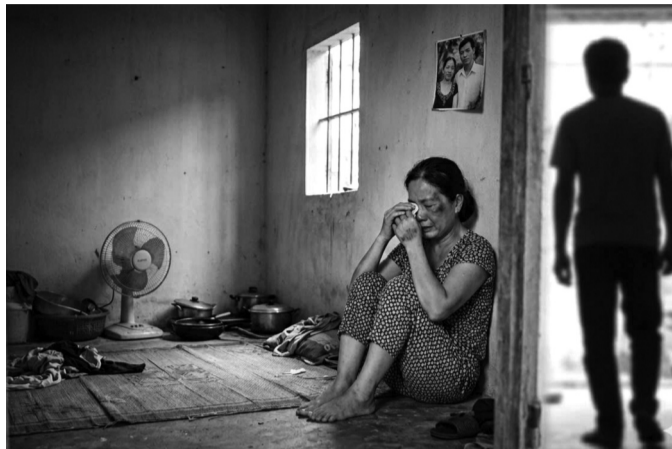
● Bạo lực trong các mối quan hệ “hôn nhân thực tế” đang đặt ra nhiều thách thức cho cơ quan quản lý. (Ảnh minh họa)

Lâu nay, nhận thức chung thường mặc định bạo lực gia đình (BLGD) chỉ xảy ra giữa những người có quan hệ hôn nhân hợp pháp. Tư duy này vô tình tạo ra một “vùng trắng” pháp lý, khiến các vụ bạo hành trong mối quan hệ chung sống như vợ chồng hay đối với con riêng, con nuôi thường khó bị xử lý triệt để. Trong khi đó, luật hiện hành đã tháo gỡ ranh giới về mặt giấy tờ, mở rộng phạm vi điều chỉnh đến các mối quan hệ ngoài hôn nhân truyền thống để xác lập nguyên tắc rõ ràng: Không thể dùng lý do thiếu ràng buộc pháp lý hay vỏ bọc “chuyện cá nhân” để làm ngơ trước các hành vi bạo lực.