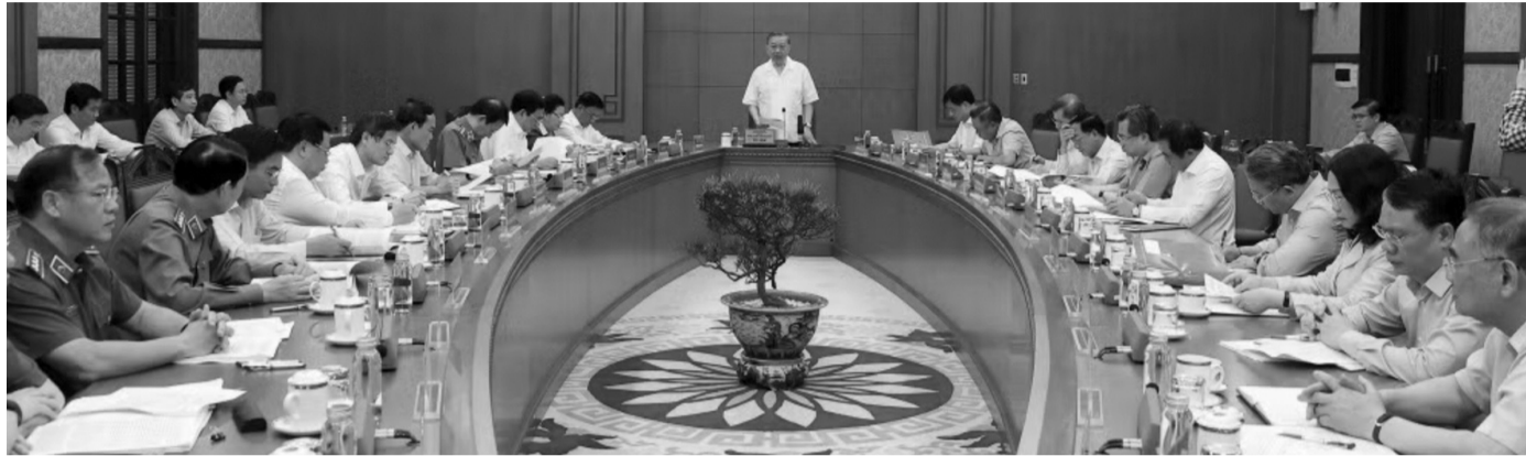
● Tổng Bí thư, Chủ tịch nước nhấn mạnh quyết tâm xây dựng nghị quyết với tư duy mới, tầm nhìn xa, nội dung sâu và giải pháp khả thi, có tính hành động cao.

Sáng 3/6, tại Trụ sở Trung ương Đảng, Tổng Bí thư, Chủ tịch nước Tô Lâm chủ trì cuộc làm việc với Đảng ủy Công an Trung ương và các cơ quan liên quan về Đề án “Xây dựng xã hội trật tự, kỷ cương, an toàn, lành mạnh, văn minh, hài hòa, phát triển”, để trình Bộ Chính trị cho ý kiến, làm cơ sở để báo cáo Ban Chấp hành Trung ương ban hành Nghị quyết về xây dựng xã hội trật tự, kỷ cương, an toàn, lành mạnh, văn minh, hài hòa, phát triển trong kỷ nguyên mới.