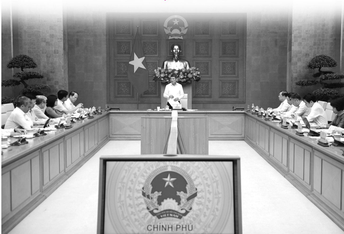
● Thủ tướng Lê Minh Hưng chủ trì làm việc với lãnh đạo Bộ Tư pháp ngày 11/5/2026.

Bộ Tư pháp vừa ban hành Kế hoạch Triển khai thực hiện Thông báo số 245/TB-VPCP ngày 12/5/2026 của Văn phòng Chính phủ về Kết luận của Thủ tướng Chính phủ Lê Minh Hưng tại cuộc họp về tình hình thực hiện nhiệm vụ từ đầu năm 2026 đến nay, phương hướng, nhiệm vụ trọng tâm trong thời gian tới của Bộ Tư pháp.