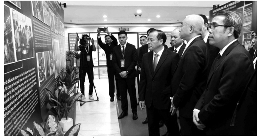
● Các đại biểu tham quan triển lãm tại Hội nghị.

Tại Hội nghị, các đại biểu đã tập trung đánh giá tình hình TPMT