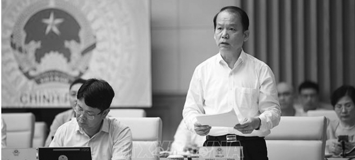
● Bộ trưởng Bộ Tư pháp Hoàng Thanh Tùng báo cáo kết quả và phương hướng triển khai các nhiệm vụ trọng tâm của ngành Tư pháp tại buổi làm việc với Thủ tướng Chính phủ Lê Minh Hưng ngày 11/5/2026.

Bộ Tư pháp vừa ban hành Kế hoạch Triển khai thực hiện Thông báo số 245/TB-VPCP ngày 12/5/2026 của Văn phòng Chính phủ về Kết luận của Thủ tướng Chính phủ Lê Minh Hưng tại cuộc họp về tình hình thực hiện nhiệm vụ từ đầu năm 2026 đến nay, phương hướng, nhiệm vụ trọng tâm trong thời gian tới của Bộ Tư pháp.