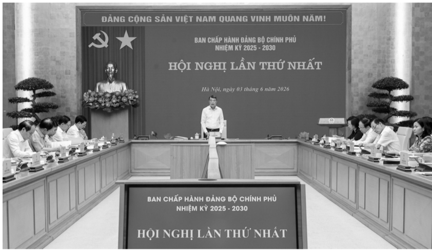
● Thủ tướng Chính phủ Lê Minh Hưng chủ trì Hội nghị lần thứ nhất Ban Chấp hành Đảng bộ Chính phủ nhiệm kỳ 2025 - 2030.

Thủ tướng nhấn mạnh, Quy chế làm việc của Đảng ủy Chính phủ phải khẳng định tinh thần đổi mới mạnh mẽ, phân cấp, phân quyền, rõ nguyên tắc, rõ quy trình, rõ trách nhiệm, rõ thẩm quyền của từng tập thể, từng cá nhân, cải cách hành chính, đơn giản hóa, cắt giảm thủ tục, đẩy mạnh chuyển đổi số, hiệu lực, hiệu quả. Văn phòng Đảng ủy Chính phủ phối hợp với Văn phòng Chính phủ rà soát, bảo đảm Quy chế làm việc của Đảng ủy phù hợp, đồng