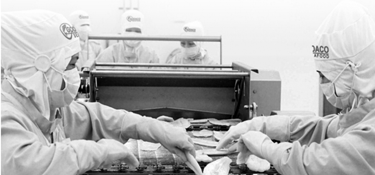
● 5 tháng đầu năm, nhiều lĩnh vực tăng trưởng khá.

Bức tranh kinh tế Việt Nam trong 5 tháng đầu năm 2026 ghi nhận nhiều tín hiệu khởi sắc khi sản xuất công nghiệp, xuất khẩu, tiêu dùng và thu hút đầu tư tiếp tục duy trì đà tăng trưởng tích cực. Trong bối cảnh kinh tế thế giới còn nhiều biến động, những kết quả đạt được sẽ tạo nền tảng quan trọng để nền kinh tế bứt tốc, hướng tới mục tiêu tăng trưởng cao và bền vững trong năm 2026.