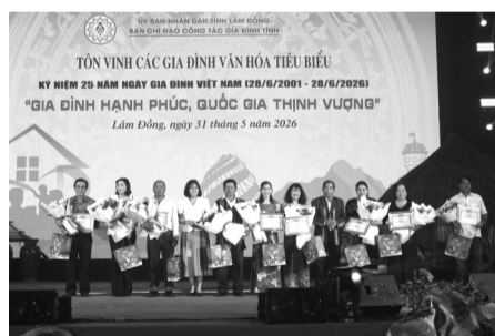
● Tại Lễ kỷ niệm 25 năm Ngày Gia đình Việt Nam của tỉnh Lâm Đồng, 17 gia đình văn hóa tiêu biểu đã được tuyên dương.