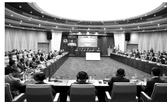
●Hội nghị có sự tham gia của đại diện các cơ quan chuyên trách PCMT các Bộ, ngành chức năng 4 quốc gia.