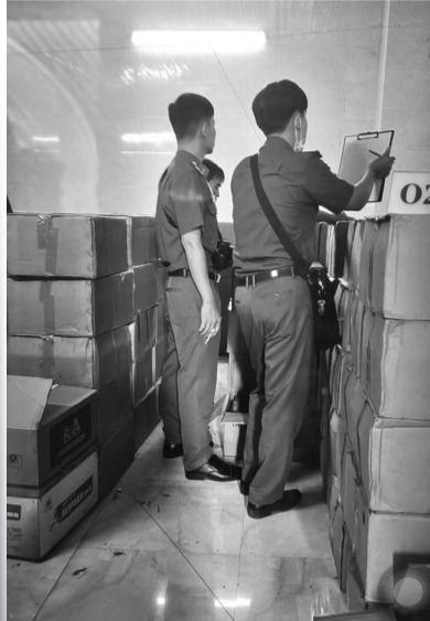
● Số thuốc BVTV có chứa chất cấm trong vụ án.