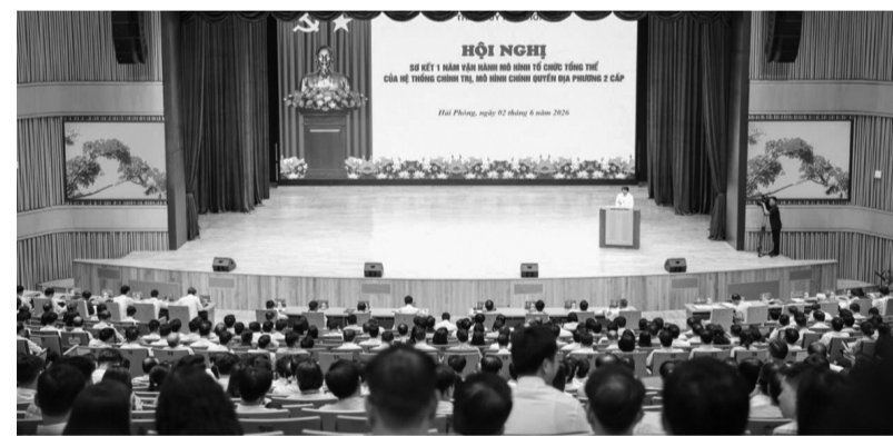
●Hội nghị cấp TP được tổ chức sau khi sơ kết tại 18 cụm cấp xã.