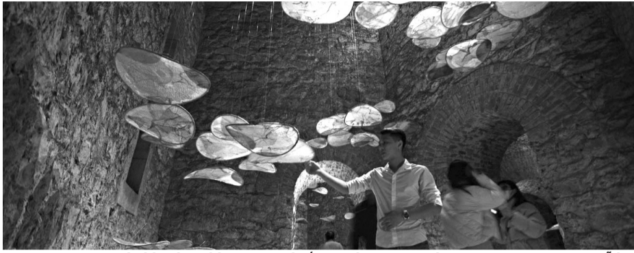
● Tương tác giữa du khách và không gian kiến trúc bên trong Tháp nước Hàng Đậu tại Lễ hội Thiết kế - Sáng tạo Hà Nội.

Những mùa “Lễ hội Thiết kế sáng tạo Hà Nội” không chỉ mang đến các hoạt động văn hóa hấp dẫn mà còn góp phần đánh thức giá trị di sản, làm đẹp cảnh quan đô thị và khẳng định vị thế của Thủ đô trong mạng lưới các thành phố sáng tạo của thế giới. Các chủ đề chính thức qua các năm của Lễ hội là: Năm 2021 “Tuần lễ Khởi nguồn Sáng tạo”; năm 2022 “Sáng tạo và Công nghệ”; năm 2023 “Dòng chảy”; năm 2024 “Giao lộ Sáng tạo”... Các lễ hội ấy đã thu hút hàng triệu người dân và du khách tới thưởng lãm, trải nghiệm. Điều đặc biệt là các hoạt động sáng tạo không làm mất đi vẻ đẹp nguyên bản của di sản mà ngược lại còn giúp công chúng hiểu sâu sắc hơn về giá trị lịch sử, văn hóa của từng địa điểm. Không ít du khách quốc tế bày tỏ sự bất ngờ khi nhận