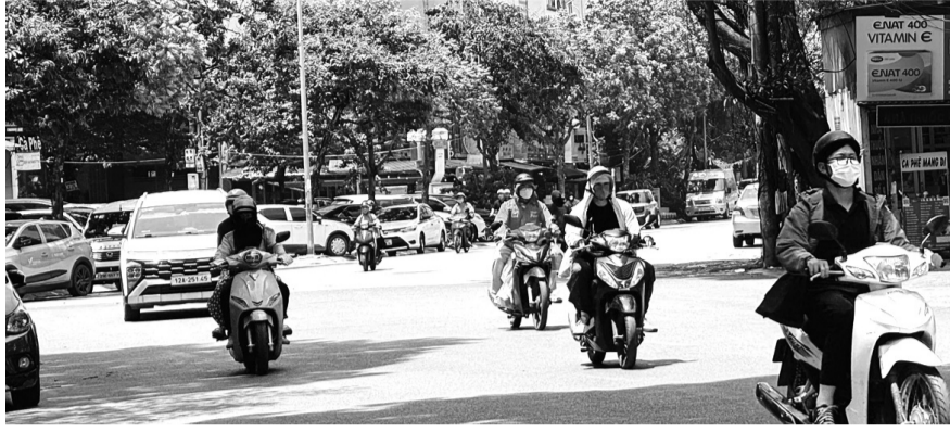
● Thời tiết nắng nóng ở Hà Nội khiến người dân ngại ra đường.

Trong khi đó, diện tích cây xanh và mặt nước ngày càng bị thu hẹp khiến khả năng điều hòa nhiệt tự nhiên suy giảm. Đơn cử, tại một số quận nội thành như: Đống Đa, Thanh Xuân, Hai Bà Trưng hay Cầu Giấy, mật độ xây dựng dày đặc cùng hệ thống giao thông đông đúc tạo nên những “túi nhiệt” cục bộ. Các tòa nhà