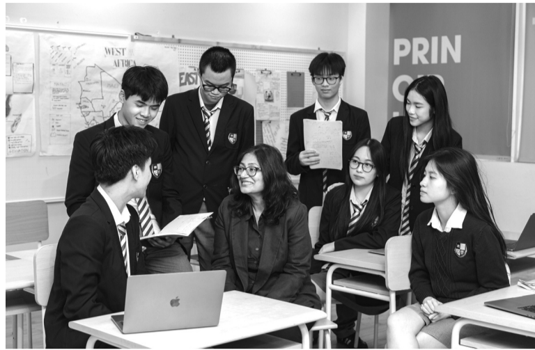
● Trường song ngữ chuẩn quốc tế.