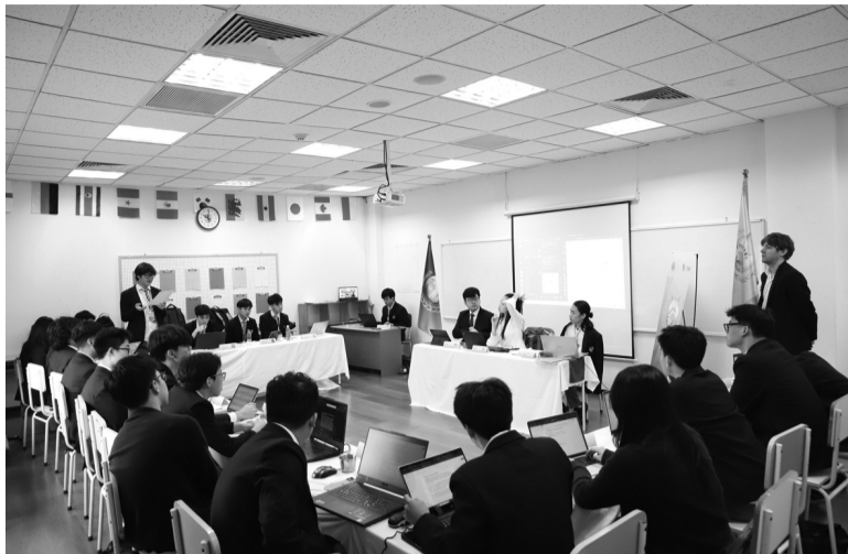
● Đa dạng trải nghiệm và cá nhân hóa việc học.