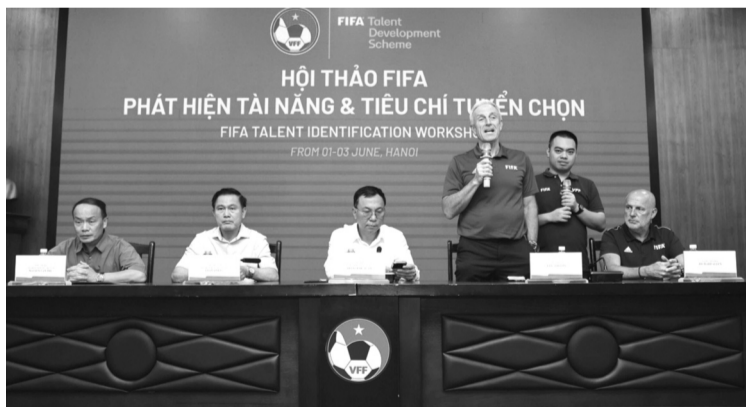
● VFF mở cuộc Hội thảo “Phát hiện tài năng và tiêu chí tuyển chọn của FIFA” để tuyển chọn tài năng trẻ.

Việc VFF mở cuộc Hội thảo “Phát hiện tài năng và tiêu chí tuyển chọn của FIFA” như một sự kỳ vọng các huấn luyện viên (HLV), nhà tuyển trạch sẽ áp dụng hiệu quả những tiêu chí và phương pháp đã được tiếp cận vào thực tiễn tại CLB và địa phương. Đồng thời, hệ thống đào tạo trẻ cần được rà soát, đồng bộ theo tiêu chuẩn FIFA, đặc biệt ở các lứa tuổi U12 và U14. VFF cũng định hướng tiếp tục tăng cường hợp tác với FIFA và AFC nhằm nâng