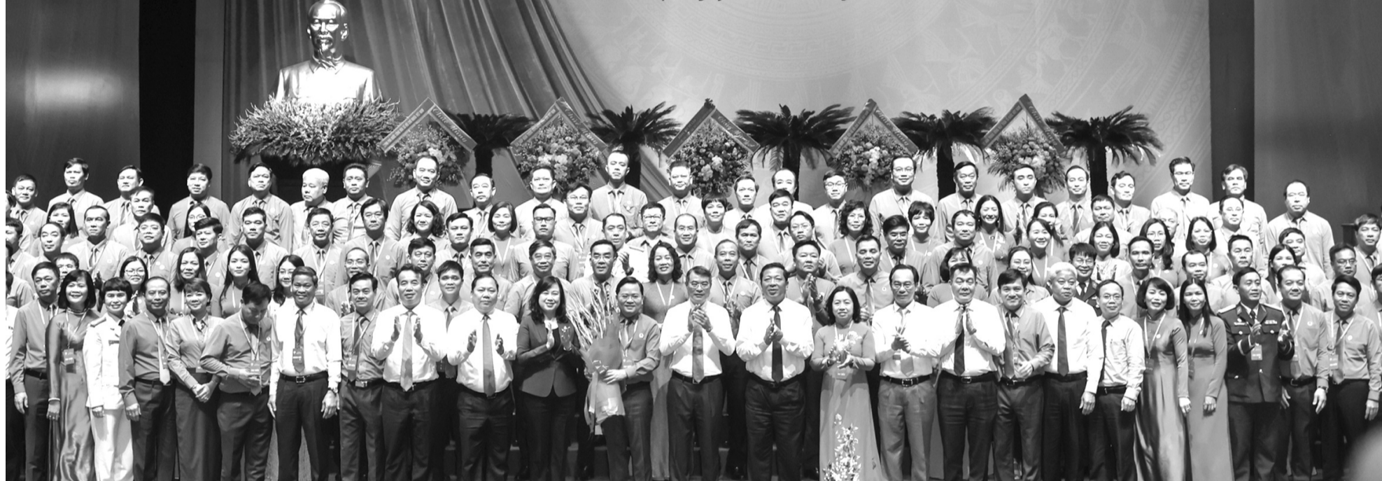
● Thủ tướng Chính phủ Lê Minh Hưng chụp ảnh lưu niệm tại Đại hội.

Sáng 5/6, tại Hà Nội, trong khuôn khổ Đại hội XIV Công đoàn Việt Nam, Thủ tướng Chính phủ Lê Minh Hưng đã chủ trì chương trình trao đổi, thảo luận với đại biểu dự Đại hội, với chủ đề "Công đoàn Việt Nam đồng hành với Chính phủ nâng cao năng suất lao động, thực hiện mục tiêu tăng trưởng hai con số".