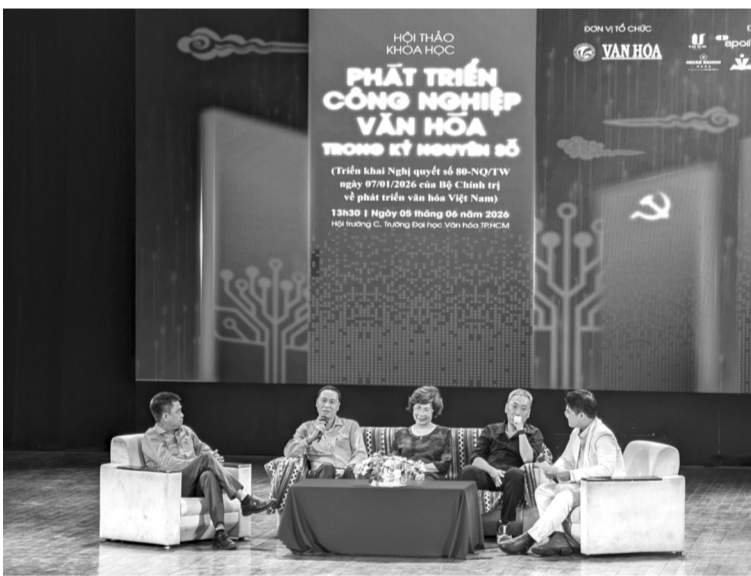
● Hội thảo diễn ra tại Trường ĐH Văn hóa TP HCM.

Hôm qua (5/6), Trường ĐH Văn hóa TP HCM phối hợp Báo Văn hóa (Bộ VH,TT&DL) tổ chức Hội thảo khoa học với chủ đề “Phát triển công nghiệp văn hóa (CNVH) trong kỷ nguyên số”. Đây là diễn đàn trao đổi học thuật và thực tiễn thiết thực nhằm tìm kiếm giải pháp đưa CNVH trở thành ngành kinh tế mũi nhọn, đóng góp đáng kể vào GDP, nâng cao hình ảnh quốc gia trên trường quốc tế.