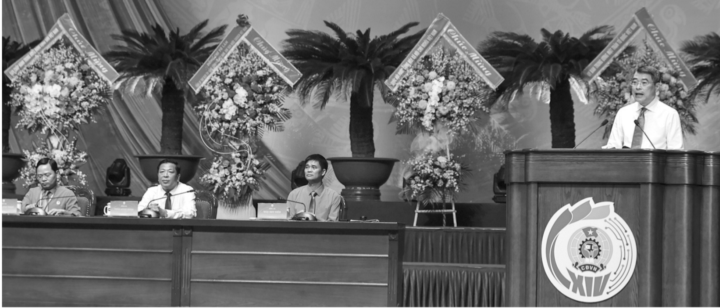
● Thủ tướng Chính phủ Lê Minh Hưng cho biết, Chính phủ sẽ có cơ chế, chính sách khuyến khích, tạo điều kiện cho doanh nghiệp đẩy mạnh đào tạo, thúc đẩy các phong trào thi đua, sáng kiến của người lao động.

Sáng 5/6, tại Hà Nội, trong khuôn khổ Đại hội XIV Công đoàn Việt Nam, Thủ tướng Chính phủ Lê Minh Hưng đã chủ trì chương trình trao đổi, thảo luận với đại biểu Đại hội, với chủ đề “Công đoàn Việt Nam đồng hành với Chính phủ nâng cao năng suất lao động, thực hiện mục tiêu tăng trưởng hai con số”.