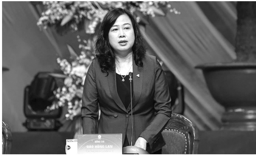
● Bộ trưởng Bộ Y tế Đào Hồng Lan tại chương trình trao đổi, thảo luận với đại biểu dự Đại hội XIV Công đoàn Việt Nam.

Bộ Y tế cũng sẽ tăng cường quan trắc môi trường nhằm bảo đảm môi trường an toàn cho NLD, đề xuất sửa đổi các quy định pháp luật về bảo hiểm xã hội, bảo hiểm y tế để phù hợp thực tế.