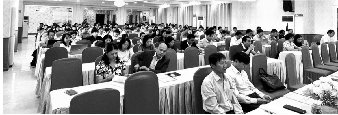
● Bồi dưỡng nâng cao năng lực chuyên môn, nghiệp vụ cho cán bộ, công tác viên thực hiện phòng, chống mại dâm.

hoạt động mại dâm thông qua các cơ sở y tế khu vực, cấp xã.