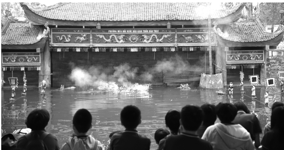
● Thúc đẩy học tiếng Anh và gìn giữ bản sắc Việt.

Quốc tế IB hướng tới phát triển tư duy phân biện, năng lực nghiên cứu, khả năng học tập độc lập và sự thích ứng trong môi trường học thuật quốc tế.