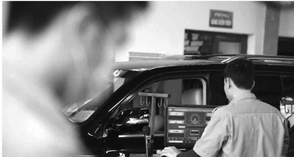
● Đăng kiểm viên không trực tiếp thực hiện công việc chuyên môn từ 36 tháng liên tục trở lên sẽ bị thu hồi chứng chỉ.

Trường hợp nộp qua dịch vụ bưu chính, trong thời hạn 3 ngày làm việc kể từ ngày nhận được hồ sơ, cơ quan có thẩm quyền