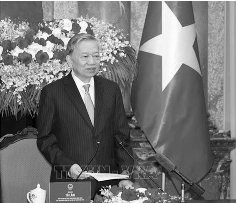
● Tổng Bí thư, Chủ tịch nước Tô Lâm phát biểu tại buổi gặp mặt.

Nhân dịp Kỷ niệm 85 năm Ngày truyền thống Người cao tuổi Việt Nam (6/6/1941 - 6/6/2026), chiều 5/6, tại Phủ Chủ tịch, Tổng Bí thư, Chủ tịch nước Tô Lâm đã gặp mặt 85 người cao tuổi tiêu biểu toàn quốc trong các phong trào thi đua yêu nước giai đoạn 2021 - 2026.