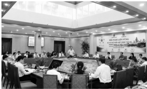
● Hội nghị do UBND TP Hà Nội phối hợp Bộ NN&MT tổ chức.

Sở NN&MT Hà Nội được giao chủ trì phối hợp các địa phương hoàn thiện các thủ tục sau ký kết, tham mưu tổ chức triển khai thực hiện Quy chế, tiếp tục hoàn thiện các nhiệm vụ trọng tâm về bảo vệ môi trường của TP; hướng tới mục tiêu phát triển xanh, bền vững, thích ứng hiệu quả với biến đổi khí hậu, nâng cao chất lượng sống của người dân trong toàn Vùng Thủ đô. VĂN SƠN