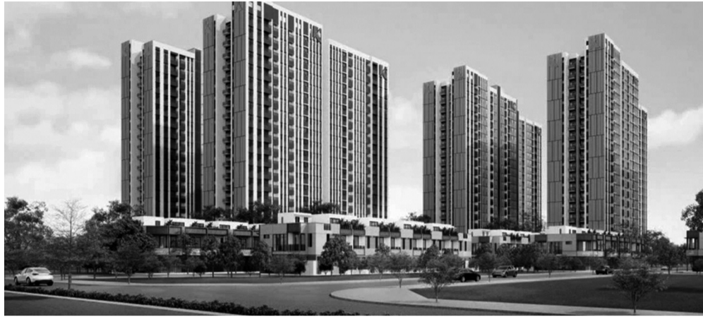
● Phối cảnh một dự án nhà ở xã hội tại TP HCM.

Thứ nhất , người dân chỉ nên theo dõi thông tin từ các nguồn chính thức như Cổng thông tin điện tử UBND TP, Trang thông tin