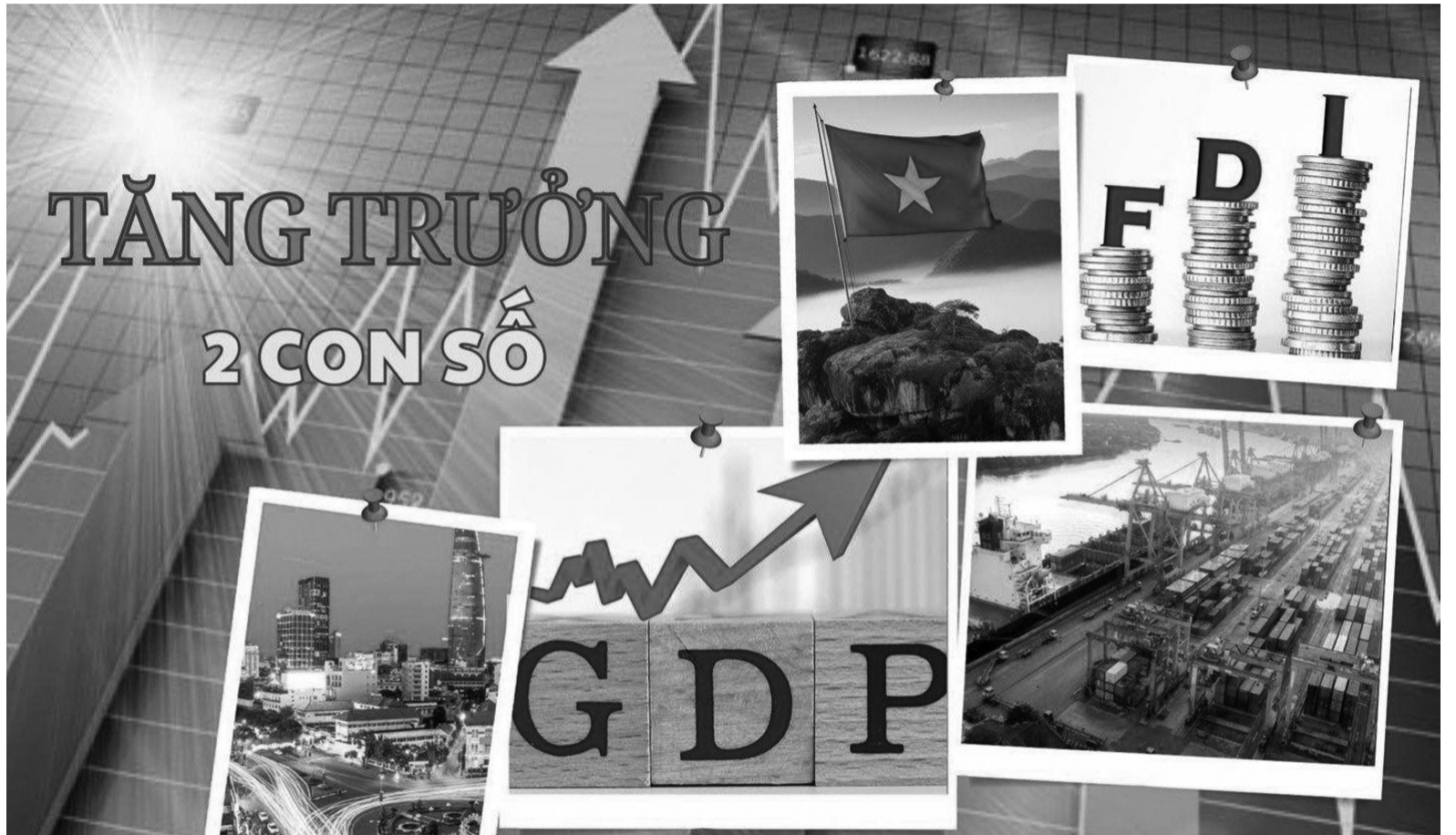
● Việt Nam tự tin, vững vàng bước vào giai đoạn phát triển mới với quyết tâm tăng trưởng cao, bền vững.

nước Việt Nam hòa bình, thống nhất, độc lập, dân chủ và giàu mạnh, và góp phần xứng đáng vào sự nghiệp cách mạng thế giới” vẫn luôn được mỗi đảng viên, mỗi người dân Việt Nam khắc ghi.