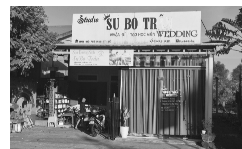
● Cơ sở giác hơi “Subo Trần”.

Theo trình bày của người trình báo, bà đến Huế thăm em gái và trong thời gian lưu trú đã sử dụng dịch vụ giác hơi tại cơ sở nói trên. Sau sự cố bỏng phải điều trị kéo dài, kế hoạch trở về nước của bà bị ảnh