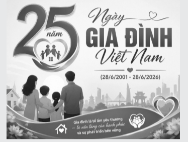
● Năm 2026 là năm kỷ niệm 25 năm Ngày Gia đình Việt Nam (28/6/2001 - 28/6/2026).

Sở Văn hóa và Thể thao Hà Nội đã ban hành kế hoạch tổ chức chuỗi hoạt động tôn vinh những giá trị tốt đẹp của gia đình Việt Nam. Điểm nhấn của chuỗi hoạt động là Hội nghị tuyên dương "Gia đình văn hóa" tiêu biểu