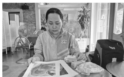
● Sau sự cố bỏng phải điều trị kéo dài, kế hoạch trở về nước của người phụ nữ bị ảnh hưởng.