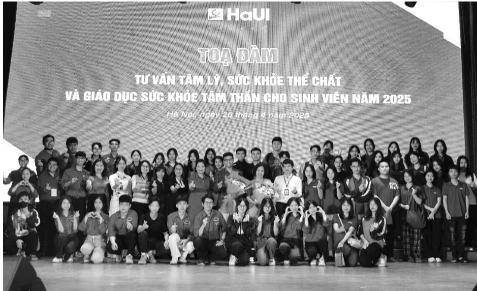
● Một chương trình tọa đàm tư vấn tâm lý, sức khỏe thể chất diễn ra tại Đại học Công nghiệp Hà Nội.