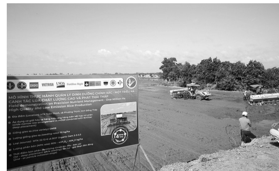
● Máy gieo sạ khí động kết hợp vùi phân tại mô hình vùng liên kết ở xã Phương Thịnh.