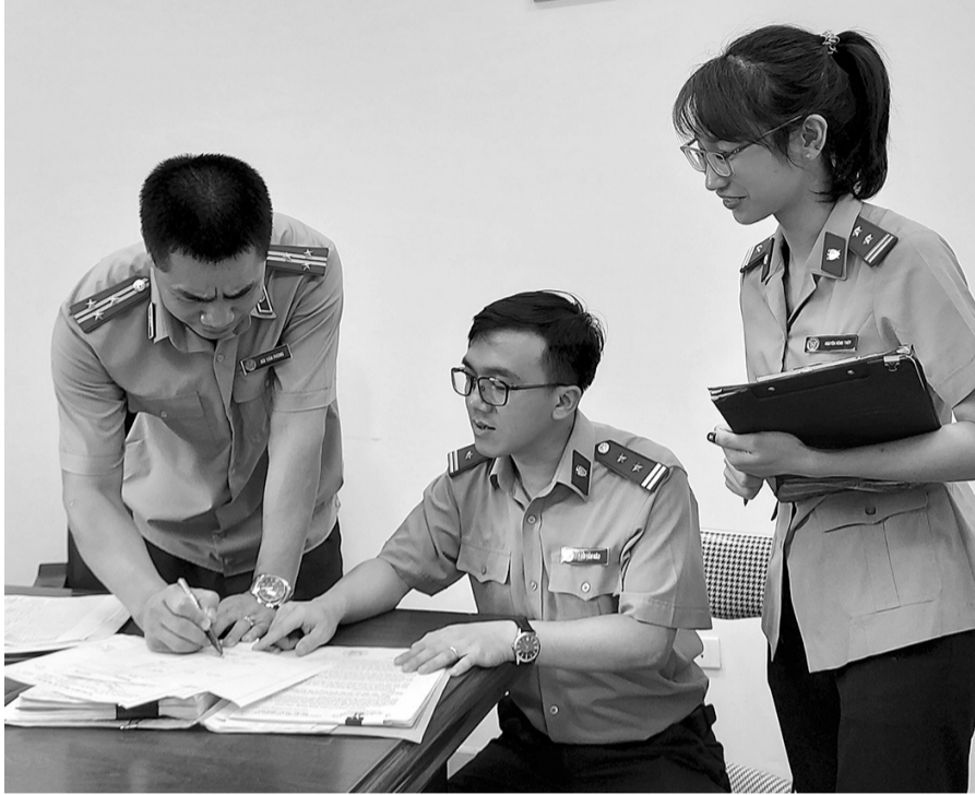
● Chấp hành viên trao đổi nghiệp vụ.

Bên cạnh đó, do các bản án hành chính thuộc trách nhiệm thi hành của UBND, Chủ tịch UBND cấp huyện (trước sáp nhập) được phân công, chuyển giao cho UBND, Chủ tịch UBND cấp xã thi hành, trong khi đây