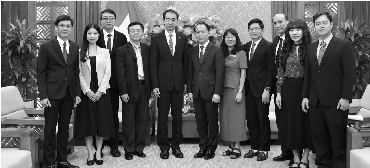
● Bộ trưởng Bộ Tư pháp Hoàng Thanh Tùng, Đại sứ Hà Vĩ và các đại biểu tham gia buổi tiếp.

Chiều 5/6, Bộ trưởng Bộ Tư pháp Hoàng Thanh Tùng đã tiếp Đại sứ Đặc mệnh toàn quyền nước Cộng hòa Nhân dân Trung Hoa tại Việt Nam Hà Vĩ nhằm trao đổi các định hướng tăng cường hợp tác trong lĩnh vực pháp luật và tư pháp giữa hai nước, góp phần triển khai tích cực kết quả chuyến thăm cấp Nhà nước tới Trung Quốc của Tổng Bí thư, Chủ tịch nước Tô Lâm vào tháng 4/2026 vừa qua.