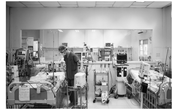
●Bên trong Khoa Hồi sức tích cực Bệnh viện Nhi đồng 2 TP HCM điều trị bệnh nhi sốt xuất huyết.

BS Quang cho biết đây là trường hợp may mắn được cứu sống, song cũng có bệnh nhân dù được điều trị tích cực vẫn không qua khỏi.