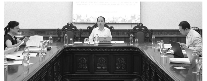
● Bộ trưởng Bộ Tư pháp Hoàng Thanh Tùng nhấn mạnh yêu cầu bảo đảm tính thống nhất, đồng bộ của hệ thống pháp luật trong việc hoàn thiện dự thảo Luật sửa đổi, bổ sung một số điều của Luật Trách nhiệm bồi thường của Nhà nước.

Cho ý kiến về việc hoàn thiện dự thảo Luật sửa đổi, bổ sung một số điều của Luật Trách nhiệm bồi thường của Nhà nước (TNBTCNN) tại cuộc họp vào cuối tuần qua, Bộ trưởng Bộ Tư pháp Hoàng Thanh Tùng nhấn mạnh ba yêu cầu cơ bản phải được quán triệt xuyên suốt trong quá trình nghiên cứu sửa đổi Luật, trong đó có yêu cầu phải bảo đảm tính thống nhất, đồng bộ của hệ thống pháp luật.