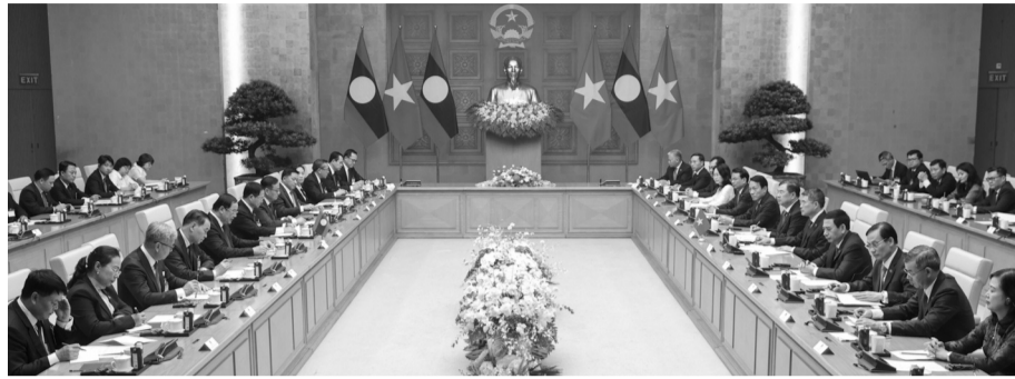
● Thủ tướng Chính phủ Lê Minh Hưng và Thủ tướng Sonexay Siphandone tiến hành hội đàm.

Để tiếp tục đưa quan hệ hai nước phát triển lên tầm cao mới, đặc biệt cụ thể hóa nội hàm "gắn kết chiến lược" Việt Nam - Lào trên các phương diện gắn kết song phương, gắn kết tiểu vùng và gắn kết khu vực, quốc tế, hai bên nhất trí tiếp tục duy trì hiệu quả các chuyến thăm, tiếp xúc cấp cao và các cấp; triển khai nghiêm túc, đạt chất lượng cao các thỏa thuận cấp cao, kết quả Kỳ họp 48 Ủy ban liên Chính phủ Việt Nam - Lào, tạo tiền đề để