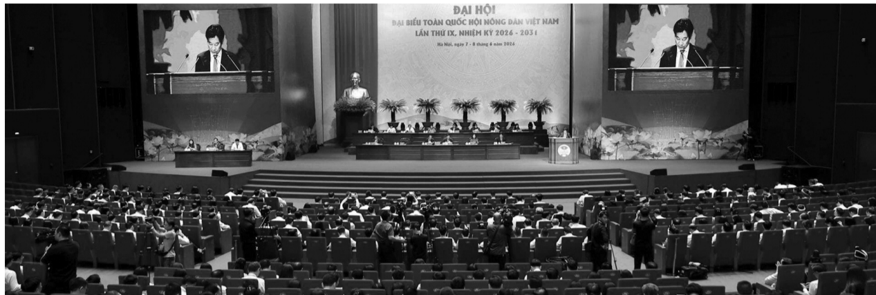
● Đại hội đại biểu toàn quốc Hội Nông dân Việt Nam lần thứ IX, nhiệm kỳ 2026 - 2031 có chủ đề: “Đoàn kết - Dân chủ - Đột phá - Hợp tác - Phát triển” với gần 600 đại biểu chính thức tham dự.

Sáng 7/6, tại Hà Nội, Đại hội đại biểu toàn quốc Hội Nông dân Việt Nam lần thứ IX, nhiệm kỳ 2026 - 2031 chính thức khai mạc phiên làm việc đầu tiên với sự tham dự của gần 600 đại biểu tiêu biểu đại diện cho hơn 10 triệu cán bộ, hội viên nông dân trên cả nước.