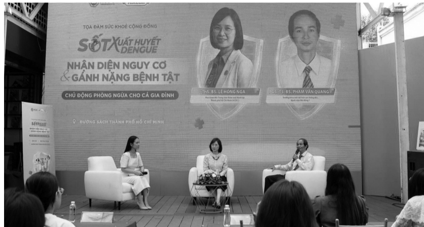
● Tọa đàm do HCDC tổ chức.

Tại Tọa đàm “Sốt xuất huyết Dengue: Nhận diện nguy cơ và gánh nặng bệnh tật - Chủ động phòng ngừa cho cả gia đình” vừa diễn ra tại TP HCM, đại diện Trung tâm Kiểm soát bệnh tật TP HCM (HCDC) cho biết, sốt xuất huyết Dengue (SXH) lưu hành quanh năm tại TP HCM nhưng thường gia tăng mạnh từ giữa tháng 6 trở đi. Năm nay, dịch bệnh xuất hiện sớm hơn thường lệ. Tính từ đầu năm đến ngày 31/5, TP ghi nhận 17.718 ca mắc, tăng hơn 64,6% so với cùng kỳ năm trước.