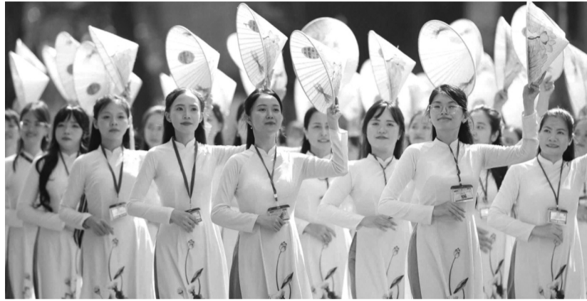
● Hình ảnh phụ nữ Việt Nam rạng ngời, mạnh mẽ trong lễ diễu binh, diễu hành kỷ niệm 50 năm thống nhất đất nước năm 2025.

Mỗi phong trào thi đua và cuộc vận động được lựa chọn ở từng giai đoạn đều có tác động chuyển biến rõ nét trong đời sống phụ nữ và cộng đồng, khơi dậy được tinh thần yêu nước, khát vọng cống hiến của các tầng lớp phụ nữ Việt Nam, thu hút được sự đồng hành của cấp ủy, chính quyền các cấp và toàn xã hội, nhiều mô hình, điển hình phụ nữ tiêu biểu được nhân rộng, tạo hiệu ứng tích cực trong xã hội.