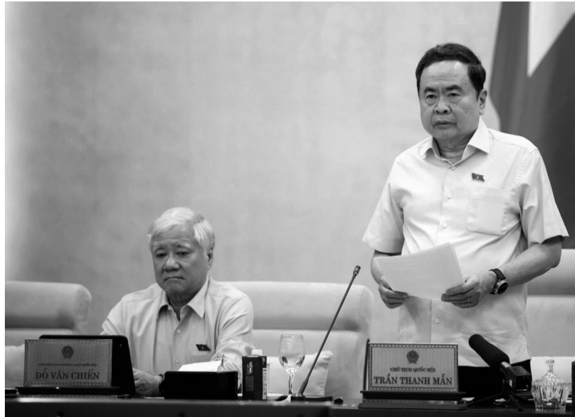
● Chủ tịch Quốc hội Trần Thanh Mẫn phát biểu khai mạc Phiên họp.

Chủ tịch Quốc hội nhấn mạnh, đây là chuyên đề giám sát đầu tiên của Quốc hội khóa XVI. Vì vậy, công tác chuẩn bị phải được tiến hành thật chặt chẽ, bài bản và khoa học ngay từ khâu đầu tiên. Đặc biệt, hoạt động giám sát lần này phải gắn kết chặt chẽ với các chỉ đạo chiến lược của Trung ương về phòng, chống tham nhũng, lãng phí, tiêu