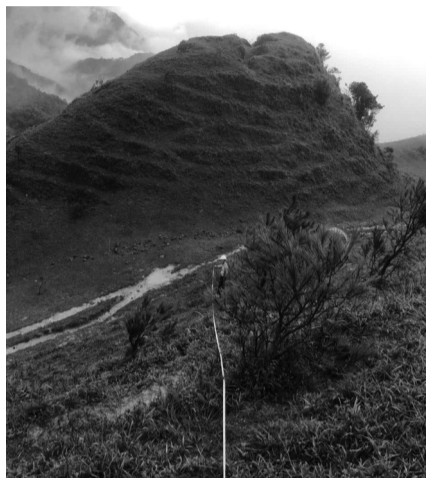
● Cán bộ Sở Công Thương tỉnh Lạng Sơn khảo sát, đo gió trên núi.