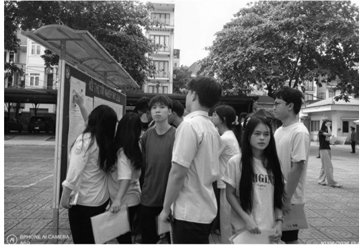
● Thí sinh trong buổi làm thủ tục dự thi tại điểm thi THPT Yên Hòa (Hà Nội).

Sáng nay - 11/6, thí sinh kỳ thi THPT 2026 làm bài thi Ngữ văn trong 120 phút, bắt đầu từ 7h35. Buổi chiều cùng ngày, thí sinh thi môn Toán trong 90 phút, bắt đầu làm bài lúc 14h30.