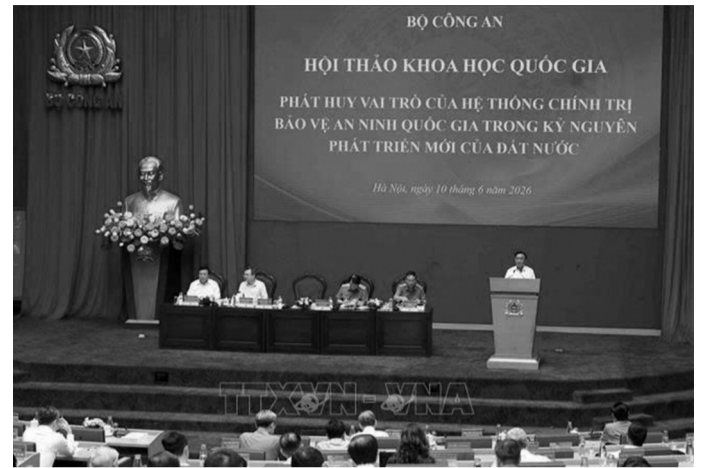
● Hội thảo khoa học quốc gia do Bộ Công an tổ chức.

Hoàn thiện cơ chế, chính sách, pháp luật và các biện pháp bảo vệ an ninh quốc gia