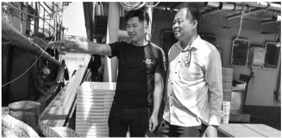
● Đại diện Ban Quản lý Cảng cá Lạch Quèn (bên phải) trao đổi với ngư dân về hoạt động của tàu cá.

thác IUU. Tại đây, toàn bộ hoạt động tàu cá cập, rời cảng, bốc dỡ sản phẩm đều được giám sát bằng hệ thống camera và dữ liệu số. Các thông tin về loài thủy sản, sản lượng khai thác, vùng đánh bắt được đối chiếu trực tiếp với nhật ký khai thác, dữ liệu VMS, hệ thống eCDT.