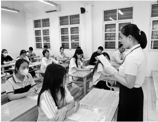
● Thí sinh kỳ thi THPT 2026. (Ảnh trong bài: PV)