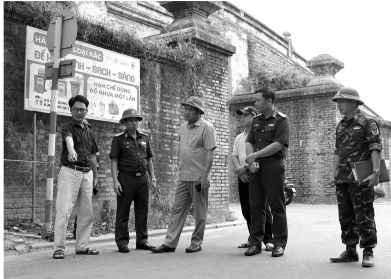
● Các nhân chứng cho rằng nơi chôn các liệt sĩ tại đường Tôn Thất Thiệp giao với đường Thái Phiên, sát Cửa Chánh Tây, Kinh thành Huế.

Người dân và các nhân chứng mong muốn cơ quan chức năng sớm triển khai áp dụng các biện pháp khoa học để khảo sát, xác