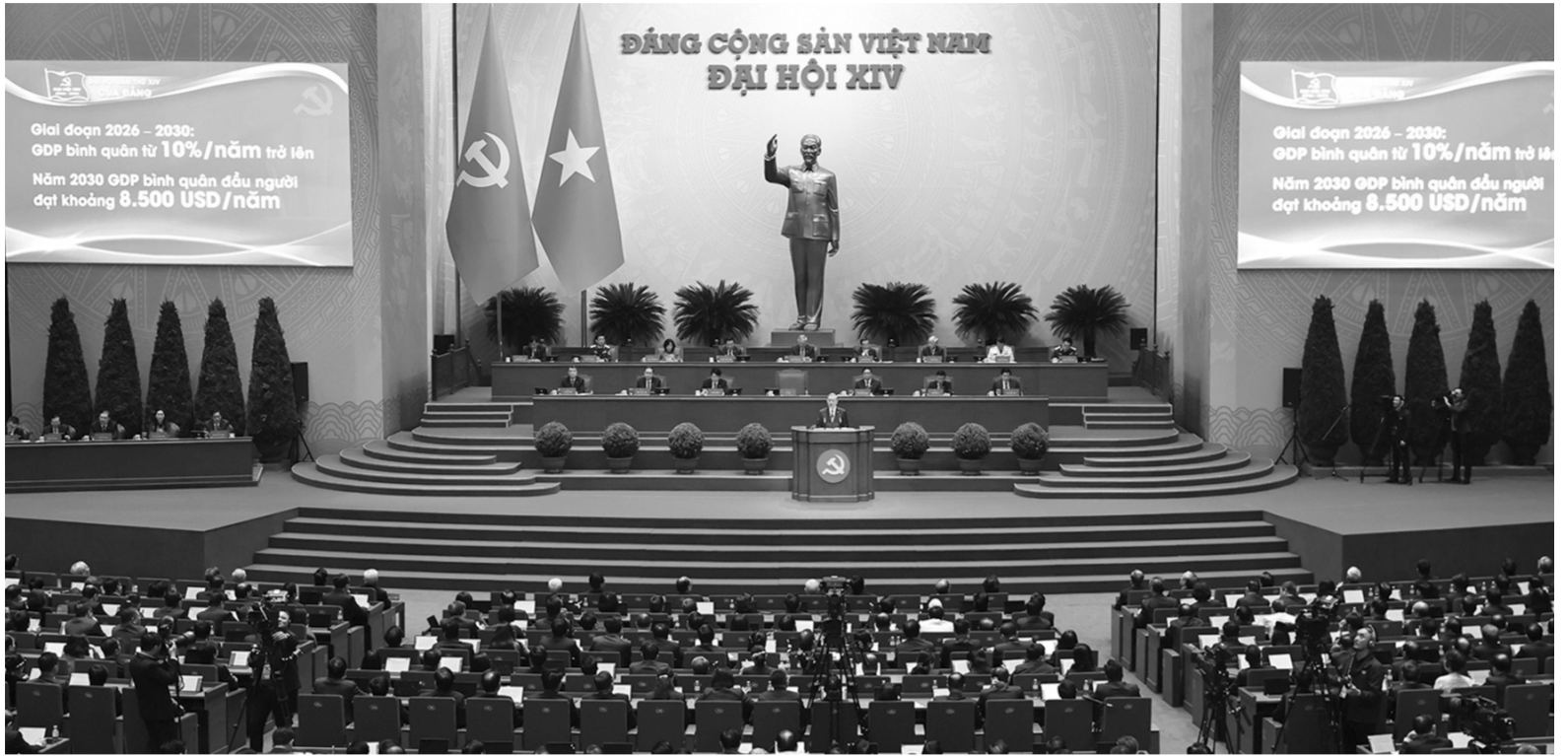
● Báo cáo của Ban Chấp hành Trung ương Đảng khóa XIII về các văn kiện trình Đại hội XIV của Đảng, do Tổng Bí thư Tô Lâm (nay là Tổng Bí thư, Chủ tịch nước) trình bày tại Phiên khai mạc Đại hội đại biểu toàn quốc lần thứ XIV của Đảng nêu rõ: Công tác cán bộ phải thực sự là “then chốt của then chốt”.

Từ những định hướng mang tính chiến lược tại Đại hội XIV của Đảng, những chỉ đạo gần đây của Tổng Bí thư, Chủ tịch nước Tô Lâm đã làm rõ hơn yêu cầu đổi mới công tác cán bộ trong giai đoạn phát triển mới. Trả lời phỏng vấn báo chí, Tổng Bí thư, Chủ tịch nước nhấn mạnh, đổi mới phương thức lãnh đạo phải hướng tới xây dựng một nền quản trị quốc gia hiện đại, kỷ cương, minh bạch, hiệu quả và phục vụ Nhân dân. Muốn vậy, yếu tố quyết định vẫn là con người - trước hết là đội ngũ cán bộ, đảng viên, nhất là người đứng đầu. Yêu cầu đặt ra hiện nay không chỉ là có phẩm chất