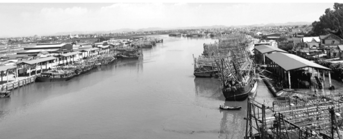
● Một góc cảng cá Lạch Quèn, xã Quỳnh Phú (Nghệ An).