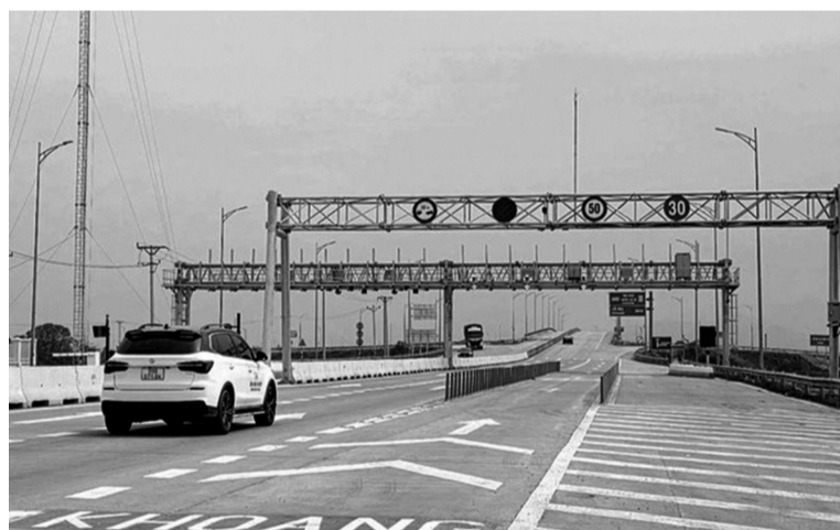
● Trạm thu phí trên cao tốc Mai Sơn - QL45.

Với các dự án thành phần thuộc giai đoạn 2021 - 2025, Bộ