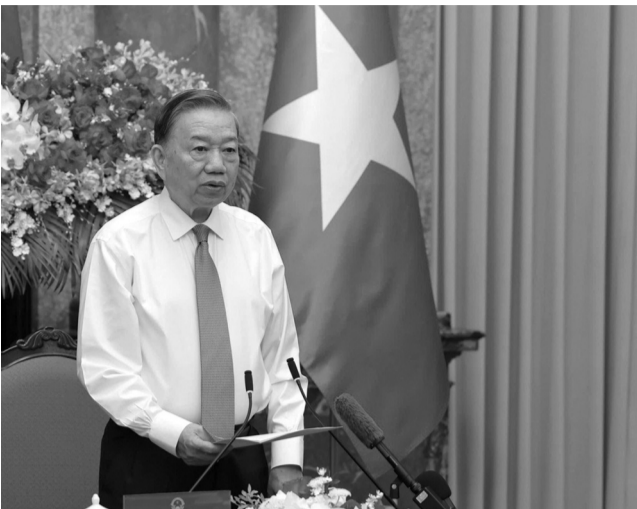
● Tổng Bí thư, Chủ tịch nước Tô Lâm nhấn mạnh: “Sự tử tế là vốn xã hội, là sức mạnh văn hóa, là một phần nền tảng của một quốc gia văn minh”.

Nhân dịp kỷ niệm 78 năm Ngày Bác Hồ ra Lời kêu gọi thi đua ái quốc (11/6/1948 - 11/6/2026), sáng 10/6, tại Phủ Chủ tịch, Tổng Bí thư, Chủ tịch nước Tô Lâm gặp mặt 100 điển hình tiên tiến trong Chương trình “Việc tử tế” của Đài Truyền hình Việt Nam. Trong không khí ấm áp, xúc động, các đại biểu đã chia sẻ những câu chuyện về hành trình cống hiến thầm lặng, bền bỉ, có ý nghĩa thiết thực đối với cộng đồng và xã hội.