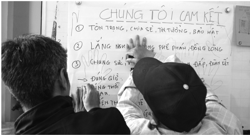
● Hiện nay nhiều mô hình phòng, chống BLGD hướng tới đối tượng mục tiêu là nam giới đã và đang vận hành hiệu quả tại nhiều tỉnh, thành trên cả nước. (Ảnh minh họa - Nguồn: Bộ VH,TT&DL)

Từ tháng 10/2019 đến tháng 9/2022, Tổ chức HAGAR International tại Việt Nam đã thực hiện Dự án “Nâng cao năng lực cán bộ và nhận thức người dân trong việc cải thiện tiếp cận dịch vụ hỗ trợ cho phụ nữ và trẻ em chịu ảnh hưởng bởi bạo lực giới” tại 4 xã trên địa bàn hai tỉnh địa bàn tỉnh Yên Bái (cũ, nay là tỉnh Lào Cai) và Nghệ An.