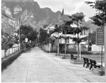
● Diện mạo nông thôn tại Quảng Trị ngày càng khởi sắc từ nguồn lực các CTMTQG.

hạn chế, tác động đến tiến độ giải ngân. Việc tích hợp các chương trình sẽ tháo gỡ những tồn tại trên.