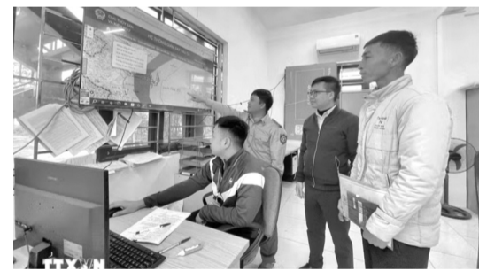
• Mọi hoạt động của tàu cá ra vào, bốc dỡ hàng hóa tại cảng cá Lạch Bạng được giám sát chặt chẽ.

Thanh Hóa còn đưa công nghệ số vào từng khâu quản lý. Tại các cảng cá chỉ định, mọi tàu cá ra vào cảng đều được kiểm tra, giám sát, cập nhật dữ liệu lên hệ thống eCDT. Thông tin về sản lượng khai thác, vị trí đánh bắt,