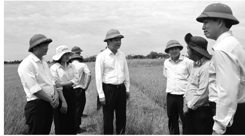
• Cán bộ chức năng tỉnh Quảng Trị kiểm tra thực tế tại địa phương trong quá trình triển khai Nghị quyết 257.

- Có thể nói, Nghị quyết 257 đã tích hợp 3 Chương trình mục tiêu quốc gia (CTMTQG); là quyết sách rất kịp thời, đúng hướng, mang tính đột phá. Đây không chỉ là sự điều chỉnh về cơ chế mà còn là bước chuyển quan trọng về tư duy phát triển, từ phân tán sang