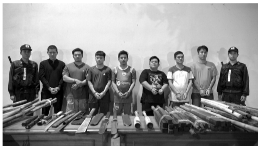
● Một số đối tượng trong vụ án.