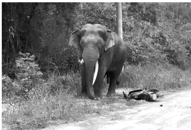
● Voi rừng đi sâu vào khu dân cư, người đi đường phải quăng xe bỏ chạy.