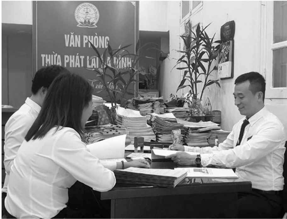
● Hướng dẫn người dân làm thủ tục thi hành án.

Cụ thể, Luật đã bổ sung các quy định về Thừa hành viên và Văn phòng