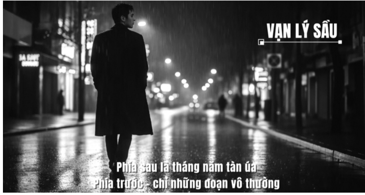
● Một tác phẩm âm nhạc bằng AI thu hút nhiều lượt xem.

Trí tuệ nhân tạo (AI) đang mở ra những cơ hội chưa từng có cho ngành công nghiệp âm nhạc, nhưng cũng đặt ra nhiều thách thức đối với người sáng tác và đời sống nghệ thuật. Chỉ với vài dòng mô tả, AI có thể tạo ra một ca khúc hoàn chỉnh trong vài phút. Sự tiện lợi ấy khiến nhiều người lo ngại về nguy cơ mai một cảm xúc sáng tạo, xâm phạm bản quyền và làm phai nhạt giá trị lao động nghệ thuật.