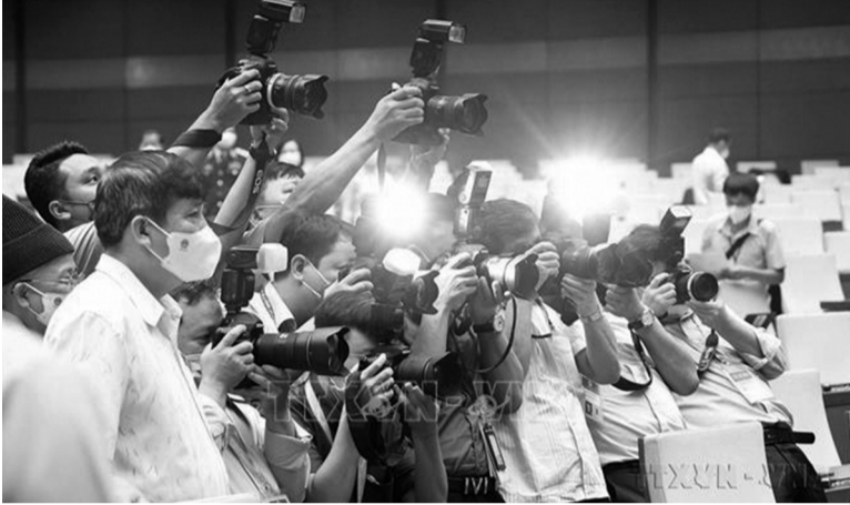
● Ảnh minh họa: TTXVN

Bộ Văn hóa, Thể thao và Du lịch đã ban hành Thông tư 13/2026/TT-BVHTTDL quy định về điều kiện, hoạt động, hồ sơ thông báo thành lập cơ quan thường trú, văn phòng đại diện, cử phóng viên thường trú và mẫu giấy giới thiệu khi hoạt động nghiệp vụ báo chí.