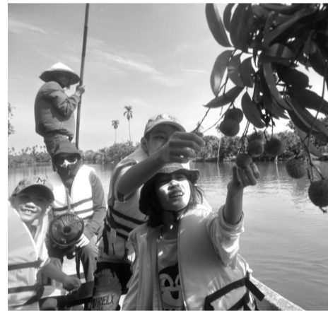
● Trẻ em rất thích thú khi trải nghiệm câu cá ở Khu du lịch.