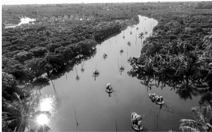
● Khu du lịch sinh thái Đồng Mẩn (xã Thanh Hà, TP Hải Phòng) mang vẻ đẹp giản dị của miền quê sông nước.

Sau khoảng 20 phút lênh đênh trên sông, du khách cập bến và bắt đầu hành trình khám phá Khu du lịch sinh thái Đồng Mẩn rộng hơn 5ha. Vải thiều là loại cây chủ lực ở đây với hàng nghìn gốc vải lâu năm. Vào mùa thu