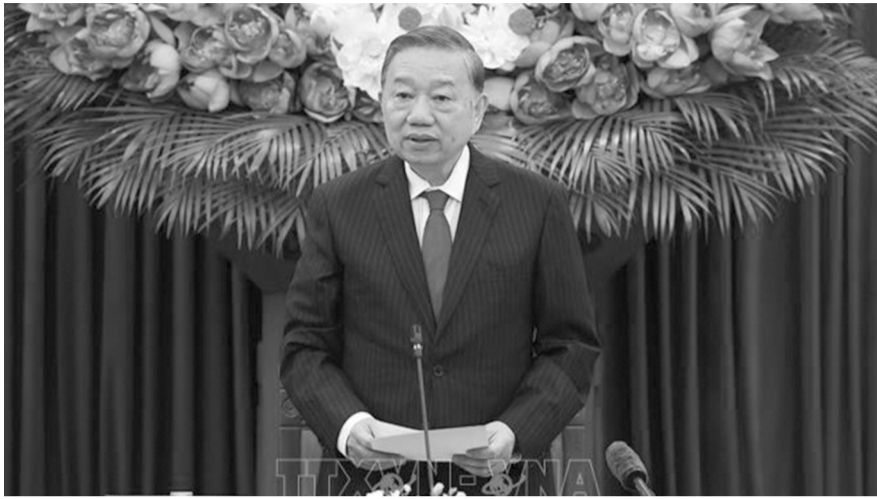
● Tổng Bí thư, Chủ tịch nước Tô Lâm chủ trì cuộc làm việc.

Tổng Bí thư, Chủ tịch nước đề nghị Hội đồng cần phối hợp chặt chẽ với các cơ quan, đơn vị liên quan phát huy