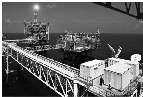
● Thăm dò và khai thác dầu khí góp phần bảo đảm an ninh năng lượng quốc gia.

Theo Quy hoạch điện VIII điều chỉnh, nhu cầu tiêu thụ điện, than, khí và LNG sẽ gia tăng đáng kể trong những năm tới. Tuy nhiên, nhiều mỏ dầu khí lớn trong nước như Bạch Hổ, Rồng, Sư Tử Đen đã bước vào giai đoạn suy giảm sản lượng sau thời gian dài khai thác. Nhiều mỏ khí tại Đông Nam Bộ và Tây Nam Bộ cũng ghi nhận lưu lượng giảm mạnh, khiến Việt Nam