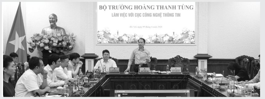
● Bộ trưởng Bộ Tư pháp Hoàng Thanh Tùng chủ trì buổi làm việc với Cục CNTT.