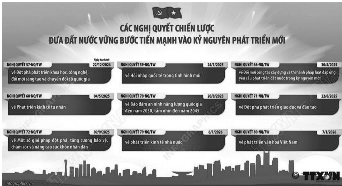
● Từ cuối năm 2024 đến nay, Bộ Chính trị đã ban hành các nghị quyết chiến lược, tập trung vào các lĩnh vực then chốt của phát triển đất nước. Đây là những chủ trương, quyết sách lớn để tháo gỡ rào cản, khơi thông nguồn lực đưa đất nước phát triển nhanh, bền vững. (Ảnh đồ họa: TTXVN)

Một yêu cầu rất quan trọng trong cuộc chiến phản bác các luận điệu phản động hiện nay là đổi mới mạnh mẽ phương thức đấu tranh, nhất là trên không gian mạng. Các thế lực thù địch