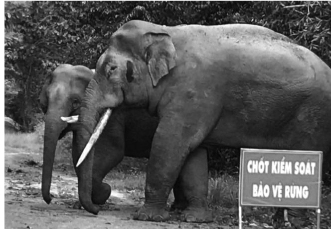
● Voi rừng xuất hiện ở chốt bảo vệ rừng.

Bước đầu, cơ quan chức năng xác định Hạ đã chiếm đoạt tổng cộng 653 triệu đồng của ba bị hại. Hiện Cơ quan CSĐT đang tiếp tục mở rộng điều tra. X.L