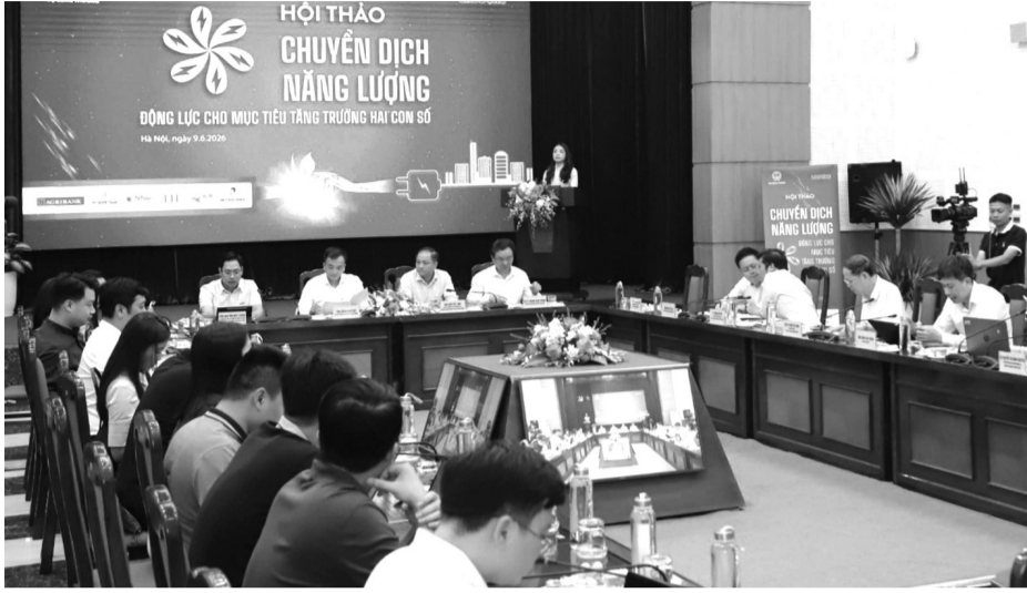
● Các chuyên gia, diễn giả tham gia Hội thảo.