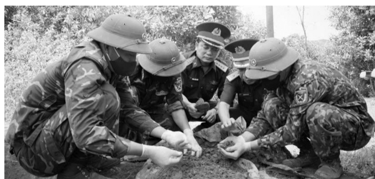
● Không chỉ là nhiệm vụ chính trị quan trọng, “Chiến dịch 500 ngày đêm đầy mạnh thực hiện tìm kiếm, quy tập và xác định danh tính hài cốt liệt sĩ” còn là mệnh lệnh từ trái tim, là trách nhiệm thiêng liêng.

Ngày 2/4/2026, Ban Chỉ đạo quốc gia đã phát động “Chiến dịch 500 ngày đêm đầy mạnh thực hiện tìm kiếm, quy tập và