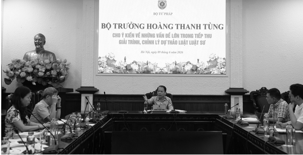
● Bộ trưởng Bộ Tư pháp Hoàng Thanh Tùng đánh giá cao dự thảo Luật Luật sư (sửa đổi) đã tiếp cận theo hướng thu gọn các quy định.