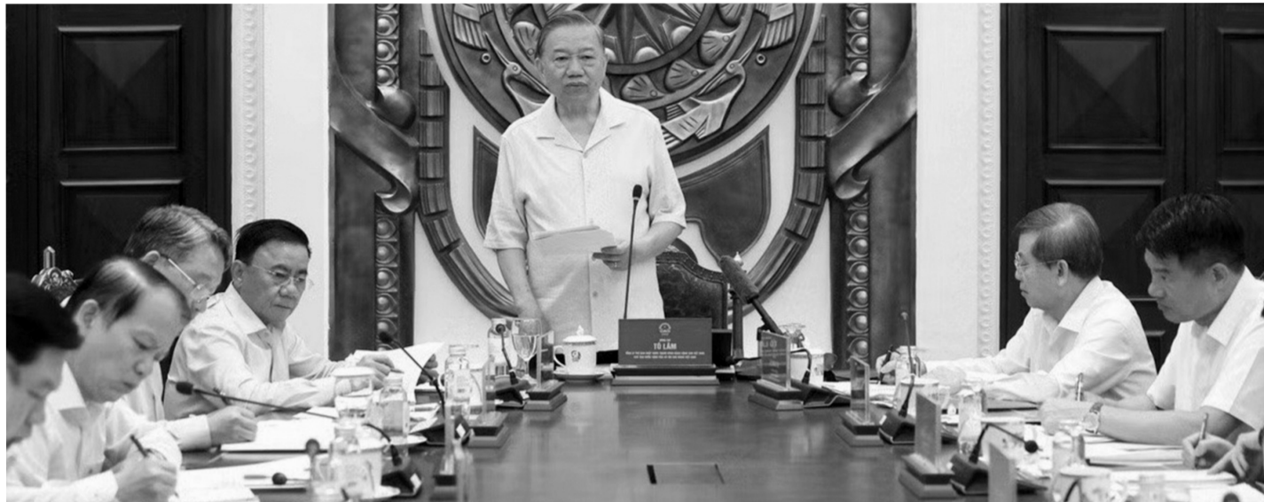
● Tổng Bí thư, Chủ tịch nước Tô Lâm chủ trì buổi làm việc với một số Bộ, ban, ngành, cơ quan về tổ chức, hoạt động của Ban Chỉ đạo Trung ương về hoàn thiện thể chế, pháp luật và Ban Chỉ đạo Cải cách tư pháp Trung ương ngày 13/5/2026.

Thay mặt Bộ Chính trị, Tổng Bí thư, Chủ tịch nước Tô Lâm vừa ký Quy định số 193-QĐ/TW (Quy định 193) về chức năng, nhiệm vụ, quyền hạn, chế độ làm việc, quan hệ công tác của Ban Chỉ đạo Trung ương về hoàn thiện thể chế và thực thi pháp luật.