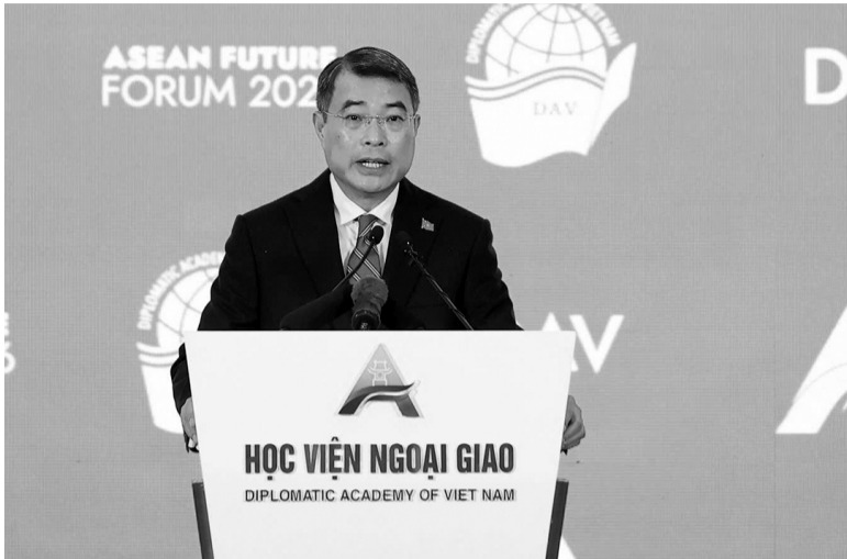
● Thủ tướng Lê Minh Hưng phát biểu tại Diễn đàn.

Diễn đàn Tương lai ASEAN là sáng kiến của Việt Nam, được công bố tại Hội nghị Cấp cao ASEAN năm 2023. Qua 2 kỳ tổ chức năm 2024 và 2025, nhiều ý tưởng, sáng kiến từ Diễn đàn đã được tiếp thu, phản ánh trong văn kiện của các Hội nghị Cấp cao ASEAN cùng năm. Điều đó cho thấy AFF không chỉ là nơi trao đổi học thuật, mà thực sự hỗ trợ thiết thực cho các tiến trình chính thức của ASEAN, góp phần định hình tương lai phát triển của ASEAN, cũng như thúc đẩy hợp tác giữa ASEAN và các đối tác.