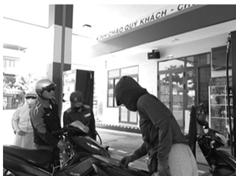
●Cán sớm hoàn thiện cơ chế giá cho xăng E10 tạo điều kiện cho doanh nghiệp duy trì nguồn cung ổn định.

Theo đó, các doanh nghiệp phải thực hiện nghiêm quy định về phối trộn, cung ứng xăng sinh học; bảo đảm nguồn hàng