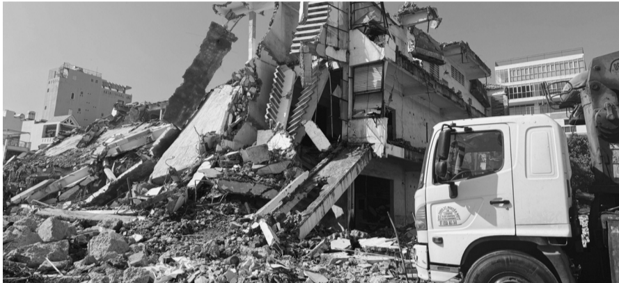
● Mỗi ngày TP HCM phát sinh khoảng 15.000 tấn CTR, trong đó có lượng lớn CTRXD.

Hiệp hội Xây dựng & Vật liệu xây dựng TP HCM (SACA) vừa tổ chức Hội thảo “Triển khai đề án tái chế chất thải rắn xây dựng (CTRXD) TP HCM giai đoạn 2026 - 2030, định hướng 2045”. Hội thảo nhằm triển khai chủ trương của UBND TP HCM về quản lý, tái chế CTRXD; thúc đẩy hình thành hệ sinh thái tái chế theo mô hình kinh tế tuần hoàn, góp phần phát triển đô thị bền vững, nâng cao năng lực tự chủ nguồn vật liệu xây dựng.