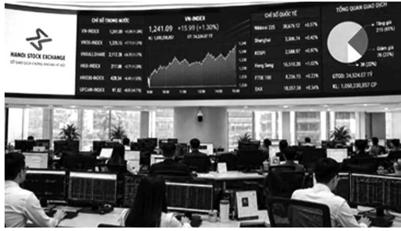
●Thị trường chứng khoán Việt Nam nhận được nhiều đánh giá tích cực từ các chuyên gia tài chính quốc tế.

UBS cho biết, lần đầu tiên Việt Nam đã xây dựng được kế hoạch nâng hạng thị trường được Chính phủ phê duyệt chính thức. Theo đó, kế hoạch tập trung vào các nội dung trọng tâm như triển khai OTA, đưa CCP vào vận hành và từng bước nới lỏng giới hạn sở hữu nước ngoài