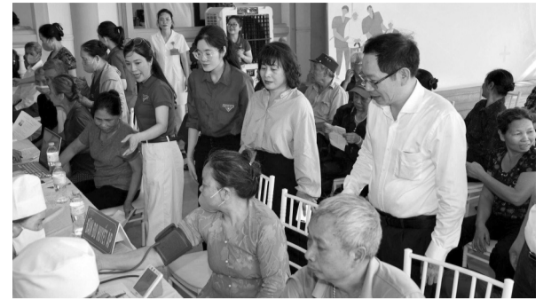
● Tính đến hết tháng 5/2026, toàn TP Hải Phòng đã tổ chức KSK cho 35.402 người thuộc nhóm người cao tuổi, người yếu thể.

UBND Hải Phòng vừa ban hành Kế hoạch 201/KH-UBND về tổ chức khám sức khỏe định kỳ (KSKĐK) hoặc khám sàng lọc (KSL) miễn phí cho người dân trên địa bàn, thay thế Kế hoạch 180/KH-UBND ngày 15/5/2026.