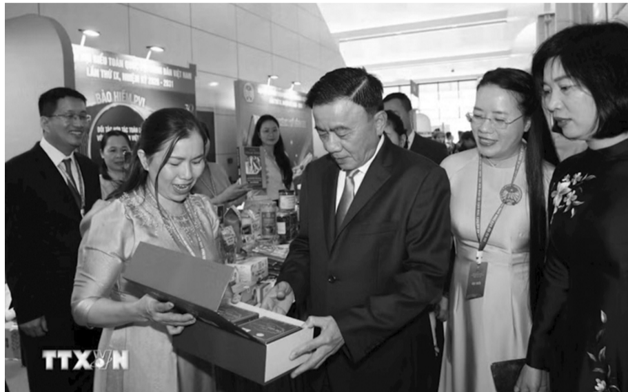
● Thường trực Ban Bí thư Trần Cẩm Tú cùng các đại biểu tham quan gian trưng bày nông sản tại Đại hội.

Trong nhiệm kỳ tới, Thường trực Ban Bí thư đề nghị Hội Nông dân Việt Nam tập trung vào một số nhiệm vụ trọng tâm. Trong đó, Hội Nông dân Việt Nam phải tiếp tục đổi mới mô hình tổ chức, nội dung và phương thức hoạt động của Hội Nông dân các cấp, bảo đảm tinh gọn, thống nhất, phối hợp thực hiện hiệu quả các nhiệm vụ, đáp ứng