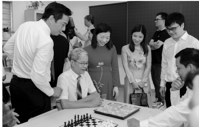
● Cơ sở chăm sóc sức khỏe ban ngày cho người cao tuổi tại phường Long Biên, Hà Nội.

Việt Nam bước vào giai đoạn già hóa dân số cũng là lúc những “khoảng trống” an sinh cho người cao tuổi ngày càng hiện rõ. Trong bối cảnh đó, các mô hình chăm sóc sức khỏe ban ngày cho người cao tuổi được xem là hướng đi phù hợp với thực tiễn, khi vừa giúp người cao tuổi được theo dõi sức khỏe, sinh hoạt cộng đồng, vừa hỗ trợ các gia đình trong việc chăm sóc để yên tâm lao động, làm việc.