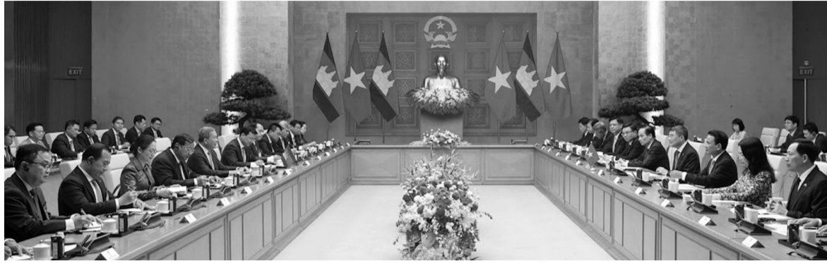
● Thủ tướng Lê Minh Hưng hội đàm với Thủ tướng Campuchia Hun Manet.

Nhận lời mời của Thủ tướng Lê Minh Hưng, Thủ tướng Campuchia Hun Manet thăm chính thức Việt Nam và tham dự Diễn đàn Tương lai ASEAN lần thứ 3 (AFF-3) tại Hà Nội từ 8 - 9/6. Sáng 8/6, sau Lễ đón chính thức, Thủ tướng Lê Minh Hưng và Thủ tướng Campuchia Hun Manet cùng Đoàn đại biểu cấp cao hai nước đã tiến hành hội đàm tại Trụ sở Chính phủ.