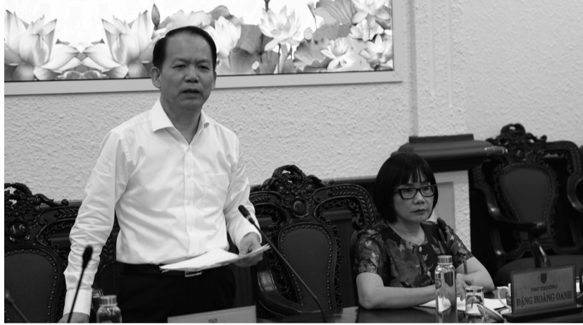
● Bộ trưởng Bộ Tư pháp Hoàng Thanh Tùng đề nghị hoàn thiện dự thảo Đề án.