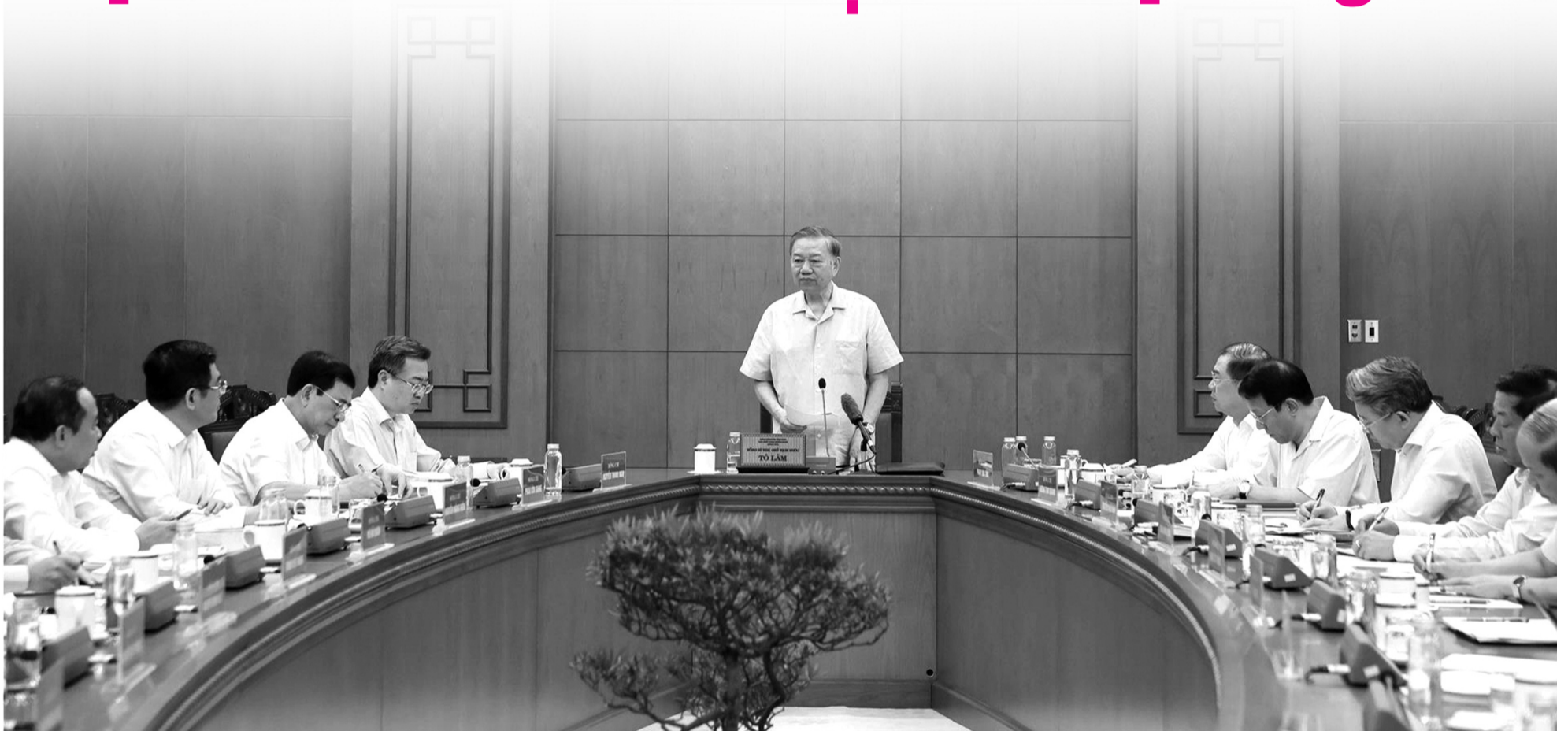
● Tổng Bí thư, Chủ tịch nước Tô Lâm chủ trì làm việc về Đề án tổng kết Nghị quyết 36-NQ/TW.

Sáng 8/6, tại Trụ sở Trung ương Đảng, Tổng Bí thư, Chủ tịch nước Tô Lâm chủ trì buổi làm việc với Ban Chính sách, chiến lược Trung ương và các cơ quan liên quan về Đề án tổng kết Nghị quyết số 36-NQ/TW, ngày 22/10/2018 của Ban Chấp hành Trung ương Đảng khóa XII về Chiến lược phát triển bền vững kinh tế biển Việt Nam đến năm 2030, tầm nhìn đến năm 2045 (Nghị quyết số 36).