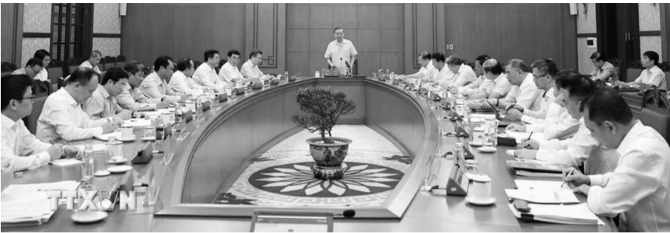
● Tổng Bí thư, Chủ tịch nước Tô Lâm nhấn mạnh phải xây dựng mô hình quản trị biển quốc gia hiện đại.

Sáng 8/6, tại Trụ sở Trung ương Đảng, Tổng Bí thư, Chủ tịch nước Tô Lâm chủ trì buổi làm việc với Ban Chính sách, chiến lược Trung ương và các cơ quan liên quan về Đề án tổng kết Nghị quyết số 36-NQ/TW, ngày 22/10/2018 của Ban Chấp hành Trung ương Đảng khóa XII về Chiến lược phát triển bền vững kinh tế biển Việt Nam đến năm 2030, tầm nhìn đến năm 2045 (Nghị quyết số 36).