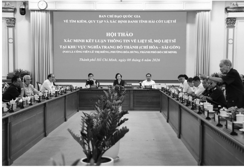
● Hội thảo được tổ chức tại TP HCM.

Hôm qua (8/6), trong khuôn khổ "Chiến dịch 500 ngày đêm đẩy mạnh thực hiện tìm kiếm, quy tập và xác định danh tính hài cốt liệt sĩ (HCLS) còn thiếu thông tin", Phó Thủ tướng Phạm Thị Thanh Trà, Trưởng Ban Chỉ đạo Quốc gia về tìm kiếm, quy tập và xác định danh tính HCLS đã dâng hương, dâng hoa tưởng niệm các anh hùng liệt sĩ tại Công viên Lê Thị Riêng (TP HCM); dự và chỉ đạo Hội thảo xác minh kết luận thông tin về liệt sĩ tại khu vực Nghĩa trang Đô Thành (Chí Hòa - Sài Gòn) nay là Công viên Lê Thị Riêng.