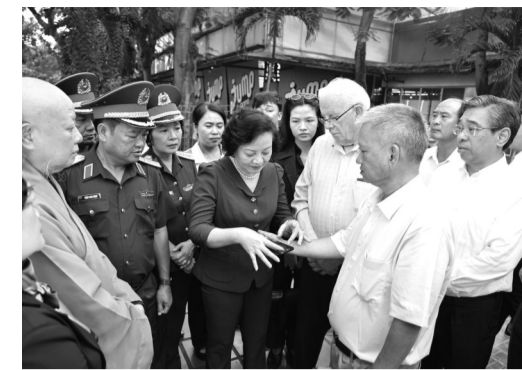
● Phó Thủ tướng Phạm Thị Thanh Trà trao đổi với nhóm nghiên cứu hỗn hợp Việt Nam - Hoa Kỳ về một số nhân chứng.

Thứ hai, làm rõ quy mô, phạm vi, đặc điểm, khả năng tồn tại khu mộ tập thể qua gần 60 năm. Khi đã có đủ cơ sở khẳng định, cần thông nhất phương án thăm dò và khai quật. Đó phải là sự kết hợp giữa phương pháp truyền thống với công nghệ hiện đại. Phải phát huy tối đa hiệu quả của công nghệ radar xuyên đất quét ngầm, kết hợp hệ thống định vị không ảnh, bản đồ lịch sử các nguồn thông tin dữ liệu và nhân chứng; nhằm bảo đảm công tác tìm kiếm đạt độ chính xác cao nhất.